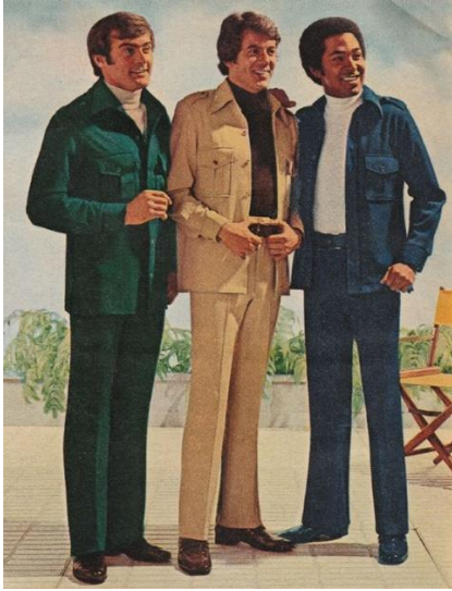
Slika 11. Ležerno odijelo.

opuštenijeg stila. „Alternativa poslovnim odijelima razvijena je za ležerno nošenje.“ (Tortora, Eubank, 2010:569).