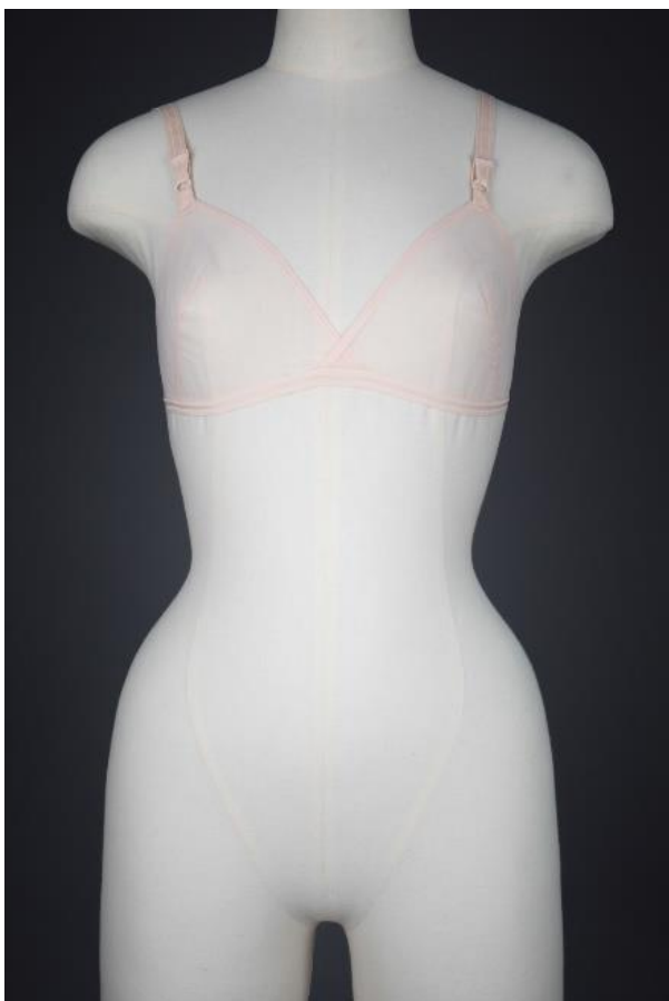
Slika 13. „No Bra“ prozirni najlonski grudnjak dizajnera Rudija Gernreicha za Exquisite Form, 1965., najlon, UM-2017-042.

Novi odjevni predmet pojavio se 1970-ih godina. „Duge dnevne haljine, poznate kao "baka haljine," bile su popularne među mladima 1970-ih. Čini se da su proizašle iz mod i hipi stilova.“ (Tortora, Eubank, 2010:553). „Kombinacije hlača i jakni uvedene su odmah nakon sredine 1960-ih za dnevnu, poslovnu i večernju odjeću.“ (Tortora, Eubank, 2010:553). Žene su također nosile večernje haljine koje su bile i duge i kratke. „Odišla s hlačama od dekorativnih tkanina i punih nogavica također su se nosila za večernje prigode, kao i široke hlače od mekanih tkanina, koje su nosile modni naziv "palazzo hlače.““ (Tortora, Eubank, 2010:554).