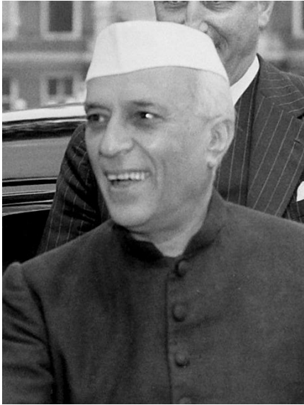
Slika 9. Jawaharlalu Nehru, File:Jawaharlal Nehru 1957 crop.jpg.