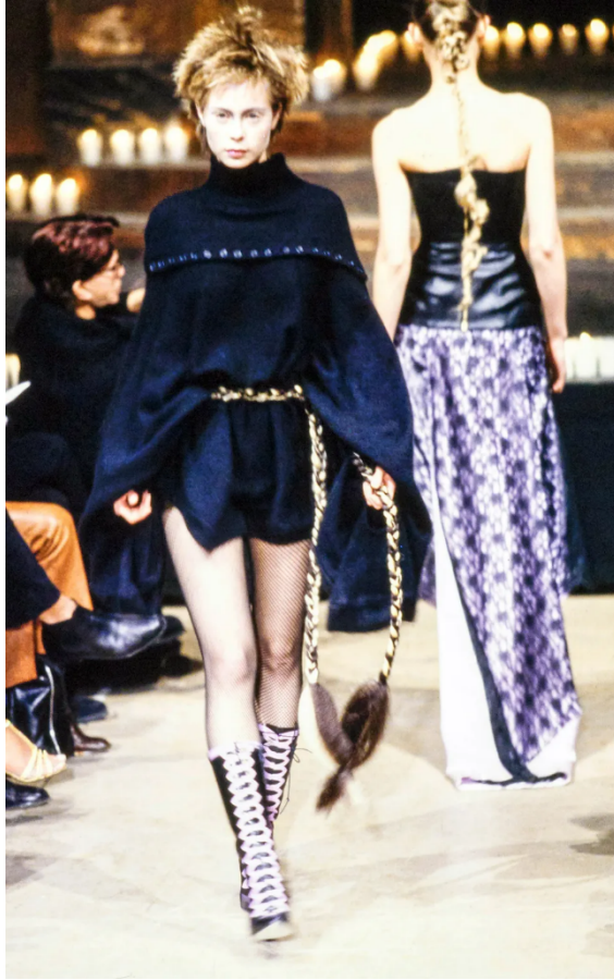
(Slika 16): Kolekcija Dante , (jesen/zima 1996), look 51 , dizajn: Alexander McQueen, autor fotografije, Kent Baker, 1996.

Jean Paul Gaultier francuski je dizajner i jedan je od najpoznatijih u modnom svijetu. Rođen je 1952. godine u Arcueilu, a prepoznatljiv je po kombiniranju elemenata visoke mode i ulične estetike. Kao i McQueen inspiraciju je često pronalazio u raznim supkulturama, a ulični stil punka i skinheada nije stran u njegovim kolekcijama. Londonska urbana scena često je izvor njegove inspiracije, koja je ostala duboko ukorijenjena u modnu scenu. Provokacija i propaganda je osjetna u njegovom radu, a često ruši rodne stereotipe svojim idejama i istražuje pitanje seksualnosti. Jedan od njegovih najpoznatijih odjevnih komada je korzet s grudnjakom šiljatog oblika koji je Madonna proslavila. Gaultier je upamćen kao dizajner koji voli istraživati i kombinirati materijale, od luksuznih cijenjenih materijala u spoju sa svakodnevnim. Dizajner smatra da je moda moć