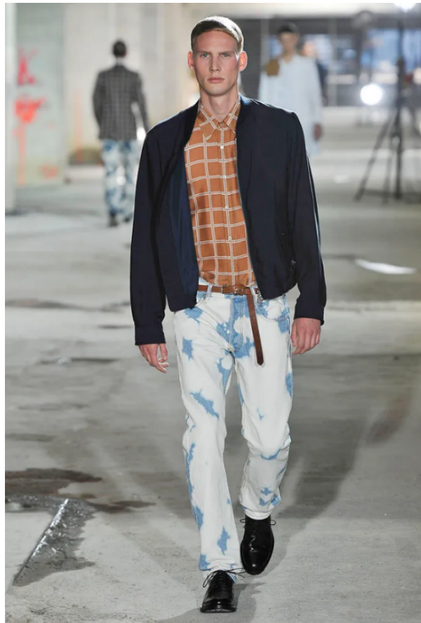
(Slika 29): Kolekcija Dries Van Noten, ( proljeće/ menswear, 2011) look 29 , dizajn: Dries Van Noten, 2011