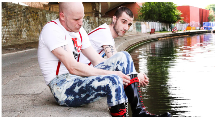
(Slika 4): pripadnici supkulture u ručno izblijeđenim Levi's 501 trapericama, autor fotografije:

Odjevni identitet skinheads a čine Levi's 501 traperice. Popularne su bile ranije među pripadnicima modsa -a jer su zbog svoje kvalitete bile skuplje nego ostale traperice. Iz tog razloga su bile ekskluzivnije i primamljivije. Iz sličnog razloga su bile omiljene i među skinsima . Originalne Levi's 501 traperice bile su izrađene od gušćeg i kvalitetnijeg denima. Džins se prao na jako visokoj temperaturi kako bi se skupio. Hlače se nosi s naramenicama, a originalni modeli su bili šireg kroja. Naramenice su se nosile iz namjere da drže čvrsto hlače, međutim uglavnom su se nosile zbog mode. Uglavnom ih možemo vidjeti na radnim odorama, odakle i dolazi inspiracija. Levi's je bio popularan u Londonu, a izvan Londona popularne marke koje su također proizvodile kvalitetne traperice su Lee i Wrangler . Američka kompanija Wrangler proizvodi svakodnevnu odjeću. Izricale su osjećaj jedinstva i zajedništva među pripadnicima iste klase i zbog toga su postale neizostavni dio skinhead uniforme 22 .