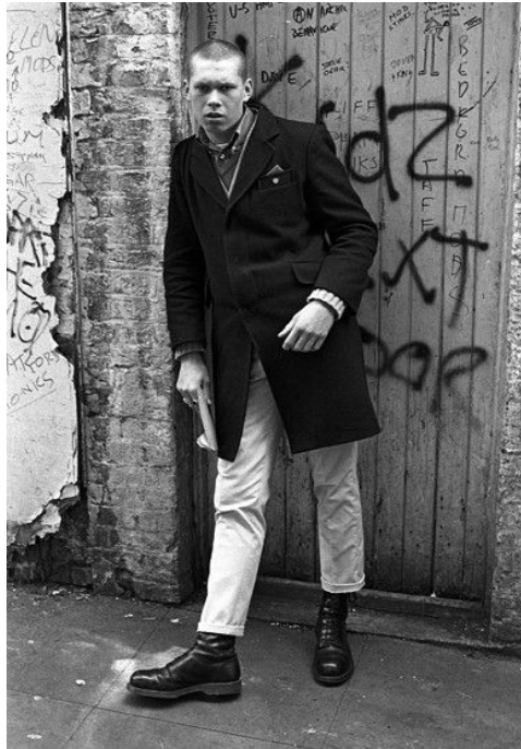
(Slika 11): Prikaz Crombie kaputa, autor fotografije, Derek Ridgers, 1981

Kao i većini jakni, podstava ovog kaputa ispunjena je obojenom podstavom, uglavnom crvenom, uglavnom napravljena satena 36 . Ovakav kaput prikazuje kako je moguće spojiti elemente elegancije i uličnog stila. Nošen na tipičnu uniformu skinheada s izbijeljenim, podvrnutim trapericama i visokim Doc Martens čizmama. Baršunasti ovratnici također su u nekim izdanjima krasili ovaj kaput 37 .