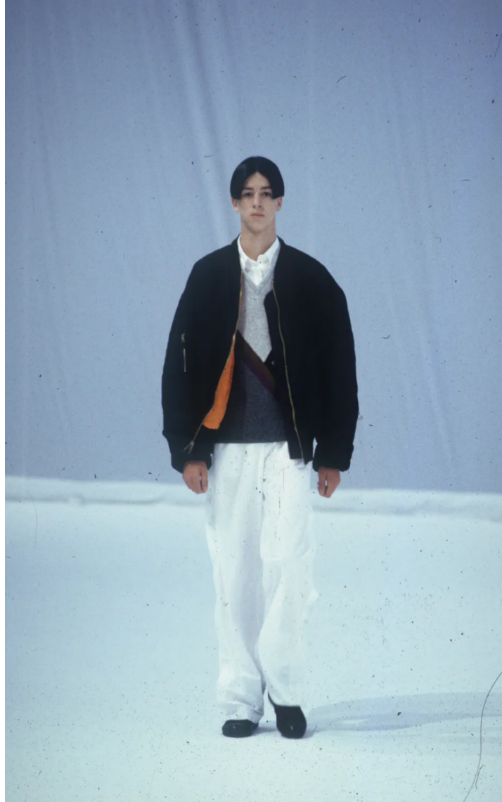
(Slika 21): Kolekcija: Summa Cum Laude , (proljeće/ljeto 2000), look 13 , dizajn: Raf Simons, autor fotografije, David Sims, 2000.