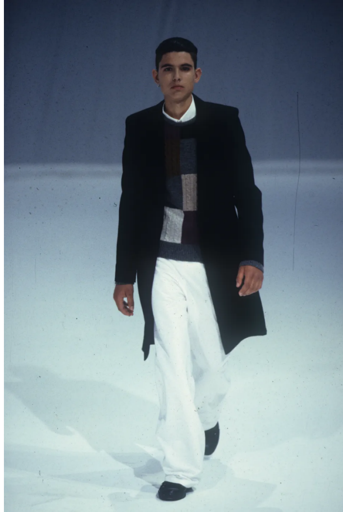
(Slika 23): Kolekcija Summa Cum Laude , (proljeće/ljeto 2000), look 18 , dizajn: Raf Simons, 2000.