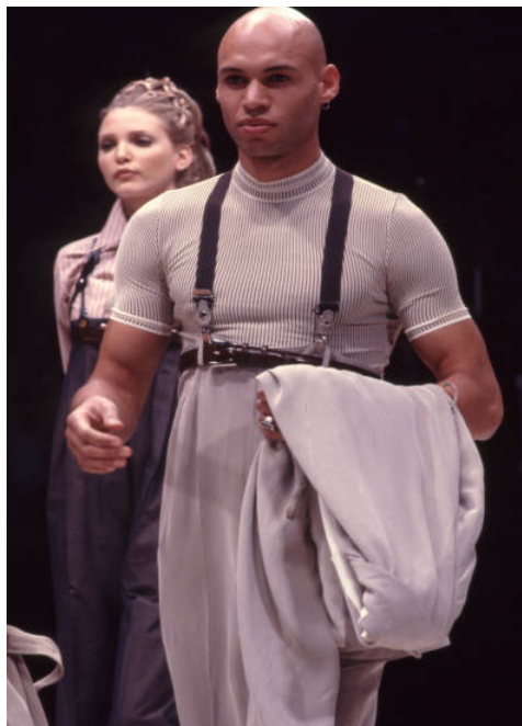
(Slika 18): Kolekcija (proljeće/ljeto 1993), dizajn: Alexander McQueen, autor fotografije, Nick Knight, 1993.