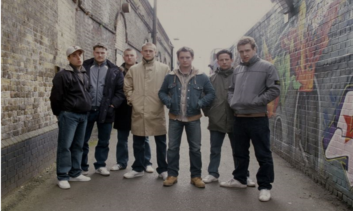
(Slika 5):Prikaz casual stila iz devedestih godina, fotografija iz filma Green street hooligans , 2005

Kao i pripadnicima skinhead supkulture, pripadnicima casual supkulture svijet se vrtio oko nogometa. Ove dvije supkulture jako su povezane i prijateljski nastrojene, te između njih nije dolazilo do netrpeljivosti i sukoba, moda i odijevanje njihov su simbol identiteta i ponosno ga nose.