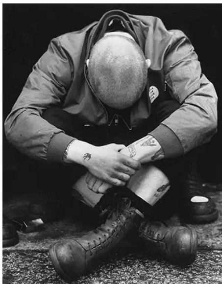
(Slika 1): Dr. Martens model 1460, 1980.

S obzirom na to da su se skinheadsi suprotstavljali elegantnijem stilu nekadašnjih modsa , Doc Martens čizme svojim ugledom i namjenom zapečatile su njihov ulični izgled 12 .