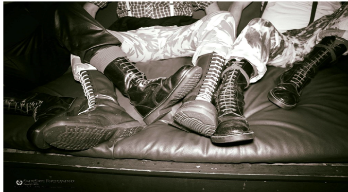
(Slika 2): Dr. Martens model 1406 sa 16 rupica, vezane horizontalno, autor fotografije:

U nekim slučajevima zbog asocijacije pripadnika i nasilja na stadionima prije početka nogometnih utakmica, policajci su pregledavali ljude i tko nosi Doc Martens čizme. Pripadnici su svoje čizme smatrali oružjem, što uistinu su i bile jer su na vrhovima prstiju sadržavale željezne kape koje su se koristile za nanošenje ozljeda u sukobima. Originalne čizme su napravljene s osam rupica a kasnije su dolazile u modelima od šesnaest pa čak do dvadeset i dvije rupe. Što su čizme bile više su se smatrale uglednijima, kao i u kakvom stanju su bile, ako su izgledale novo i nenošeno, često ih se znalo namjerno uništiti kako bi izgledale iznošeno i dobile više na važnosti, a najpopularnije boje su crvena i crna. Moda je uglavnom ostala ključni faktor koji i danas održava skinheade popularnima. Od 1969. godine kada se pojavila na ulicama Londona, nastavila se širiti po Britaniji i ubrzo je postala prepoznatljiva diljem svijeta 14 .