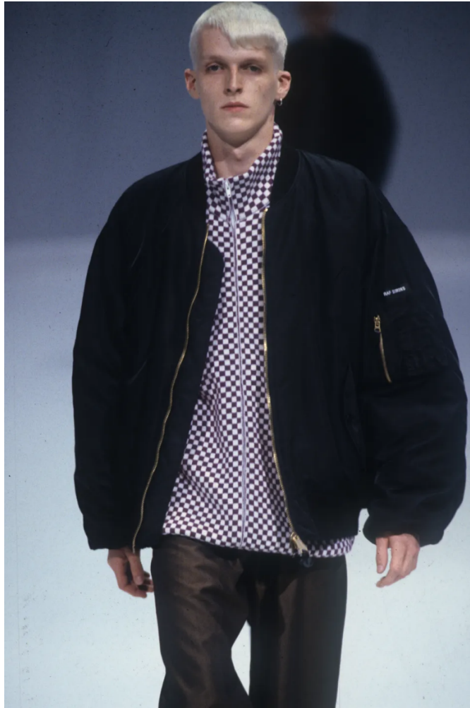
(Slika 20): Kolekcija Summa Cum Laude (proljeće/ljeto 2000), look 47, dizajn: Raf Simons, 2000.