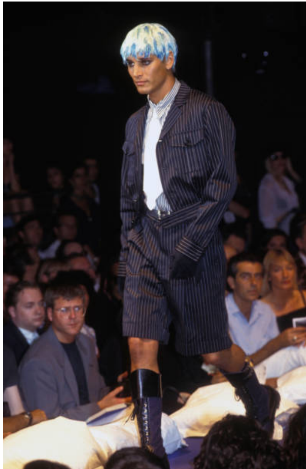
(Slika 19): Kolekcija (proljeće/ljeto 1993), dizajn: Jean Paul Gaultier

Raf Simons belgijski je modni dizajner rođen 1968. godine u Neerpeltu. Postao je prepoznatljiv po avangardnom poimanju ženske i muške mode, te primjenom supkulturnih stilova u svome radu. Karijeru je započeo u industrijskom dizajnu, što je vidljivo u njegovim idejama koje se doimaju čisto, precizno i minimalno. U svoje radove često uključuje stilove raznih supkultura, a najčešće su to punk , skinhead , goth i rave elementi. Njegove kolekcije odišu buntovništvom, prikazom identiteta, željom za promjenom i duhom zajedništva. Poznat je po minimalističkom stilu i krojevima, a njegove palete boja često su monokromatske. Simons se bavio i ženskom modom, ali je ostavio je ostavio snažni pečat na mušku modu. Kombinacija različitih supkulturnih stilova povezanih s uličnom estetikom i klasičnim modnim komadima, proizveli su moderni, sofisticirani