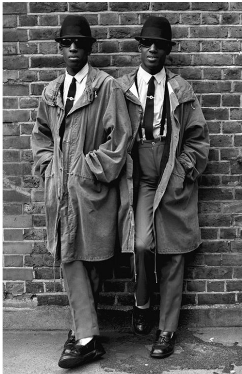
(Slika 3): Prikaz klasičnog rude boy stila šezdesetih godina prošlog stoljeća, 1979.

Stil odijevanja skinheada vrlo je karakterističan. Zbog svoje odjevne prepoznatljivosti često su nailazili na kritiku jer se takav ulični stil smatrao neprihvatljivim i prostim. Britanija u šezdesetim godinama prošlog stoljeća, točnije u vremenu pojavljivanja pokreta, nailazila na velike klasne i rasne podjele što je uzrokovalo nezadovoljstvo i potrebu za promjenom. Zbog konzervativne okoline došlo je do pojave brojnih supkultura koje su za cilj imale promjenu i stvaranje vlastitog identiteta. Zbog velikih klasnih podjela, ponos je rastao a netrpeljivost je bila sve veća. Veliki utjecaj na odjevni izraz skinheada imaju radnička odjeća, nogomet i vojne odore. Za odlazak na utakmicu obavezno se nosio šal oko vrata s grbom omiljenog kluba. Nogomet je uvelike određivao identitet pripadnika, stoga su uglavnom nosili odjevne predmete u bojama svog omiljenog kluba, kao i njihova obilježja. Uz nogomet, da se zaključiti da je estetika supkulture nadahnut prikazom radničke klase. Ono što se da primijetiti je to da odjeća koju su nosili pripadnici ne odgovara idealima radničke klase. Radi se o markiranoj odjeći koja cjenovno nije dostupna svima .