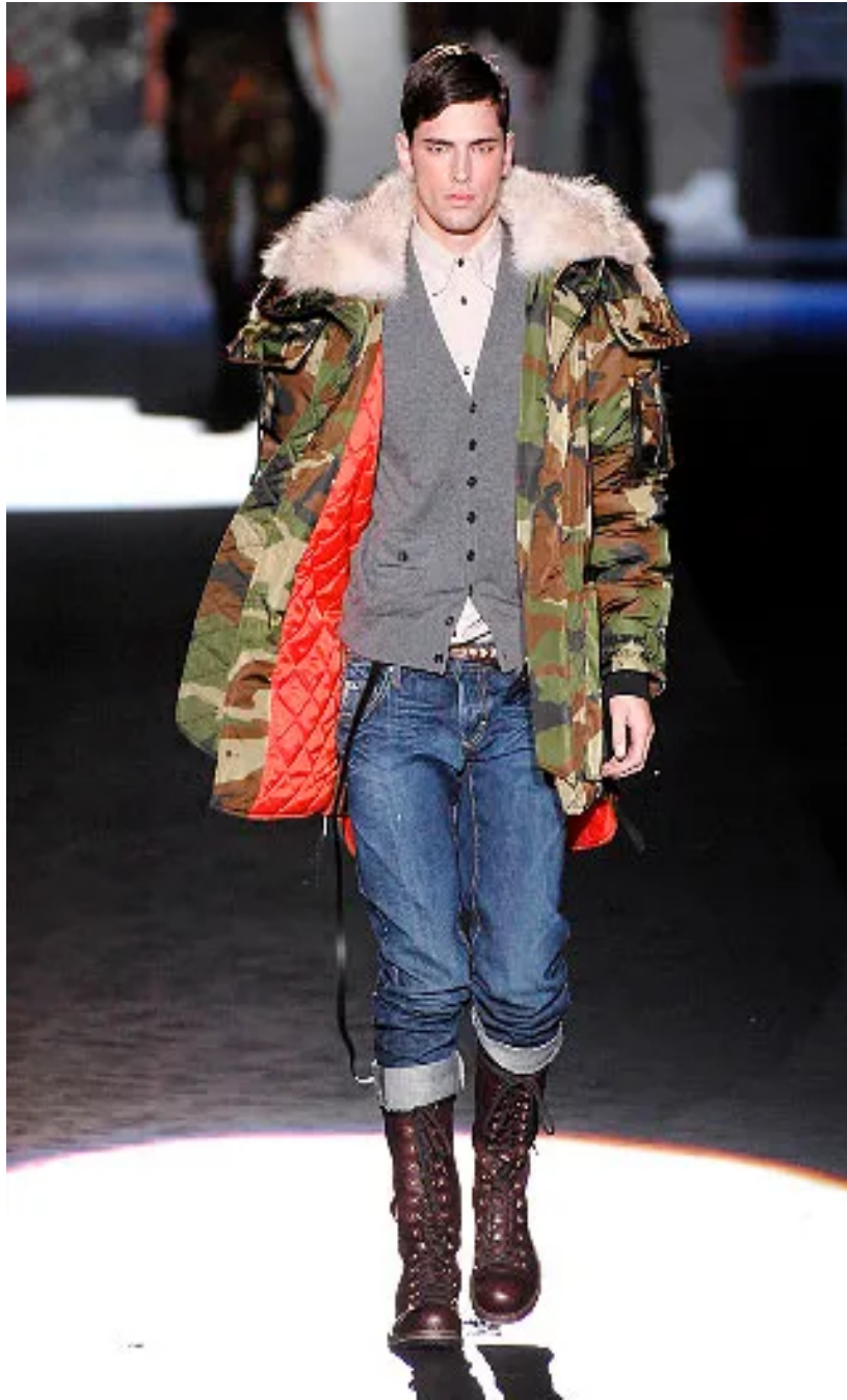
(Slika 26): Kolekcija Dsquared 2 , jesen 2008 look 1 , dizajn: Dean Caten, Dan Caten, autor fotografije, Mauricio Madeira, 2008.