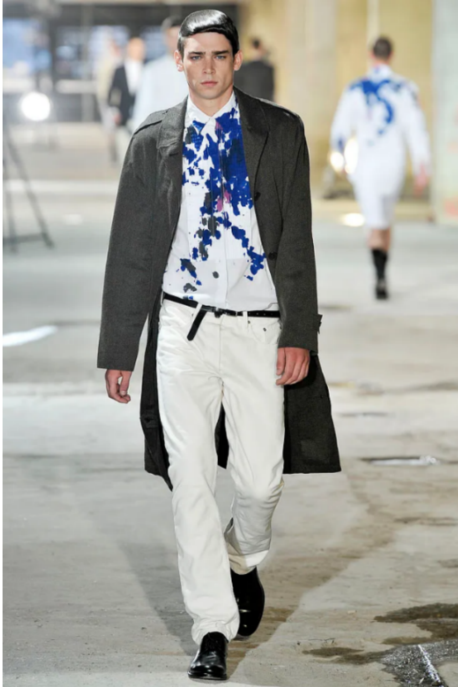
(Slika 30): Kolekcija Dries Van Noten, (proljeće/menswaer 2011), look 6 , dizajn: Dries Van Noten, autor fotografije, Tommy Ton, 2011