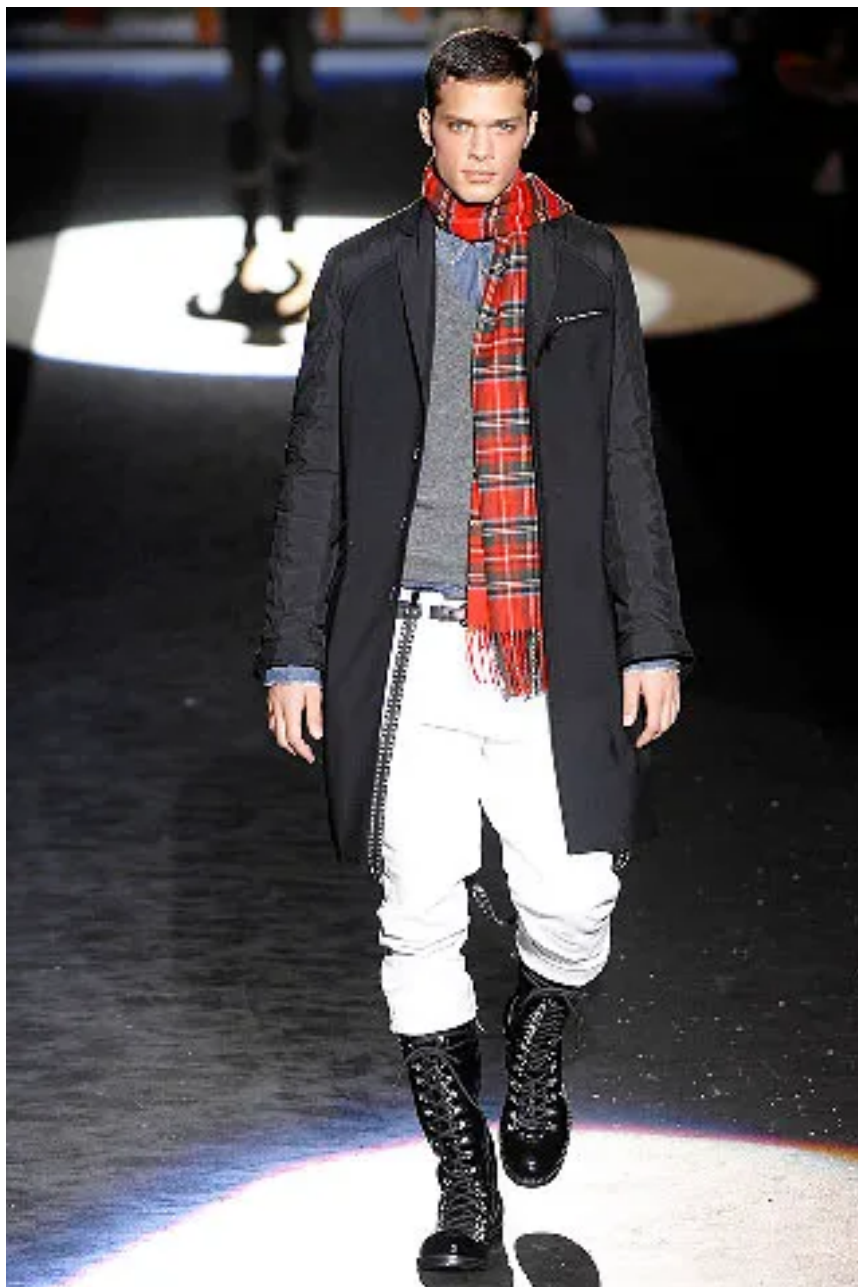
(Slika 24): Kolekcija Dsquared 2 , jesen 2008, look 10 , dizajn: Dean Caten, Dan Caten, autor fotografije, Marcio Madeira, 2008.