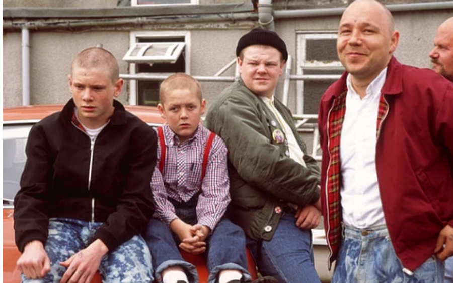
(Slika 8): Klasična Harrington jakna s kariranom podstavom, fotografija iz filma This is England , 2006.

Na odjeći skinheada mogu se vidjeti razni uzorci, s prevladavajućim kariranim motivima u raznim varijantama boja i veličina. Najčešće kombinacije su crvene kockice sa plavim ili zelenim prugama, kao i kombinacija zelenih kockica s žutim ili bijelim prugama. Prince of Wales ili Glen plaid uzorak kao jedan od popularnijih, a krasi ga kombinacija tzv. Puppytooth 32 uzoraka što daje dojam iluzije pruga i kvadratića kada se gledaju izdaleka. Originalno je napravljen u crno – bijeloj varijanti, a među pripadnicima je često bila popularna zelena i plava nijansa 33 .