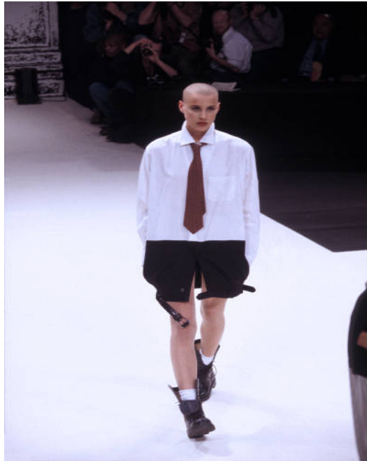
(Slika 17): Kolekcija (proljeće/ljeto 1993), dizajn: Jean Paul Gaultier, 1993.