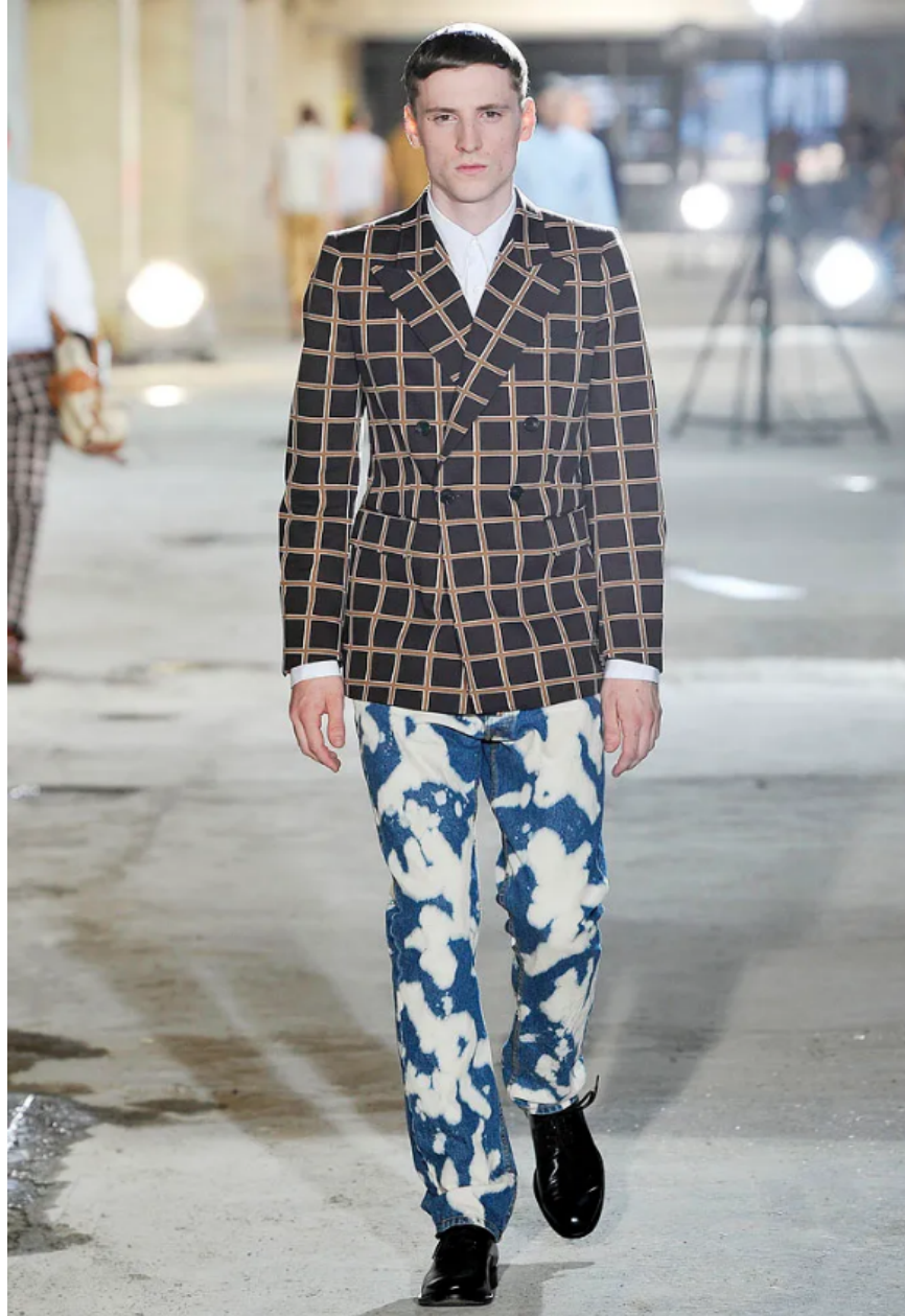
(Slika 32): Kolekcija Dries Van Noten, ( proljeće/ menswear 2011), look 27 , dizajn: Dries Van Noten, autor fotografije, Tommy Ton, 2011