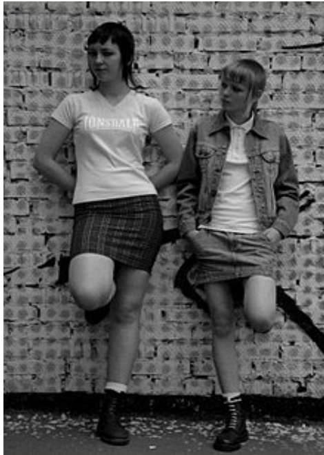
(Slika 12) : Ženske pripadnice u mini-suknjama i Doc Martens čizmama, autor fotografije:

Ženske pripadnice supkulture dijele sličan odjevni stil kao muški pripadnici, a poznate su pod popularnim nazivom skinbird ili female skinheads . Ženske pripadnice nisu se uvelike razlikovale od muških pripadnika. U ovoj supkulturi žene su zauzimale jednako mjesto kao i muškarci. Popularne Ben Sherman košulje su najčešće kariranog uzorka u raznim bojama, a Fred Perry polo majice također u raznovrsnim bojama, ali najčešće u crvenoj, sivoj, bijeloj i bordo nijansi. Harrington jakne su također omiljene, a Levi's 501 traperice su uskog kroja nošene s prepoznatljivim tregerima, uglavnom bijele, crne ili crvene boje.