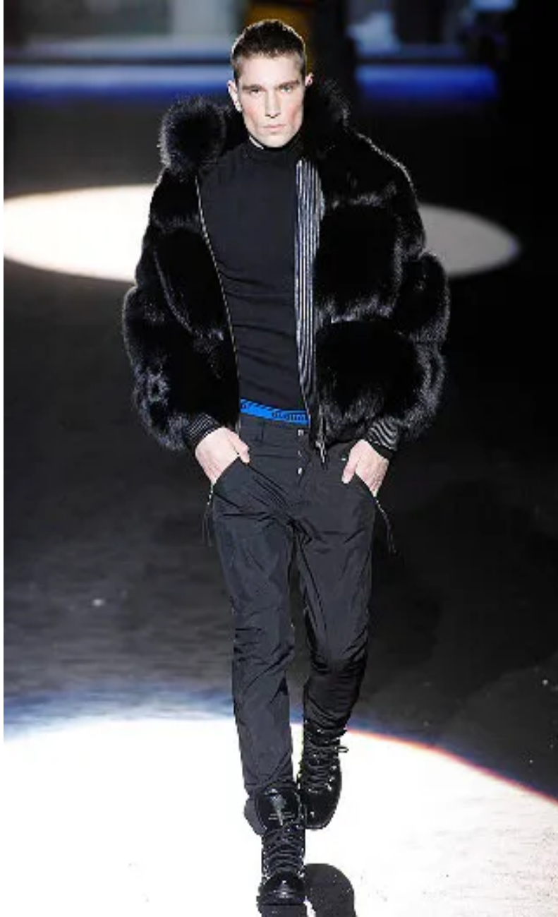
(Slika 25): Kolekcija Dsquared 2 , jesen 2008, look 23 , dizajn: Dean Caten, Dan Caten, 2008.