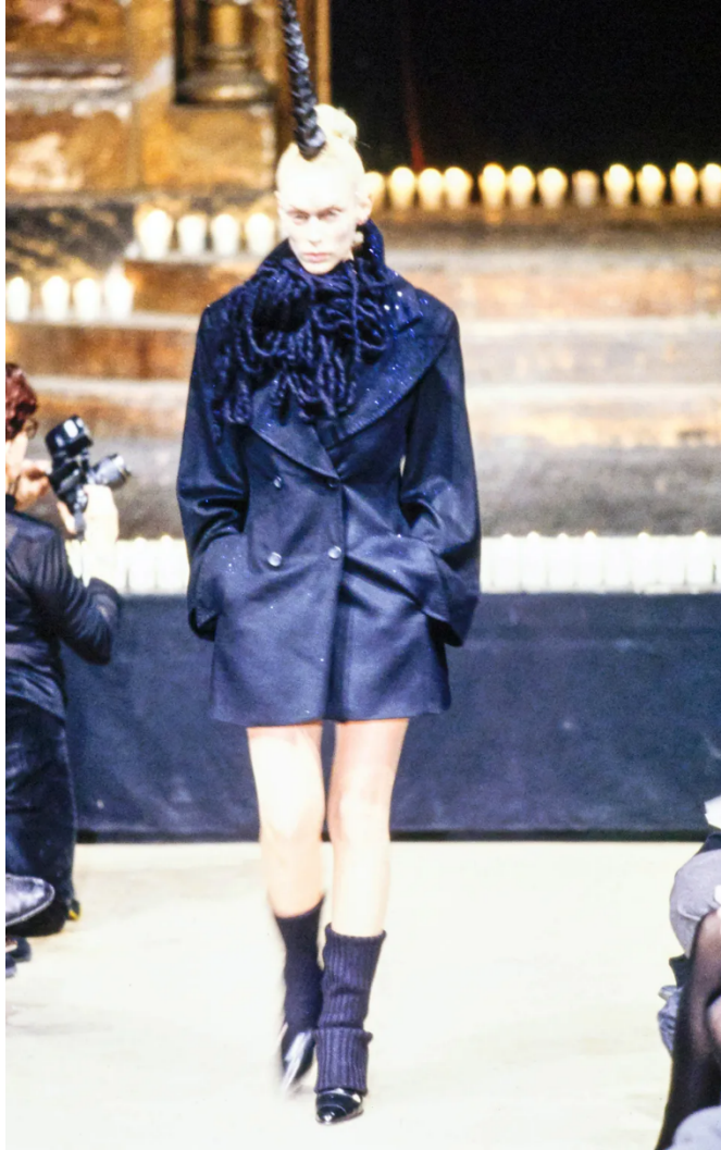
(Slika 14): Kolekcija Dante (jesen/zima 1996), look 13, dizajn: Alexander McQueen, autor fotografije, Kent Baker, 1996.