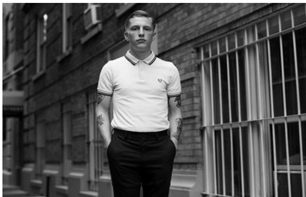
(Slika 7) : Klasična Fred Perry M3600 polo majica sa dva gumba

Polo majica je s novom generacijom skinheads a stekla novo kulturološko značenje. Često viđena na nogometnim utakmicama, postala je standardna uniforma na stadionima. Popularnost ovog odjevnog predmeta prenosila se generacijama i jedan je od razloga za nastanak casual supkulture koja se kasnije razvila.