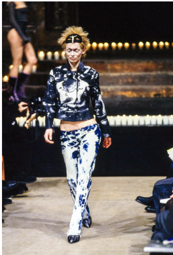
(Slika 13): Kolekcija Dante (jesen/zima 1996) look 45, dizajn: Alexander McQueen, 1996.