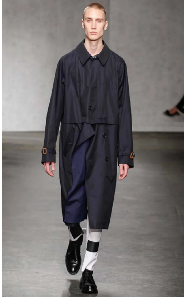
(Slika 35): Kolekcija Casely-Hayford, (proljeće/ljeto 2015), look 12 , dizajn: Joe Casely – Hayford, Charlie Casely – Hayford, 2015