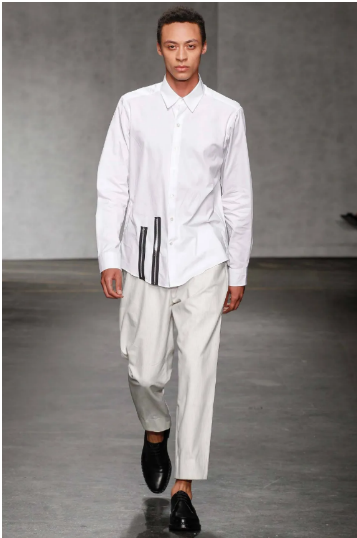
(Slika 36): Casely – Hayford kolekcija (proljeće/ljeto 2015), look 22 , dizajn : Joe Casely – Hayford, Charlie Casely – Hayford, 2015