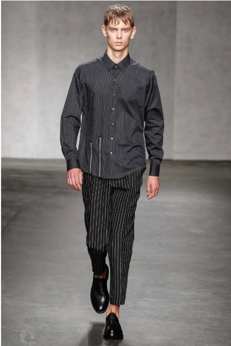
(Slika 33): Kolekcija Casely – Hayford, 2015, (proljeće/ljeto 2015) , look 5 , dizajn: Joe Casely – Hayford, Charlie Casely – Hayford, autor fotografije, Katinka Herbert, 2015