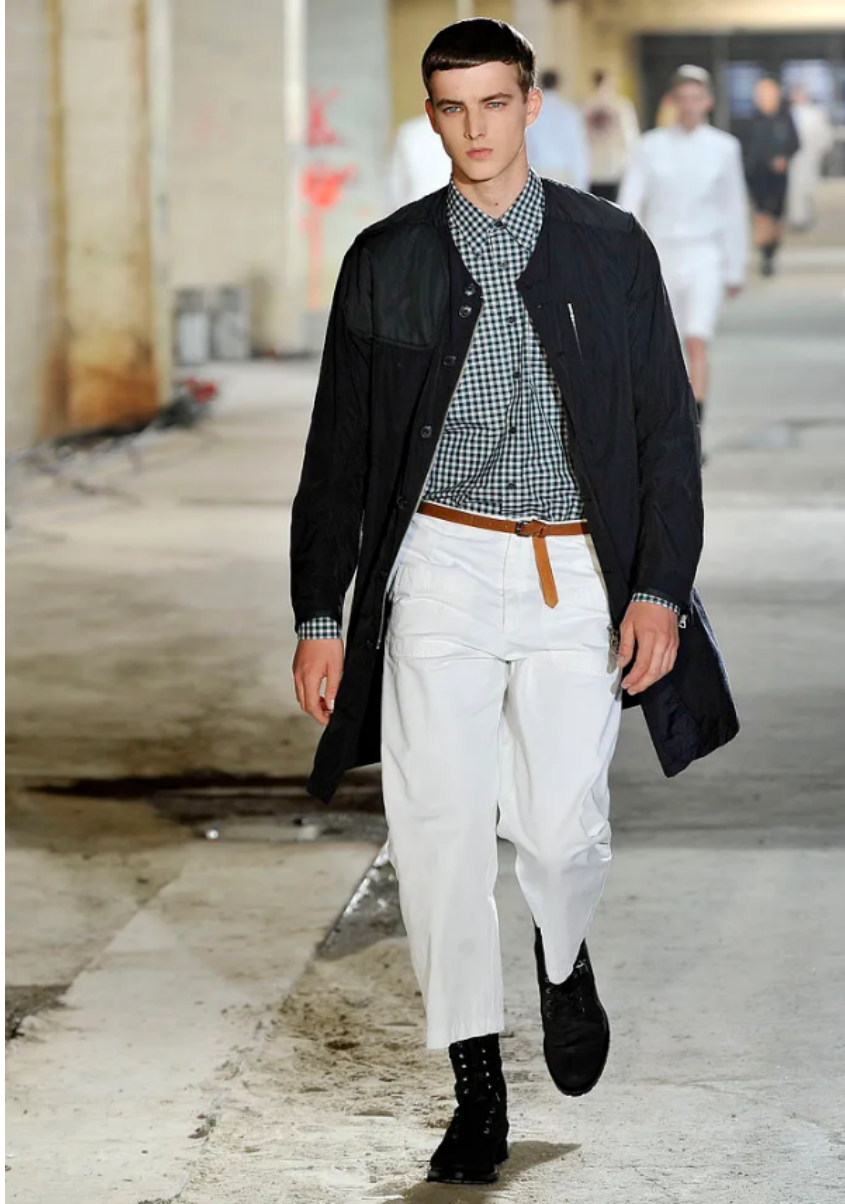
(Slika 31): Kolekcija Dries Van Noten, (proljeće/menswear 2011) , look 13, dizajn: Dries Van Noten, autor fotografije, Tommy Ton, 2011.