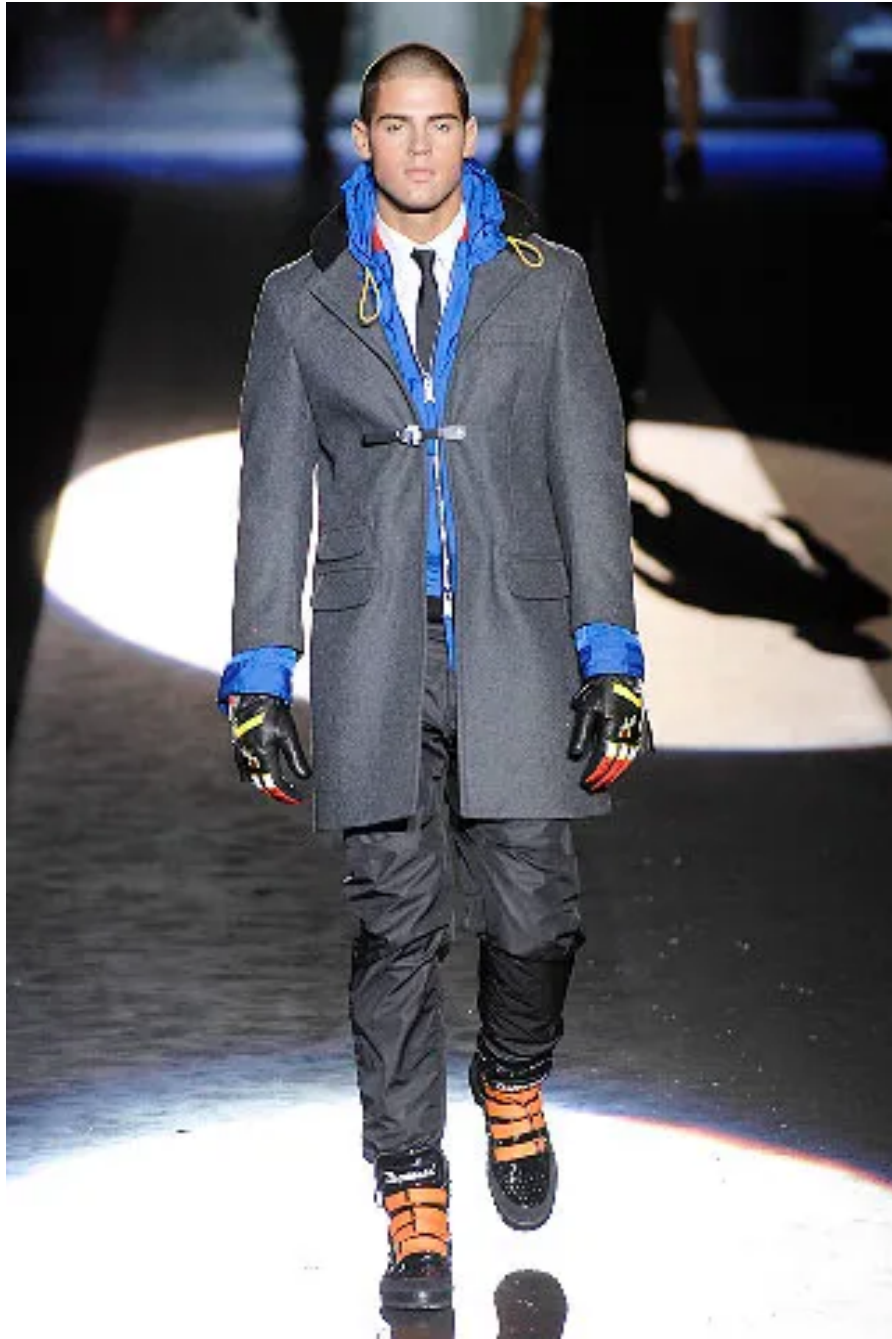
(Slika 27): Kolekcija Dsquared 2 , jesen 2008 look 9, dizajn: Dean Caten, Dan Caten, autor fotografije, Mauricio Madeira, 2008