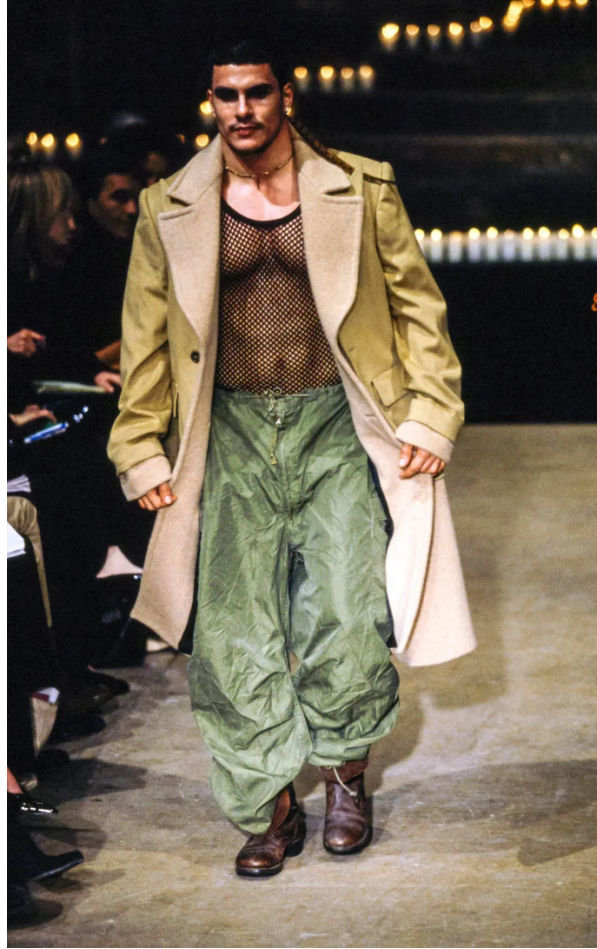
(Slika 15): kolekcija Dante , (jesen/zima 1996), look 73, dizajn: Alexander McQueen, autor fotografije, Kent Baker, 1996.