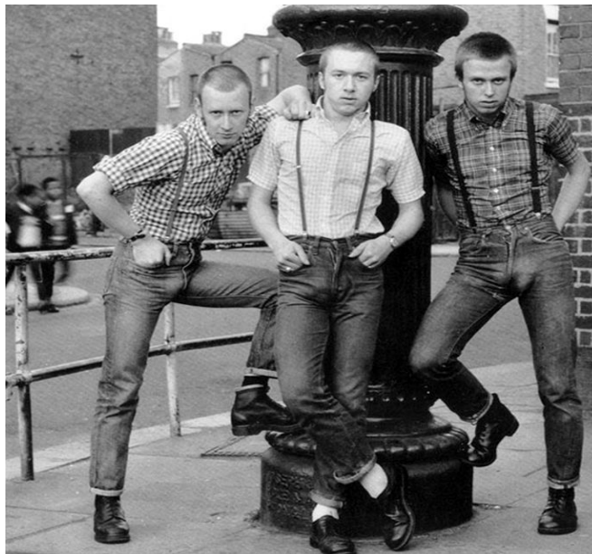
(Slika 6): Originalne Ben Sherman košulje različitih boja i uzoraka, autor fotografije: Smith Archive, 1970

Kada je riječ o košuljama, dvije vrste su bile svakodnevni odabir. Košulja bez ovratnika, uglavnom jednobojna ili na pruge. Druga vrsta je klasična košulja, s kopčanjem na lijevoj strani, a najpoznatija marka košulje je bila Ben Sherman . Ovakva vrsta košulje je bila popularna među pripadnicima modsa , prošlih desetljeća 25 . Košulje su upotpunjavale uniformu skinhead-a od pojave supkulture. Brend koji se najviše ističe među ostalima, je Ben Sherman . Brend se pojavio 1962. godine, osnovao ga je Kanađanin, a prvenstveno se proširio među pripadnicima mods supkulture. Klasične Ben Sherman košulje su izrađene od prozračne, ugodne tkanine Oxford tkanja. Radi se o čvrstoj tkanini mješavine pamuka i sintetičkih vlakana, glatke i sjajne površine. Među pripadnicima osim košulja sa uzorcima, popularne su bile bijele Ben Sherman košulje sa dubokim ovratnicima. Originalna Ben Sherman košulja sadrži ovratnik koji je širine tri prsta, gumb i nabor na stražnjoj strani kako bi se ovratnik čvrsto smjestio. Košulja sadrži džep na lijevoj strani prsa i jedno dugme na rubu svakog rukava. Košulja se uglavnom nosi sa svim gumbovima zakopčanim, a rukavi su jednom ili dvaput zavrnuti, uglavnom do tri četvrtine dužine rukava. Karirane košulje sa malenim kvadratićima i prugama su raznim bojama su prolazile kao omiljene. Popularni naziv Bennies se često koristi kada se govori o ovom kulturnom odijevnom predmetu .