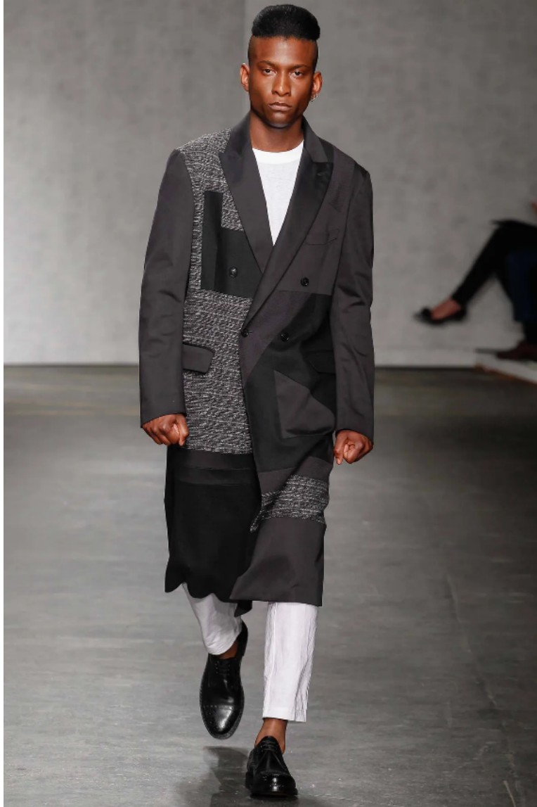
(Slika 34): Kolekcija Casely – Hayford, 2015, (proljeće/ljeto 2015), look 10 , dizajn: Joe Casely – Hayford, Charlie Casely – Hayford