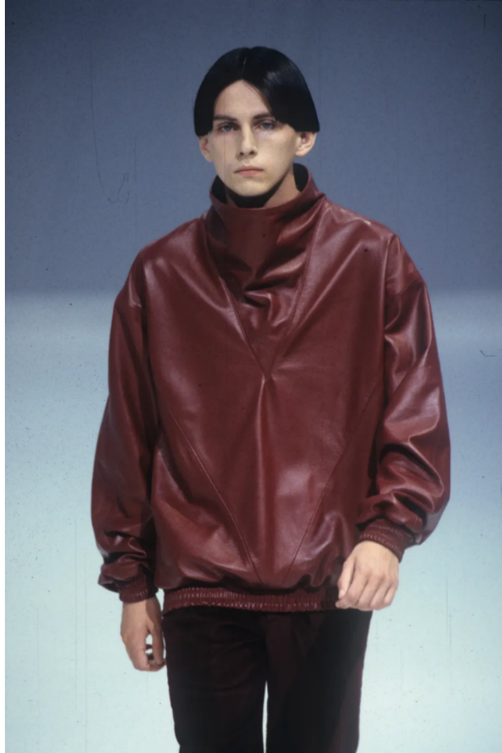
(Slika 22): Kolekcija Summa Cum Laude , (proljeće/ljeto 2000), look 29, dizajn: Raf Simons, 2000.