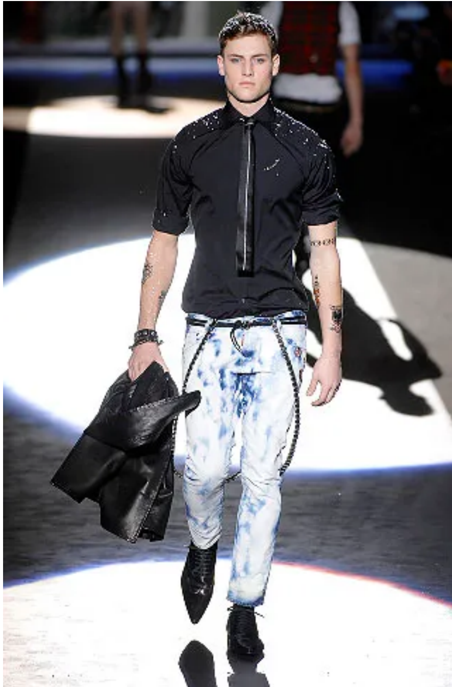
(Slika 28): Kolekcija Dsquared 2 , jesen 2008 look 20 , dizajn: Dean Caten, Dan Caten, 2008