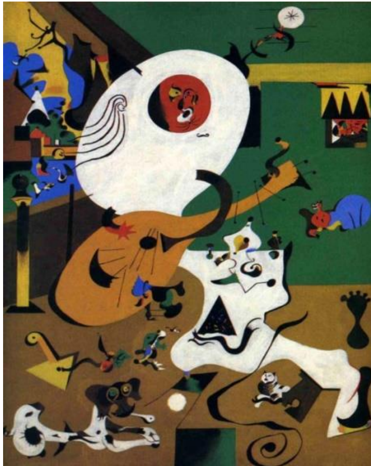
Slika 2. Joan Miro Dutch Interior

lika naslikana su slično čime je Miro namjerno pokazivao da su to živi likovi u njegovom slikarstvu. Interijer je obogaćen slikama. Na jednoj od slika je i prikaz vraga. Muškarac je postavljen leđima prema prozoru usredotočen na sadašnjost, na sviranje gitare, izdvajajući se od svijeta oko sebe. 27