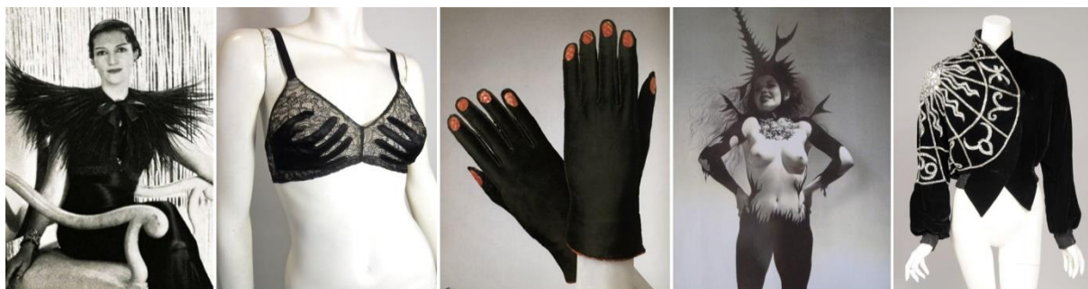
Slika 11. Kolaž Elsinih kreacija

Petersburgu, Floridi. 85 Sadržavala je poznate haljine visoke mode, nakit, slike, crteže predmeta, fotografije te nove dizajnovne Bertrada Guyona za Maison Schiaparelli. To je bila prva izložba posvećena kreativnom stvaralaštvu Else i Dalija koji su utjecali na Pariz i cijeli svijet svojim revolucionarnim vizijama.