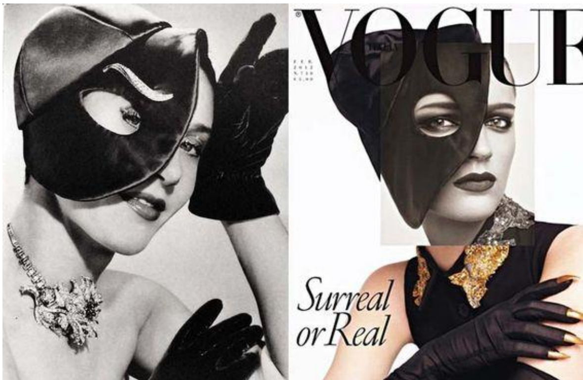
Slika 12. Naslovnica časopis Vogue iz 1949. i 2012. godine

Elsine utjecaje možemo vidjeti posvuda, od grafika, slika, do dizajna. Najčešća inspiracija današnjim dizajnerima je zasigurno Skeleton Dress nastala 1938. te Lobster dress iz 1937. godine. Veliki dizajner Alexander McQueen, inspiriran nadrealizmom, 2009. izrađuje haljine koje su na sebi imale print ljudskog kostura, cipele u skladu te haljinu inspiriranu Schiaparellinom Lobster dress . Osim njega, motiv jastoga pojavljuje se u dizajnu Betsey Johnson i Heal Fashion Lab-a. U Hrvatskoj to radi dizajner Zigman koji izravno prenosi motiv jastoga na tkaninu u svojoj kolekciji poljeće/ljeto 2013. godine. Časopis Vogue je 2012. izdao replicirano izdanje časopisa iz 1949. s Elsinom slikom na naslovnici. (Slika 12.)