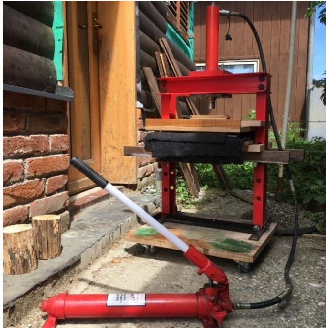
Slika 18 preša korištena tijekom izrade papira

Osušeni papiri pažljivo se odvajaju od podloge kako ne bi došlo do njihovog traganja, kako što svaki papir mogu potrgati nagli pokreti ruke. Određene podloge za izradu tijekom izrade pokazale su se bolje od drugih, ovisno o glatkoći njihove površine. Oni nešto čupaviji netkani tekstili vlakna ostaju na jednoj strani proizvedenog papira. Takva vlakna pomalo i otežavaju odvajanje papira s podloge jer nastali papir za njih zapinje ili ih čupa ostajući zalijepljen na njih.