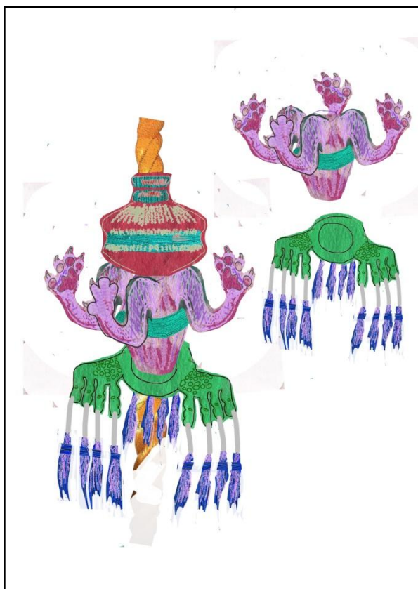
Slika 6 prve skice 1, autorski digitalni crtež