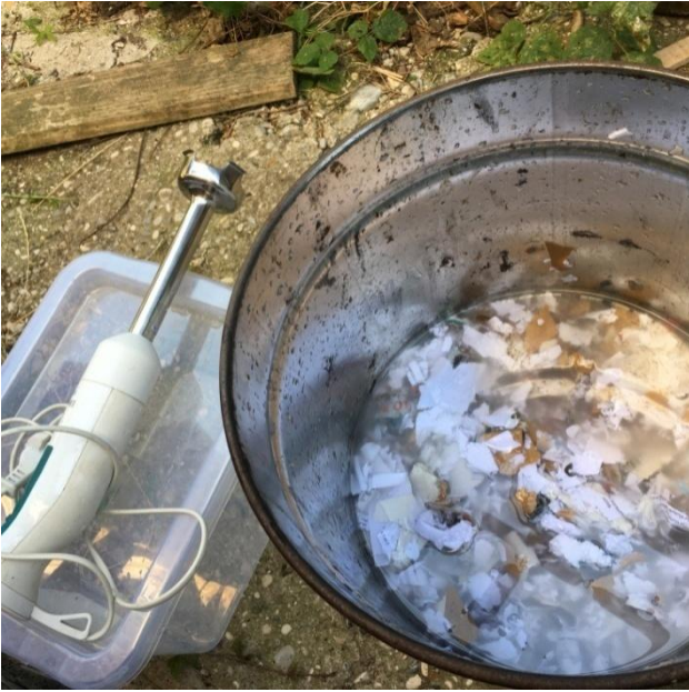
Slika 15 natrgani reciklirani papir u vodi, štapni mikser