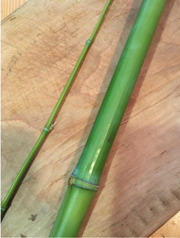
Slika 13 deblji bambus nakon odvajanja radi mogućnosti rada s njime

Prvobitni dizajni kićanki nastali su referirajući se uglavnom na prstenaste forme kićanki te osmišljanje kako bi te željene forme izgledale i funkcionirale međusobno.