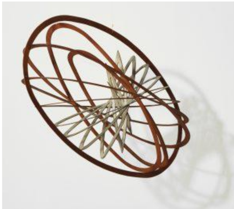
Slika 2 spiralna konstrukcija 12, AleksandrRodchenko, 1920, MOMA, https://www.moma.org/collection/works/81043 , pristupljeno:

Na izložbi su bile izložene njegove trodimenzionalne strukture koje su na svojoj sredini bili obješene na žicu. Prema sačuvanim fotografijama i izvorima izgleda da je sveukupno bilo pet izloženih konstrukcija. Strukture su se sastojale od šesterokuta, elipsa, trokuta, kvadrata i kruga. Sve su bili izrađene od šperploče i obojene srebrom, vjerojatno da imitiraju izgled metala. Sve su skulpturne instalacije imaju zajedničku metodu izrade. Koncentrični geometrijski oblici izrezani su iz jednog ravnog komada šperploče. Počevši od elementa najvećih dimenzija pa prema manjem. Ti su koncentrični elementi zatim raspoređeni jedan unutar jedan drugog i rotirani iz dvodimenzionalne ravnine u trodimenzionalni prostor kako bi se formirala prostorna kompozicija koja se drži na mjestu upotrebom žice.