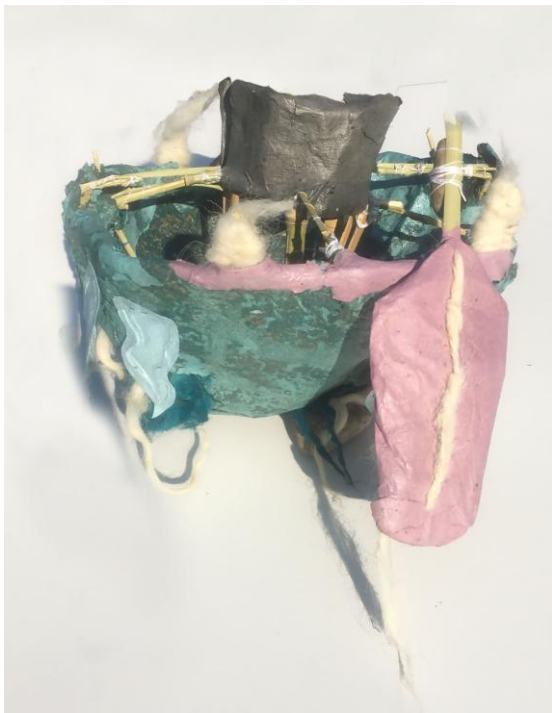
Slika 25 segment nalik donjoj čeljusti, vlastita fotografija

Segment koji je nalik donjoj čeljusti dimenzija 22 centimetara visina i 34 centimetra promjer. U gornjem dijelu sačinjavaju zubi izrađeni od vune prirodnog kolorita. Trokutasti oblik zubiju završava u vertikali vunene pređe koja se slobodno savija pri vrhu. Između dva takva zuba nalazi se plošno istanjen segment nalik jeziku. Po njegovoj sredini vidljiv je šav vunene pređe.