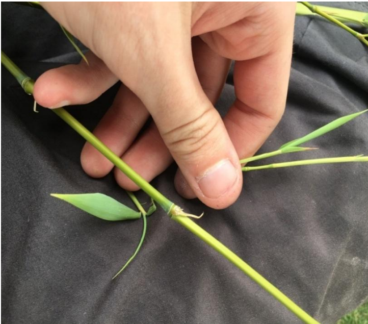
Slika 9 ručno odvajanje najtanjih grana

Na sakupljenim biljkama potrebno je odvojiti s bazne stabljike njene sporedne grane. One su nešto mekše no i dalje prigodne za rad i daju podjednaku čvrstoću kada se osuše. Takvo odvajanje vršilo se ručnim čupanjem kod tanjih grana, te rezanjem vrtlarskim škarama kod debljih grana. S tih sporednih grana trebalo je maknuti lišće koje je premekano za rad, te kada se osuši puca i mrvlji se. Tako da je lišće postao jedini otpadni materijal. Stabljike su same po sebi djelomično tvrde te ih je bio potrebno pažljivo saviti cijelom njihovom duljinom pazeći pritom da ne puknu.