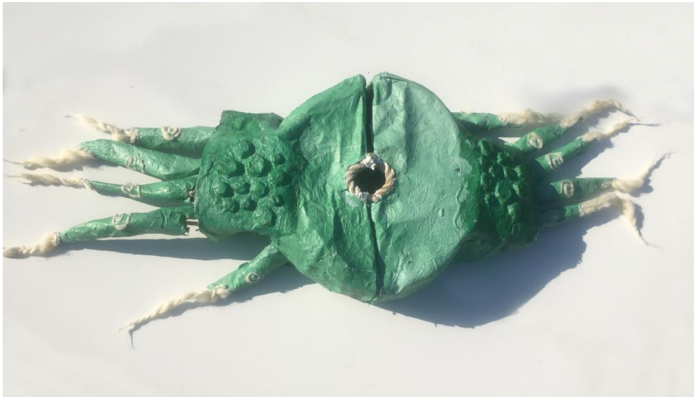
Slika 27 Dio kićanke "Zelena ruka" pogled odozgo

Te dvije teksture i boje međusobno se miješaju na radu. Iz svijetloplave izvire tamni krugovi. Na njima se uočavaju i smeđe teksture koje stvara piljevina u papiru. Mrlje su za razliku od prethodnog dijela, pravilno raspoređene po površini. Kružne forme koje se granaju poredane u nizu. Prevladava tamnija zelena boja koja je čak prodire i ispod svijetlo plave akcenti na radu su rozi tonovi koji ističu dijelove poput nosa, unutrašnjosti uha ili istaknutih zubiju.