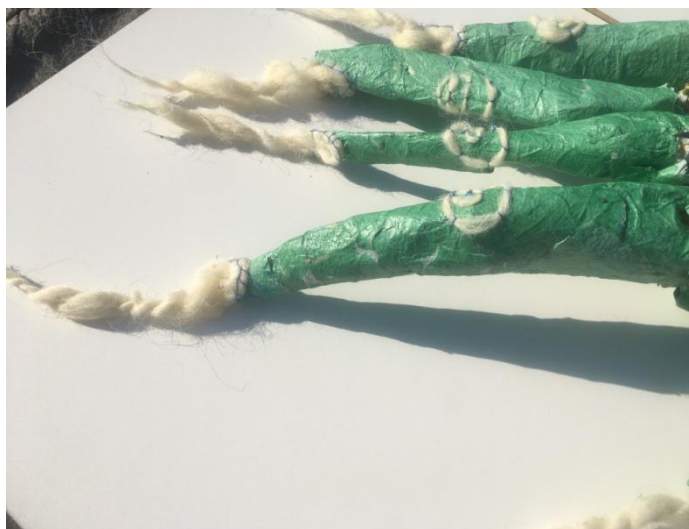
Slika 28 "Zelena ruka" detalj, vidljivi prsti sa vunenim detaljima

Šesterokuti različnih dimenzija raspoređeni su po plohi, formiraju neravnu teksturu sličnu ljuskama.