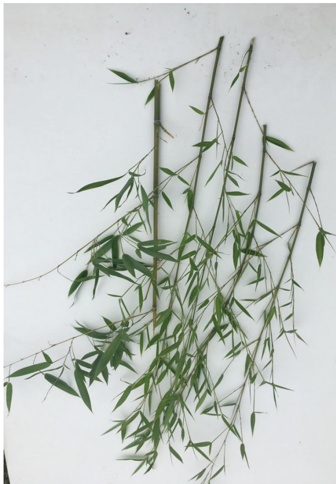
Slika 8 bambus prije odvajanja lišća i različitih deblina grana

Takva svojstva posjeduju i razne grane kakve se primjenjuju pri izradi košara. Pri odabiru materijala u obzir se uzimala i njegova dostupnost u okolini autora. Zbog tih razloga izbor materijala se nakon istraživanja sveo na odbačeno granje te bambus koji raste na autorovom dvorištu. Ovalna struktura bambusa bila je pogodna da se lako izreže na sitnije uzdužne dijelove kako bi se dobilo više materijala za rad. Njihovim korištenjem iskoristio se materijal koji bi inače bio bačen u biootpad. Specifičnosti bambusa su takve da je fleksibilan za rad a kada se osuši stvrdne se.