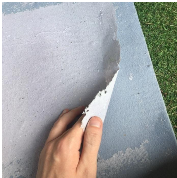
Slika 19 odvajanje papira od podloge nakon sušenja

Osušeni papiri pažljivo se odvajaju od podloge kako ne bi došlo do njihovog traganja, kako što svaki papir mogu potrgati nagli pokreti ruke. Određene podloge za izradu tijekom izrade pokazale su se bolje od drugih, ovisno o glatkoći njihove površine. Oni nešto čupaviji netkani tekstili vlakna ostaju na jednoj strani proizvedenog papira. Takva vlakna pomalo i otežavaju odvajanje papira s podloge jer nastali papir za njih zapinje ili ih čupa ostajući zalijepljen na njih.