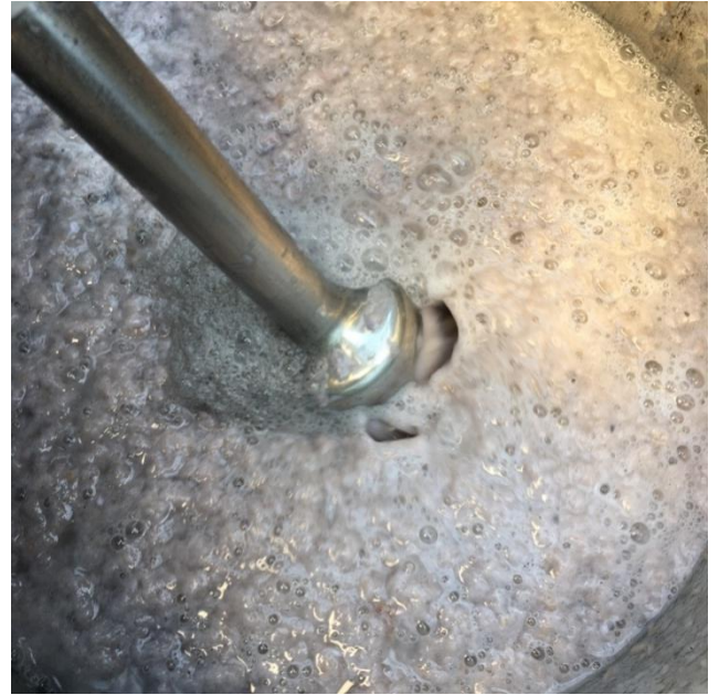
Slika 16 papir u vodi nakon miksiranja, nastaje vlaknasta pulpa prije dodavanja pigmenta

Obojena smjesa vlakana pritom se stavlja u kupelj dovoljne širine, kako bi okvir za izradu papira mogao biti uronjen u nju. U njega se stavlja tvar sluzave strukture zvana neri koji se tradicionalno može dobiti od biljaka. U vlastitoj izradi upotrebio sam sintetički polietilen oksid (PEO) koji dolazi u prahu radi lakšeg skladištenja. Miješa se s vodom kada se želi upotrijebiti. On ima funkciju ljepila, no i mijenja električnu nabijenost u kupelji te pritom čini ravnomjernu raspoređenost vlakana. Kako bi se ona ravnomjerno rasporedili na okvir.