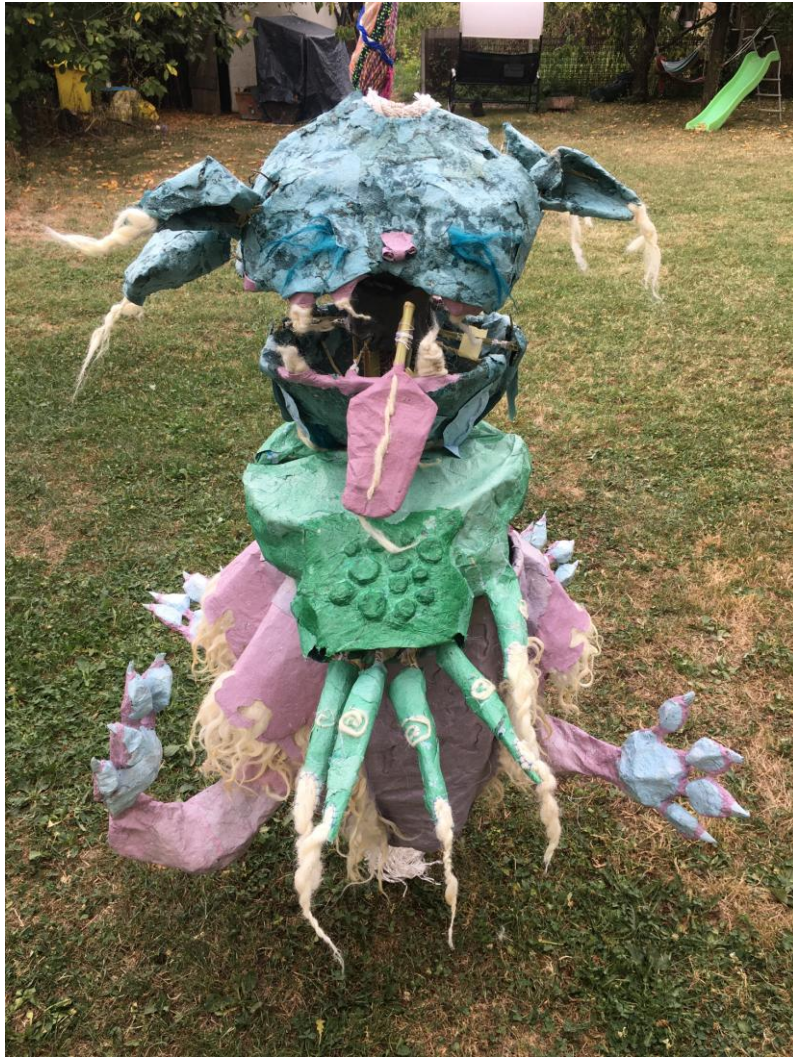
Slika 32 različiti dijelovi spojeni u kićanku