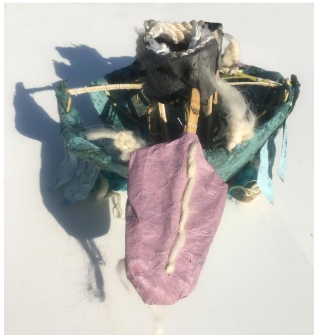
Slika 26 segment nalik donjoj čeljusti