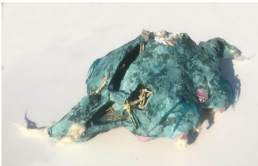
Slika 23 segment kićanke nalik njuške divlje zvijeri