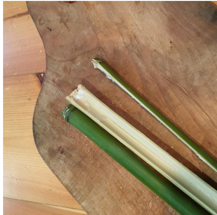
Slika 12 razlike u debljim i tanjim granama bambusa iz bliza

Širi dijelovi nisu se mogli savijati samo rukom. Za njih je bilo potrebno udaranjem čekićem razdvojiti ih na plohe. Udarajući od sredine prema prstenovima koji ih spajaju. Sličan princip se radi i u profesionalnoj izradi košara no u njima su te plohe rezane posebnim nožem kako bi se postigla jednakost.