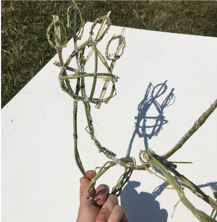
Slika 14 unutarnja konstrukcija od bambusa spajana ručnim šivanjem, prikaz životinjske šape

lagano gibali, te stvarali pokret koji se i povezuje za mobilnom skulpturom. Dodana je težina posebno odabranim kamenjem kako bi se postigao željeni nagib elemenata. Kamenje se fiksirano šivanjem.