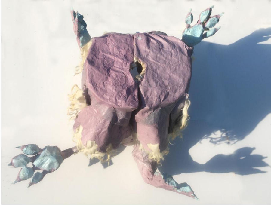
Slika 30 dio kićanke nalik torzu, prikaz odozgo

Četvrti dio nalik je torzu dimenzija visine 56 centimetara i promjera 38 centimetara. Naglašene je vertikalne kompozicije. Valjkasti oblik nadograđen je izbočinama na bočnim stranicama iz koje izlaze vijugavi objekti nalik rukama ili životinjskim šapama. Vrh ruke istaknut je sirovom vunom koja svojim prirodno formiranim vijugama uokviruje ruku.