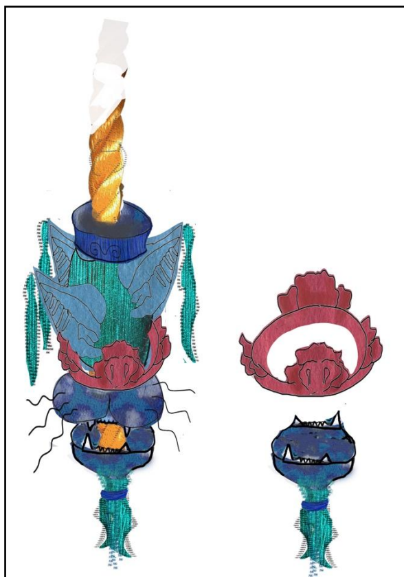
Slika 7 prve skice 2, autorski digitalni crtež

Ako ponovo promotrimo Calderove skulpture i usporedimo to s takvim prvobitnim dizajnom na skicama, uočava se djelomični nedostatak pokretnih dijelova koje čine mobile. Osim što su elementi pozicionirani na baznoj osnovi koja se lagano pomiče, sami mobili u sebi bi trebali posjedovati više dijelova koji slobodno stoje i mogu dovesti do laganog pokreta.