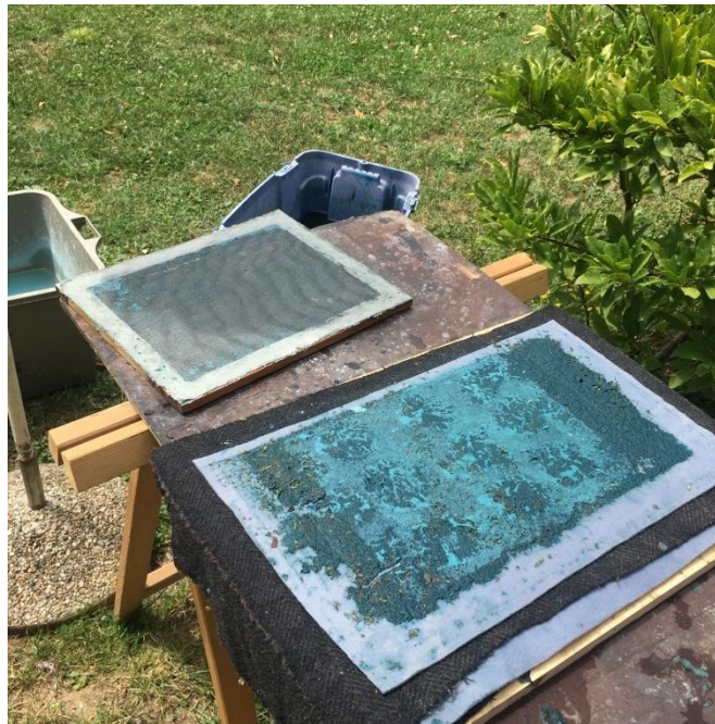
Slika 17 izrada papira, vidljiv papir sa podlogom, okvir za izradu i kadice u kojima su vlakna u vodi

lokaciji samog sušenja. Izrađeni papiru sušili su se vani na suncu. Vrijeme sušenja papira ovisi i o tome da li je papir prešan nakon završetka njegovog rada.