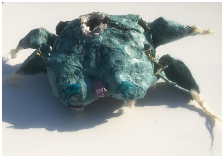
Slika 22 segment kićanke nalik njuške divlje zvijeri

Na dijelovima iz kojih izlaze ti mobilni elementi pojavljuju se i šupljine koje omogućavaju lakšu pokretnost, no oni daju i uvid u unutrašnju konstrukciju koja je prirodne boje bambusa.