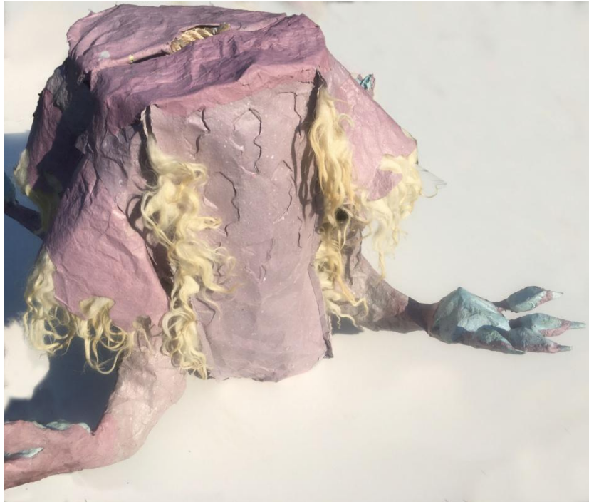
Slika 31 dio kićanke nalik torzu, vidljiv rejef

Preko tih vijuga na papirnatom materijalu izrezana je bordura stiliziranih vunениh vijuga. Takva slična stilizacija vune pronalazi se i na prednjoj strani u gornjem dijelu objekta. Ondje su u redovima raspoređene vijuge koje su u ulegnutom reljefu formirane na površini papira. Cijelu plohu papira s njima omeđuje vidljivi šav u koji je smještena vuna iste vijugaste formacije kao i ona na bočnim izbočinama.