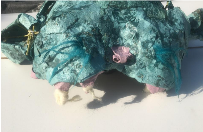
Slika 24 segment kićanke nalik njuške divlje zvijer, detalji

Segment koji je nalik donjoj čeljusti dimenzija 22 centimetara visina i 34 centimetra promjer. U gornjem dijelu sačinjavaju zubi izrađeni od vune prirodnog kolorita. Trokutasti oblik zubiju završava u vertikali vunene pređe koja se slobodno savija pri vrhu. Između dva takva zuba nalazi se plošno istanjen segment nalik jeziku. Po njegovoj sredini vidljiv je šav vunene pređe.