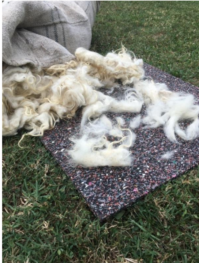
Slika 20 sirova vuna u fazi čišćenja i potom češljanja, vlastita fotografija

Za izradu radova koristi se osim reciklirane celuloze od papira i sirova vuna koju je prvobitno bilo potrebno oprati. Prije samog pranja sortiraju se tamnije vune zasebno od onih svijetlih. Pranju sam pristupio tako da sam u kupelj s vodom stavio vunu, pazeći da ne dođe do procesa filcanja. Oprana vlakna potrebno je iščešljati te pritom razvrstati ovisno o korištenju. Vlakna su služila ili za formiranje pređe ili ako su se koristili za papire posebno su odvojeni za takvu upotrebu.