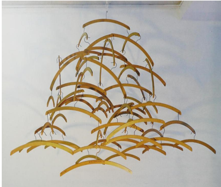
Slika 1 Opstrukcija, Man Ray, kolekcija Marion Meyer iz: Klein, Mason; Alias Man Ray : the art of reinvention , New Haven : Yale University Press, 2009, Str 138

Američki umjetnik Man Ray se u svojim radovima prvenstveno fokusirao na ideju ili određenu misao te je pritom birao umjetnički medij kojim bi je najbolje izrazi. Tako je došao i do bavljenja fotografijom i stvaranja fotografskih radova. Isprva su to bile fotografije njegovih drugih dijela, kao što su ona slikarska. Kroz svoj rad dolazi do spoznaje kako i svakodnevni predmeti imaju mogućnost prenijeti njegovu određenu viziju. U tim radovima može se vidjeti doticaj s umjetničkim pravcem dadaizmom čiji je značajni predstavnik bio Marcel Duchamp. Međutim, razlike u njihovim radovima su u načinima kojima pristupaju tim objektima. Duchamp svoje objekte bira sasvim slučajno te od njih pritom radi svoje „ready-made“ skulpture. 2