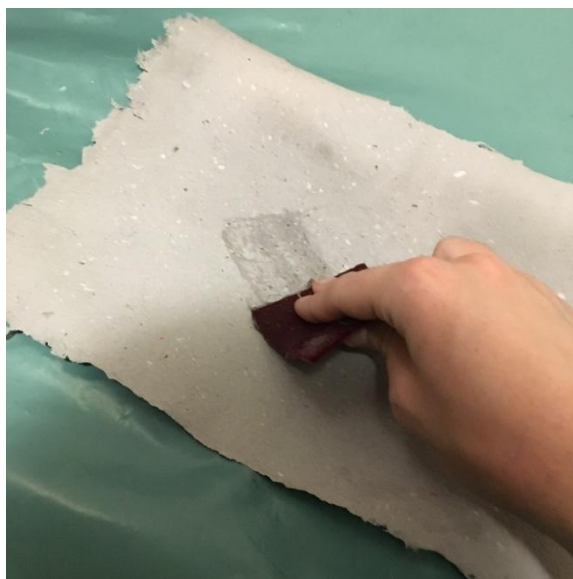
Slika 21 prikaz faze premazivanja papira radi njihovog jačanja i mogućnosti šivanja, vlastita fotografija

Sam premaz papira radi se tako da se smjesa nanosi u tankome sloju prvo na jednu stranu papira, pri svakom premazu potrebno je nabrati materijal, kao što je navedeno kako bi se osigurala elastičnost i dalo mogućnosti smjesi da prodre u srž papira. Nakon toga materijal se pažljivo izravna kako ne bi došlo do trganja, te se stavlja na sušenje. Zatim se nakon sušenja isti postupak ponavlja za drugu stranu papira. Obje faze poželjno je ponoviti nekoliko puta kako bi se povećala svojstva koje premaz daje, poput čvrstoće ili vodootpornosti koja ovisi i o debljini papira. Vlastiti cilj u postupku bio je primarno dobit svojstvo čvrstoće i elastičnosti nalik tekstilu koji čini materijal prigodan za šivanje.