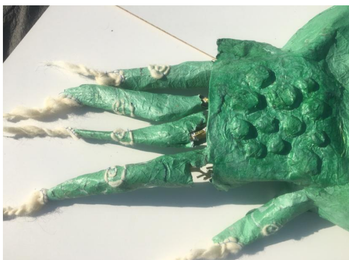
Slika 29 "Zelena ruka" detalj, vidljiv reljef