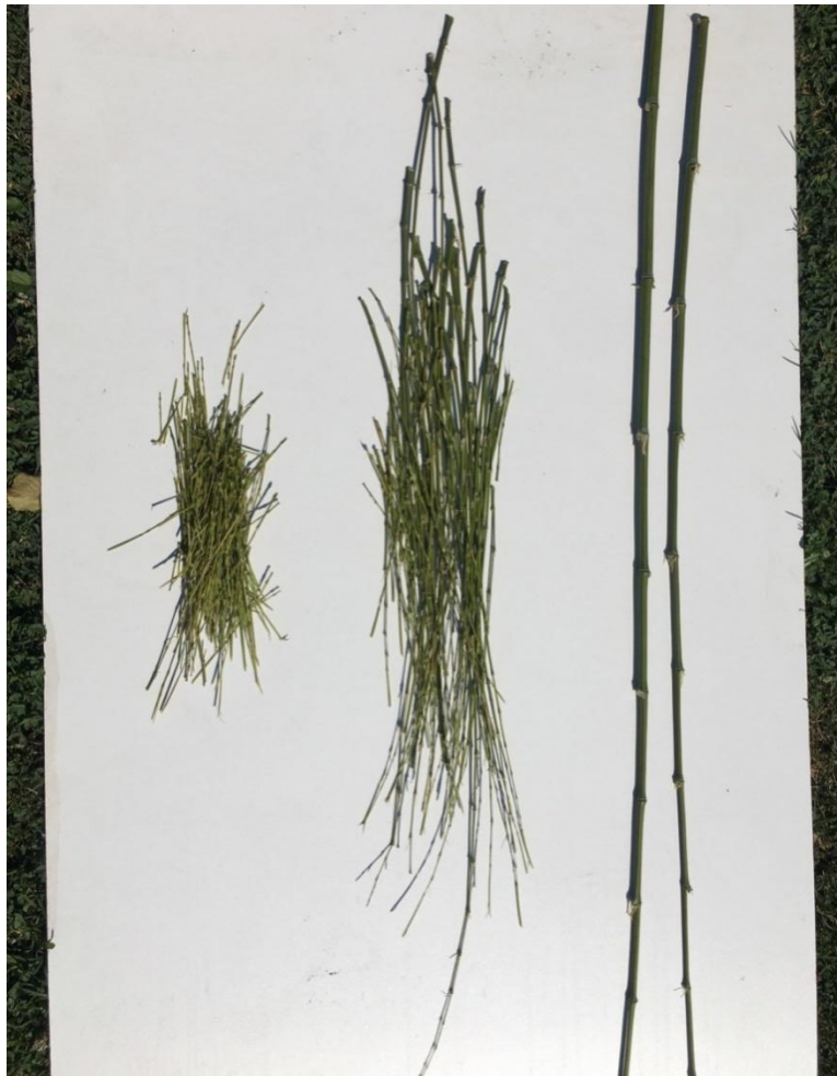
Slika 11 različite debljine grana bambusa, uskoredba količine grana različitih debljina sakupljenih iz dvije najdeblje grane

Zatim, kako bi nastala željena skulpturalna forma, potrebno takve pripremljene materijale saviti u željene oblike. Spajajući njih nekoliko kako bi povećao čvrstoću. Takve svježe stabljike bile su savitljive nekoliko dana, tako da se njihova forma mogla popravljati sve dok se ne bi potpuno osušile. Nakon dva, tri dana mijenjaju boju u nijansu maslinasto zelene. S tom promijenim boje dolaze i druge njihove promijene. Postaju manje savitljive, no dalje ne pretjerano krute i mogu se raditi sitne prepravke u željenom obliku.