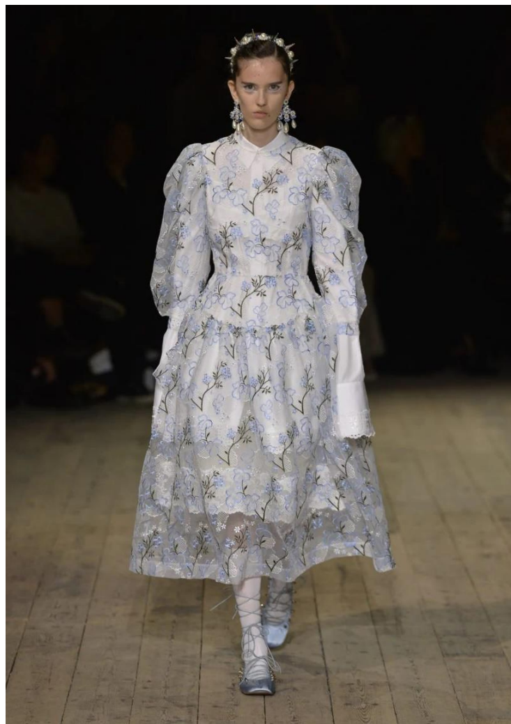
Slika 11. Kreacija iz kolekcije proljeće/ljeto 2020.

Pristup stilizaciji ove kolekcije dodatno pojačava cjelokupni dojam. Prirodna ljepota modela, s minimalnom šminkom i jednostavnim frizurama, savršeno je upotpunila složenost i bogatstvo tekstura i silueta u kolekciji. Ova prirodnost, u kombinaciji s luksuznim materijalima i bogatim detaljima, stvorila je efekt koji je istodobno eteričan (prozračan?) i moćan. Rocha je uspješno stvorila kolekciju koja svoje nadahnuće nalazi u povijesti, ali za izražaj rabi moderno doba.