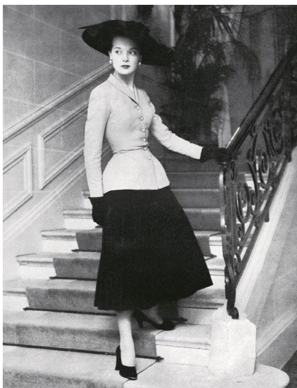
Slika 5. The bar odijelo iz kolekcije The New Look