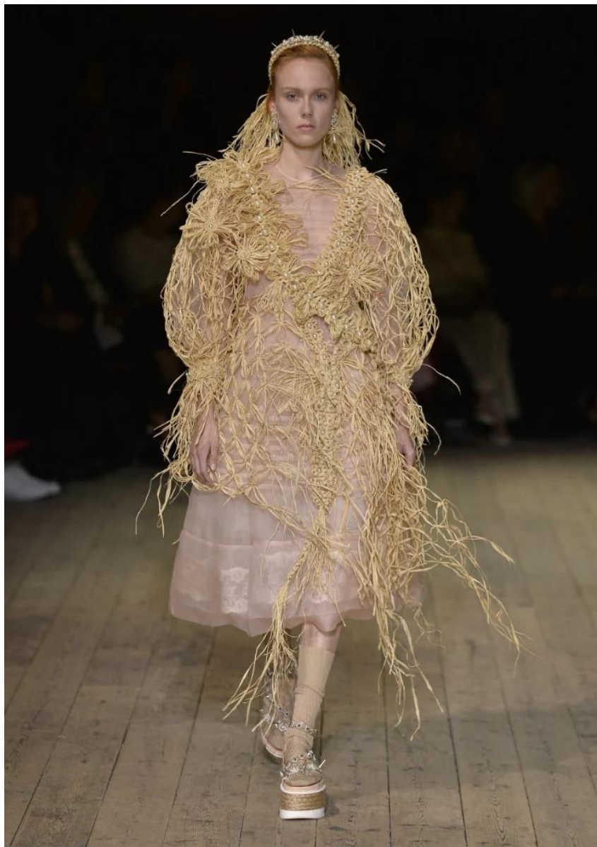
Slika 12. Kreacija iz kolekcije proljeće/ljeto 2020.