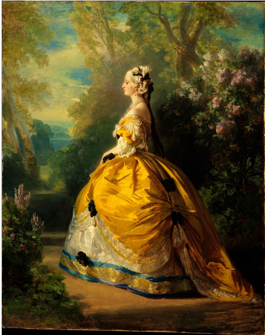
Slika 4. Portret carice Eugenie u dizajnu Charlesa Fredericka Wortha, Franz Xaver Winterhalter, 1854.