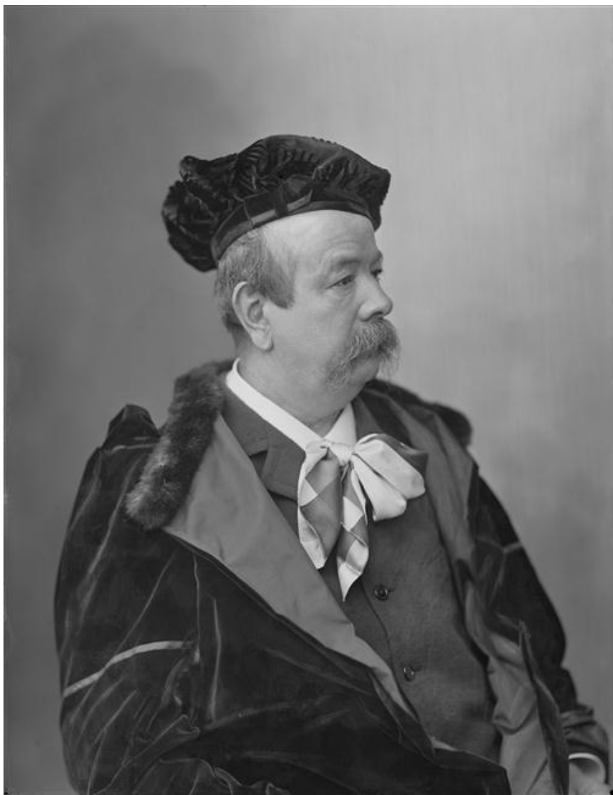
Slika 3. Charles Frederick Worth, portret, 1892.

Osim carice Eugenie, Worth je dizajnirao za mnoge druge članove europskih kraljevskih obitelji, uključujući caricu Austrije, Elizabetu Bavarsku, poznatu kao Sisi. Haljine koje je Worth dizajnirao za Sisi bile su poznate po svojoj sofisticiranosti i eleganciji te su postale ključni elementi njenog nezaboravnog stila. Njegov se utjecaj proširio i na britansku aristokraciju, uključujući dame s britanskog dvora koje su također bile oduševljene njegovim dizajnom. Worthova klijentela nije se ograničavala samo na Europu. Njegove haljine nosile su i bogate žene iz Amerike koje su putovale u Pariz kako bi iskusile luksuz haute couture mode. S obzirom na to da je Pariz bio svjetski centar mode, Worth je imao globalnu klijentelu, a njegova modna kuća postala je mjesto gdje su se stvarale najprestižnije modne kreacije tog doba.