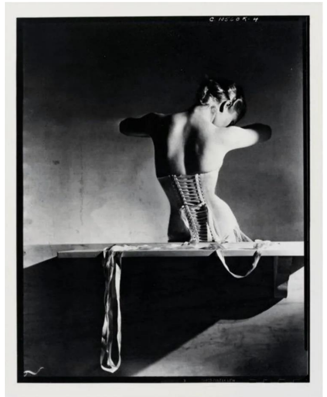
Slika 7. Mainbocher Corset, Horst P. Horst, 1939.