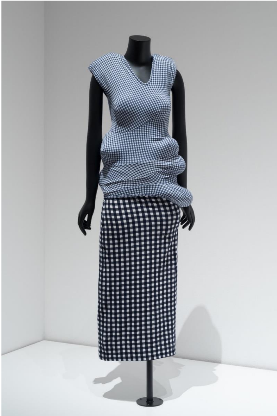
Slika 9. Kreacija iz kolekcije Dress Meets Body, Body Meets Dress