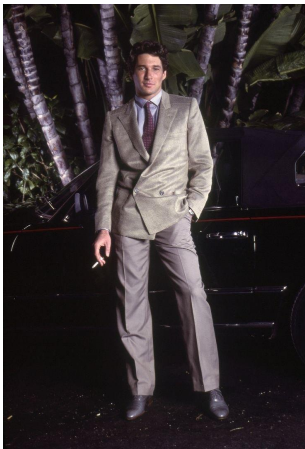
Slika 8. Richard Gere u filmu Američki žigolo

Kada je osnovao brend 1975. godine, Giorgio Armani bio je relativno nepoznat u modnim krugovima izvan Europe. S izlaskom filma Armani postaje ime na usnama svih modnih znalaca. Film prikazuje protagonista Juliana Kayea kao sofisticiranog eskorta čiji stil odijevanja nije bio samo modni dodatak nego i esencijalni dio njegovog identiteta. Armanijeva odijela u filmu nisu samo oblačila Gere a; ona su definirala njegovu osobnost i način života. Odijela su postala produžetak Kayeove karizme, njegovog statusa i zavodničkog identiteta. Odjeća kreira auru i poželjnost Gereova lika, bez obzira na Gereovu nepoželjnu poziciju unutar filma.