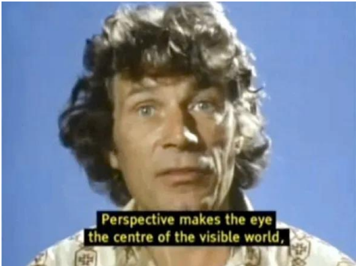
Slika 2. Kadar iz prve epizode BBC-jeve serije The ways of seeing