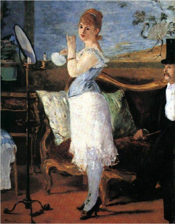
Slika 6. Nana, Édouard Manet. 1877.