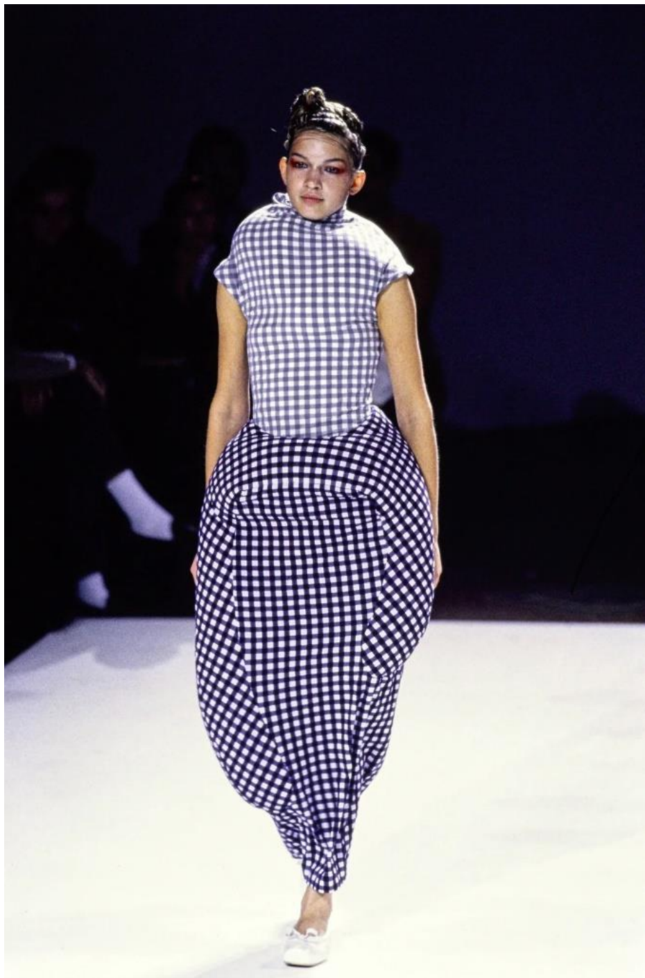
Slika 10. Kreacija iz kolekcije Dress Meets Body, Body Meets Dress