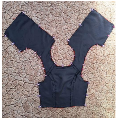
Slika 32. Spajanje podstave i gornjeg dijela