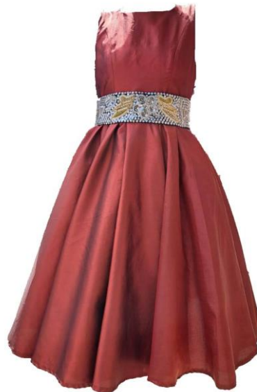
Slika 36. Haljina s pojasom od zlatoveza