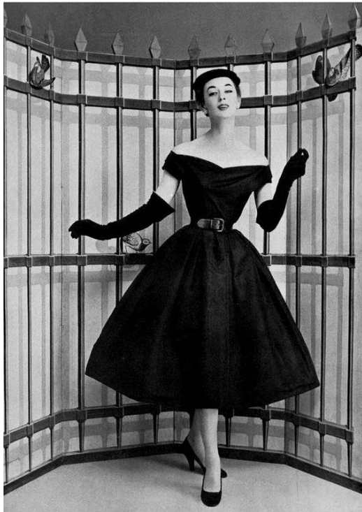
Slika 2. Christian Dior 1947.