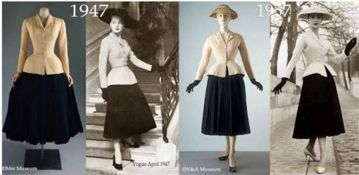
Christian Dior - The Original "Bar Suit" (left) and the 1957 version (right)