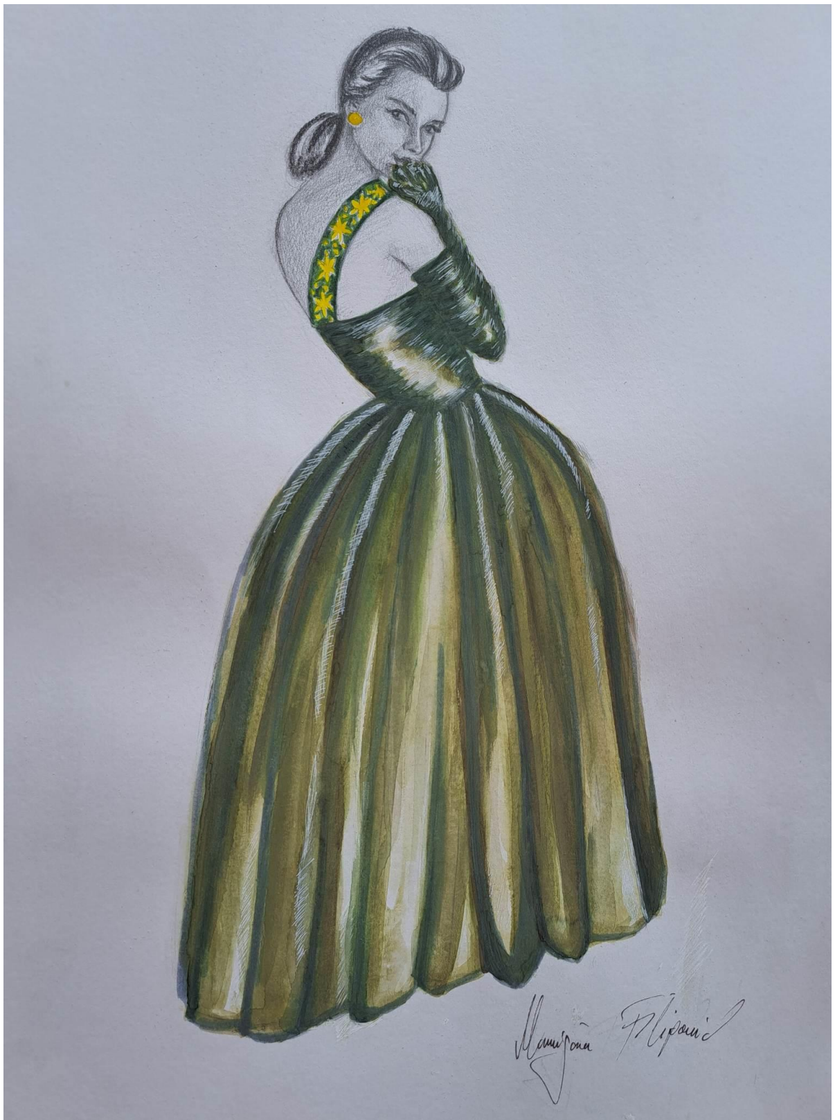
Slika 20. Modna skica haljine 9