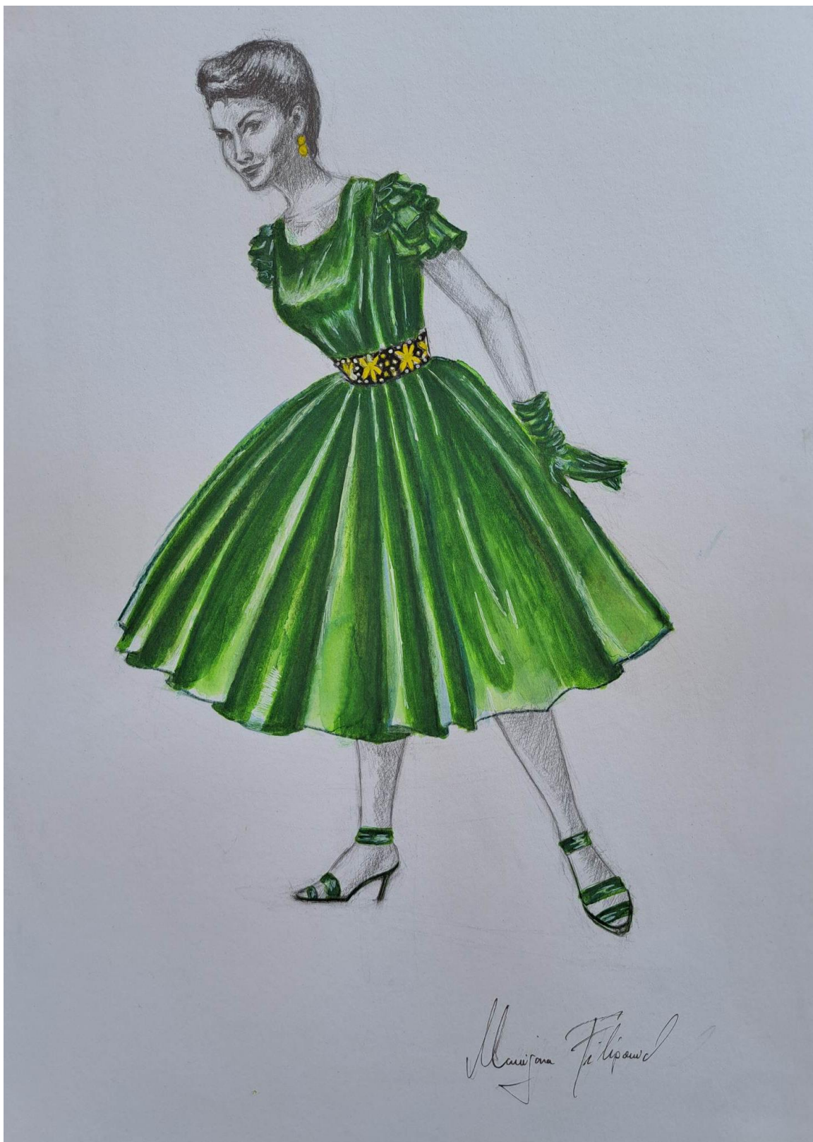
Slika 21. Modna skica haljine 10