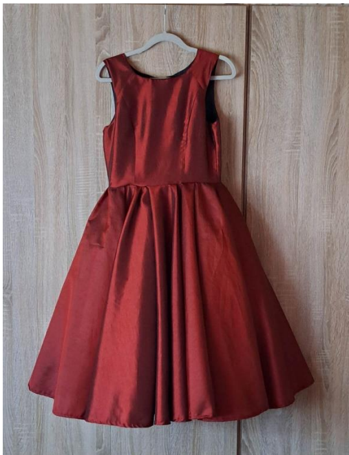
Slika 35. Izrealizirana haljina

Haljina izrealizirana na temelju kroja Diorovih haljina 1947. i 1950ih godina prošlog stoljeća od crvenog tafta, crnog satena i crnog tila kako bi dobila volumen uz pojas ručno navezen slavonskim zlatovezom.