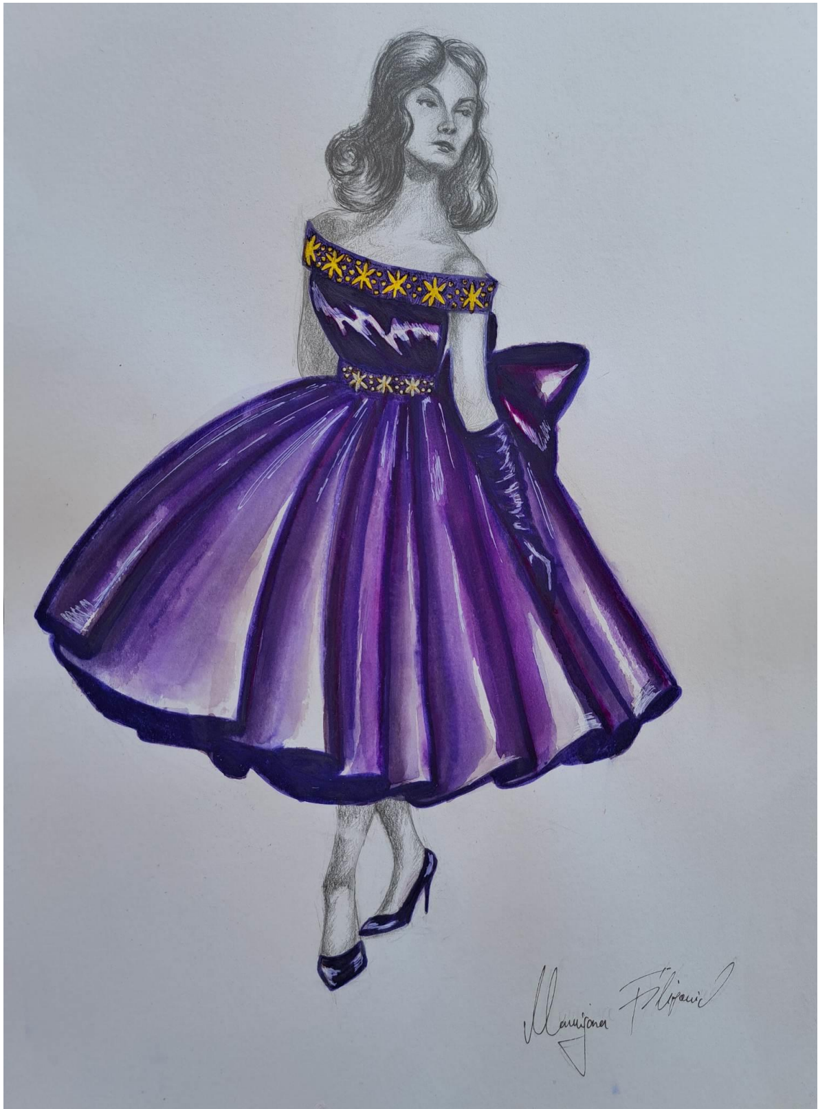
Slika 19. Modna skica haljine 8