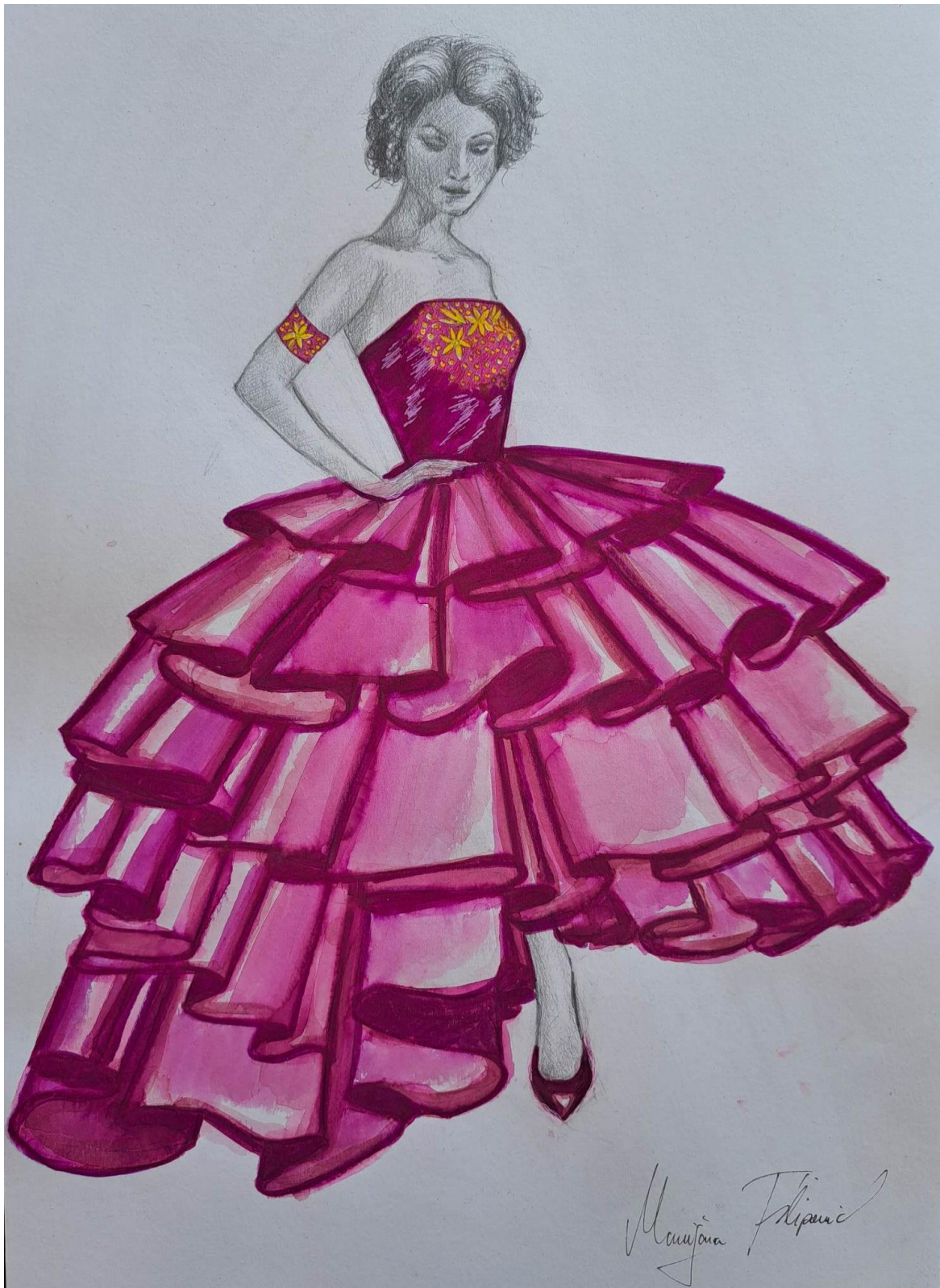
Slika 23. Modna skica haljine 12