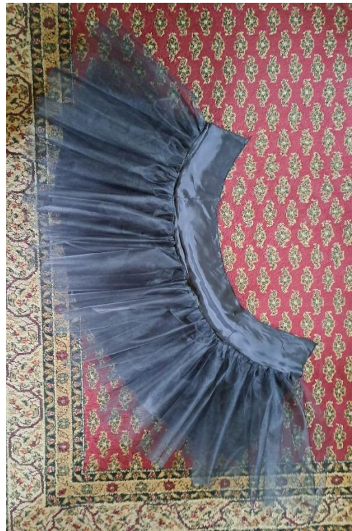
Slika 30. Sašivena podsuknja