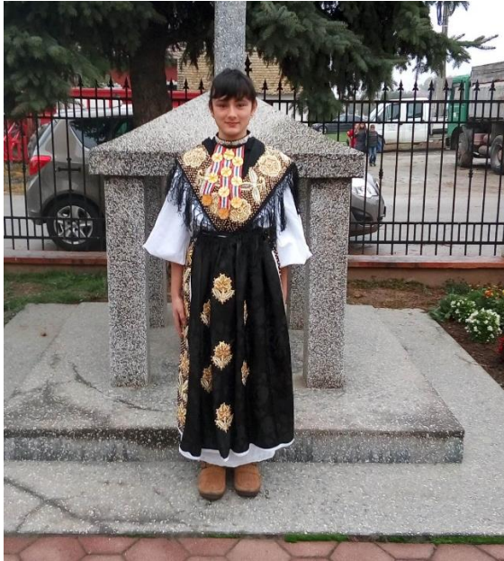
Slika 8. Ženska narodna nošnja prednja strana