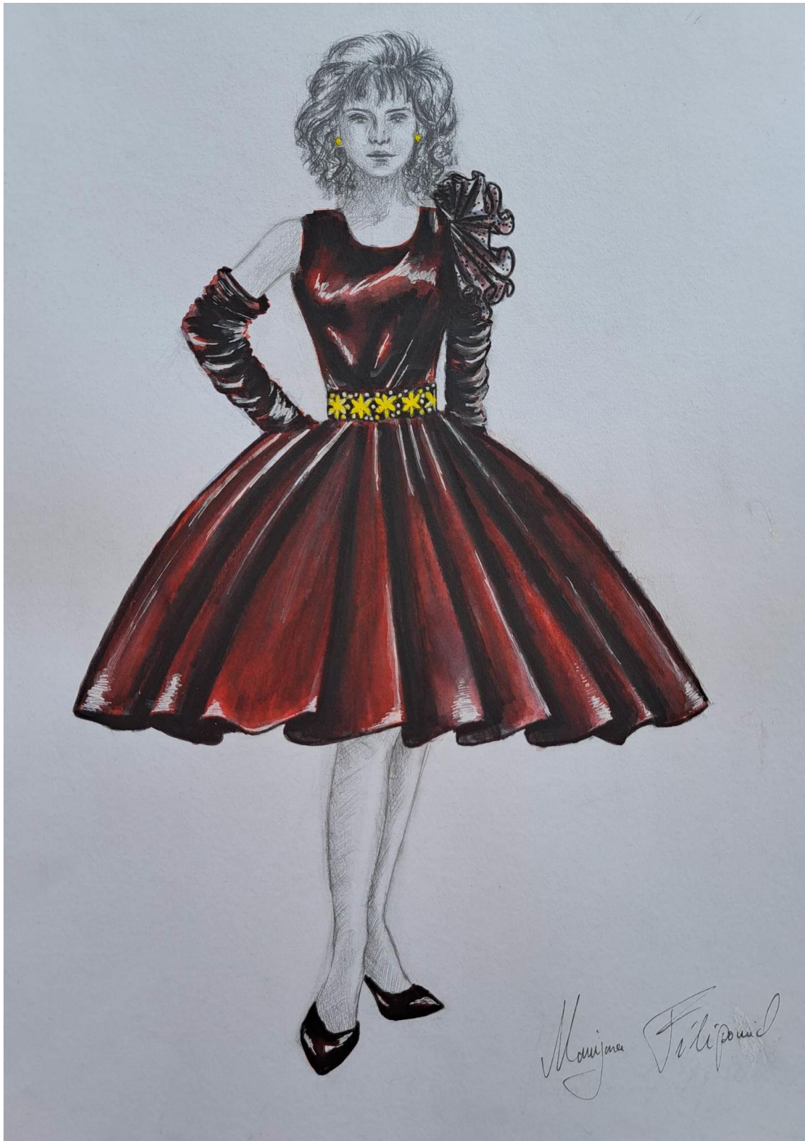
Slika 12. Modna skica haljine 1