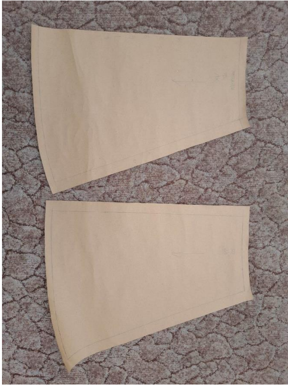
Slika 29. Kroj podsuknje