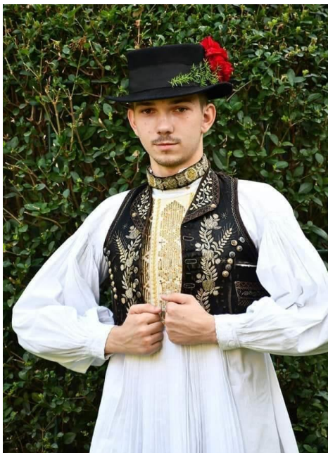
Slika 6. Slavonska nošnja sa zlatovezom