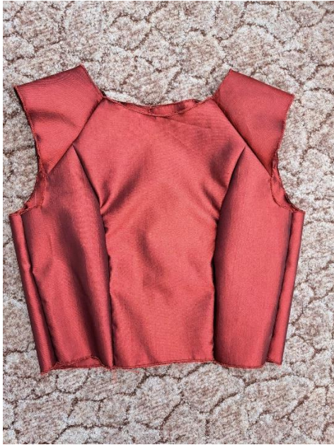
Slika 33. Spojen gornji dio