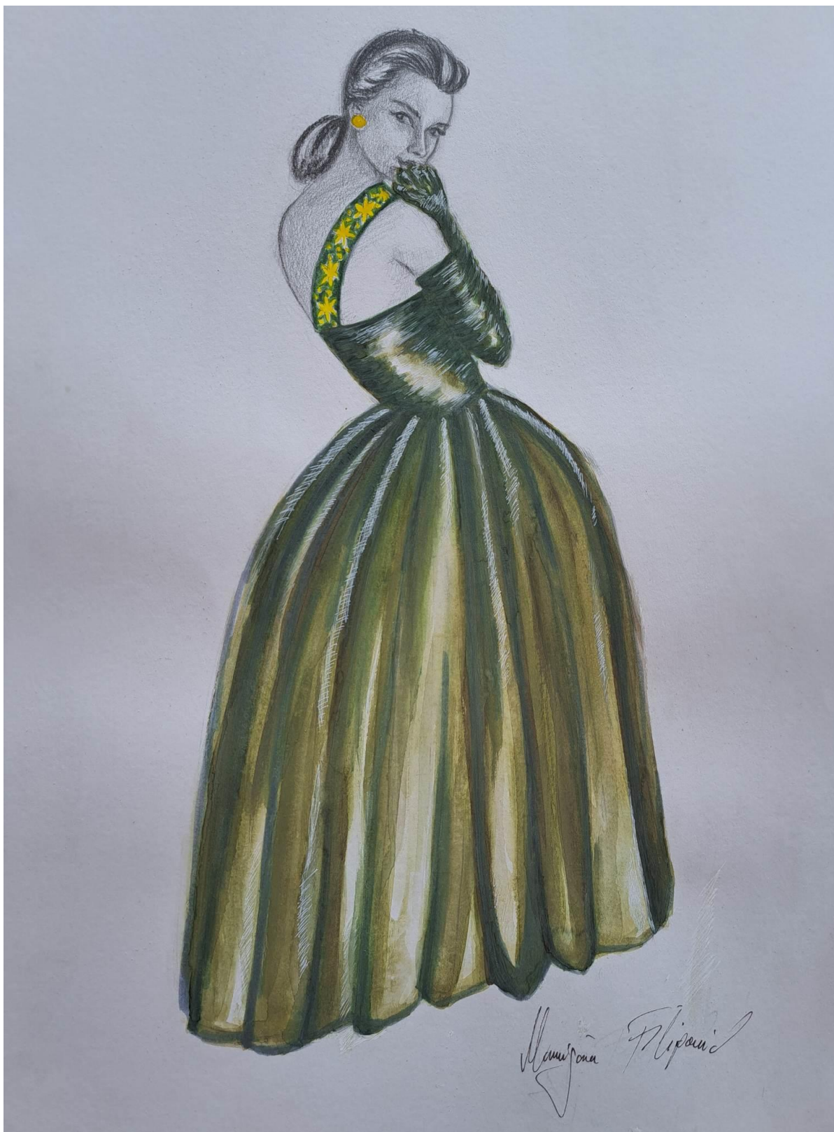
Slika 20. Modna skica haljine 9