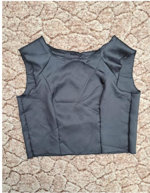
Slika 34. Spojena podstava