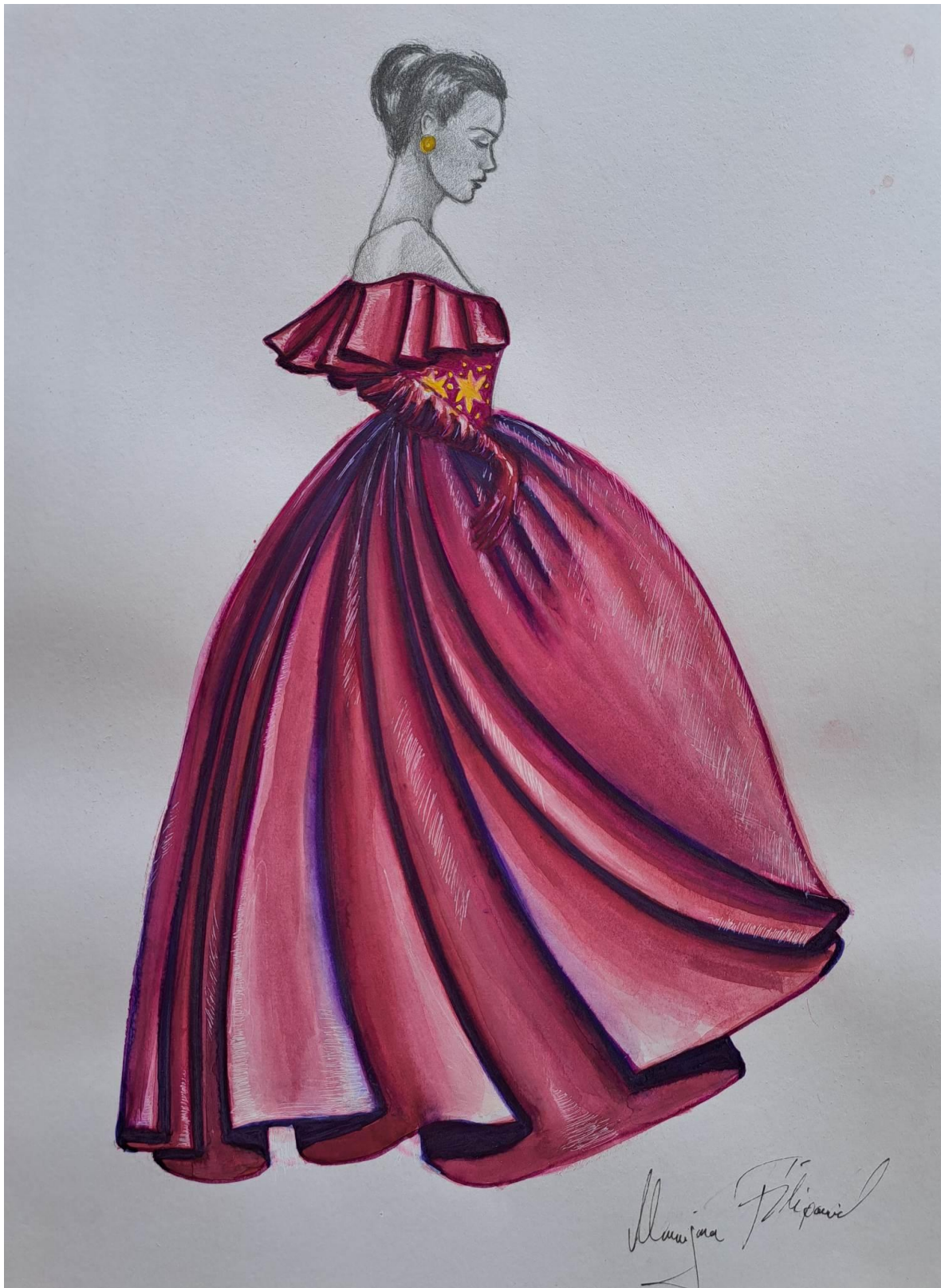
Slika 24. Modna skica haljine 13