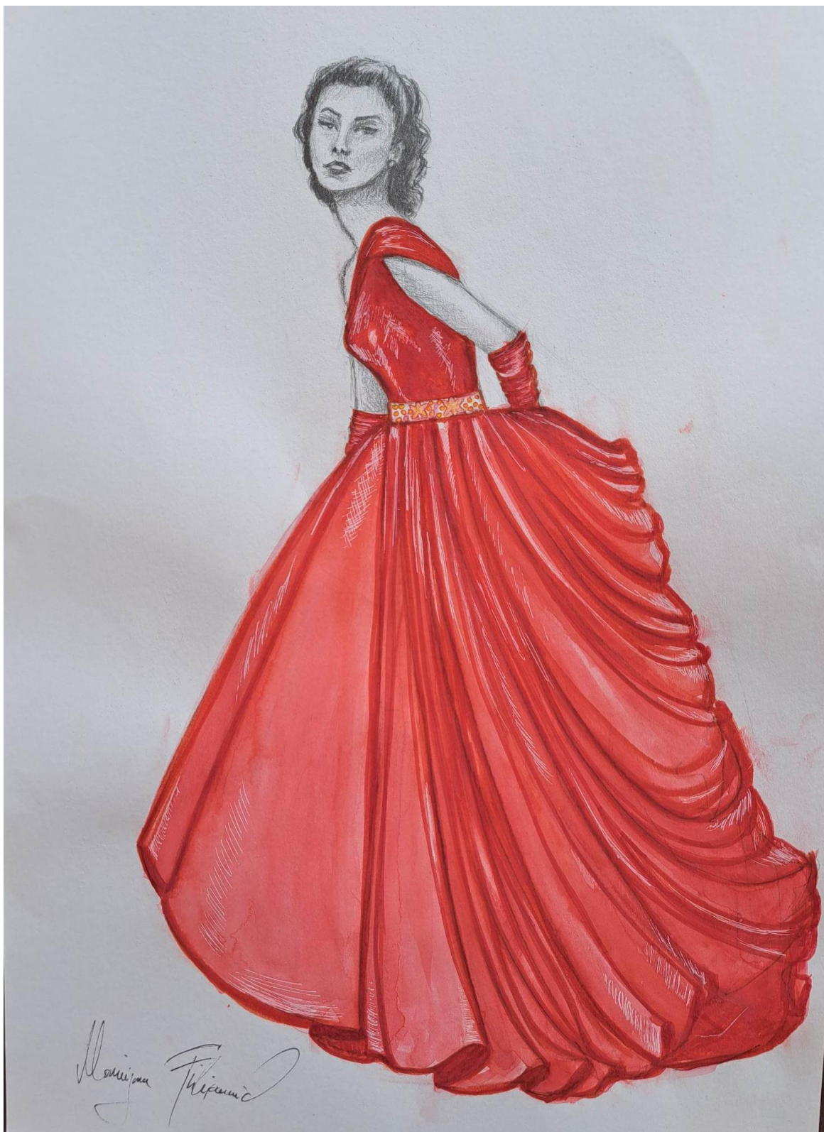
Slika 25. Modna skica haljine 14