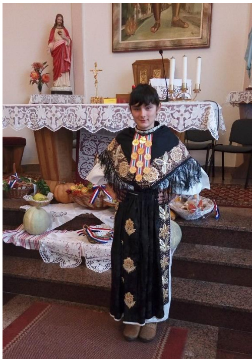
Slika 10. Ženska nošnja sa zlatovezom