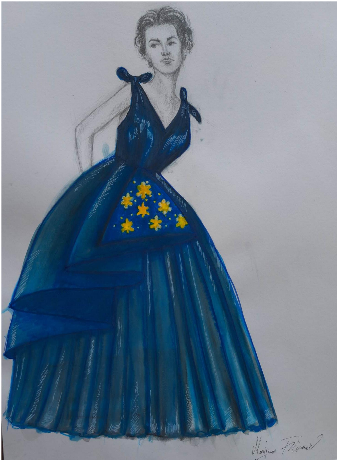
Slika 14. Modna skica haljine 3