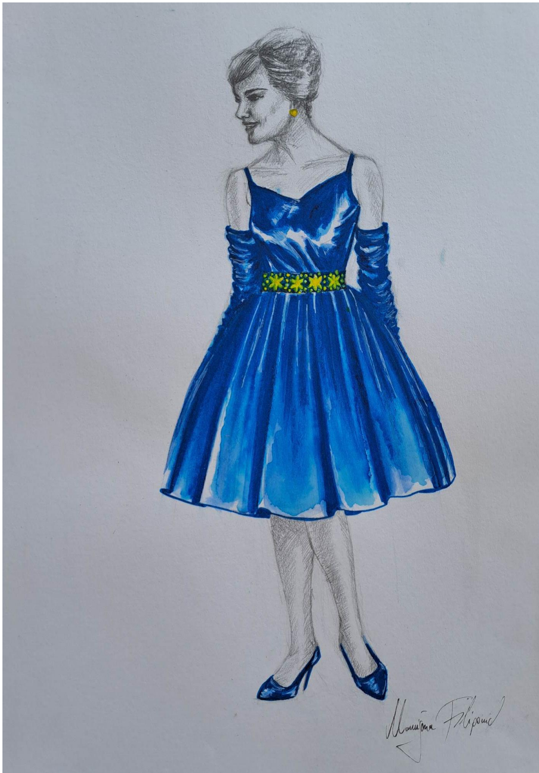
Slika 17. Modna skica haljine 6