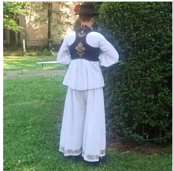
Slika 4. Slavonska muška nošnja prednja strana Slika 5. Slavonska nošnja stražnja strana