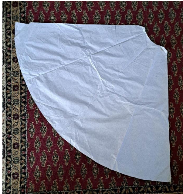
Slika 27. Kroj gornjeg prednjeg i stražnjeg dijela Slika 28. Kroj šestina punog kruga