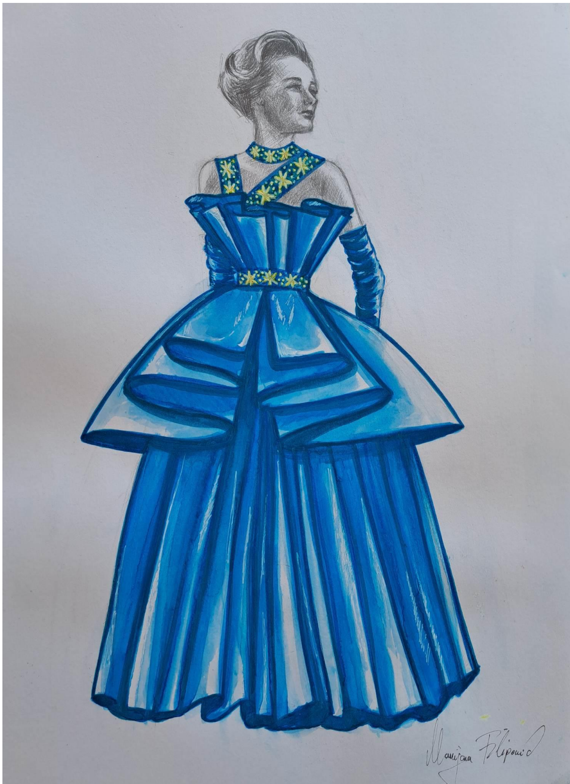
Slika 15. Modna skica haljine 4