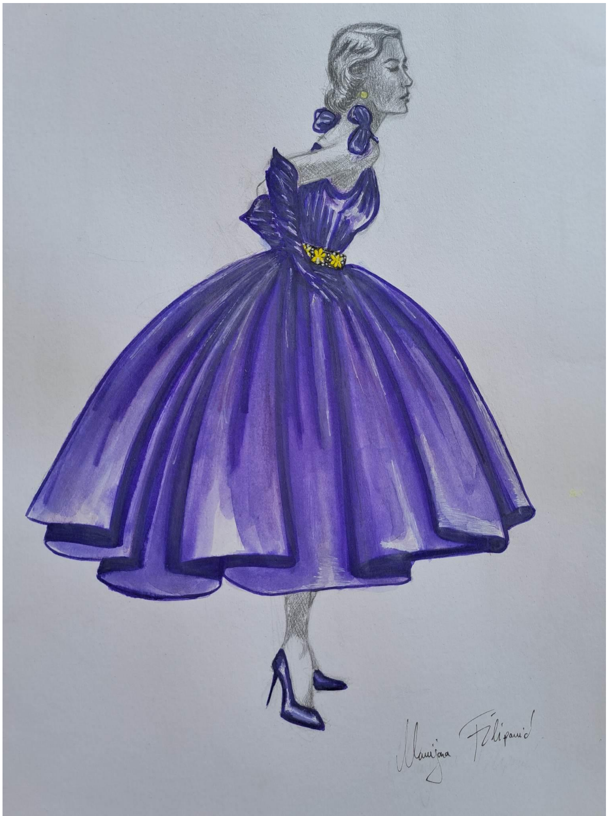
Slika 18. Modna skica haljine 7