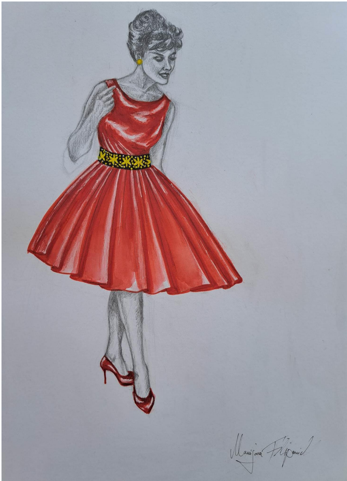
Slika 26. Modna skica haljine 15 koja je realizirana u prirodnoj veličini