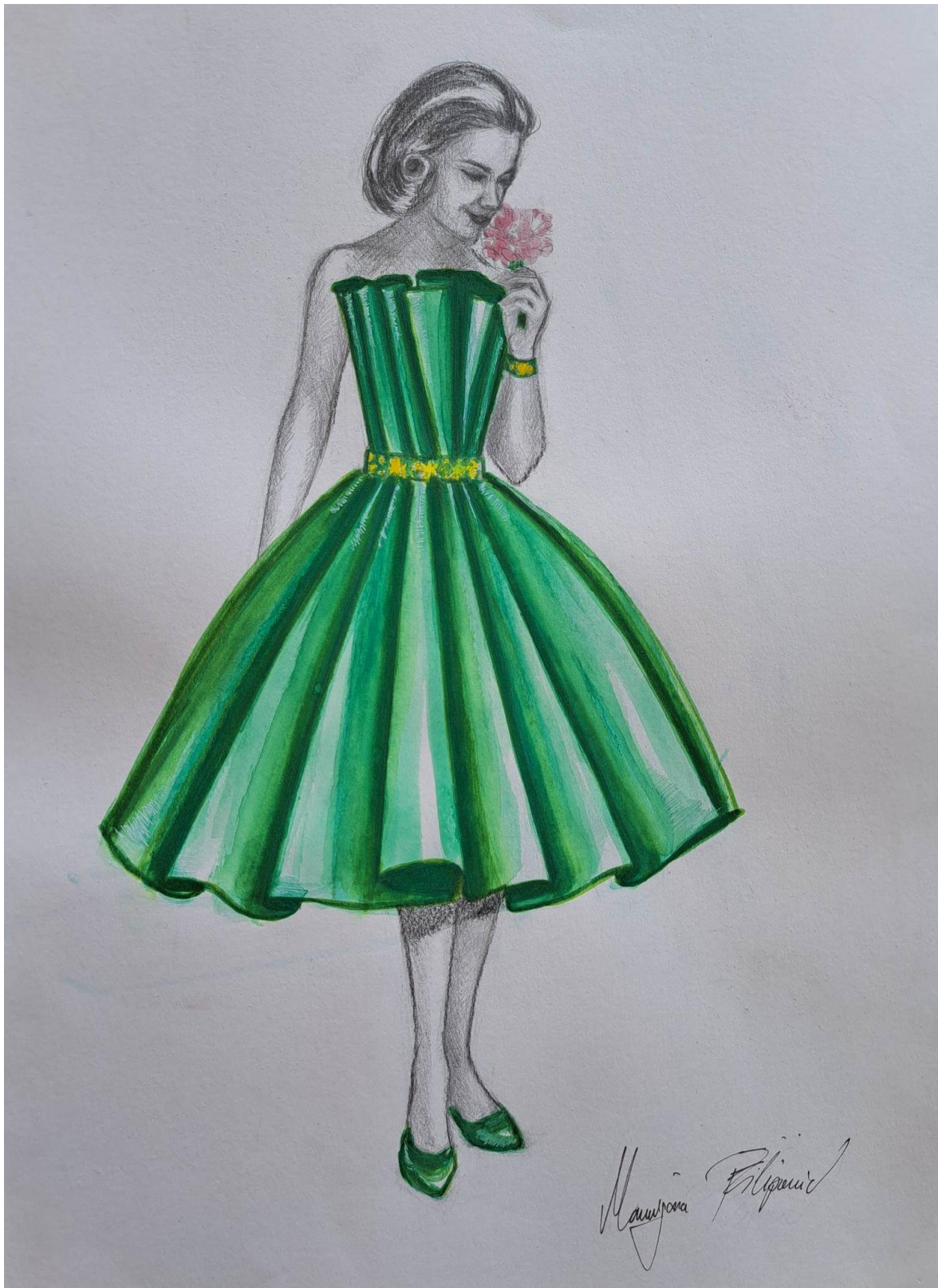
Slika 22. Modna skica haljine 11