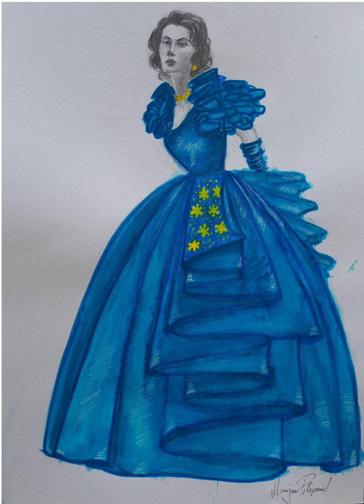
Slika 16. Modna skica haljine 5