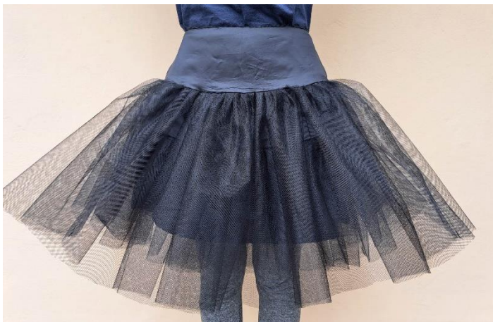
Slika 31. Spojena podsuknja