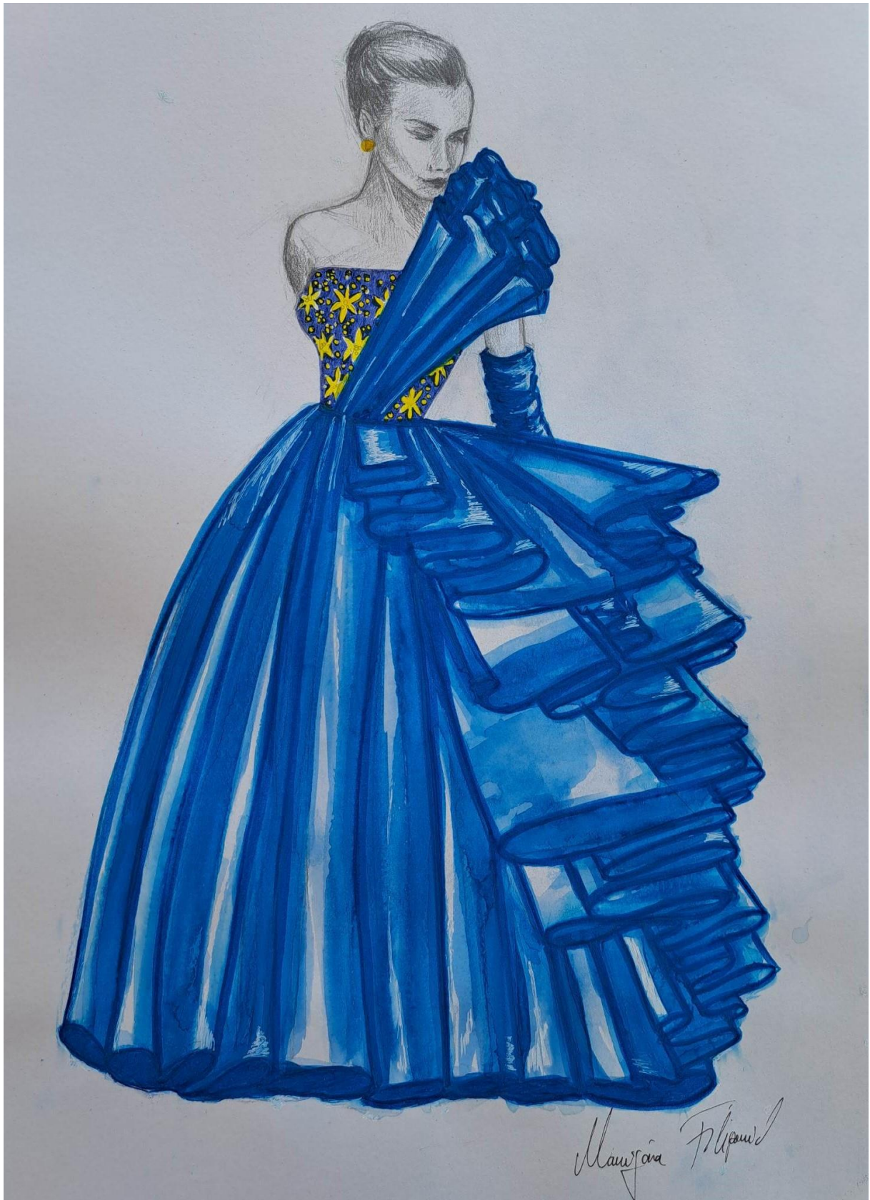
Slika 13. Modna skica haljine 2