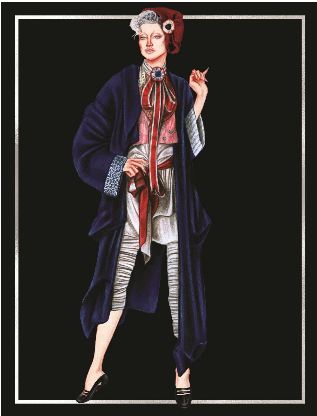
Slika 27. završna kolekcija na fakultetu, 1984. godine