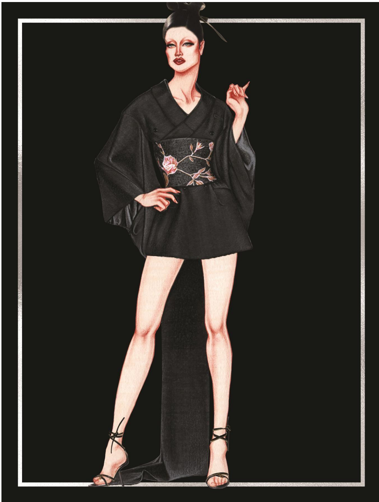
Slika 30. John Galliano ready-to-wear kolekcija za jesen 1994. godine