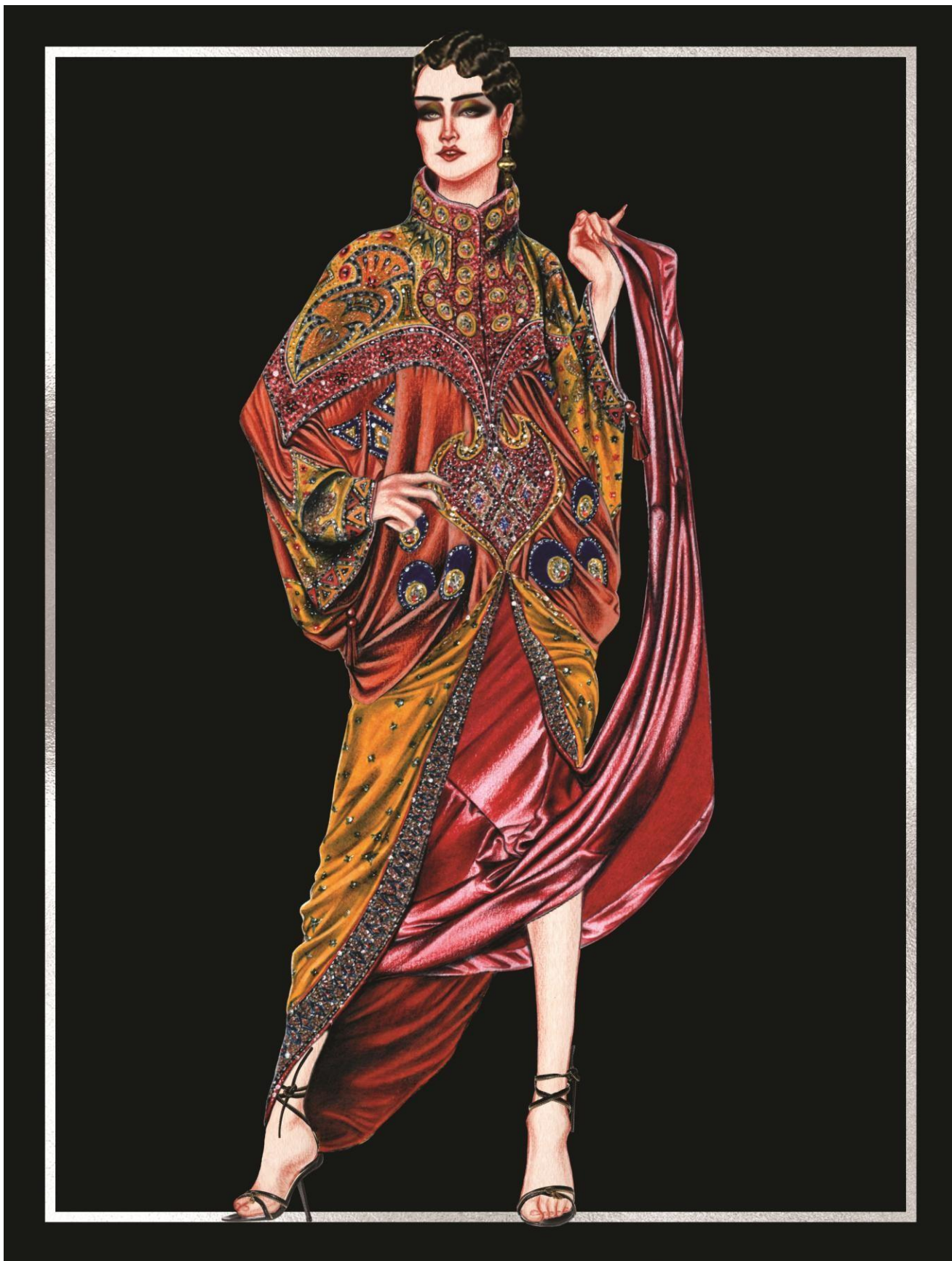
Slika 33. Christian Dior couture kolekcija za proljeće 1998. godine