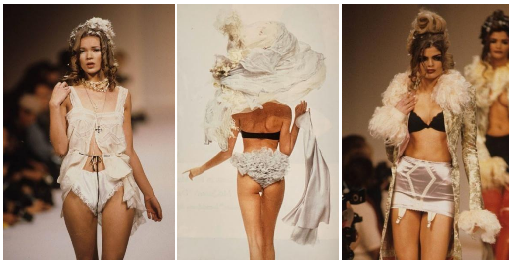
Slike 7., 8. i 9. proljetna kolekcija 1992. godine

Nakon toga Galliano ponovno naginje prema svojim avangardnim korijenima koji još uvijek ne rezultiraju komercijalnim uspjehom. Kolekcije nisu pozitivno primljene od strane medija te je Bertelsen imao velikih poteškoća u prodaji odjeće. Nakon što je 1992. godine prezentirao kontroverznu kolekciju "Josephine Bonapart meets Lolita" u kojoj su modeli vrlo oskudno odjeveni u donje rublje, providne haljine i pohabane komade paradirali modnom pistom, Bertelsen je konačno povukao sredstva i prekinuo suradnju s Gallianom. Time je njegov obrt po drugi put privremeno zatvoren. Kreacije su bile previše ekstremne za tadašnju javnost i niti jedan trgovac nije bio spreman za takav financijski rizik, zbog čega kolekcija nikada nije došla do proizvodnje.