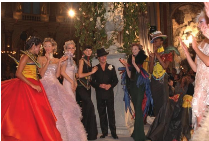
Slika 15. Gallianova prva kolekcija za Dior

Po dolasku u Dior, Galliano je pod velikim pritiskom da predstavi impresivnu kolekciju. Njegova prva prezentacija označavala je pedesetu obljetnicu prve kolekcije Christiana Diora. Bilo je nužno da i on sam ostavi utisak na klijente te predstavi novu i inovativnu viziju za modnu kuću. Galliano je odlučio interpretirati različite arhivne elemente te ih pomiješati s vlastitom estetikom. Kolekcija je po običaju nadahnuta elementima mnogih kultura i povijesnih referenci, od kineskih silueta s vezom do tradicionalnog afričkog ukrašavanja, dok je od Diora posudio klasični karirani houndstooth uzorak te siluete večernjih haljina. I kupci i mediji su kolekciju smatrali apsolutnim trijumfom te su po završetku revije Galliana dočekale ovacije publike.