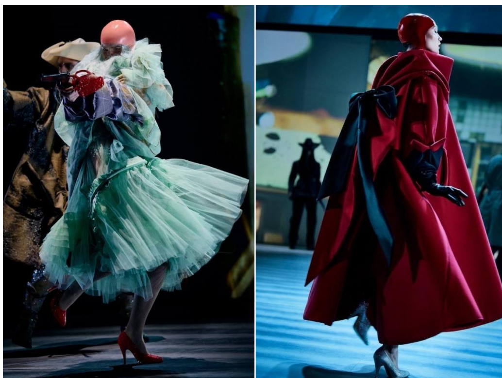
Slike 25. i 26. Margiela kolekcija za jesen 2022. godine

zapravo kreirao Galliano, koji osobno nije prisustvovao njenoj prezentaciji. Te iste sezone prezentirana je nedovršena verzija kolekcije za John Galliano. Unatoč tome što je njegova karijera bila naočigled gotova, njegov doprinos modnoj industriji ostaje cijenjen i zabilježen u povijesti. Nakon javnog skandala Galliano odlazi na odvikavanje te kroz nekoliko idućih godina uglavnom izbjegava javnost. 2013. godine je po prvi put nakon skandala intervjuiran za američki časopis Vanity Fair , gdje je otvoreno govorio o svojoj borbi s ovisnošću, vlastitoj percepciji događaja koji mu je okončao karijeru te mogućnostima za budućnost. Prvi znak povratka na modnu scenu imao je kao gostujući dizajner za jesensku kolekciju dizajnera Oscara de la Rente 2013. godine, ali je pravi povratak doživio potkraj 2014. godine kada je dobio poziciju kreativnog direktora za modnu kuću Maison Margiela. Svoju prvu kolekciju predstavio je couture linijom u proljeće 2015. godine. Galliano je proučavajući arhivu modne kuće iskoristio elemente poput minimalizma i dekonstruktivizma te ih provukao kroz filter vlastitog kreativnog jezika i sada već prepoznatljivih motiva. Modna je industrija entuzijastično prihvatila njegov povratak na modnu scenu. Galliano je u posljednjih osam godina rada za Margielu pronašao jedinstveni pristup i vlastitu interpretaciju kodova modne kuće koje stapa sa svojom sklonosti prema teatralnosti i avangardi.