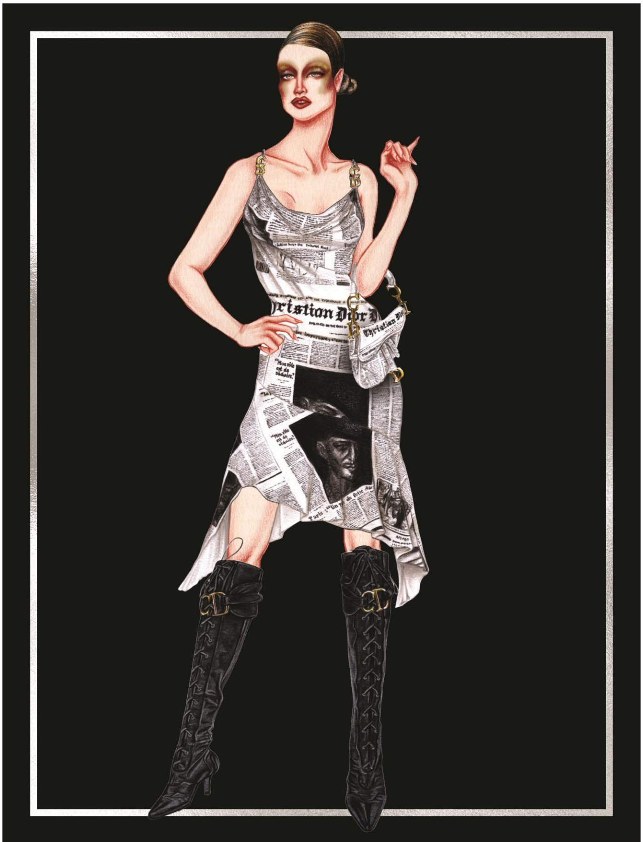
Slika 35. Christian Dior ready-to-wear kolekcija za jesen 2000. godine