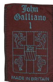
Slika 3. prva službena etiketa sa logotipom

Inspiraciju za svoju prvu kolekciju Galliano pronalazi u povijesnom kostimu, što na samom početku postavlja temeljnu notu njegova budućeg rada. Kolekciju je nazvao "Les Incroyables"