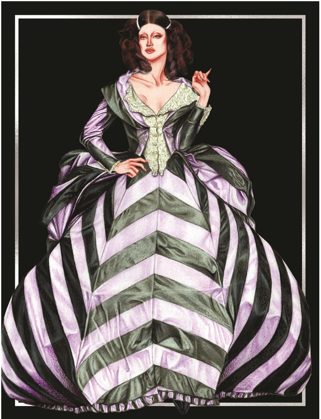
Slika 29. John Galliano ready-to-wear kolekcija za proljeće 1994. godine