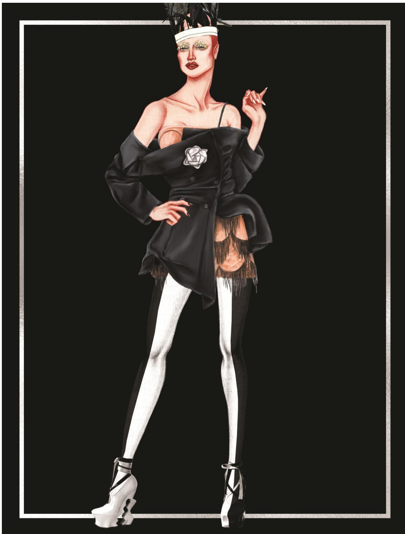
Slika 41. Maison Margiela couture kolekcija za proljeće 2015. godine