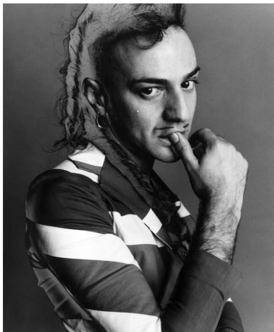
Slika 1. John Galliano

John Charles Galliano rođen je u britanskom prekomorskom teritoriju Gibraltar, smještenom na samom rubu između kontinenta Europe i Afrike. Geografski se preciznije radi o području na istoimenom tjesnacu na jugu Pirenejskog poluotoka, između Atlantskog oceana i Sredozemnog mora. Zbog takvog položaja, u Gibraltaru se sastaje mnoštvo raznolikih kulturnih utjecaja koji se stapaju u bogatu cjelinu. Tako je i Galliano od malih nogu otkriven ljepoti prirode Mediterana, mirisima začina i bilja s lokalnih marketa, tepisima i sagovima obogaćenih šarenim bojama i teksturama sjevernoafričkih te španjolskih tekstila koji su na njega ostavili trajni utisak. (Taylor, 2020: 11). Napustio je Gibraltar sa samo šest godina kada se obitelj seli u Ujedinjeno Kraljevstvo radi boljih prilika i mogućnosti za Johna i njegove dvije sestre. Deset godina kasnije kao mladić nadaren za jezike i umjetnost započinje školovanje u City of East London College gdje svoju edukaciju fokusira na jezike, ali po savjetu profesora koji primjećuju njegov prirodni talent za crtanje odlučuje promijeniti smjer te odlazi na Central Saint Martins School of Art.