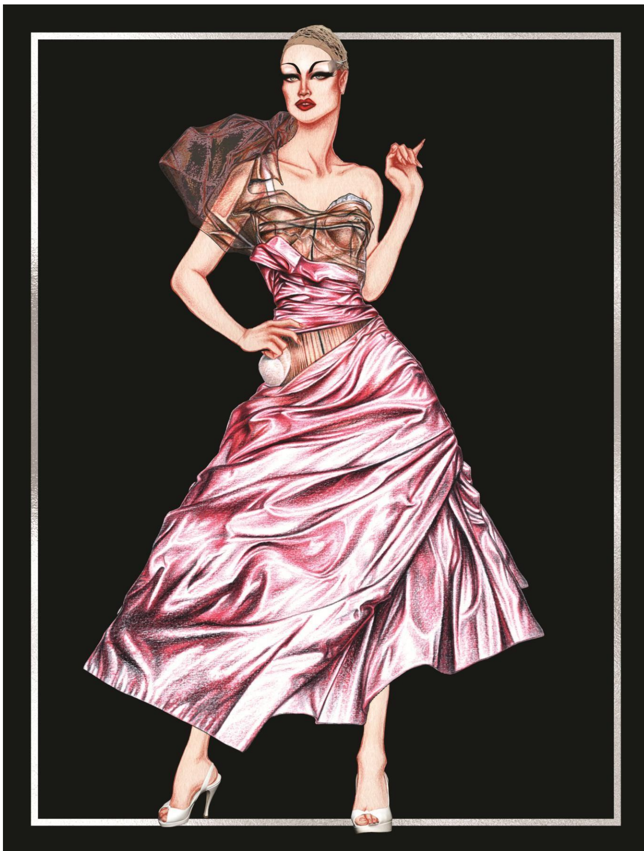
Slika 38. Christian Dior couture kolekcija za jesen 2005. godine