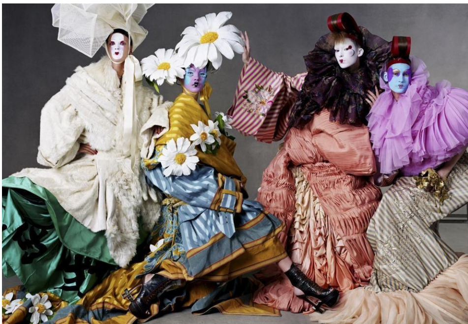
Slika 24. Dior couture kolekcija za proljeće 2003. godine

Etnička tematika nastavlja se u kolekcijama i za Dior i za Galliano. U jesenskoj kolekciji 2002. za John Galliano kolekciju inspiraciju pronalazi u Kineskoj i Eskimskoj ikonografiji s peruanskim i škotskim elementima. (Taylor, 2020: 238). Za Dior je kolekcije Galliano kroz nekoliko idućih sezona predstavio spektakularne prezentacije inspirirane Meksikom, Indijom te osobnim istraživačkim putovanjem u Kinu i Japan, čija je kultura nadahnula proljetnu couture kolekciju 2003. godine. Nakon velikog zakašnjenja, modnu reviju otvaraju kineski akrobati koji su svoj gimnastički performans izvodili tijekom čitave prezentacije dok su modeli na visokim platformama izlazili u teškim predimenzioniranim varijacijama na kimono, s detaljnim ukrašavanjima i vezom. Ovom kolekcijom Galliano nastavlja vlastitu tradiciju izričito nenosivih couture komada koji brišu granice između mode i umjetnosti, dok prêt-à-porter kolekcije sličnu tematiku pokušavaju približiti nosivoj odjeći za klijente.