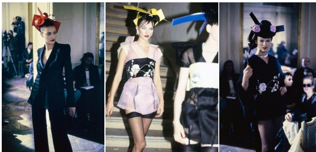
Slike 11., 12. i 13. Prezentacija jesenske kolekcije 1994. godine