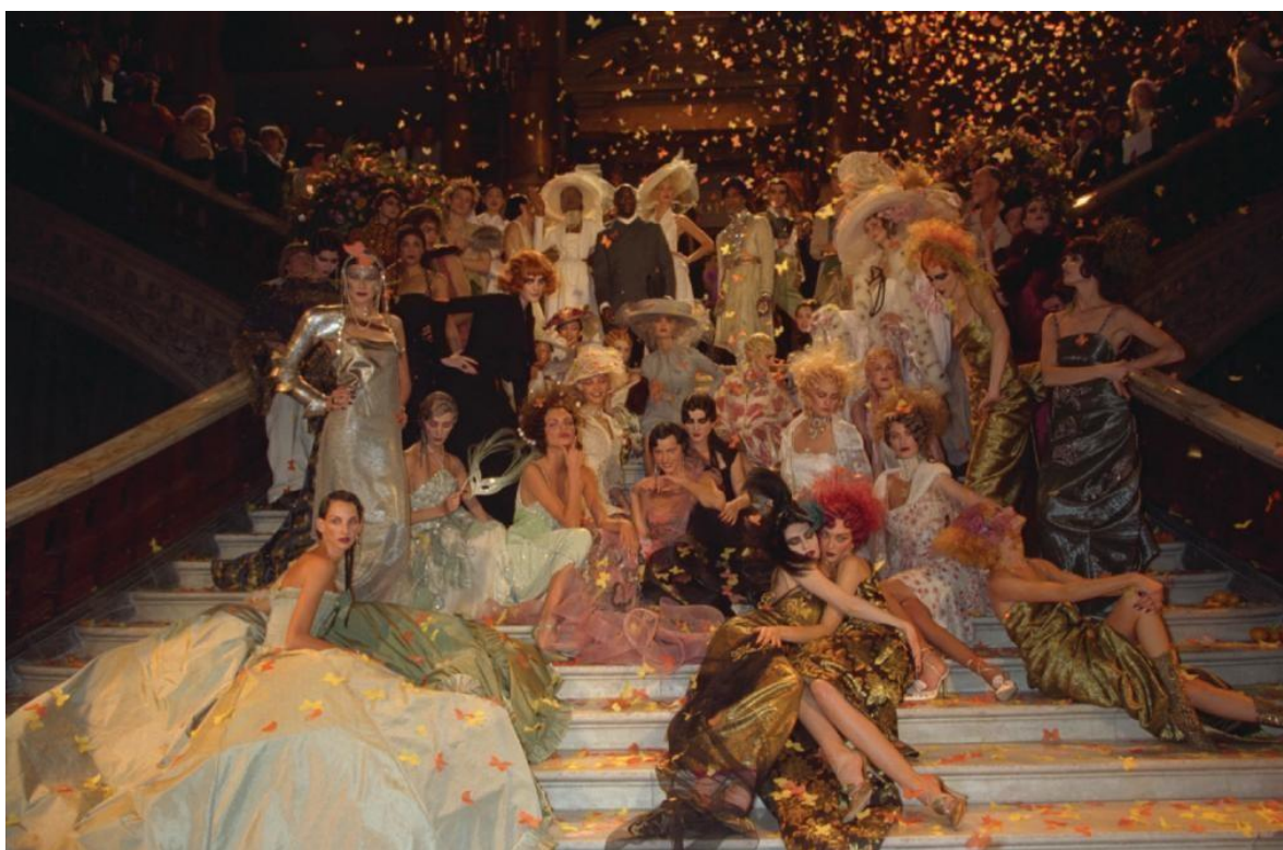
Slika 16. Christian Dior couture kolekcija za proljeće/ljeto 1998. godine

predstavlja njegov osobni kreativni rast od kaotičnih početaka karijere. Kroz iduće kolekcije Galliano konstantno predstavlja kreativne fantazije nadahnete povijesnim heroinama, dalekim kulturama i avanturama ovijenim romantičnim večernjim haljinama i glamurozno ukrašenim komadima prezentiranim kroz pomno razrađene teatralne revije. Jedan od najekstravagantnijih primjeraka je proljetna couture kolekcija iz 1998. godine. Inspiriran raskošnom markizom Mariom Luisom Casati i njenim jednako raskošnim zabavama, Galliano je za reviju organizirao spektakularni bal pod maskama, podijeljen na prolog i šest činova, na koji su modeli pristizali mramornim stubištem uz pomoć oskudnije odjevenih mladića kako bi upotpunili fantaziju. Šest činova je sadržavalo različite tematski povezane komade, od dnevne odjeće inspirirane porculanskim pastirskim figuricama do orijentalnih večernjih komada od baršuna s raskošnim vezom i aplikacijama. Kolekcija je proglašena najsenzacionalnijim modnim događajem u Parizu. (Taylor, 2020: 164)