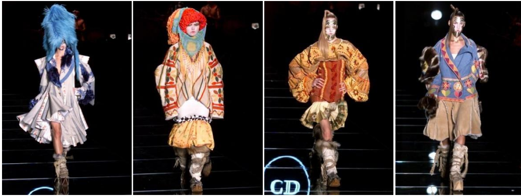
Slike 20., 21., 22. i 23. Dior couture kolekcija za proljeće 2002. godine

Etnička tematika nastavlja se u kolekcijama i za Dior i za Galliano. U jesenskoj kolekciji 2002. za John Galliano kolekciju inspiraciju pronalazi u Kineskoj i Eskimskoj ikonografiji s peruanskim i škotskim elementima. (Taylor, 2020: 238). Za Dior je kolekcije Galliano kroz nekoliko idućih sezona predstavio spektakularne prezentacije inspirirane Meksikom, Indijom te osobnim istraživačkim putovanjem u Kinu i Japan, čija je kultura nadahnula proljetnu couture kolekciju 2003. godine. Nakon velikog zakašnjenja, modnu reviju otvaraju kineski akrobati koji su svoj gimnastički performans izvodili tijekom čitave prezentacije dok su modeli na visokim platformama izlazili u teškim predimenzioniranim varijacijama na kimono, s detaljnim ukrašavanjima i vezom. Ovom kolekcijom Galliano nastavlja vlastitu tradiciju izričito nenosivih couture komada koji brišu granice između mode i umjetnosti, dok prêt-à-porter kolekcije sličnu tematiku pokušavaju približiti nosivoj odjeći za klijente.