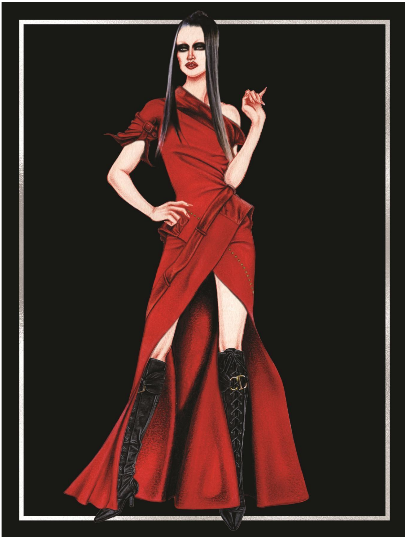
Slika 34. Christian Dior couture kolekcija za jesen 1999. godine