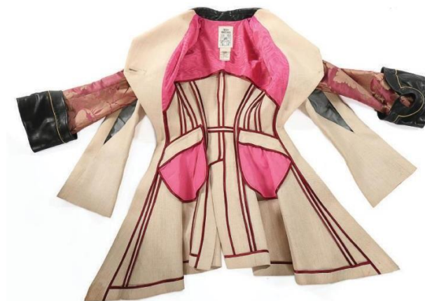
Slika 10. Filibustier kaput od finih materijala sa vidljivim unutarnjim šavovima

U pomoć mu ovoga puta dolazi marokanski dizajner i poduzetnik, Faycal Amor, koji Galliana podiže na noge svojim financijskim doprinosom te mu pruža slobodu eksperimentiranja s kvalitetnim tkaninama i novi prostor za studio. Nakon što je prethodnu sezonu propustio zbog nedostatka financijske potpore, bilo je nužno da njegova iduća kolekcija ostvari uspjeh. Svoju proljetnu kolekciju 1993. godine predstavio je kroz likove glamuroznih pirata, odjevenih u romantične bias cut haljine te jaknama i steznicima bogatih tekstura s elementima različitih povijesnih utjecaja. Evidentna je bila i tada već očekivana vrhunska kvaliteta izrade odjeće od finih materijala, uključujući specifično tkane tkanine sa slamkastim efektom, želatinom prekrivene organze te inovativni spoj između satena i kože korišten za izradu hlača i tradicionalnih kineskih haljina. (Taylor, 2020: 88).