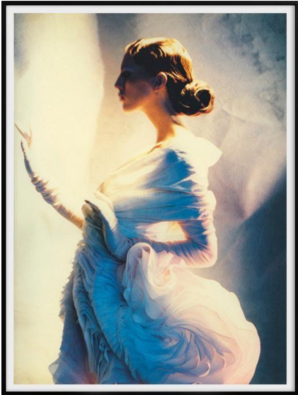
Slika 6. Fotografija Javiera Vallhonrata iz 1988. godine

opstanak biznisa. Nakon prezentacije svoje komercijalno najuspješnije proljetne kolekcije 1988. godine, Galliano prima prestižnu nagradu za dizajnera godine od Britanskog modnog vijeća. No već sljedeće godine dolazi do novih poteškoća kada mediji negativno recenziraju njegove kolekcije, što se odrazilo i u prodaji. Ponovno troškovi skupocjenih materijala i kompleksne produkcije ne odgovaraju prihodima te je Galliano suočen sa strogim restrikcijama koje dodatno narušavaju njegov kreativni izričaj.