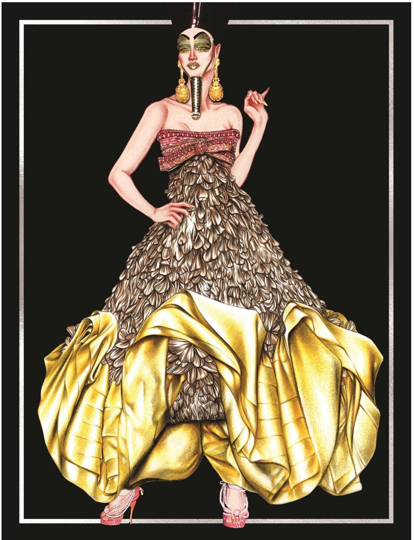
Slika 37. Christian Dior couture kolekcija za proljeće 2004. godine