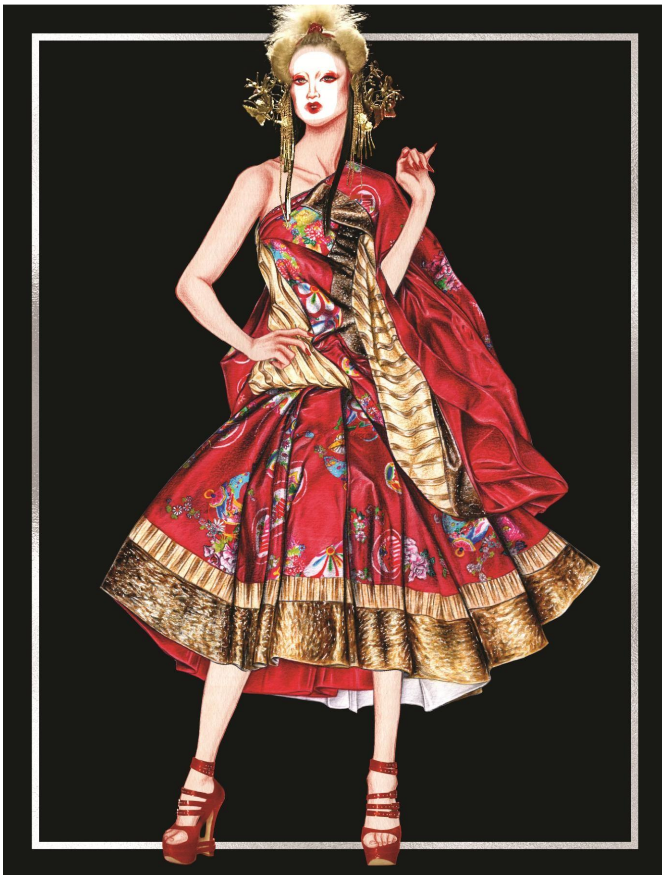
Slika 36. Christian Dior couture kolekcija za proljeće 2003. godine