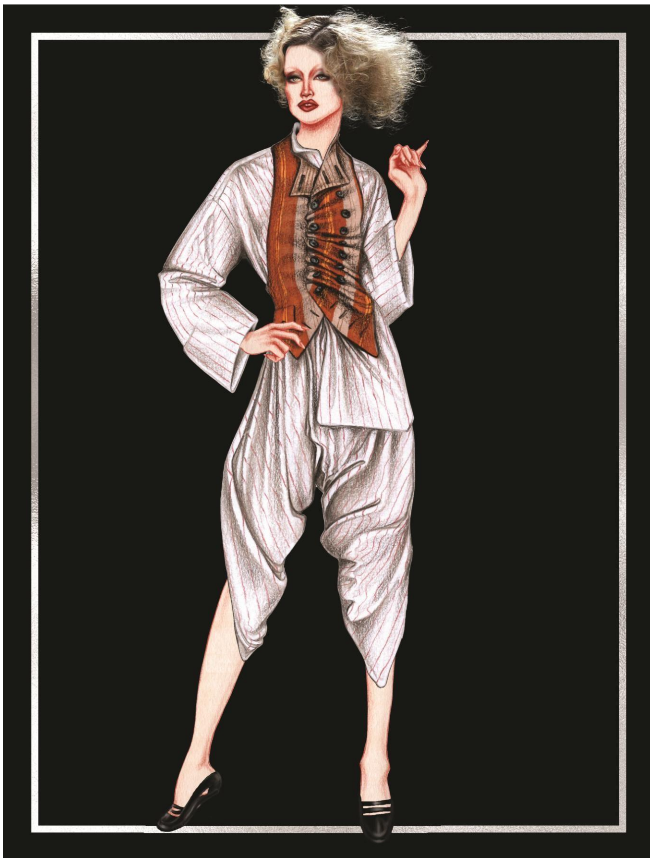
Slika 28. John Galliano ready-to-wear kolekcija za proljeće 1985. godine