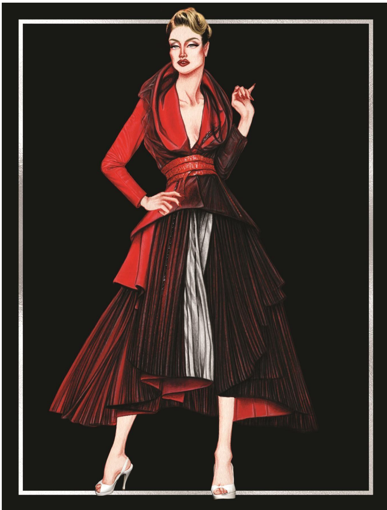
Slika 39. Christian Dior couture kolekcija za proljeće 2011. godine