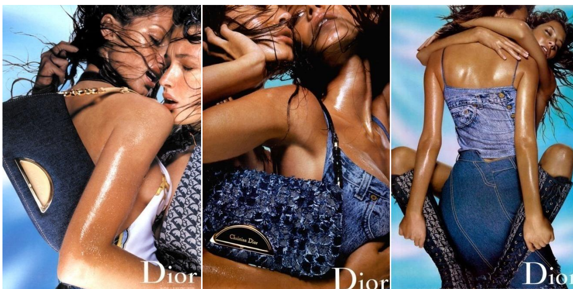
Slike 17., 18. i 19. Reklamna kampanja za proljetnu kolekciju 2000. godine

Svojom posljednjom couture kolekcijom za jesen 1999. godine, Galliano unaprijed postavlja ton za buduće kolekcije novog milenija. Romantiku i sanjivost nadograđuje snažnijim i seksepilnim siluetama, modernijega izgleda prikladnijeg za novu eru. Već prvom proljetnom kolekcijom za Dior 2000. godine postavlja jedan od ključnih trendova koji će trajno obilježiti dvije tisućite godine u modi, a to je logomanija. Od odjeće do modnih dodataka, Diorov klasični CD logo bio je glavni motiv koji se provukao čitavom kolekcijom. Te iste sezone po prvi put predstavlja slavnu Dior Saddle torbicu u obliku sedla, koja je i danas popularan komad među obožavateljima mode. Galliano evidentno odstupa od svoje prijašnje estetike koju modni kritičari sada opisuju kao vulgarnu i neprimjerenu, ali koja u isto vrijeme privlači nove, mlađe klijente kojima odgovaraju provokativni nosivi komadi. Nova se estetika također očituje u reklamnim kampanjama koje za modnu kuću fotografira Nick Knight.