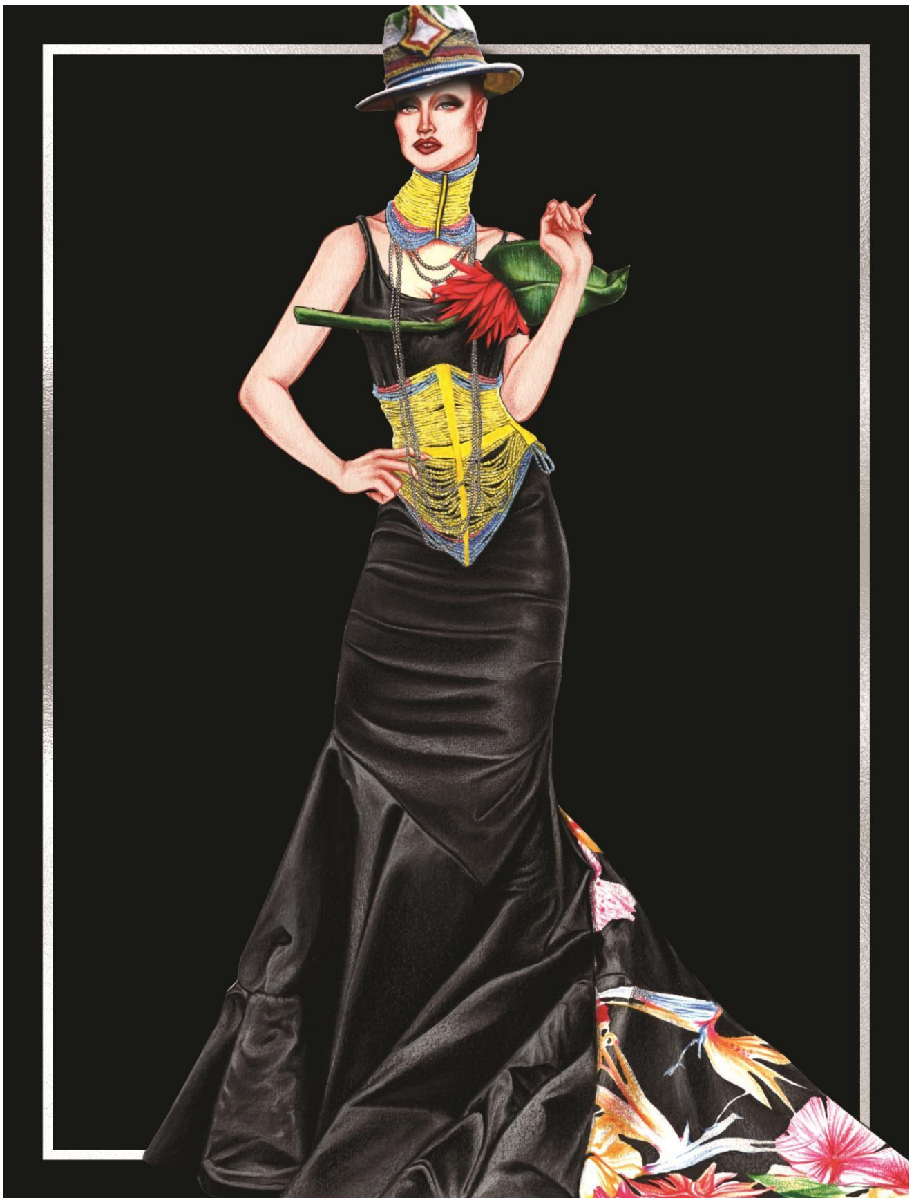
Slika 32. Christian Dior couture kolekcija za proljeće 1997. godine