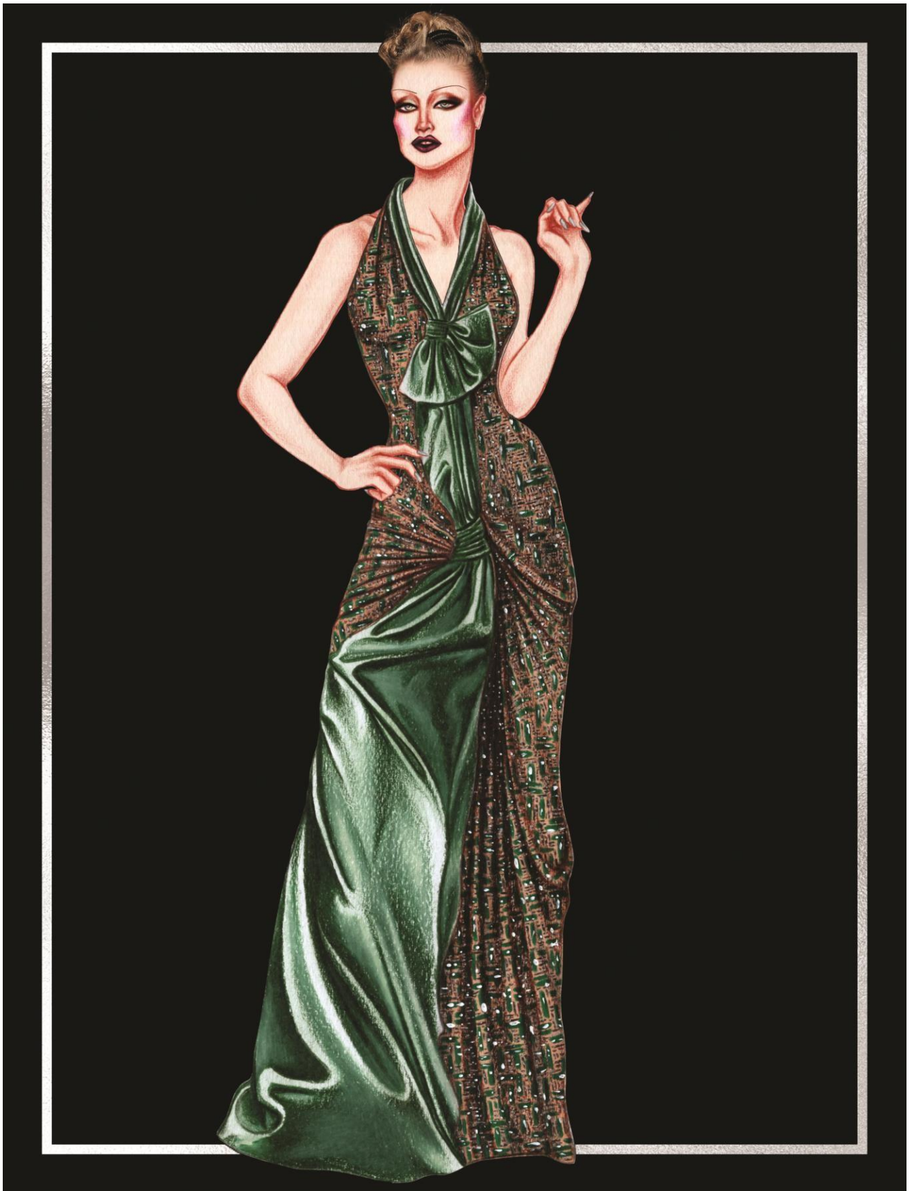
Slika 40. John Galliano ready-to-wear kolekcija za jesen 2011. godine