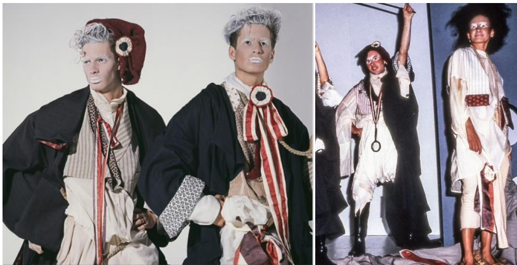
Slike 4. i 5. Kolekcija Les Incroyables , 1984

prema pariškoj supkulturi modno osviještene pariške aristokratske mladeži iz osamnaestog stoljeća. Naziv Incroyables dolazi od francuske riječi koja u prijevodu znači nevjerojatni te se odnosi na mladiće, dok su žene nazivali Merveilleuses što znači čudesne. Takvi nazivi odnosili su se na njihov ekstravagantan i luksuzan stil odijevanja prema kojemu su se isticali u znaku protesta Jakobinskoj diktaturi. Od njih Galliano preuzima nekoliko elemenata odijevanja za svoju debitantsku kolekciju, uključujući jarko obojene prsluke, prozirne košulje boje bjelokosti rezane u jednostavnom T-obliku iz osamnaestog stoljeća s produženim rukavima i prenatlaženim manšetama te raznovrsne modne dodatke uključujući oglavlja i vrpce povezane oko vrata. (Taylor, 2020: 15) Njegov se izbor inspiracije također može razumjeti kao odgovor na rad suvremenih dizajnera, koji su tada većinski bili fokusirani na jednostavnost forme i elegantne siluete. Osim elemenata povijesnog kostima, Galliano inspiraciju također prolazi u Japanskoj kulturi iz koje posuđuje oblik kimona za predimenzionirane kapute izrađene od jeftinijih materijala poput vune. Unatoč tome što naziv kolekcije predlaže da se radi o muškoj modi, odjeća je predstavljena kao unisex te su reviju nosili i muški i ženski modeli.