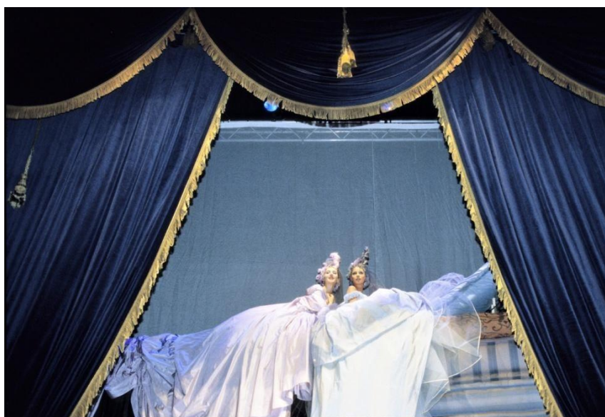
Slika 14. Givenchy couture 1996. godine

Idući veliki korak u karijeri nastupio je već 1995. godine kada je Galliano proglašen kao zamjenik Huberta de Givenchyja kao kreativni direktor poznate modne kuće Givenchy. Na svojoj je novoj poziciji Galliano morao kreirati dvije sezonske kolekcije, dvije međusezonske te dvije couture kolekcije za Givenchy, što je označilo njegov prvi pothvat u službenom couture ateljeu. Zbog tradicionalne hijerarhije i načina na koji utvrđeni couture ateljei funkcioniraju, Galliano se nije uspijevaio uklopiti među Givenchyjev postojeći tim sa svojim radikalnim idejama i načinima. Svoju prvu couture kolekciju za Givenchy predstavio je za proljeće/ljeto 1996. godine. Presentaciju je započeo s dva modela postavljena na masivnu hrpu madraca, odjevenih u suknje od tafete sa šlepom od pet metara koji se prostirao niz madrace. Tema kolekcije bila je bajka "Princeza na zrnju graška" te je prva sekcija velikih viktorijanskih haljina svojim izgledom podsjećala na prethodnu kolekciju "Princess Lucretia". Kasnije sekcije sadržavale su jednostavnije siluete inspirirane modom prve polovice dvadesetog stoljeća ukrašene volanima i cvjetnim motivima, jarko obojene haljine silueta pedesetih godina te nekoliko indijskih haljina sari . (Taylor, 2020: 122) Recenzije za kolekciju bile su pomiješane, ali je Galliano uspio ostvariti uspjeh i za sebe i za Givenchy.