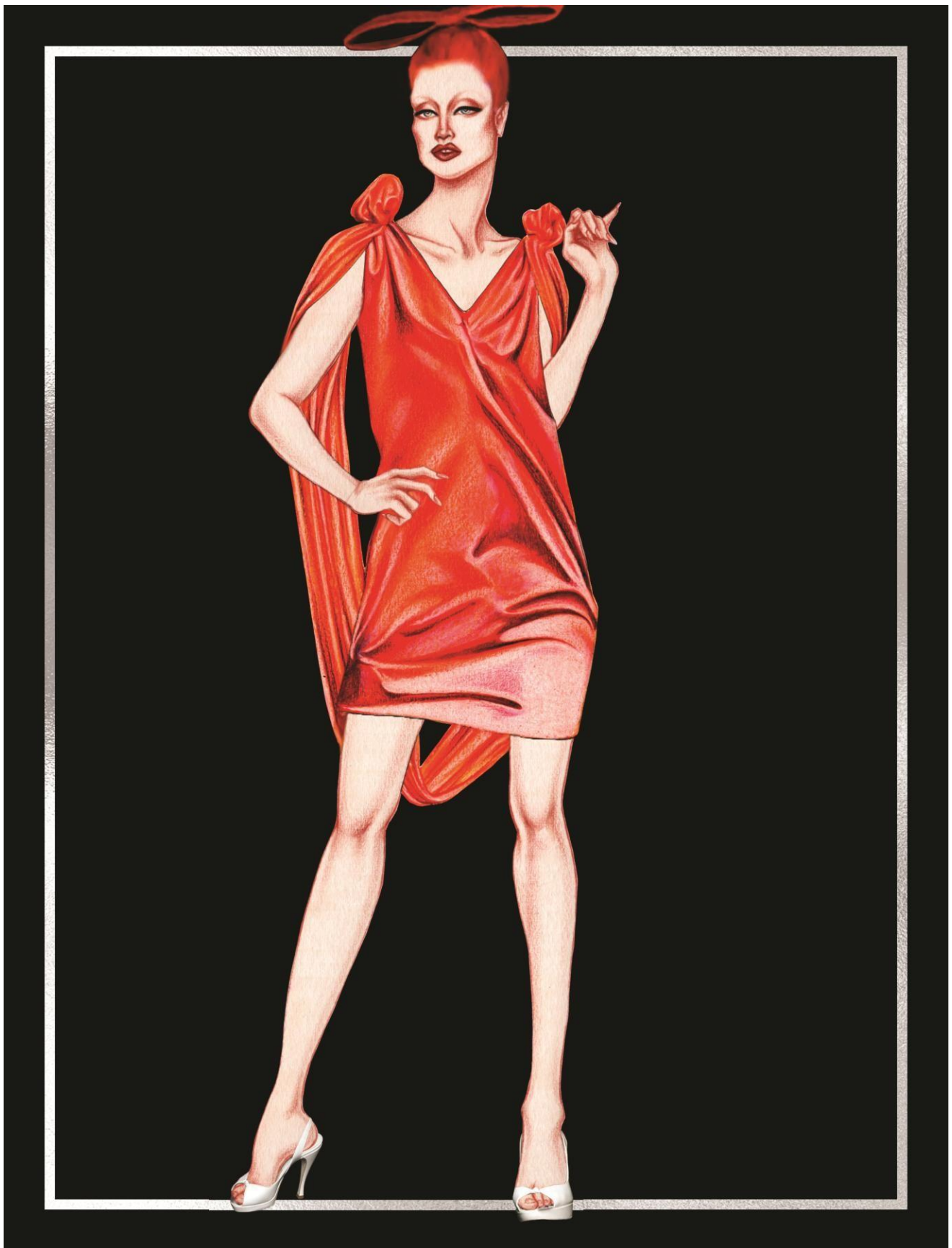
Slika 31. Givenchy couture kolekcija za proljeće 1996. godine