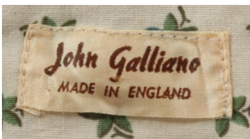
Slika 2. etiketa iz kolekcije Les Incroyables

Osamdesete godine dvadesetog stoljeća predstavljaju početak i najranije faze stvaralaštva Johna Galliana. Prema savjetu profesora na sveučilištu Galliano svoje modne ilustracije realizira u gotovi proizvod te u lipnju 1984. godine predstavlja svoj završni rad, ujedno i svoju prvu modnu kolekciju. Kolekcija je prezentirana u sklopu modne revije s ostalim studentima na St Martins-u, na ukupno tri prikazivanja tijekom dana za ostale studente, poznanike i važne kontakte u industriji. Nakon prvog prikazivanja njegova je kolekcija premještena na posljednje mjesto koje je generalno bilo rezervirano za najbolju prezentaciju. Uz mnogobrojne pohvale i aplauz, Gallianova je kolekcija zadobila pažnju poznate vlasnice uspješnog Londonskog butika Browns , Joan Burstein. Ona je prva pružila potporu njegovim kreacijama te ih već nekoliko dana nakon prezentacije smjestila u sami izlog butika, gdje su zalihe brzo ponestale te je nespremni Galliano iz vlastitog doma morao pokrenuti proizvodnju uz pomoć obitelji i prijatelja koji su mu neumorno pružali pomoć i podršku.