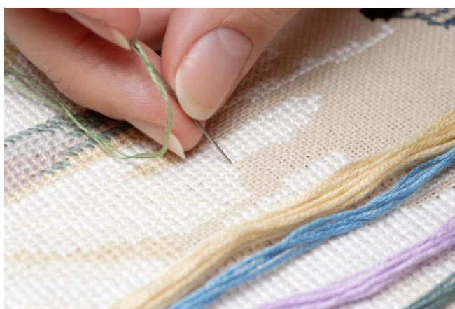
SL 5. Izvedba križnog veza [8]