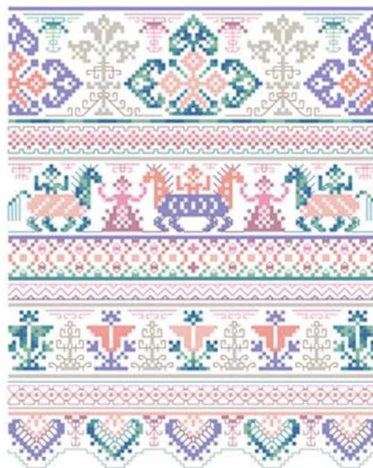
SL 7. Ruski vez srednje Rusije