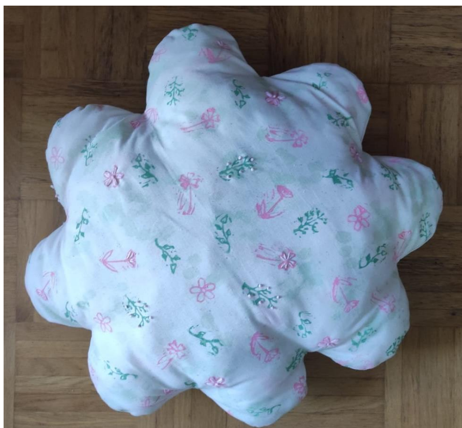
SL 39. Završni izgled jastuka broj 3