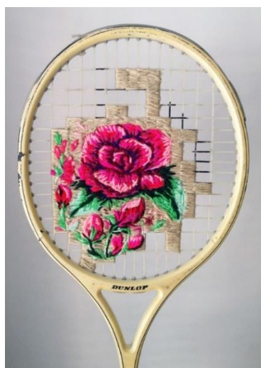
SL 14. Primjer rada Danielle Clough

Teresa Lim inspiraciju za svoje radove pronalazi svuda oko sebe. Dok putuje, umjesto da fotografira znamenitosti i prirodne ljepote koje posjeti, ona ih veze na malena platna, te dodaje svojoj kolekciji radova pod nazivom „Sew Wanderlust“. Od gradskih parkova i znamenitih građevina, do prirodnih proplanaka i krajolika, ova umjetnica svaki detalj svojih uspomena uspije dočarati kroz raznobojne minijature na svojim platnima.