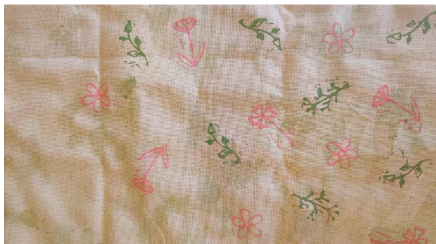
SL 27. Tisak na tkaninu broj 3