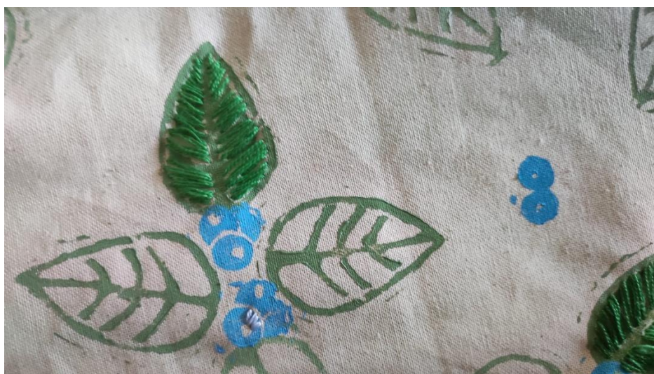
SL 28. Ručni vez na tkanini broj 1

Tehnika ručnog veza u ovom je radu korištena za postizanja efekta trodimenzionalnosti dajući tako radu taktilnu notu. Također je poslužila za isticanje i naglašavanje nekih dijelova da bi se razbila monotonija ponavljanja motiva. Nakon što se boja za tisak osušila tkanina je spremna za intervenciju koncem, što je ujedno i posljednja obrada tkanine u svrhu stvaranja dizajna. Za ovu je priliku bilo potrebno koristiti deblji konac kako bi se na tkanini većeg formata mogao istaknuti. Važno je obratiti pažnju na početku i kraju vezenja da se rubovi dobro pričvrste kako se kasnije ne bi parali, te tokom vezenja treba paziti na stvaranje petlji i čvorova koji ako se ne uoče na vrijeme, mogu stvoriti problem. Konci su također birani prema ranije određenoj paleti te su odgovarali i bili u skladu sa svakom od tkanina.