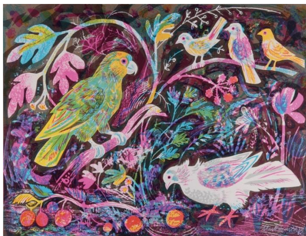
SL 13. Primjer rada Marka Hearalda