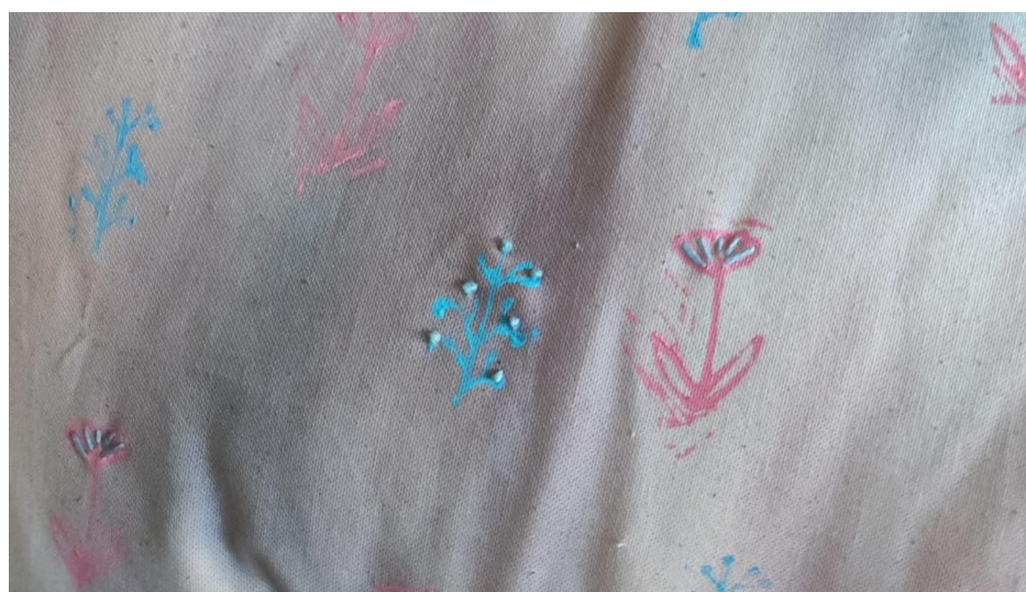
SL 29. Ručni vez na tkanini broj 2