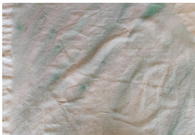
SL 21. Obojana tkanina broj 1

Kao boja za ručni tisak korištena je bijela akrilna boja, pogodna za tehniku, u kombinaciji s tekućim bojilima za bojadisanje tekstila. Ovom kombinacijom dobiva se kremasta smjesa blagih tonova koje određuje količina kapi dodanih u akrilnu boju. Smjesa je lako razmaziva, pogodna za nanošenje na linoleumsku pločicu, te ostavlja jednoličan i zasićen trag na tkanini. Za bojanje tkanine simulacijom tehnike akvarela korištene su tekuće boje za bojadisanje tekstila razrijeđene sa odgovarajućom količinom vode kako bi se smanjio njihov intenzitet.