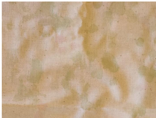
SL 23. Obojena tkanina broj 3