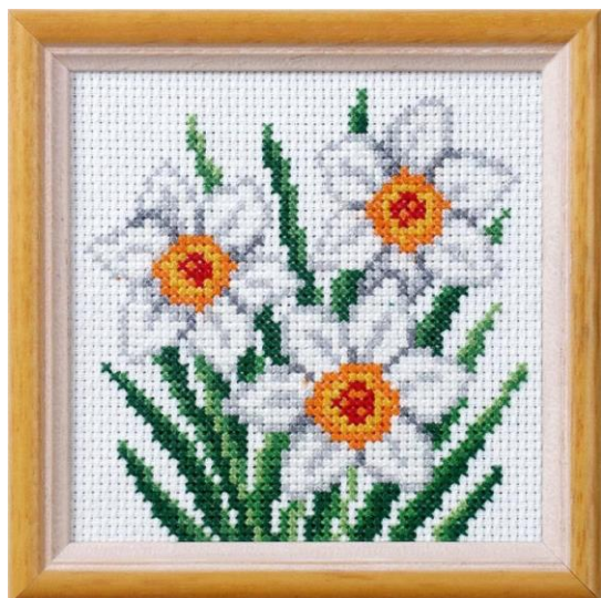
SL 4. Slika izvezena u križnom vezu

unatrag. Pri izvedbi prve opcije šavovi su napravljeni od gornjeg lijevog kuta prema donjem desnom, te je potrebno dalje ponavljati ubode u istom smjeru. Ova tehnika je zbog svoje lakoće prikladna za početnike prije savladavanja težih tehnika vezenja [11]. Danas se vesti može ne samo ručno, već i uz pomoć strojeva. Do napretka je također došlo i u likovnom oblikovanju veza. Sve se više koriste ornamenti i unaprijed dizajnirani crteži.