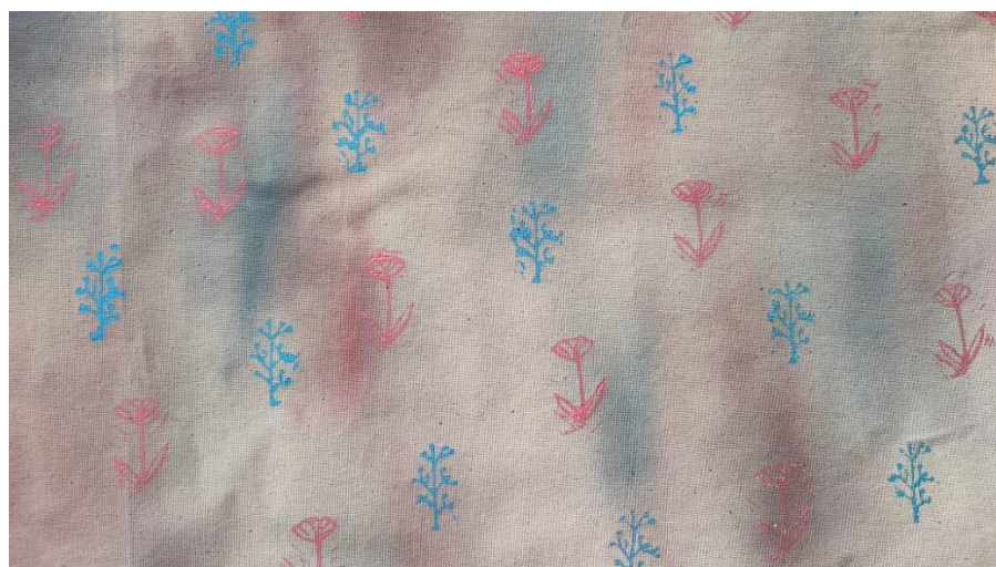
SL 26. Tisak na tkaninu broj 2