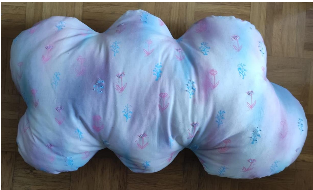
SL 38. Završni izgled jastuka broj 2