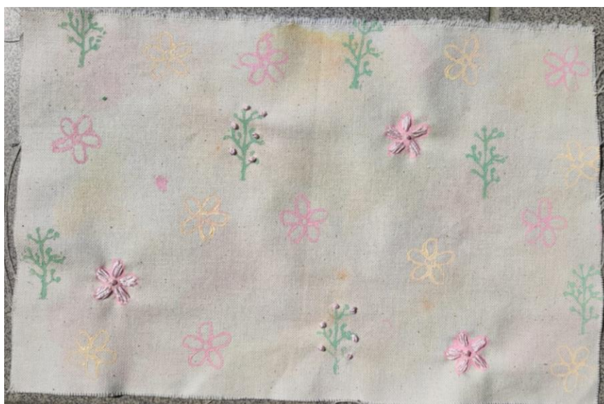
SL 31. Rad za analizu broj 1