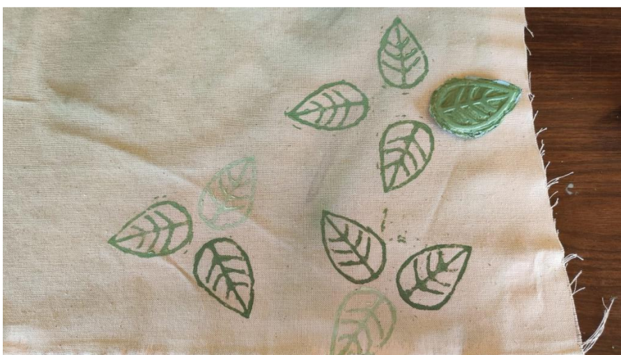
24. Početak tiska na tkaninu broj 1 i primjer šablone

Nakon bojanja tkanine uslijedio je ručni tisak izveden pomoću ranije pripremljenih šablona. Potrebno je voditi računa o gustoći smjese za tisak te o čistoći šablona pošto se uslijed korištenja mogu javiti nepravilnosti izazvane smjesom koja je na šabloni ostala od ranije uporabe, tako da je šablone potrebno po potrebi ispirati. Ukoliko se vrši tisak više različitih šablona ili boja na istu tkaninu tada je potrebno šablone otiskivati jednu za drugom uz dovoljan vremenski razmak da se nanescena boja stigne osušiti.