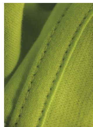
SL 20. Jersey