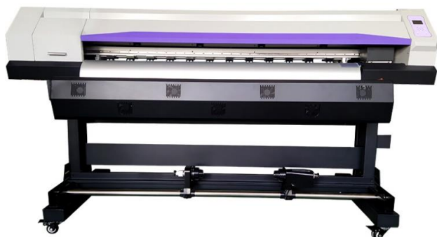
SL 8. Suvremeni digitalni InkJet pisač za primjenu na tekstil