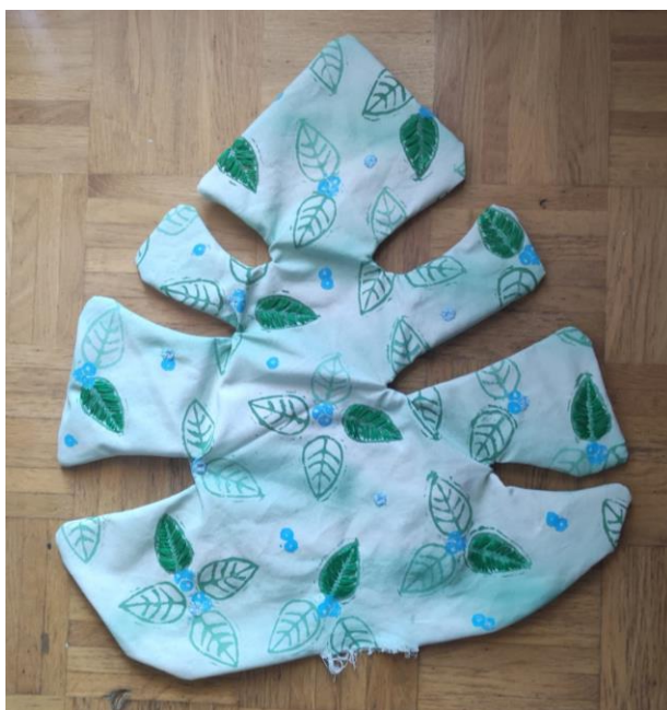
SL 36. Primjer jastučnice prije punjenja

koji je ranije ostavljen potrebno je ručno zašiti uz što veću opreznost kako se taj dio ruba jastuka ne bi kasnije isticao. Time je završen praktični dio izrade ukrasnih jastuka.