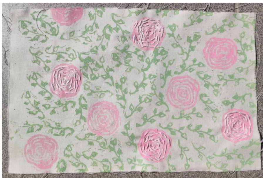
SL 32.Rad za analizu broj 2