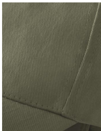
SL 19. Pamučni keper