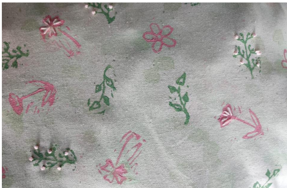
SL 30. Ručni vez na tkanini broj 3