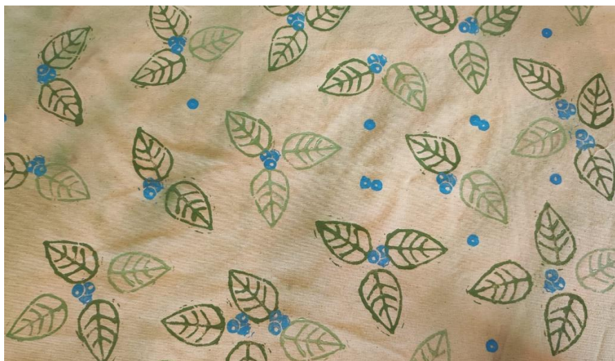
SL 25. Tisak na tkaninu broj 1