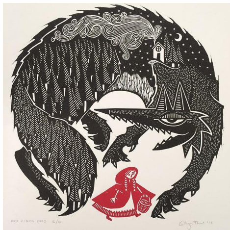
SL 12. Primjer rada Kat Flin