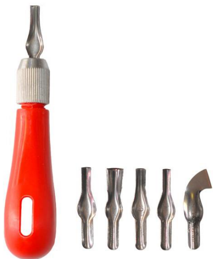
SL 2. Alati za urezivanje u ploču

Picasso, Henri Matisse, Walter Inglis Anderson, Georg Baselitz, Maurits Cornelis Escher, Jakiv Jakovič Hnizdovskij i drugi.