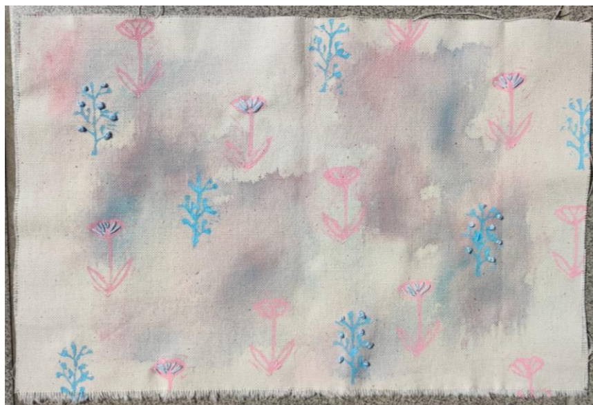
SL 34. Rad za analizu broj 4

Unikatni tekstil, jedan od idejnih rješenja dizajna za ukrasne jastuke. Pri izradi su korištene tehnike akvarela (bojanja tekstila bojilima za tekstil, ali bez upotrebe kemijskih ili termičkih obrada nego isključivo nanošenjem kistom), ručni tisak sa originalnim šablonama i ručni vez. Format rada je kružan. Na radu se ponavljaju stilizirani motivi lista i bobica, stvara se prizor nalik grmu borovnice. Rad je figurativan jer prikazuje motive koji nas okružuju u svakodnevnom životu. Kompozicija rada je slobodna, raspored motiva je nepravilan, bez repeticije, ali takav da je „ugodan oku“ i daje osjećaj ravnoteže i sklada. Možemo reći da ima ponavljajući ritam, kompozicija je otvorena i ne ograničavaju ju rubovi tkanine. Linije koje čine obrisne linije motiva su pune, zakrivljene, nepravilnih oblika, umjerene debljine. Na radu se mogu vidjeti dvije boje, zelena i plava. Na radu se pojavljuje modelacija zelenih tonova, više nijansi zelene koje se razlikuju po svjetlini tako što svaka ima različiti udio čistog zelenog tona i bijele boje. Plavi je ton konzistentan, zasićen i intenzivan. Pošto je prividno hladniji od zelenih tonova različitog intenziteta, stvara se kontrast i plavi se tonovi ističu. Prostor na ovom radu nije dočaran budući je i sama tkanina obojena zelenim tonovima te se otisnuti motivi posebno ne ističu. Jedina promjena događa se na motivima na kojima je izvršena dorada ručnim vezom te je stvoren efekt trodimenzionalnosti.