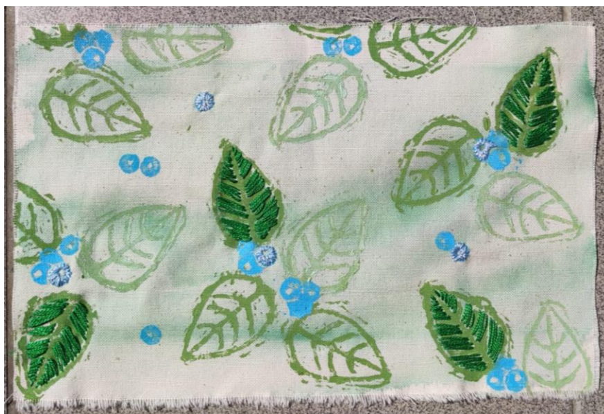
SL 33. Rad za analizu broj 3

Unikatni tekstil, jedan od idejnih rješenja dizajna za ukrasne jastuke. Pri izradi su korištene tehnike ručnog tiska s originalnim šablonama i tehnike ručnog veza. Format rada je horizontalan. Na radu se ponavljaju stilizirani motivi cvijeta ruže u jednoj boji i lišća u drugoj boji, a podsjećaju na ružu penjačicu koja je u toj mjeri raširena i rascvjetana da može prekriti cijeli zid. Kompozicija rada je slobodna, raspored motiva je neodređen, bez pravila u ponavljanju, ali takav da je „ugodan oku“ i daje osjećaj ravnoteže i sklada. Stvoren je dojam slobodne razigranosti elemenata. Možemo reći da ima ritam, kompozicija je otvorena i ne ograničavaju ju rubovi tkanine što je postignuto otiskivanjem elemenata polovično na rubovima materijala. Linije koje čine obrise linije motiva su pune, zakrivljene, nepravilnih oblika, umjerene debljine. Na radu se mogu vidjeti dvije boje, zelena i „svijetlo ružičasta“. Sličnog su intenziteta, „svijetlo ružičasta“ je nešto svjetlija, ali u pravilu niti jedna ne iskače već stvaraju jedan pomalo monotoni sklad bez stvaranja privida volumena ili prostora. Kontrast je komplementaran s obzirom da je „svijetlo ružičasta“ zapravo dobivena miješanjem crvene i bijele boje, a u Ostwaldovom krugu crvena i zelena se nalaze na suprotnim stranama što ih čini komplementarnima. Površina materijala je na dijelovima ukrašenim ručnim vezom izbočena te iz tog razloga materijal nije u potpunosti gladak i postignut je dojam trodimenzionalnosti motiva.