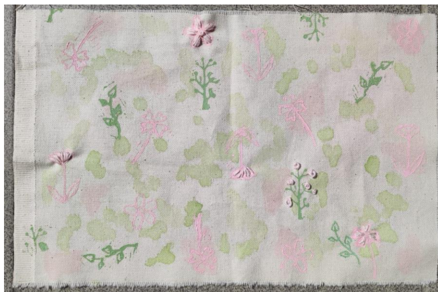
SL 35. Rad za analizu broj 5

obrada nego isključivo nanošenjem kistom), ručni tisak sa originalnim šablonama i ručni vez. Format rada je horizontalan. Na radu se ponavljaju motivi dva različita cvijeta, jednoga u cvatu i drugoga punog pupoljaka. Rad je figurativan jer prikazuje motive koji nas okružuju u svakodnevnom životu. Kompozicija rada je dijagonalna, raspored motiva je slobodan bez pravila u ponavljanju, ali takav da daje osjećaj ravnoteže i sklada. Možemo reći da ima ritam, kompozicija je otvorena i ne ograničavaju ju rubovi tkanine što je postignuto otiskivanjem elemenata polovično na rubovima materijala. Linije koje čine obrisne linije motiva su pune, zakrivljene, nepravilnih oblika, umjerene debljine. Na radu se mogu vidjeti tri boje, plava i „svijetlo ružičasta“ se ističu jer su korištene za otiskivanje šablona, a ljubičasta se može vidjeti na platnu gdje je nastala prilikom bojanja platna bojilima plave i crvene boje. Plava i „svijetlo ružičasta“ nisu pretjerano zasićene, te su svjetlijeg tona. Stvaraju kontrast toplo-hladno budući „svijetlo ružičasta“ dolazi od crvene pomiješane s velikom količinom bijele. Prostor i dubina na ovom radu nisu dočarani budući su boje sličnih intenziteta pa nema odskakanja koja bi činila jednu prividno bližom ili daljom od druge. Jedina promjena dešava se na motivima na kojima je izvršena dorada ručnim vezom i stvoren efekt trodimenzionalnosti.