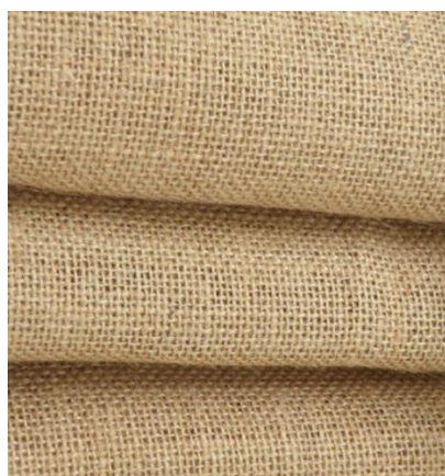
SL 18. Laneno platno

Jersey (pleteni pamučni tekstil) - fino, mekano i rastezljivo pletivo. Idealno je za ručni vez i tisak. Često se koristi u odjevnoj industriji ili kućnom tekstilu za posteljine.