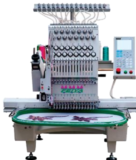
SL 9. Stroj za strojni vez