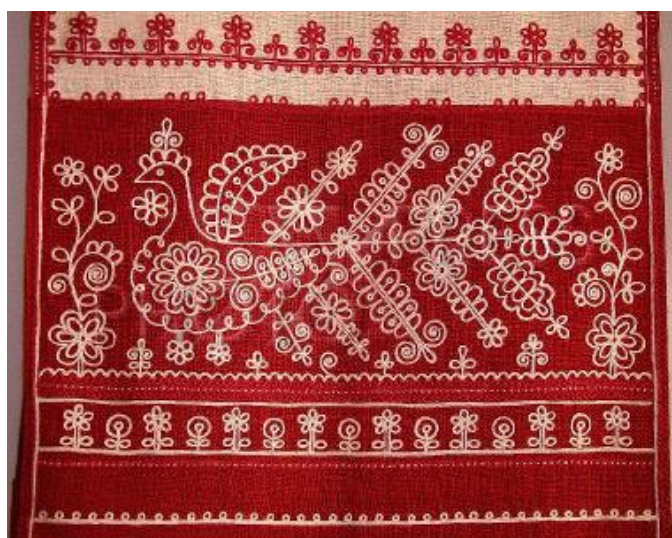
SL 6. Ruski vez sjeverne Rusije

srebrne i zlatne niti. Ruski vez bio je vrlo podložan utjecaju ručnog rada iz Bizanta tako da je nužno dolazilo do preplitanja stilova. Vez u Rusiji je povezan s tradicijom ruskog naroda te stoga ima posebno mjesto u ruskoj baštini. To se posebno odnosi na ruski križ. Svaki uzorak na tekstilu imao je posebno značenje, krug je primjerice značio sunce, a kukasti križ označavao je želju za dobrim. Dvije su skupine veza, vez srednje Rusije i sjevernog dijela Rusije, a razlikuju se po svojim karakteristikama. Vezovi srednje Rusije prepoznatljiviji su po svojoj svjetlini, mnoštvu boja i uzoraka, dok su vezovi sjevernog dijela Rusije izrađeni najčešće crvenim nitima na bijeloj tkanini.