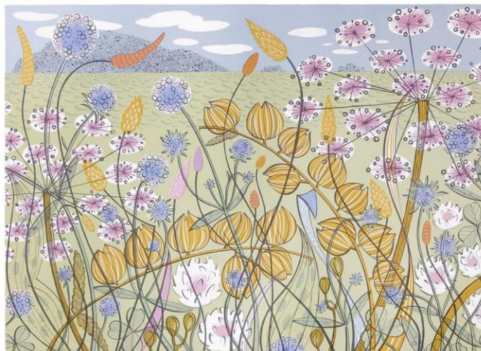
SL 11. Primjer rada Angie Lewin naslova Machair

Kat Flin razlikuje se od ostalih umjetnika linorezom kako izborom motiva, tako i izborom boja. U svojim radovima koristi uglavnom crnu, uz mogućnost dodavanja još jedne boje. Njeni motivi crpe inspiraciju iz svakodnevnih simbola i pojava koje dočarava pomoću debelih, naglašenih linija dajući im tako snažan karakter i izražajnost. Često prikazuju ljude u svakodnevnim situacijama ili ilustracije prikladne za slikovnice poput one dolje priložene inspirirane bajkom Crvenkapica.