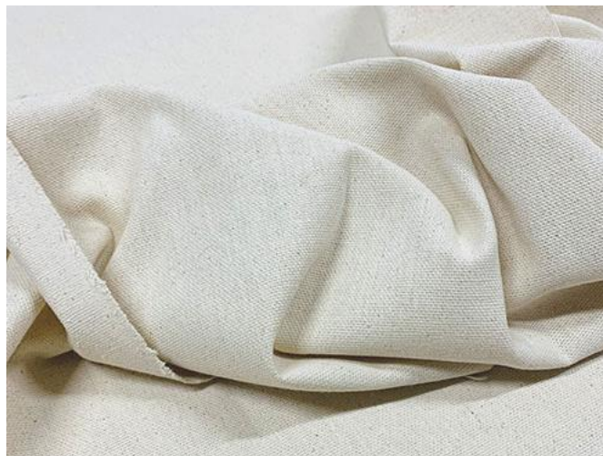
SL 17. Pamučno platno u panama vezu

Ostale tkanine pogodne za ručni tisak i ručni vez: