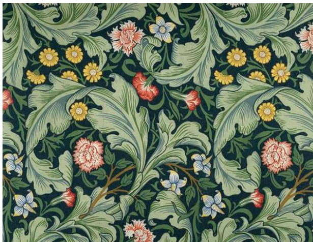
SL 1. William Morris, "Leicester Wallpaper"