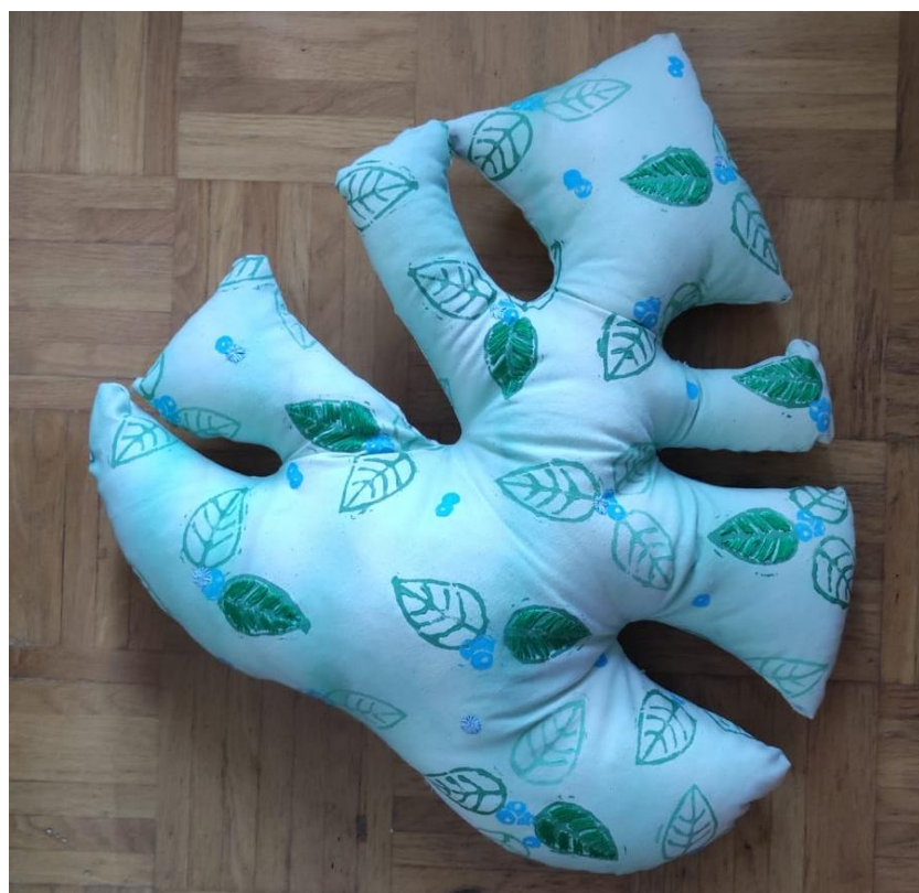
SL 37. Završni izgled jastuka broj 1