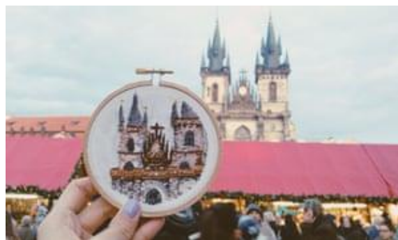
SL 16. Primjer rada Terese Lim