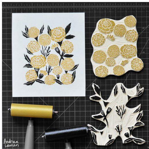
SL 10. Primjer rada Andree Lauren

Angie Lewin engleska je umjetnica koja se u svojim radovima koristi raznim tehnikama među kojima su linorez, akvarel, sitotisak i drvorez. Kombiniranje navedenih tehnika čini njene radove jedinstvenim i prepoznatljivim među ostalim umjetnicima dok su njeni motivi u skladu s predvodnicima tehnike linoreza. Inspiraciju crpi iz prirode koja ju okružuje, posebice proplanaka i livada, s posebnim naglaskom na detalje raznolikog biljnog svijeta koji u njima obitava.