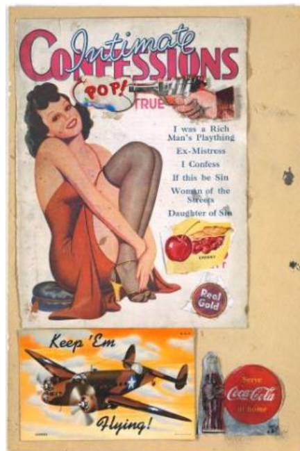
Slika 1. Eduardo Paolozzi

Na prvom sastanku Independent Group 1952. godine, član suosnivač, umjetnik i kipar Eduardo Paolozzi održao je predavanje koristeći seriju kolaža pod naslovom Bunk! koje je okupio tijekom svog boravka u Parizu između 1947.-1949. Taj se materijal sastojao od 'pronađenih predmeta' kao što su reklame, likovi iz stripova, naslovnice časopisa i razne masovno proizvedene grafike koje su uglavnom predstavljale američku popularnu kulturu. Jedna od slika u toj prezentaciji bio je Paolozzijevo kolaž iz 1947., I was a Rich Man's Plaything , koji uključuje prvu upotrebu riječi "pop", koja se pojavljuje u oblaku dima koji izlazi iz revolvera. 9