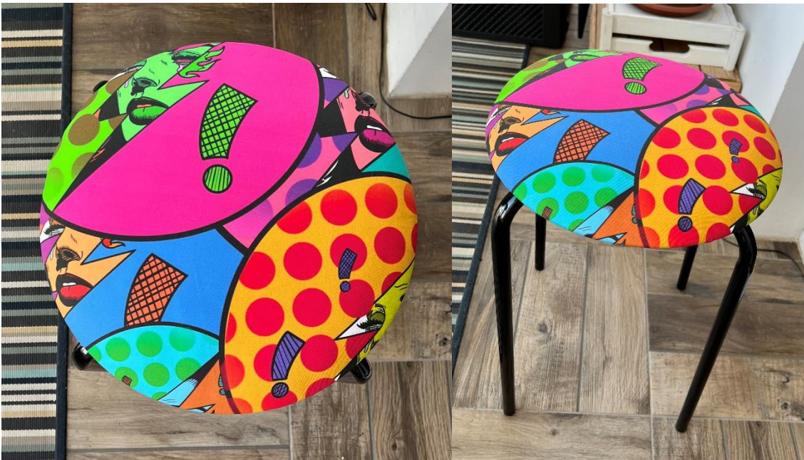
Slika 13. likovno rješenje rada „Energična Transformacija“