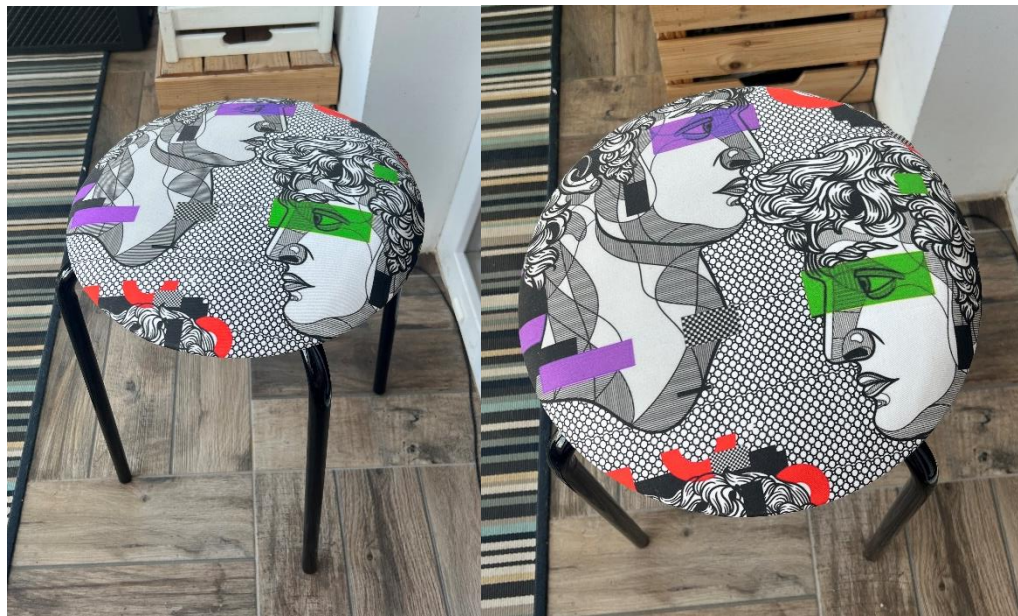
Slika 11. likovno rješenje rada „Dvostruka Glava“

U ovom dijelu, predstaviti ćemo krajnje proizvode koji su rezultat primjene tekstilnih uzoraka inspiriranih pop artom. Ovdje ćemo istaknuti krajnji rezultat te kako su se uzorci uspješno uklopili u odabran proizvod.