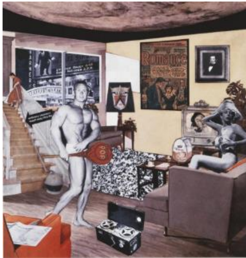
Slika 7. "What is it that makes today's homes so different, so appealing?"

jednim od pionira u korištenju kolaborativnih i multimedijalnih pristupa umjetnosti. Najpoznatije djelo Richarda Hamiltona je "What is it that makes today's homes so different, so appealing?" ("Što čini današnje domove tako različitim, tako privlačnim?"), koje je nastalo 1956. godine. Ova kolaborativna kolažna slika predstavlja vizualnu kritiku konzumerističkog društva, s prikazom različitih predmeta, reklama i likova koji simboliziraju sveprisutnost konzumerizma i medijske manipulacije.