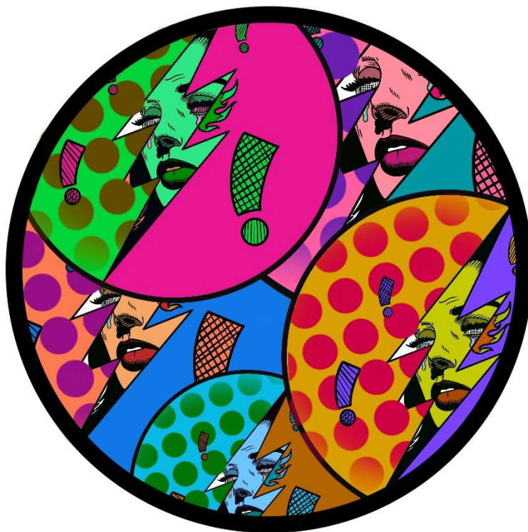
Slika 8. „Energična Transformacija“