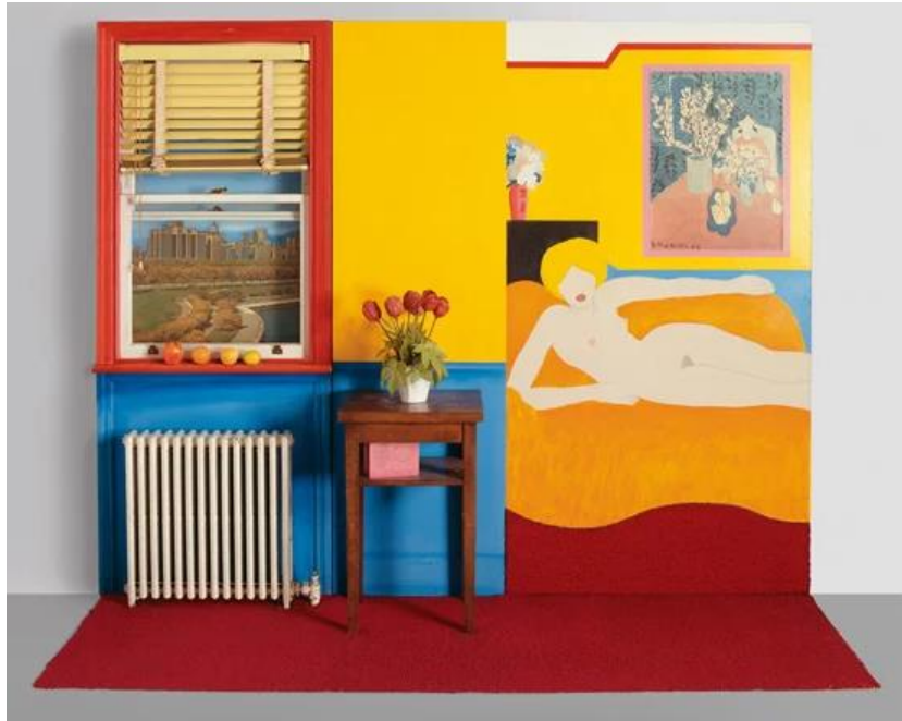
Slika 4. "Great American Nude"

kombinaciji s objektima kao što su voće, telefoni ili reklamne poruke. Wesselmann je koristio oštre linije, ravne boje i izražajne konture kako bi stvorio svoje prepoznatljive kompozicije. 18 Tom Wesselmann je svojim radom i inovativnim pristupom stvorio svojevrsni stil unutar pop arta. Njegova umjetnost ističe se po upotrebi svijetlih boja, ikoničkih motiva iz popularne kulture te kombinaciji apstraktne i figurativne stilizacije. Njegovi radovi su izloženi u mnogim galerijama i muzejima diljem svijeta, a njegovo naslijeđe i utjecaj na pop art ostaju značajni i danas.