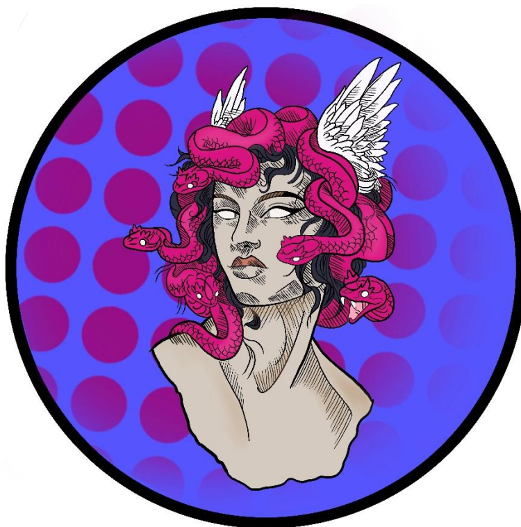
Slika 9. „Nadrealno“