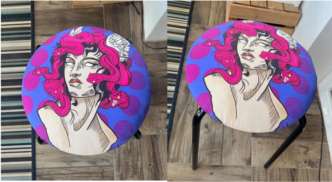
Slika 12. likovno rješenje rada „Nadrealno“