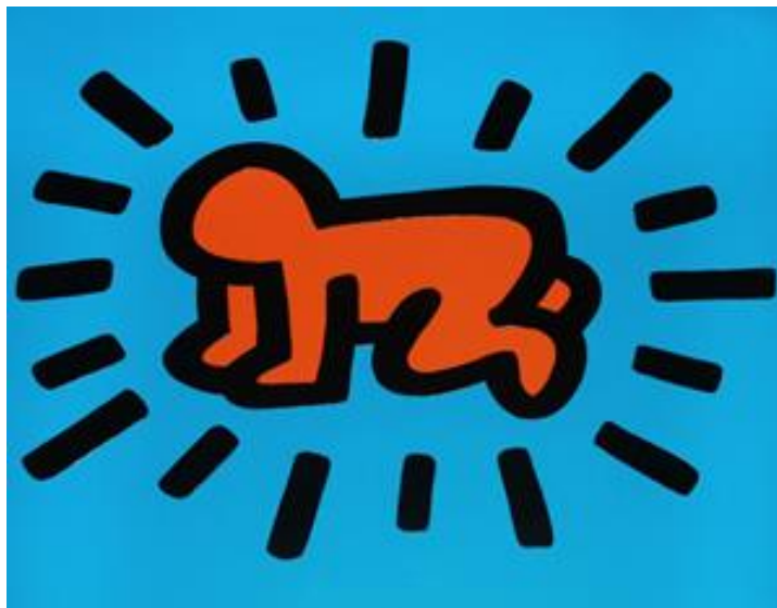
Slika 6. "Radiant Child"

i poznat po svojim jednostavnim, prepoznatljivim linijama i stiliziranim likovima. Najpoznatije djelo Keitha Haringa je "Radiant Child", koje je postalo simbol njegovog stvaralaštva. Radi se o liku djeteta s podignutim rukama, često prikazanom kao crtež ispunjen vibrantnim bojama i crnim konturama. Ova ikonična figura predstavlja radost, ljubav i solidarnost, te je postala prepoznatljiv simbol Haringovog umjetničkog izraza. 20