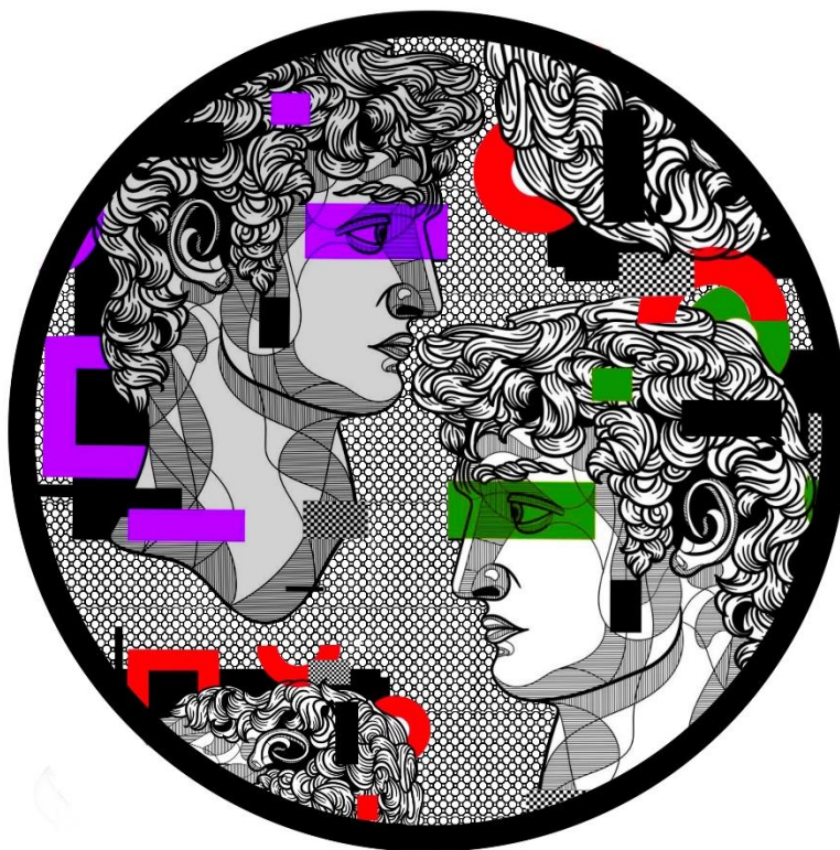
Slika 10. „Dvostruka Glava“