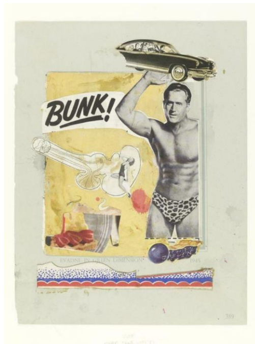
Slika 5. Bunk

Jedno od najpoznatijih djela Eduarda Paolozzija je njegova serija pod nazivom "Bunk" koju je stvorio 1947. godine. Ova serija kolaža i asamblaža prikazuje razne fragmente iz popularne kulture, industrijskih predmeta i reklama. Paolozzi je koristio različite materijale kao što su časopisi, reklamni materijali, metalni dijelovi i ostaci industrijskih proizvoda kako bi stvorio svoje karakteristične i slojevite kompozicije.