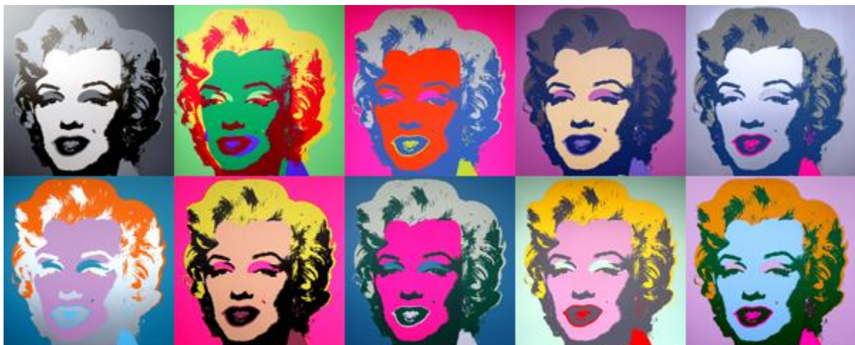
Slika 3. Marilyn Diptych

"Marilyn Diptych" postala je simbol pop arta i jedno od najprepoznatljivijih umjetničkih djela 20. stoljeća. Njegova estetika, koja kombinira masovnu reprodukciju i upotrebu slavni ikona, odražava ključne motive i karakteristike pop arta. Djelo je izloženo u mnogim svjetskim muzejima i galerijama, a postalo je ikona popularne kulture i simbol umjetnosti Andyja Warhola. 17