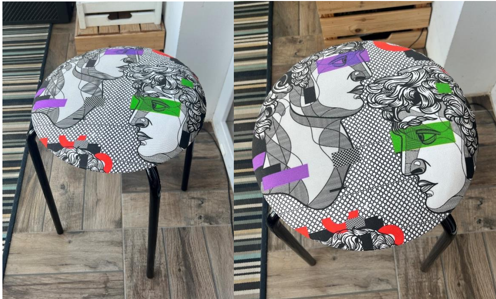
Slika 11. likovno rješenje rada „Dvostruka Glava“

U ovom dijelu, predstaviti ćemo krajnje proizvode koji su rezultat primjene tekstilnih uzoraka inspiriranih pop artom. Ovdje ćemo istaknuti krajnji rezultat te kako su se uzorci uspješno uklopili u odabran proizvod.