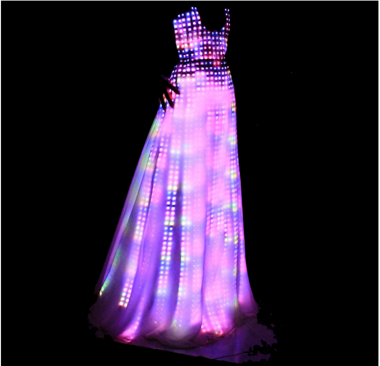
[5] Haljina Aurora koju je dizajnirala tvrtka CuteCircuit čiji je slogan " Moda budućnosti sada ", inspirirana je svjetlima Aurore Borealis s LED svjetlima ugrađenima u tkaninu