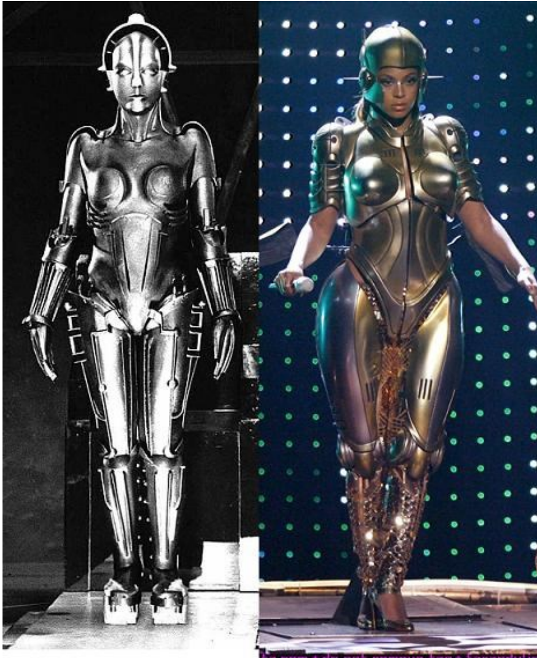
[3] Lijevo: slika kiborga u Metropolisu snažno je utjecala na ikonografiju ZF filma. Desno: današnja pop kultura posuđuje iz ZF žanra.