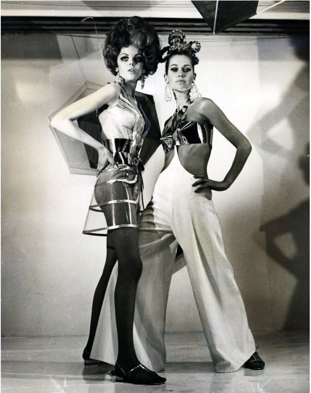
[8] Space age moda, London, 1968.