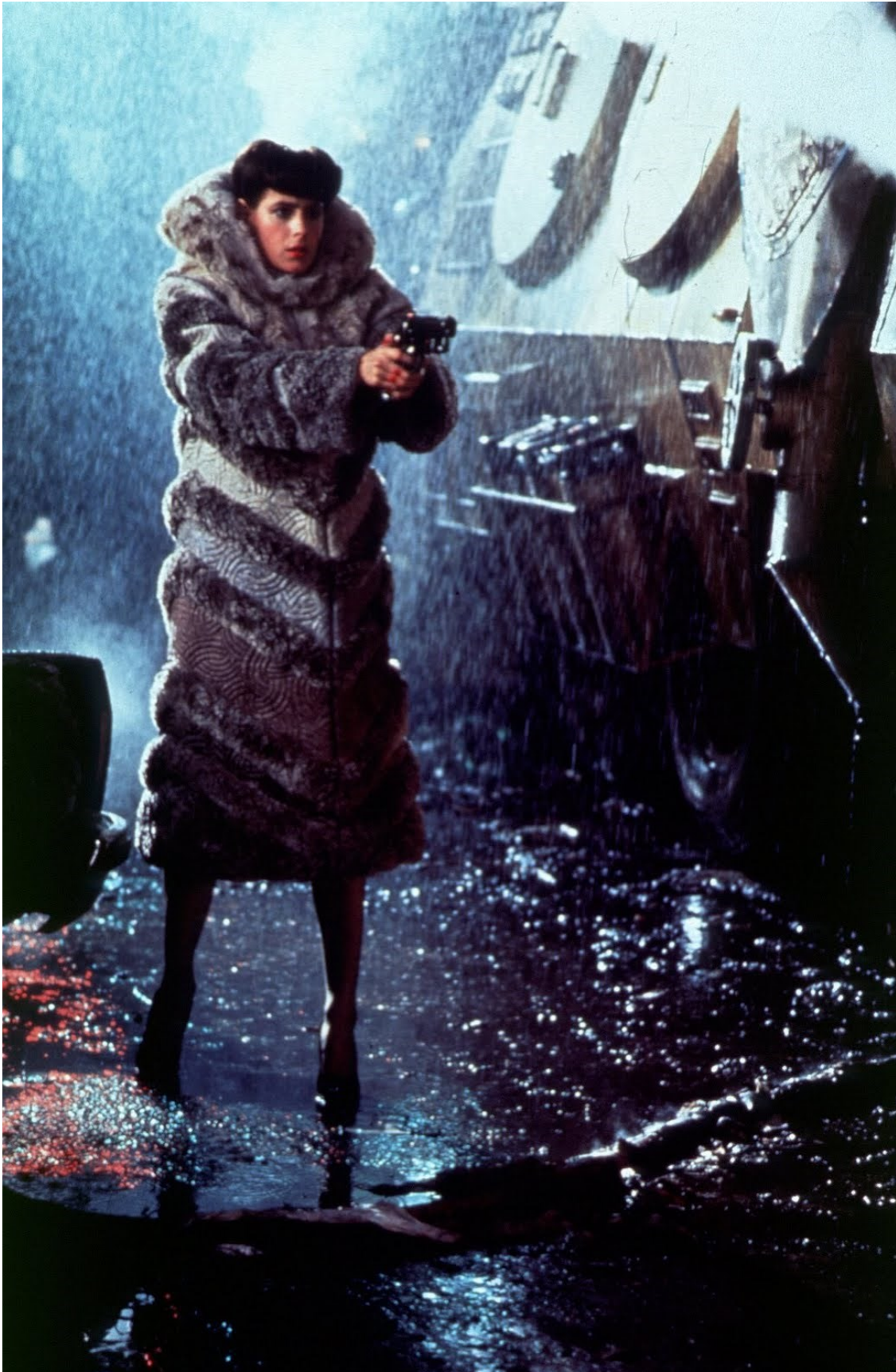
[2] " More human than human "; krilatica je pod kojom se odvija proizvodnja genetičkih replikanata u Blade Runneru. ZF je duboko refleksivan žanr koji u srži postavlja pitanje: Što znači biti čovjek? Enciklopedija znanstvene fantastike autora Clute i Nichollsa broji oko 125 različitih tema za