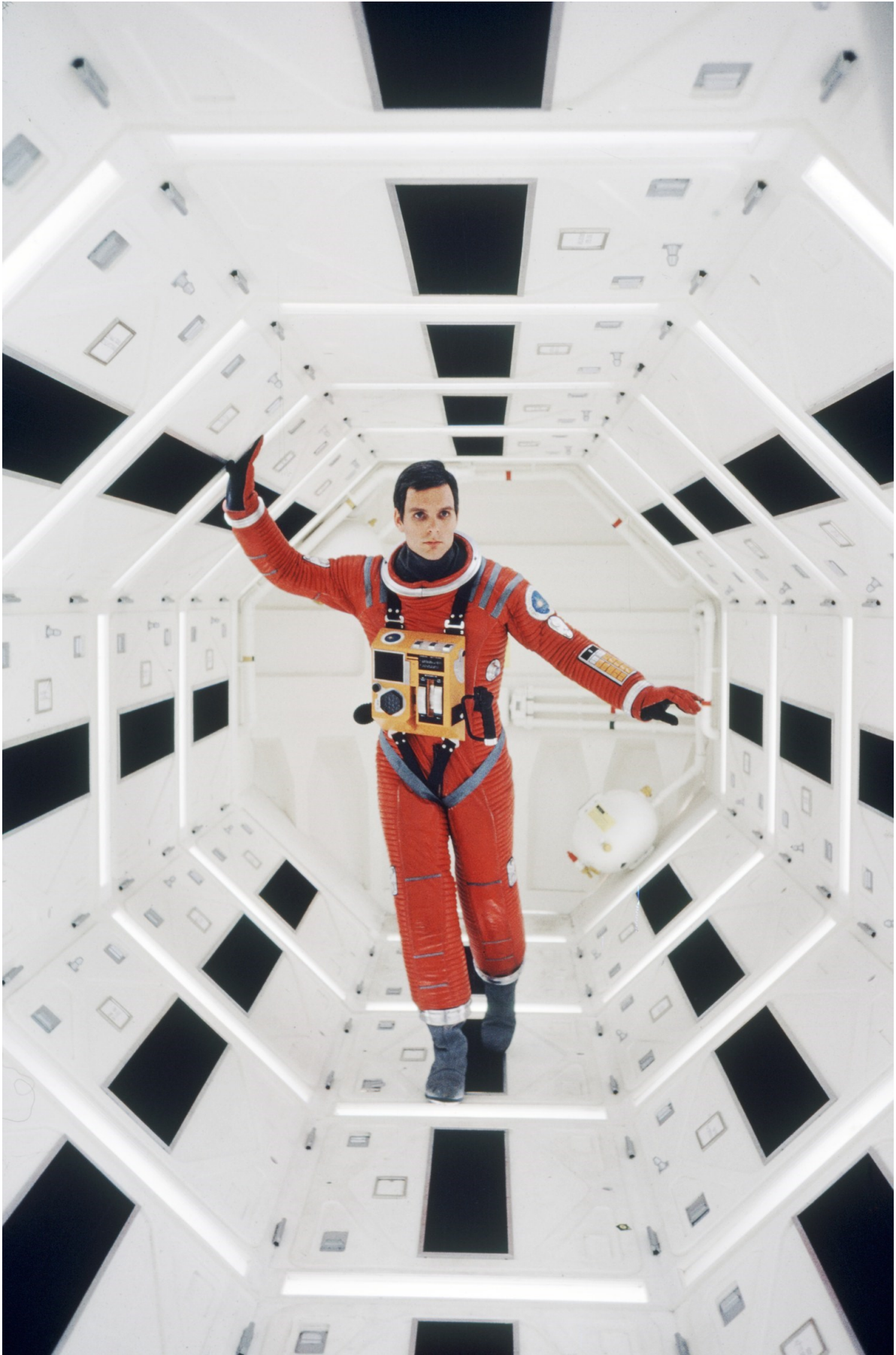
[1] Ikonografsko remek djelo ZF kinematografije, 2001: A Space Odyssey redatelja S. Kubricka