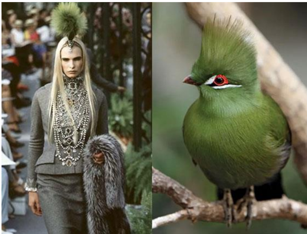
Slika 18. Lijevo: John Galliano za The House of Dior, jesen/zima 1997., Haute Couture. Desno: Gvinejski turako ( Tauraco persa), https://www.britannica.com/animal/turaco (posjećeno 07.09.2023.)