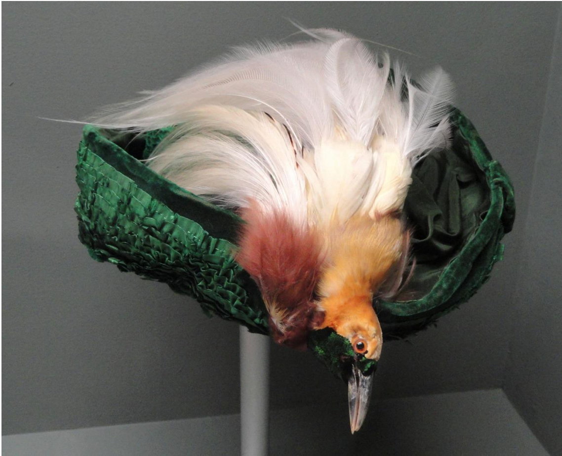
Slika 7. Ptičji šešir iz edwardskoga doba, oko 1901. godine, Pacific Grove Museum of Natural History , https://museums victoria.com.au/article/flight-of-fashion-when-feathers-were-worth-twice-their-weight-in-gold/ (posjećeno 09.11.2022.)

lepeza od nojevog perja. 21 Do 1900. godine, oko 5 milijuna ptica godišnje je žrtvovano modi u Sjedinjenim Američkim Državama. 22