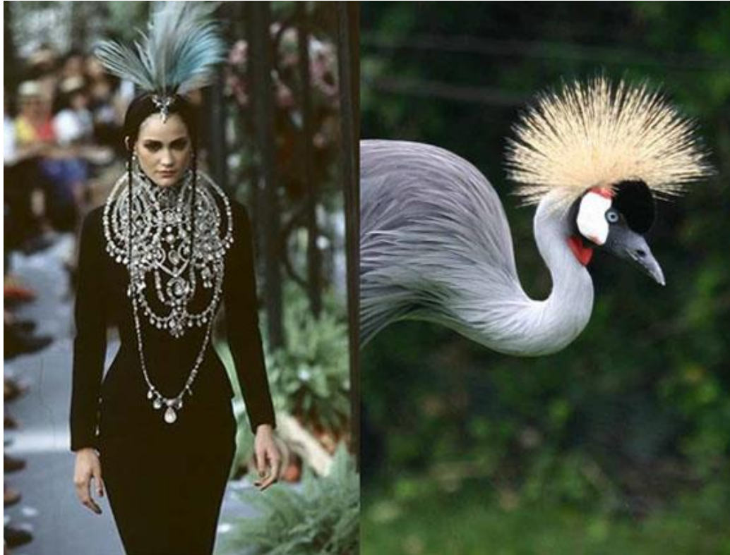
Slika 17. Lijevo: John Galliano, The House of Dior , jesen/zima 1997., Haute Couture . Desno: Sivi krunasti ždral ( Balearica regulorum ), Indianapolis Zoo, https://www.indianapoliszoo.com/exhibits/plains/east-african-grey-crowned-crane/ (posjećeno 07.09.2023.)