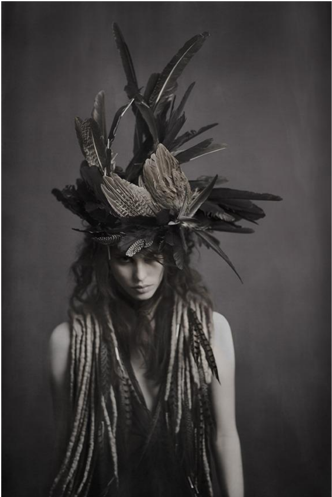
Slika 42. Pernato ogavlje, Selina Elkuch, šalovi i ogrtači: Taiana Design , model: Michelle Muse kozmetika: Cheyenne Timperio, frizura: Takeo Suzuki, Style Zeitgeist , 2013.