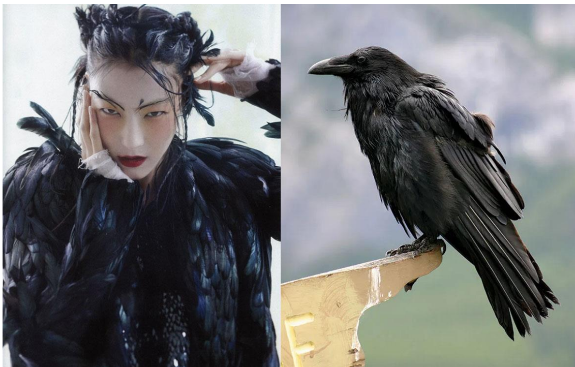
Slika 31. Desno: "Noir et Blanc": Black Swan, Vogue Korea, siječanj 2013. Lijevo: Obični gavran ( Corvus corax), Britannica, https://www.britannica.com/animal/raven (posjećeno 07.08.2023.)