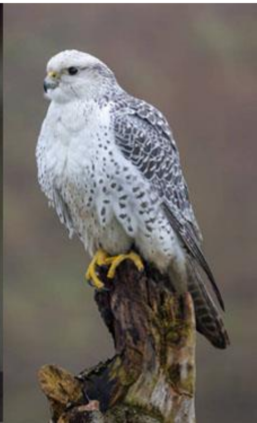
Slika 12. Lijevo: Yves Saint Laurent, “Pariz s daškom stila”, Vogue , 1979., fotograf François Lamy, model Mira Tibblin nosi “rajski” široki vuneni kostim s hlačama Rive Gauche , uljepšan točkastom košuljom i lakiranom kutijom od slame. Desno: Veliki sokol ( Falco rusticolus ), fotograf Edwin Butter, Getty Images , 2022. Modna kreacija svojim izgledom i paletom boja podsjeća na uzorak perja velikoga sokola, a na šeširu se nalazi tamnocrveno pero.