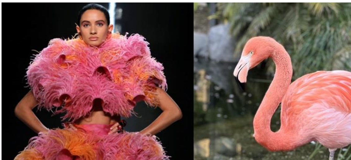
Slika 33. Lijevo: Pernati dizajn Marca Jacobsa iz njegove kolekcije proljeće/ljeto 2019., New York Fashion Week. Desno: Američki plamenac ( Phoenicopterus ruber), Palo Alto Junior Museum & Zoo, https://www.paloaltozoo.org/Exhibits/Zoo-Animals/American-Flamingo (posjećeno 05.09.2023.)