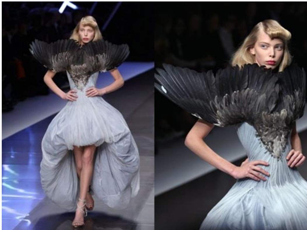
Slika 24. Alexander McQueen, proljeće/ljeto 2008., RTW; Fotografije s modne revije ili prezentacije za Alexander McQueen proljeće 2008., RTW revije u Parizu.