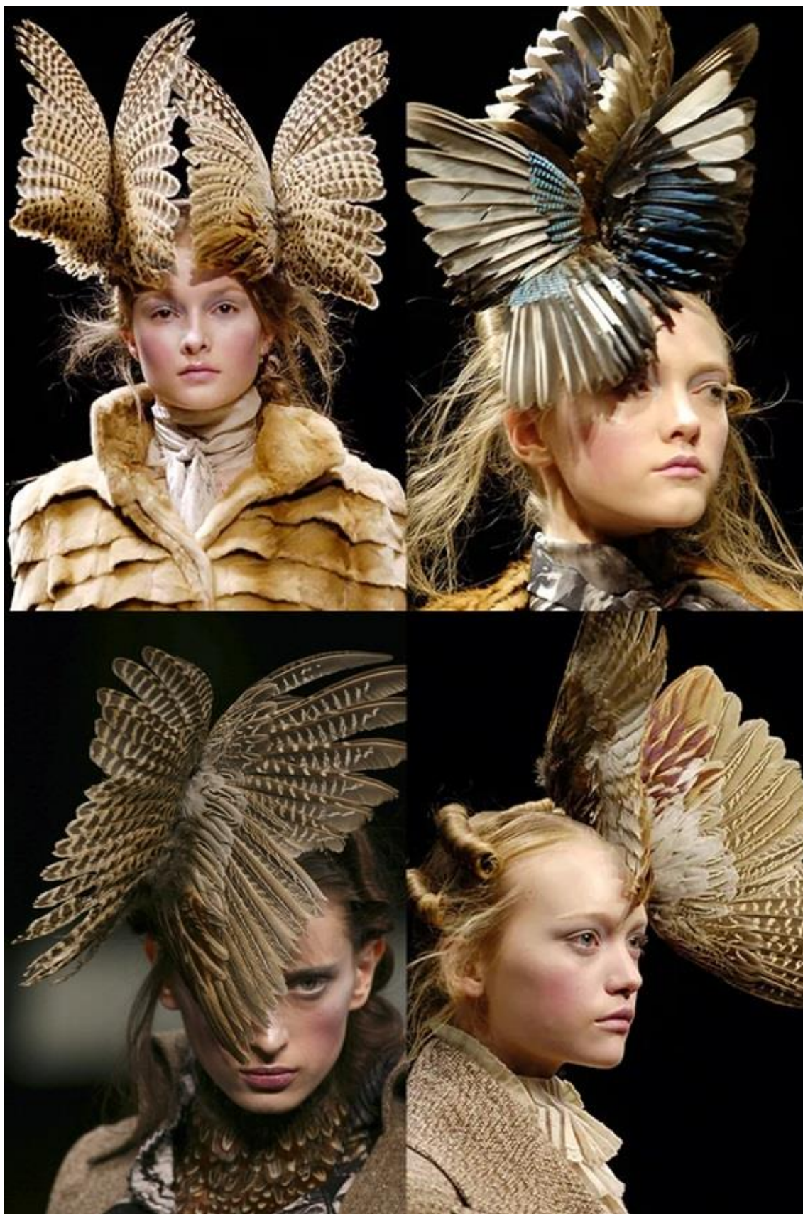
Slika 21. Kolaž fotografija, oglašnja, Alexander McQueen, , Ready-to-Wear Fashion Show , Vogue , jesen 2006., https://www.vogue.com/fashion-shows/fall-2006-ready-to-wear/alexander-mcqueen/slideshow/collection#1 (posjećeno 22.05.2023.)