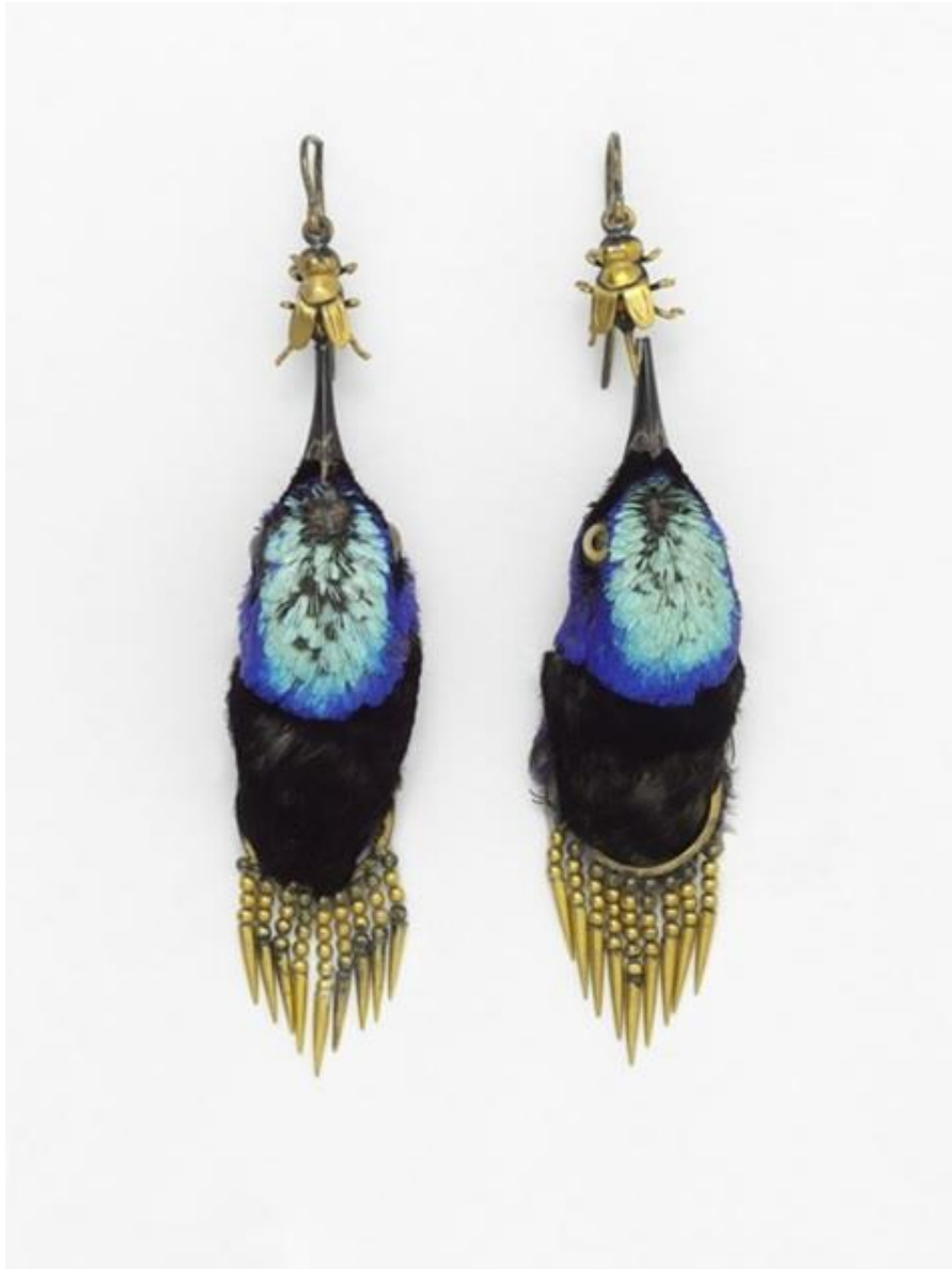
Slika 1. Naušnice izrađene od glava crvenonoge ptice medarice ( Red Legged Honeycreeper ), oko 1875., ptice su predstavljene kako love pozlaćenu muhu, Victoria and Albert Museum , London, Ujedinjeno Kraljevstvo, https://collections.vam.ac.uk/item/O1126619/earring-unknown/ (posjećeno 12.05.2023.)

napredovalo, francuska monarhija je obnovljena; elita je počela žudjeti za više raskoši, a to se odrazilo na njihovu odijevanju. U godinama koje su uslijedile, ova pomama za raskoši filtrirala se do masa kroz povećanu nakladu ženskih časopisa. Žene su nosile šesire obrubljene perjem tijekom 1800-ih. Veličine šešira rasle su 1820-ih, a kako se širina oboda povećavala, tako je rasla i potražnja za perjem. Do 1875. Engleskinje bi ponekad nosile cijele preparirane ptice, od kljuna do kandže. 10