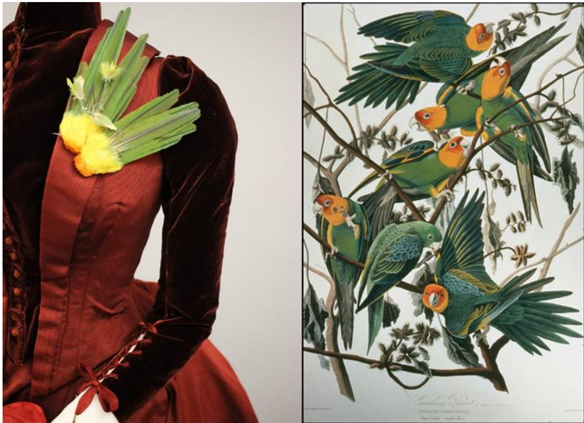
Slika 2. Lijevo: broš izrađen od repova i tjemena izumrlog karolina papagaja ( Conuropsis carolinensis ), prikazan na haljini za šetanje s kraja 1880-ih, fotografija Grace Anderson. Desno: ilustracija karolina papagaja (eng. Carolina Parakeets ) od Johna Jamesa Audubona, 1827., izvorno objavljena u „ The birds of America: from original drawings ”. Slika i digitalizacija Slika i digitalizacija: Odjel za zbirke rijetkih i rukopisa, Sveučilišna knjižnica Cornell