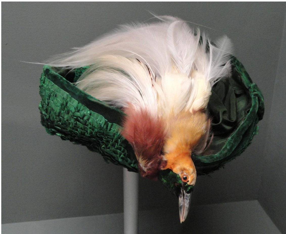
Slika 7. Ptičji šešir iz edwardskoga doba, oko 1901. godine, Pacific Grove Museum of Natural History , https://museums victoria.com.au/article/flight-of-fashion-when-feathers-were-worth-twice-their-weight-in-gold/ (posjećeno 09.11.2022.)

lepeza od nojevog perja. 21 Do 1900. godine, oko 5 milijuna ptica godišnje je žrtvovano modi u Sjedinjenim Američkim Državama. 22