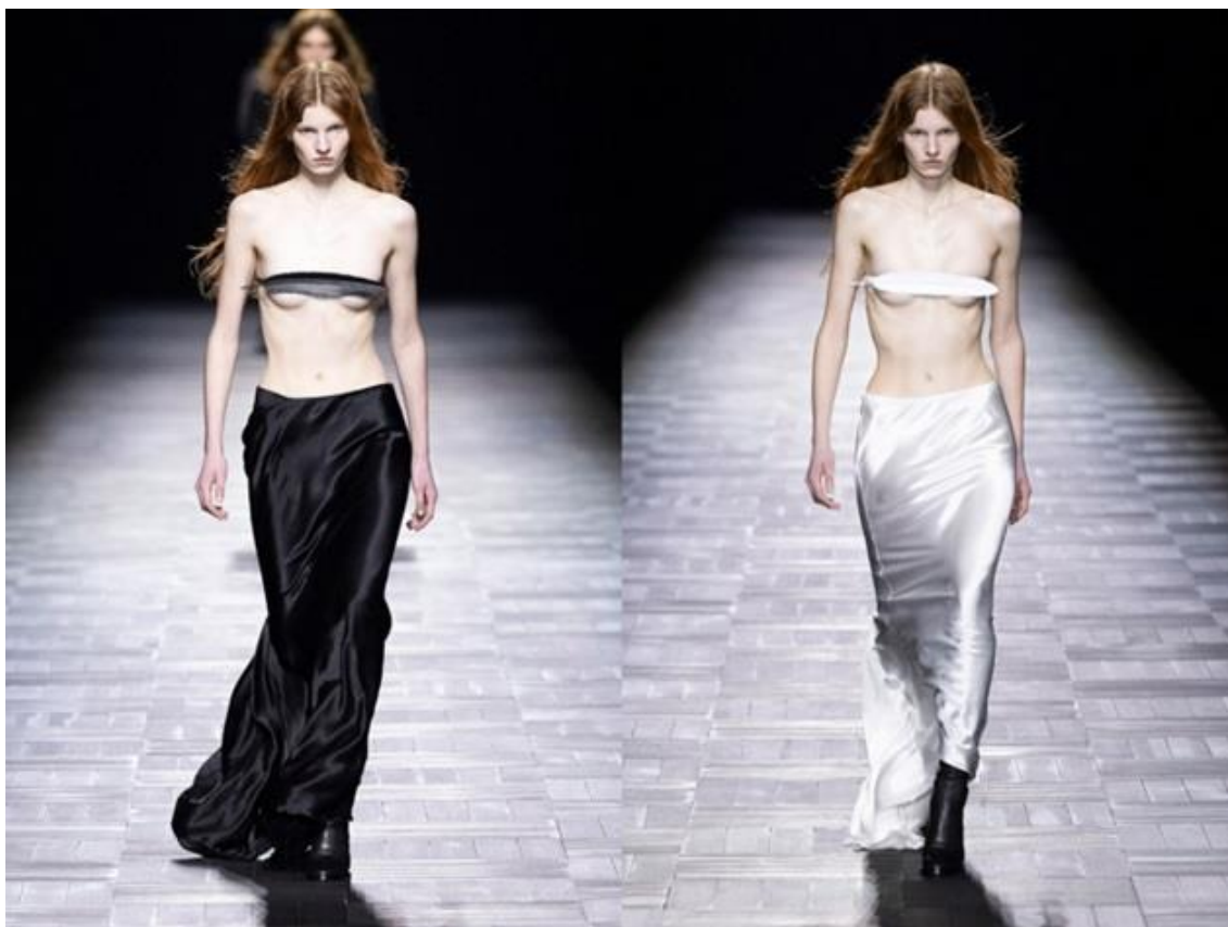
Slika 35. Dizajner Ludovic de Saint Sernin, modna kuća Ann Demeulemeester, kolekcija jesen / zima 2023., Design Scene , https://www.designscene.net/2023/03/ann-demeulemeester-aw23.html (posjećeno 10.06.2023.)

Ludovic de Saint objasnio je kako je njegova debitantska kolekcija u modnoj kući Ann Demeulemeester bila istraživanje autorstva i autobiografije, književne analogije koju je mladi dizajner proširio na izgled kolekcije. Za svoje kreacije izjavio je „ kako je svaka od njih iskrena rečenica, idealno napisana perom, detaljem kojeg je Ann voljela. ” Pero se pojavilo u početnom izgledu kolekcije, izrađeno je od kože i korišteno je kao crni uski grudnjak koji je prelazio preko grudi modela. 29