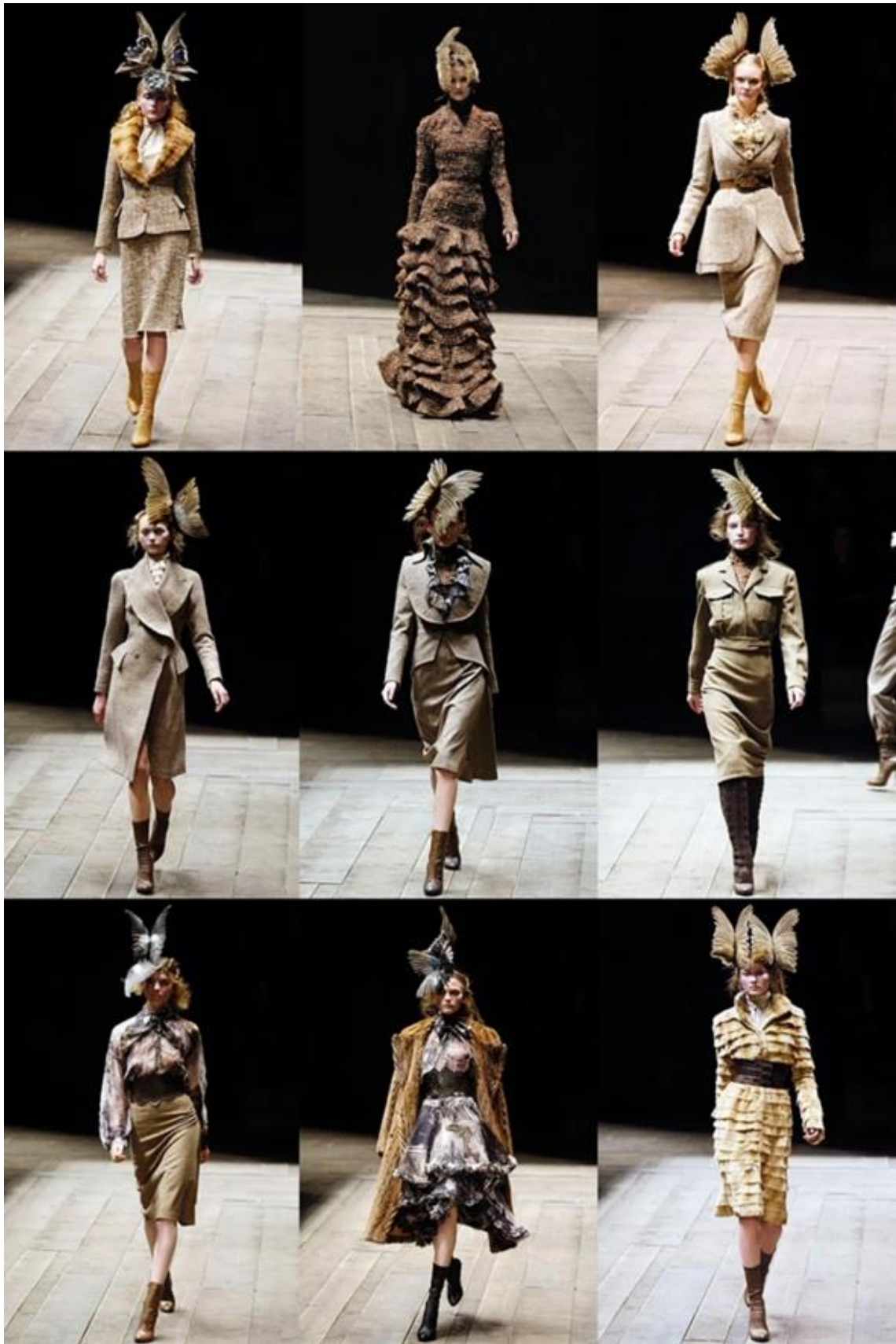
Slika 20. Kolaž fotografija modnih kreacija, dizajner Alexander McQueen, Ready-to-Wear Fashion Show , Vogue , jesen 2006., https://www.vogue.com/fashion-shows/fall-2006-ready-to-wear/alexander-mcqueen/slideshow/collection#1 (posjećeno 22.05.2023.)