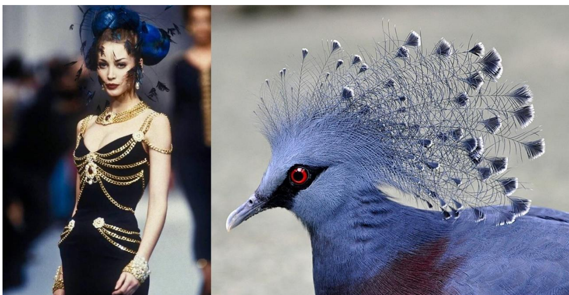
Slika 16. Lijevo: Karl Lagerfeld - 100 najboljih trenutaka Chanel modne revije: Christy Turlington odjenula je vrhunsku Chanel koktel odjeću na reviji Haute Couture , proljeće/ljeto 1992., Harper's Bazaar , 19. veljače 2019., Desno: Viktorijin krunasti golub ( Goura cristata ) https://en.wikipedia.org/wiki/Crowned_pigeon (posjećeno 06.09.2023.)