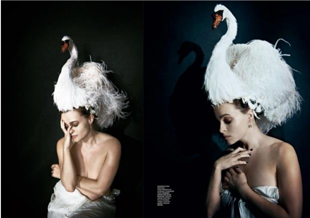
Slika 27. Modna fotografija, model je glumica Helena Bonham Carter, fotograf Peter Lindbergh za "Interview" By Daniel Radcliffe, Magazine, Russia!, 2012.