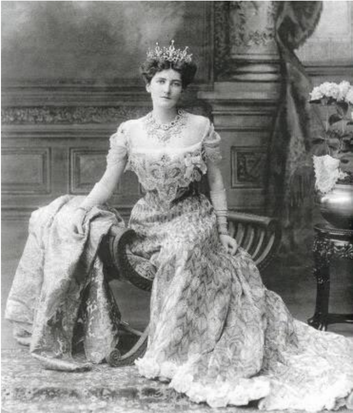
Slika 4. Fotografija Lady Curzon u paunovoj haljini, 1903. godine, Wikipedia, https://en.wikipedia.org/wiki/Peacock_dress_of_Lady_Curzon#/media/File:Mary_Leiter,_Lady_Curzon,_wearing_a_1903_gown_by_Jean-Philippe_Worth.jpg (pristupljeno 18.11.2022.)

kontinuiteta, usklađujući britansku vladavinu s indijskim dvorovima iz prošlosti kao iskaz onodobne aktualne dominacije putem kolonija. 15