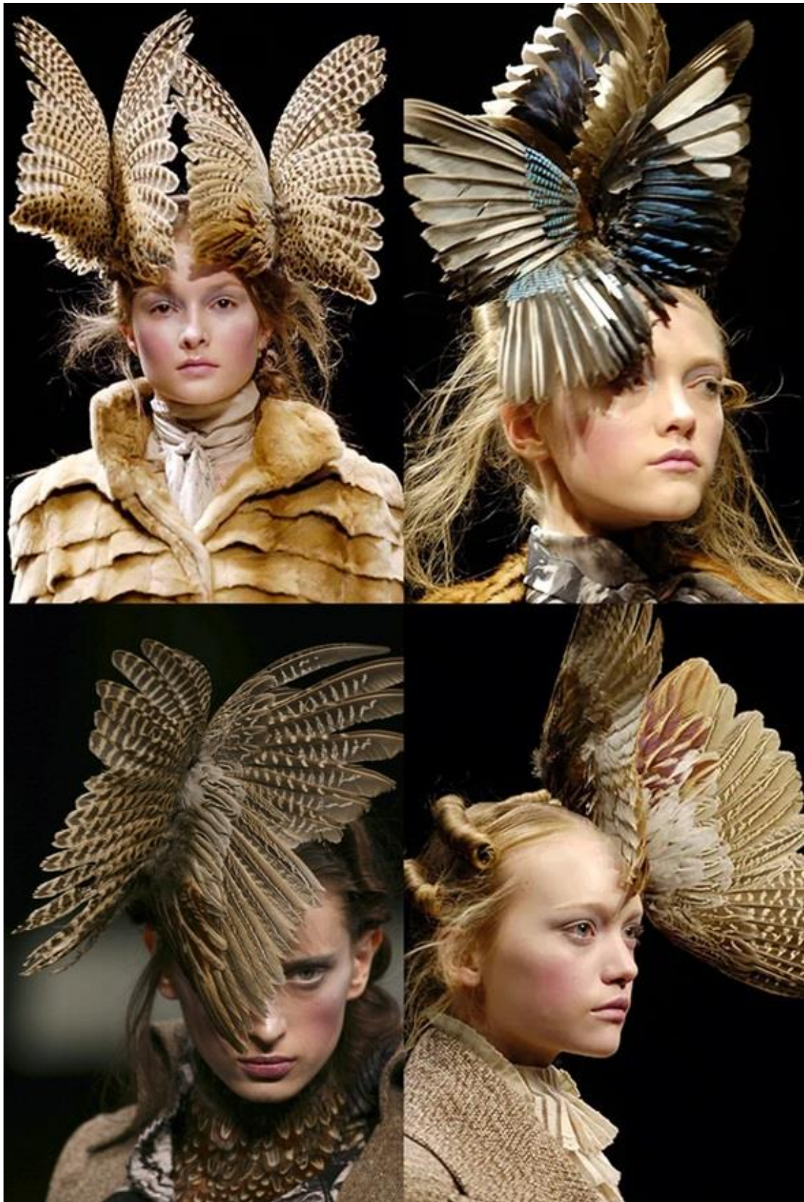
Slika 21. Kolaž fotografija, oglašnja, Alexander McQueen, , Ready-to-Wear Fashion Show , Vogue , jesen 2006., https://www.vogue.com/fashion-shows/fall-2006-ready-to-wear/alexander-mcqueen/slideshow/collection#1 (posjećeno 22.05.2023.)