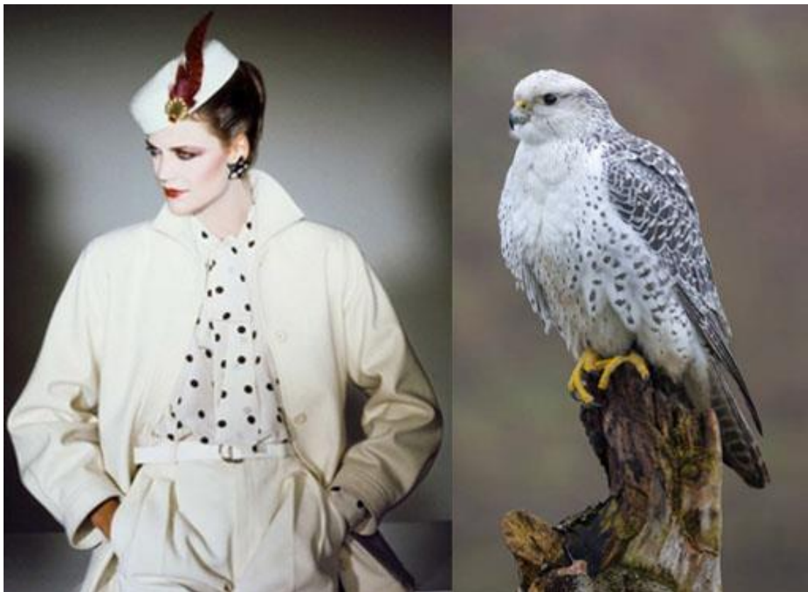
Slika 12. Lijevo: Yves Saint Laurent, “Pariz s daškom stila”, Vogue , 1979., fotograf François Lamy, model Mira Tibblin nosi “rajski” široki vuneni kostim s hlačama Rive Gauche , uljepšan točkastom košuljom i lakiranom kutijom od slame. Desno: Veliki sokol ( Falco rusticolus ), fotograf Edwin Butter, Getty Images , 2022. Modna kreacija svojim izgledom i paletom boja podsjeća na uzorak perja velikoga sokola, a na šeširu se nalazi tamnocrveno pero.