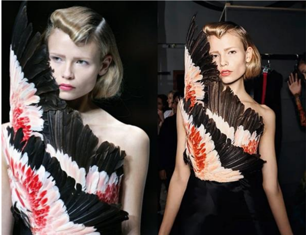
Slika 23. Alexander McQueen, proljeće/ljeto 2008., RTW; Fotografije s modne revije ili prezentacije za Alexander McQueen proljeće 2008., RTW revije u Parizu.