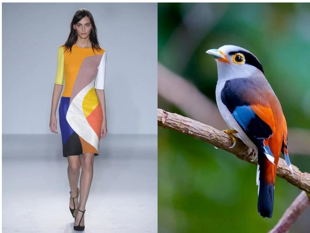
Slika 29. Lijevo: dizajner Josef Albers, Spring/Summer Collection, 2013., Desno: Silver-breasted broadbill ( Serilophus lunatus)