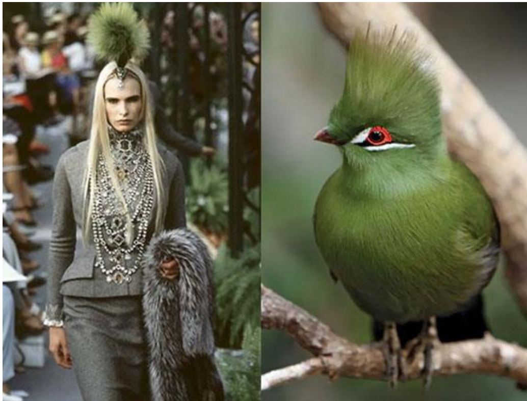
Slika 18. Lijevo: John Galliano za The House of Dior, jesen/zima 1997., Haute Couture. Desno: Gvinejski turako ( Tauraco persa)