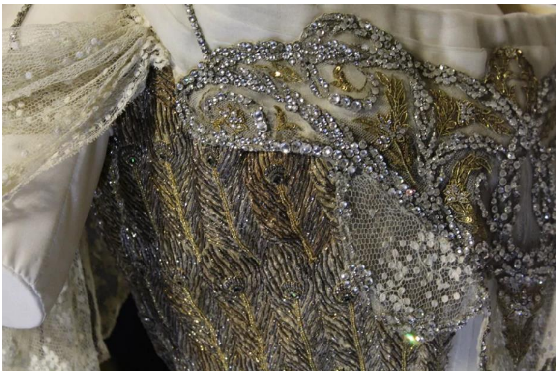
Slika 5. Detalji na dekolteu paunove haljine, prikazi perja, Quello che piaceva Valeria , Italija, https://quellochepiaceavaleria.com/en/worths-dress-with-peacock-feathers-worn-by-lady-curzon/ (Posjećeno 10.05.2023.)