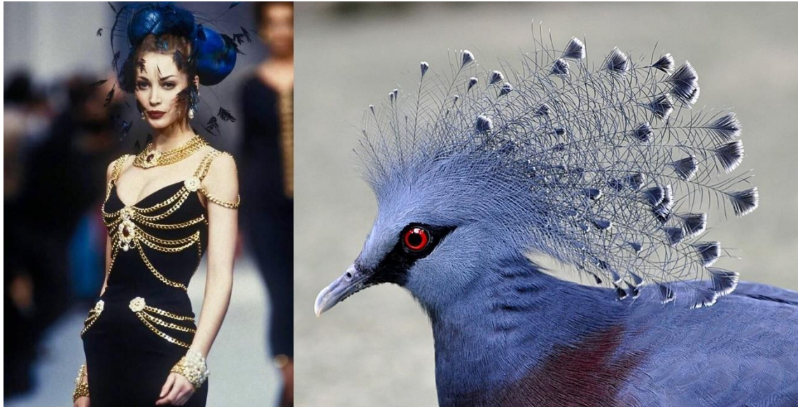
Slika 16. Lijevo: Karl Lagerfeld - 100 najboljih trenutaka Chanel modne revije: Christy Turlington odjenula je vrhunsku Chanel koktel odjeću na reviji Haute Couture , proljeće/ljeto 1992., Harper's Bazaar , 19. veljače 2019., Desno: Viktorijin krunasti golub ( Goura cristata ) https://en.wikipedia.org/wiki/Crowned_pigeon (posjećeno 06.09.2023.)