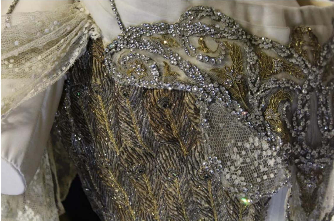
Slika 5. Detalji na dekolteu paunove haljine, prikazi perja, Quello che piaceva Valeria , Italija, https://quellochepiaceavaleria.com/en/worths-dress-with-peacock-feathers-worn-by-lady-curzon/ (Posjećeno 10.05.2023.)