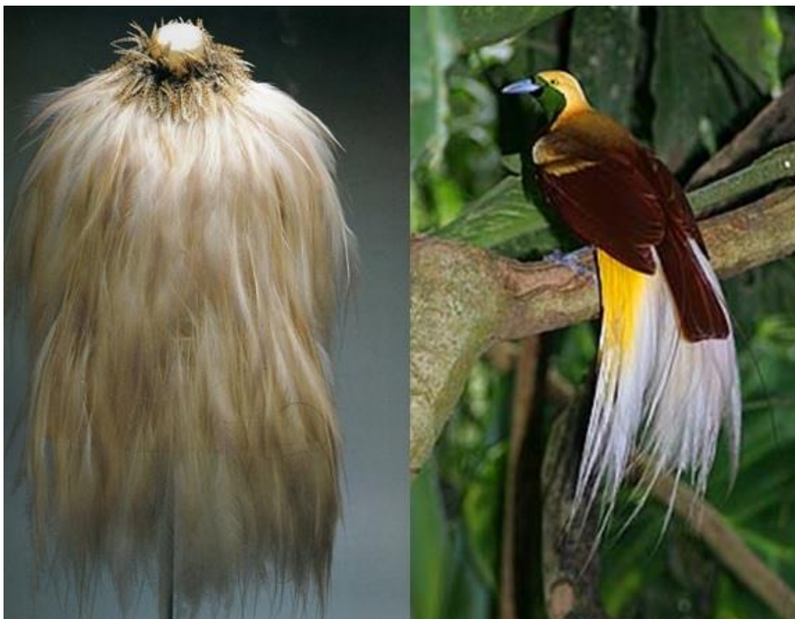
Slika 9. Lijevo: Yves Saint Laurent, couture mini haljina iz 1969. godine izrađena od perja rajske ptice. Desno: Rajska ptica ( Paradisaea minor), https://en.wikipedia.org/wiki/Lesser_bird-of-paradise (posjećeno 06.09.2023.)