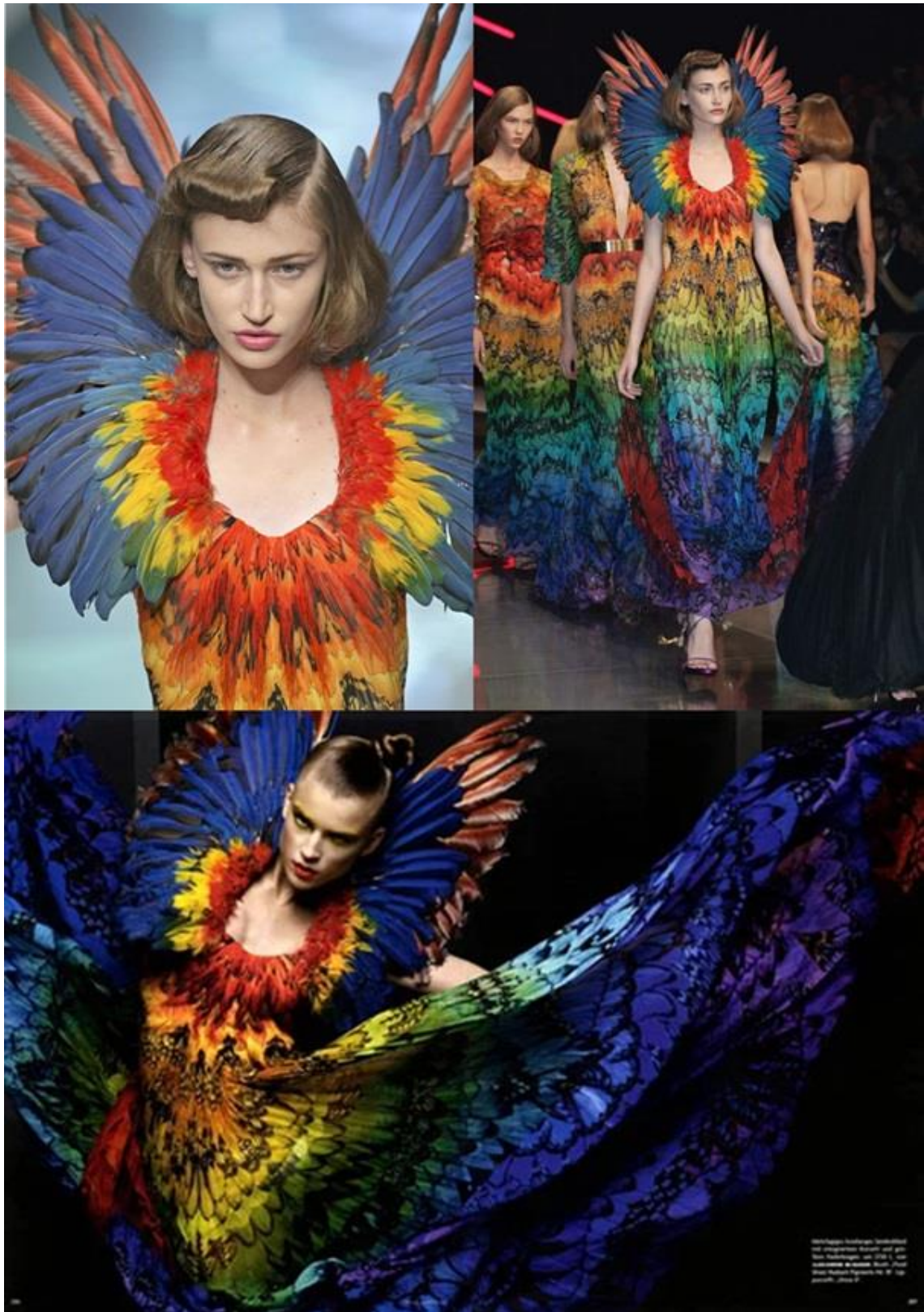
Slika 22. Alexander McQueen, proljeće/ljeto 2008., RTW; Fotografije s modne revije ili prezentacije za Alexander McQueen proljeće 2008., RTW revije u Parizu. https://pynck.com/2020/09/alexander-mcqueens-most-spectacular-nature-inspired-collections.html (posjećeno 22.05.2023.). Kreacija i kolorit su inspirirani crveno-modrom arom ( Ara macao)