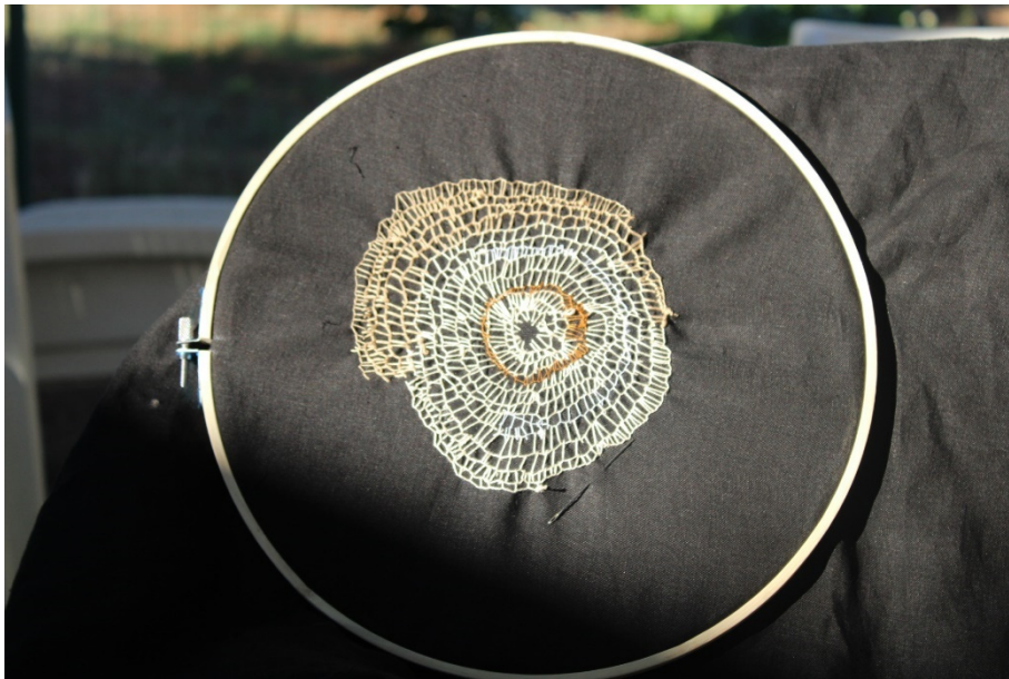
Slika 19. Misao, treća , I. Furundžija, 2022.

Podloga ovog rada načinjena je od kombinacije starih tkanina, jedna je čvršća, a druga nešto slabija, pa tako spojene po sredini načinile su bijelo-žutu osnovu na kojoj intervencija veza ide u suprotnim smjerovima. Na bijelom dijelu prevladava žuti vez, a na žutom konac nešto svjetlijih tonova. Sama struktura rada stvorena je mašinskom intervencijom elastičnim koncem koji je uticao na stvaranje nepravilne površine.