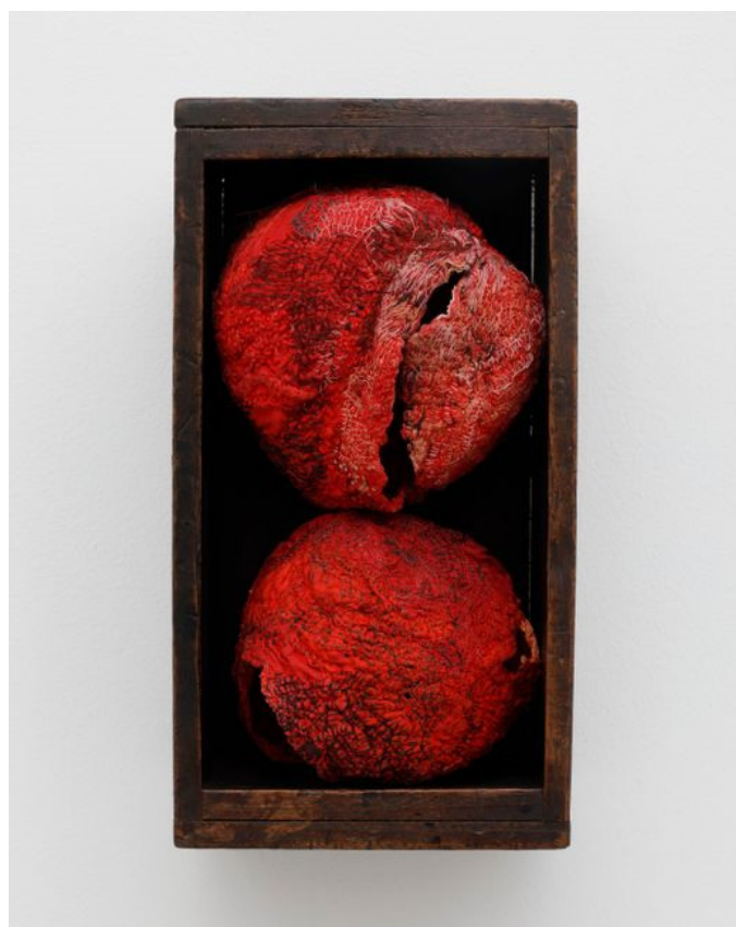
Slika 7 Junko Oki, Feeling unsaid and unspoken words 02, 2019.