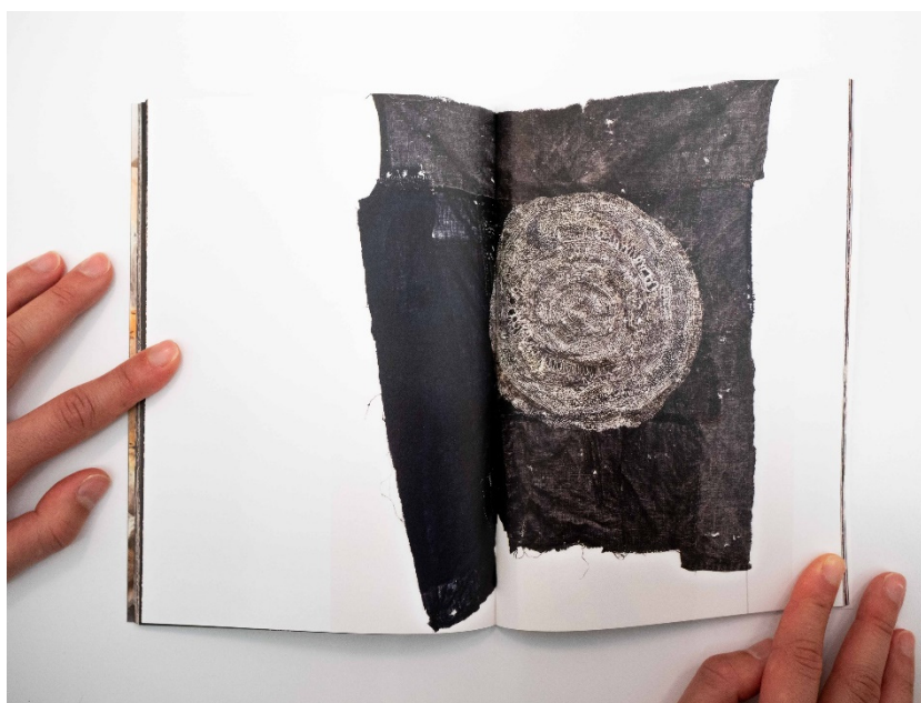
Slika 12 junko Oki, Truly Indispensable, 2019.