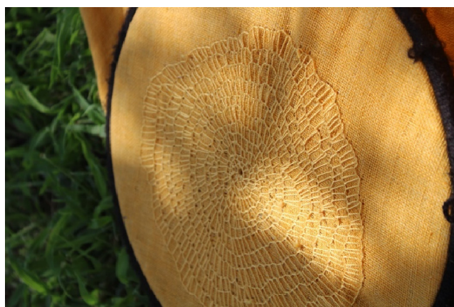
Slika 21. Misao, peta , I. Furundija, 2022.

Za osnovu ovog rada korištena je duplo sašivena lanena tkanina koja jedina od svih ima mašinsku intervenciju običnim koncem preko čega je vez u crvenoj i crnoj boji. Prvotno je zamišljen jedan crveni krug koji, kako sam to i ranije spomenula u istraživanju, svojom bojom na bijeloj podlozi naglašava svoj simbol moći, manifestacije i stvaranja. Ali u samom procesu rada, intuitivno je nadodano nekoliko krugova u crvenoj i crnoj boji koji se međusobno preklapaju i popunjavaju skoro cijeli rad.