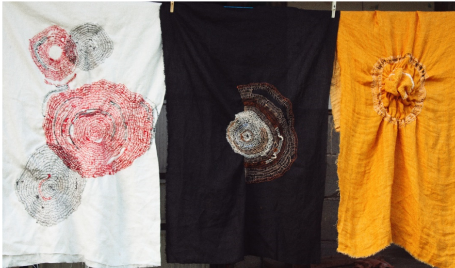
Slika 23. I. Furundžija, 2022.