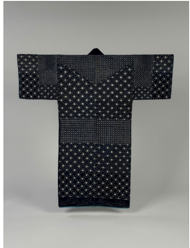
Slika 2, jakna iz razdoblja Meiji u kolekciji Metropolitan Museum of Art

Velika je raznolikost sashiko uzoraka, a mnogi od njih nastali su po uzorcima iz drugih tekstila, keramike ili arhitekture. Neki od uzoraka su: