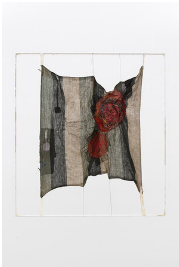
Slika 8 Junko Oki, Moon and chrysalis 01, 2017.