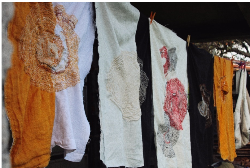
Slika 22. I. Furundžija, 2022.

Ovaj završni rad inspiriran umjetnošću Junko Oki, rezultirao je likovnim rješenjem od ukupno 5 radova dimenzija 70x100 cm čija je odlika vez koji se nepravilno rasprostire po površini te tako stvara kružnu kompoziciju koja je kao takva u središtu stvaranja. Osim izrade ovih radova, odnosno tekstilnih slika, radom je obuhvaćen i dio o uporabnom tekstilu koji je prikazan torbama kojih je nastalo ukupno 5. Torbe su u različitim veličinama i krojevima, šivane od lanenog materijala sa minimalnom intervencijom koja je u kontrastu sa intervencijom koja u većoj količini prevladava na slikama.