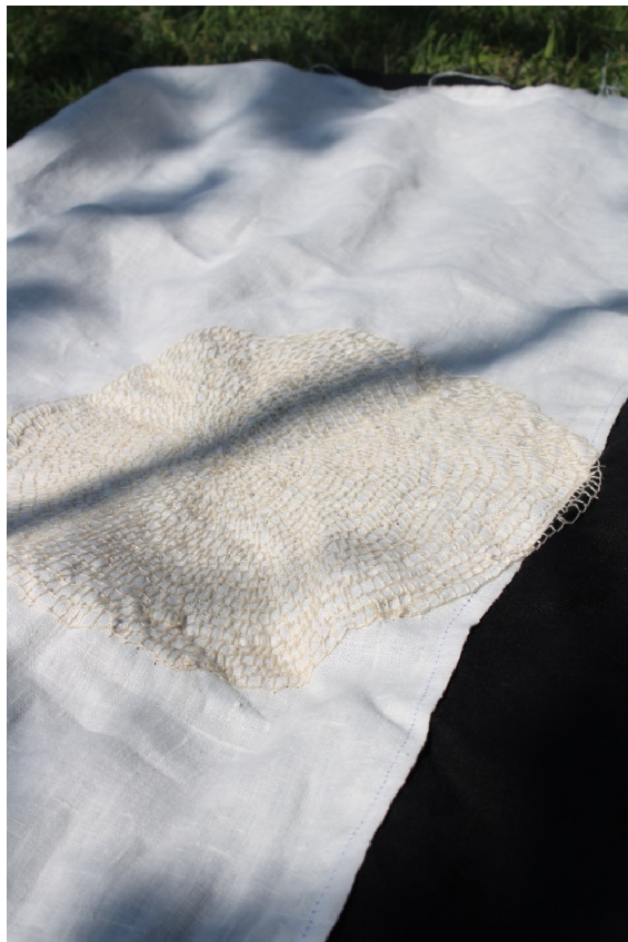
Slika 17. Misao, prva , I. Furundžija, 2022.

Vez je rađen na spojenoj tkanini crnog i bijelog lana na kojoj je omjer bijelog naspram crnog 2:1, isto tako što se tiče i veza. Bijeli konac preko bijele tkanine stvara kružni oblik koji svojim širenjem polako prelazi na crni dio te tako u odnosu na bijelu stranu, crna ističe vez te tako na ovom radu možemo spomenuti njegovu osobinu kontrasta.