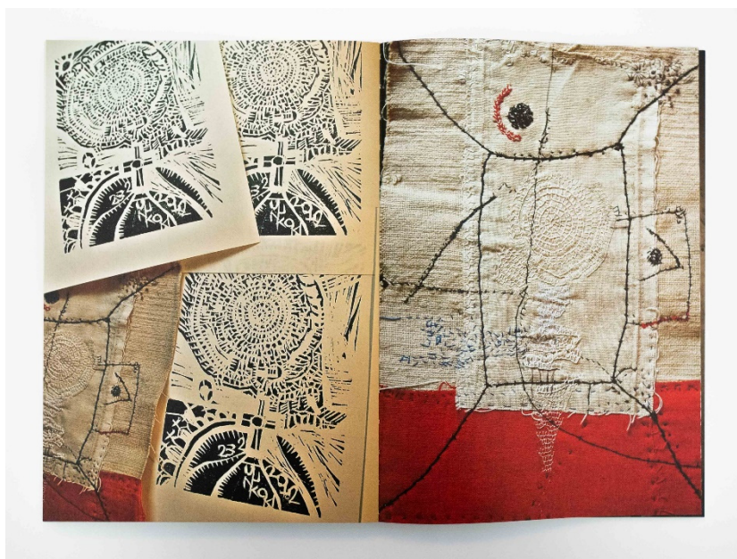
Slika 10 Junko Oki, Punk, 2014.