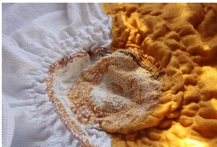
Slika 18. Misao, druga , I. Furundžija, 2022.

Vez je rađen na spojenoj tkanini crnog i bijelog lana na kojoj je omjer bijelog naspram crnog 2:1, isto tako što se tiče i veza. Bijeli konac preko bijele tkanine stvara kružni oblik koji svojim širenjem polako prelazi na crni dio te tako u odnosu na bijelu stranu, crna ističe vez te tako na ovom radu možemo spomenuti njegovu osobinu kontrasta.