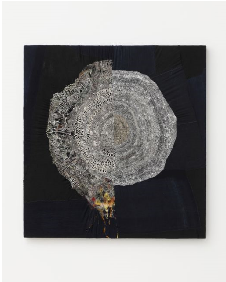
Slika 13 Junko Oki, Interwine 1, 2021.

kretnju. Naizgled nabacani šavovi, besprije korno skladnim spajanjem stvaraju priču koja prepoznatljivo stoji iza Junko Oki i istovremeno se gradi i raste uz nju.