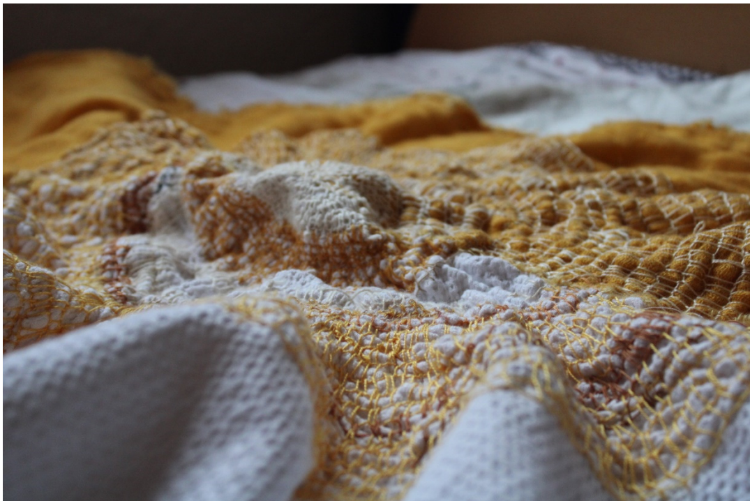
Slika 28. detalji rada