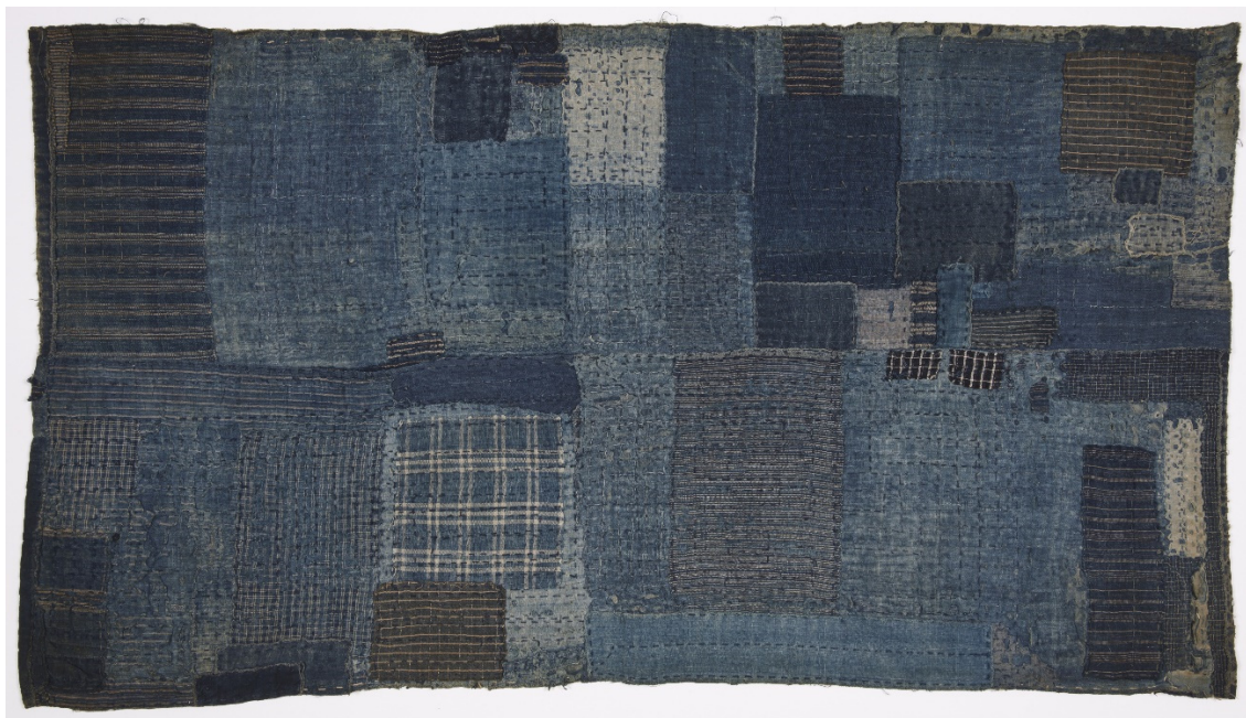
Slika 3 dječja prostirka za spavanje, kasne 1800.

Nakon donesenih klasnih zakona u Japanu, siromašno seosko stanovništvo imalo je pristup samo tkaninama koje su izrađene od konoplje i drugih stabljičnih vlakana, a od boja su imali tonove indiga, sive, smeđe i crne.