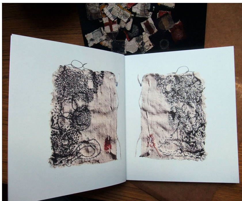
Slika 11 Junko Oki, Culte a la Carte, 2013.