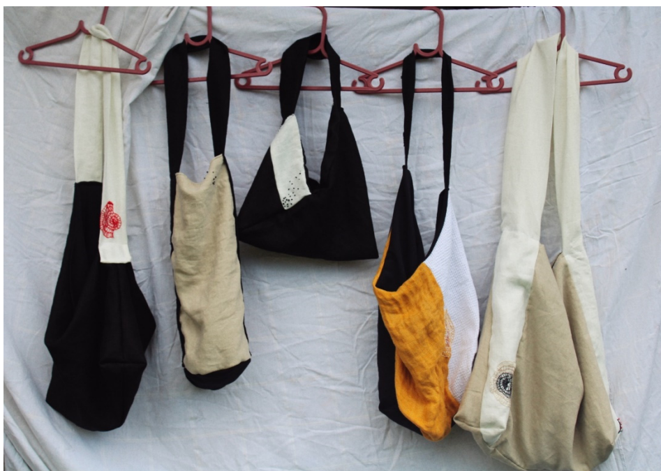
Slika 29. Uporabni tekstil (Torbe) I. Furundžija, 2022.