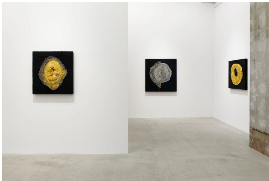
Slika 7 Samostalna izložba "Yobitsugi" KOSAKU KANECHIKA, Tokyo, Japan 2021.