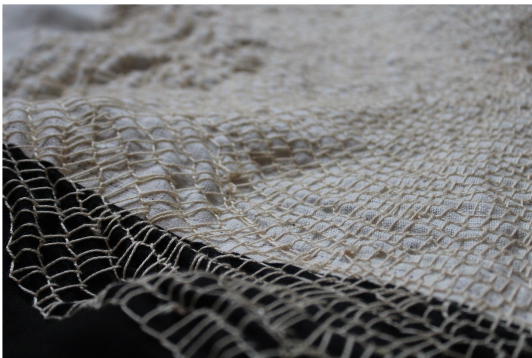
Slika 26. detalji rada