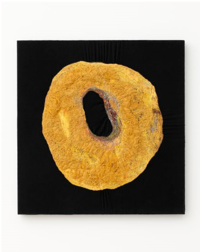
Slika 16. Junko Oki. Lemon 2, 2021.

Vidljivo je da u svom radu najčešće koristi niti u žutoj, crvenoj i plavoj boji, naravno u kombinaciji bijele i crne. Primjeri žutih radova okarakteriziranih po samoj boji govore o njezinoj inspiraciji koju pronalazi u Suncu, limunima i sl. Sama žuta boja simbol je živopisnosti, kreativnosti, stvaranja i slobode. U svom radu vođena je životvornošću, pa skladno tome stvara takve radove.