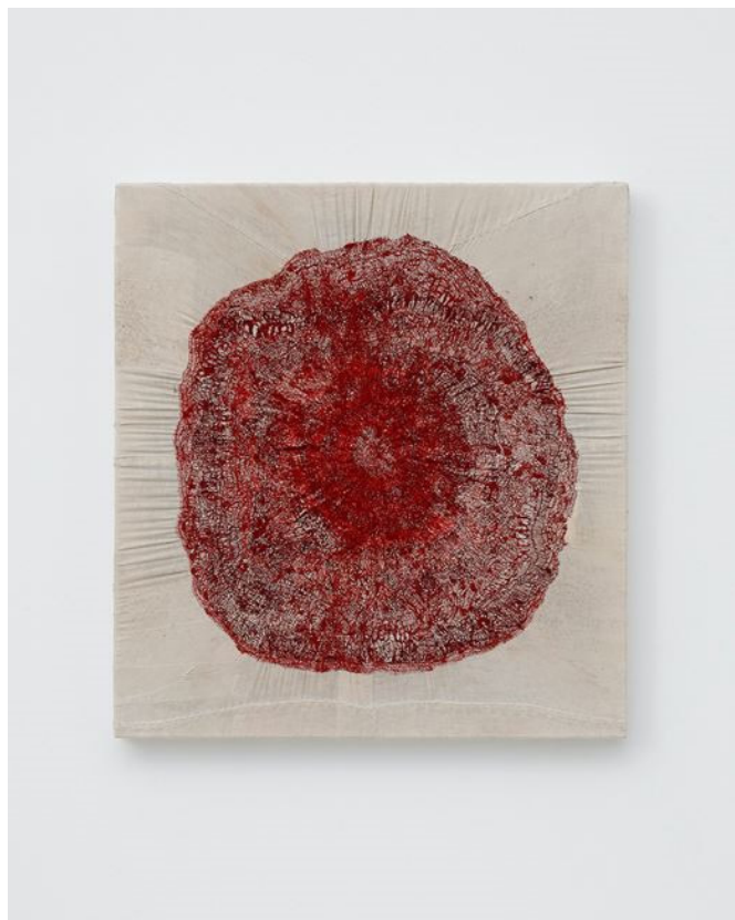
Slika 8. Junko Oki, amaranths, 2020.