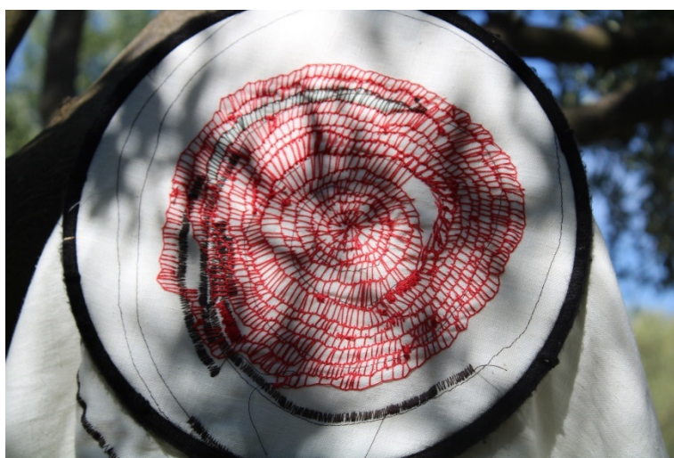
Slika 20. Misao, četvrta , I. Furundija, 2022.

Za osnovu ovog rada korištena je duplo sašivena lanena tkanina koja jedina od svih ima mašinsku intervenciju običnim koncem preko čega je vez u crvenoj i crnoj boji. Prvotno je zamišljen jedan crveni krug koji, kako sam to i ranije spomenula u istraživanju, svojom bojom na bijeloj podlozi naglašava svoj simbol moći, manifestacije i stvaranja. Ali u samom procesu rada, intuitivno je nadodano nekoliko krugova u crvenoj i crnoj boji koji se međusobno preklapaju i popunjavaju skoro cijeli rad.