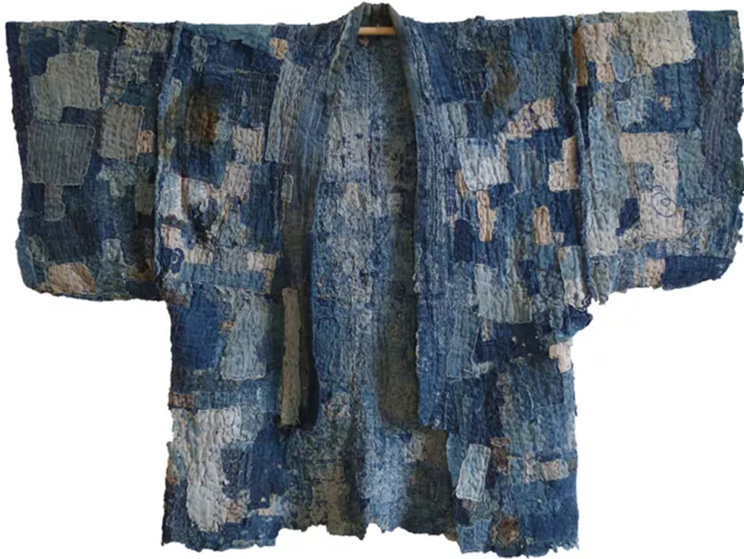
Slika 4 Tradicionalni boro kimono

Središnji smisao boro tehnike je pronalaženje ljepote čak i u nesavršenostima, cilj je iskoristiti svaki komad tkanine tako da ništa ne ode u otpad. Kao i sashiko, i boro je postao oblik tekstilnog dizajna i umjetničkog stvaranja. [4]