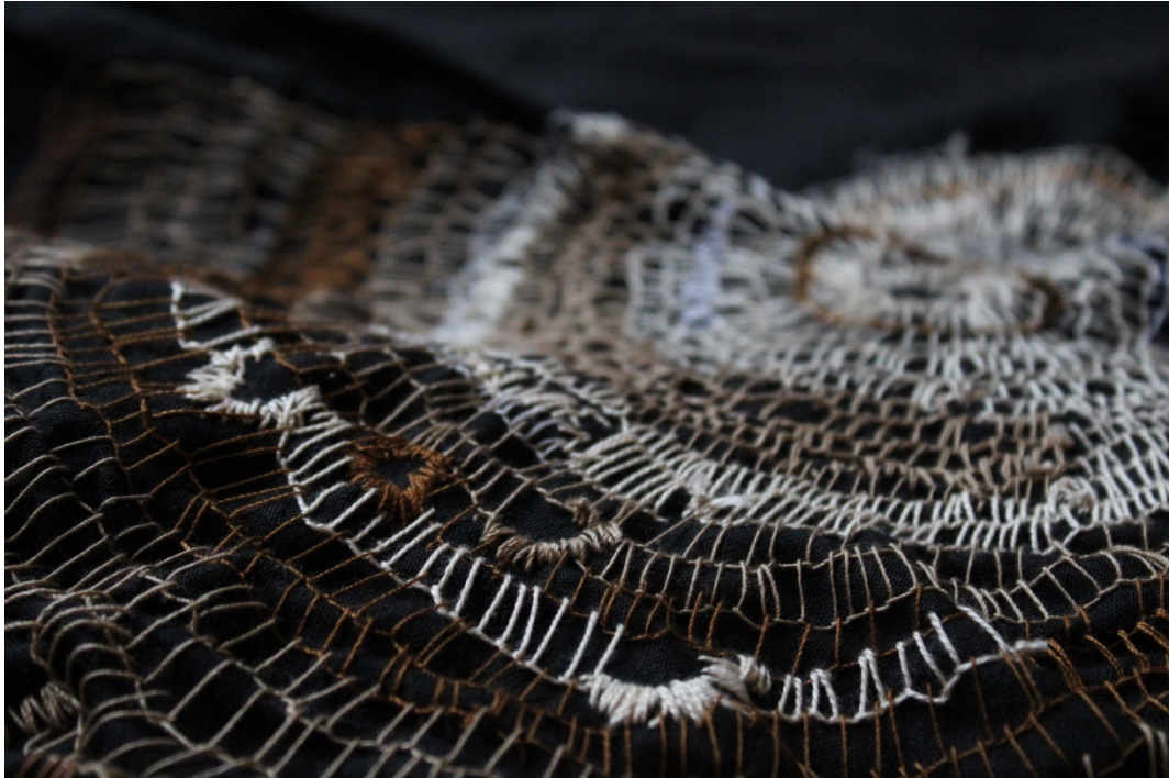
Slika 27. detalji rada