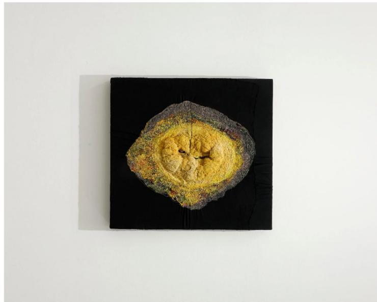
Slika 6 Junko Oki, Lemon 1, 2021.

2017 The 11th shisheido art egg, shisheido art egg award