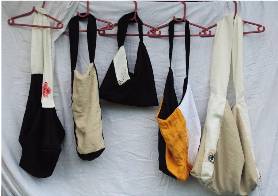
Slika 29. Uporabni tekstil (Torbe) I. Furundžija, 2022.