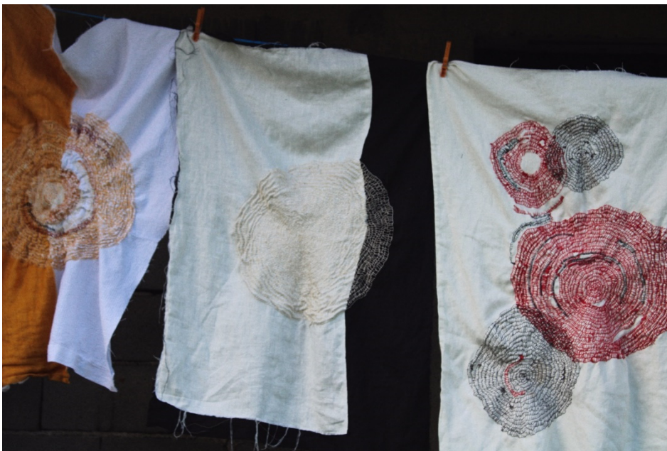
Slika 24. I. Furundžija, 2022.