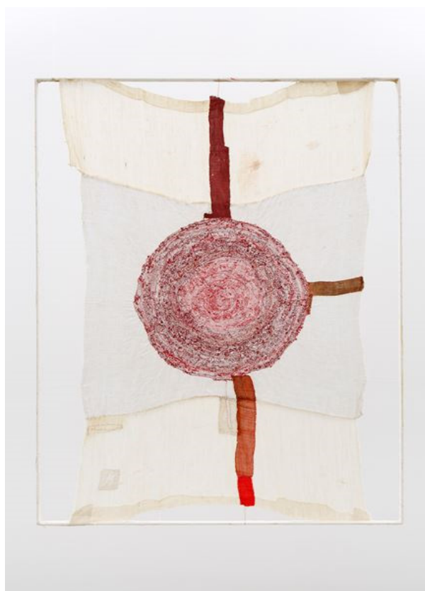
Slika 9 Junko Oki, Moon and chrysalis 03, 2017.