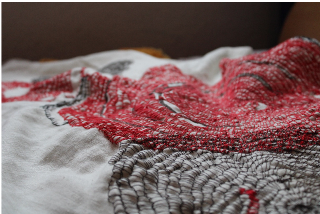
Slika 25. detalji rada