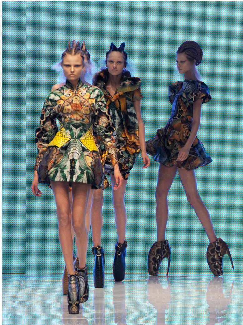
Slika 3. Alexander McQueen spring/summer 2010 „Plato's Atlantis“

Prema riječima Sare Burton bila je to ideja svojevrsnog preokreta evolucije s velikim interesom za realizaciju McQueenovog koncepta hibrida. Spajao je različite elemente i vrste tkanina da bi vidio kako reagiraju zajedno. Rezao je sve skrojene komade i spajao ih, a kada ste ga gledali kako se odvažno primio „posla“ naježili ste se jer je pokazao neku vrstu hrabrosti. Nikada se ničega nije bojao. Nikada nije bilo: „Oh, ovo neće uspjeti.“ Bio je izrazito samouvjeren i jasan u pogledu načina na koji je radio stvari, a to je, mislim... dio njegove genijalnosti i stručno poznavanje izrade odjeće. 16 Rezultat kolekcije Plato's Atlantis bio je svijet nakon tragedije koja će se tek dogoditi kao posljedica globalnog zatopljenja. Prema McQueenu, Zemlju će naseljavati poluljudi, napola gmazovi, prilagođeni životu i na kopnu i pod vodom.