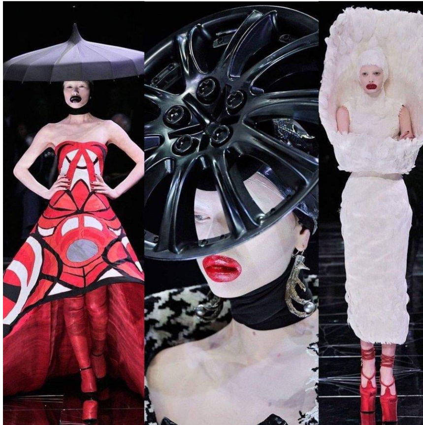
Slika 2. Alexander McQueen autumn/winter 2009 „Ready to Wear“

riječima: „Odjeća i nakit trebaju biti zapanjujući, individualni. Kada vidite ženu u mojoj odjeći, želite znati više o njoj, za mene je to ono što razlikuje dobre dizajnere od loših.“