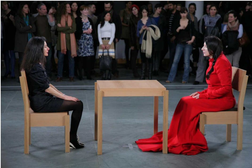
Slika 5. Marina Abramović „The Artist is Present“ 2010.

bi došao na red, prepustio bi svoje mjesto nekom drugom. Nikad nije sjeo ispred mene“, rekoše Marina. Ovo je performans koji je na nove načine zblizavao ljude, umjetnica je bila ondje za svakog od prisutnih, dobila je veliko povjerenje i nije ga se usudila zlorabiti. Prihvatila je sve što se događalo tijekom performansa, tijekom energije iza sebe, ispod sebe i oko sebe. Bolom, pokretom, mimikom i gestom uspjela nam je iskazati granice tijela i svjesnosti. Pedeset godina karijere Marine Abramović je umjetnost performansa ismijavana i nije se smatrala umjetnošću. No, danas, danas je na sreću dio muzeja, kulture i kolekcija.