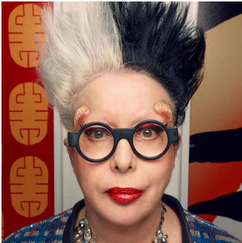
Slika 8. Orlan

dizajnerskim naočalama jarkih boja. Ne može se poreći da njezina umjetnost nije zabrinjavajuća, ali moramo priznati da je ujedno i intrigantna, zapanjujuća i pomalo uvrnuta. Prilikom jednog intervjua, novinaru je ponudila tzv. “relikvijar od mesa”, materijal koji je ostao nakon njezinih operacija koji naziva svojim tijelom, preciznije, svojim softverom. Zaključno, njezin rad nije toliko kontroverzan koliko su kontroverzne njene izdvedbene operacije. Velik dio toga je feministička kritika muške, zapadne umjetnosti.