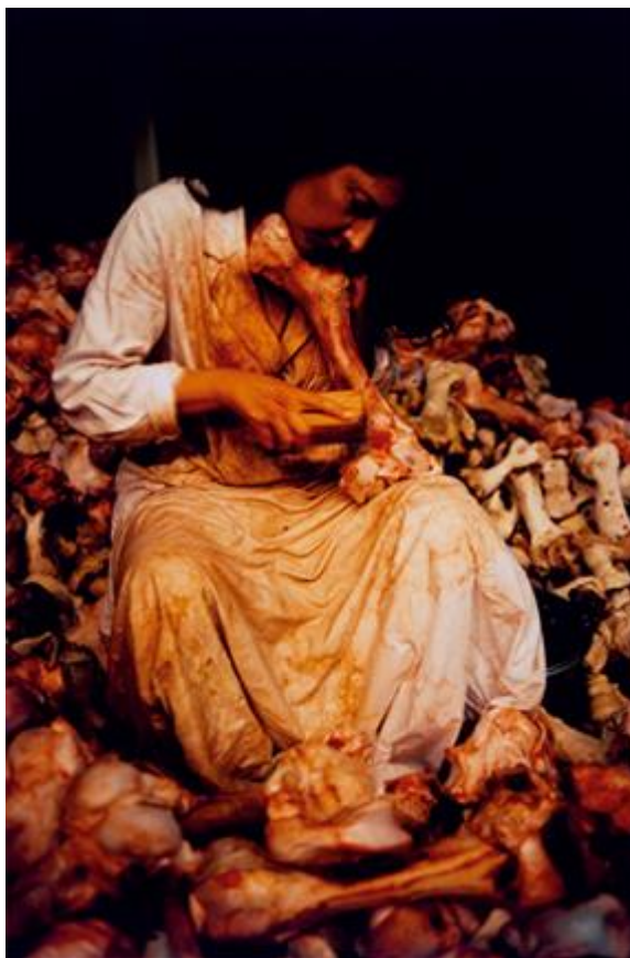
Slika 4. Marina Abramović „Balkan Baroque“ 1997.

U svojoj knjizi „Prolazim kroz zidove“ Abramović piše da se naslov performansa Balkanski barok nije odnosio na umjetnički pravac, već na baroknost balkanskog uma. Progovara o Balkanskom mentalitetu i tvrdi da ga je uistinu moguće razumjeti samo ako ste Balkanac ili ako ste dugo tamo živjeli. U ovom značajnom spektaklu, nagrađena je Zlatnim lavom za najboljeg umjetnika na Bijenalu. Cijelu svoju dušu dala je u taj performans, a u govoru zahvale rekla je: „Zanima me jedino umjetnost koja može promijeniti društvenu ideologiju. Umjetnost temeljena isključivo na estetskoj vrijednosti nepotpuna je.“ 23 Ispreplitanje moćnih triju radova oplakivalo je tragedije koje su zadesile njenu rodnu zemlju tijekom 1990-ih; posebice Hrvatski rat za neovisnost, kao i sukobe u Bosni i Hercegovini i na Kosovu. Balkanski barok danas je jedan od najvažnijih performansa Marine Abramović temeljen na ceremonijama i razaranjima koja leže u središtu njene prakse.