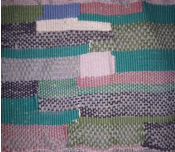
Slika 7. Dovršena tapiserija

Za svoj završni rad koristila sam tkalački okvir kakav se koristi za izradu tapiserija i zidnih ukrasa. Okvir se inače izrađuje od letvica/borovina, a na uglovima se učvrsti s vijcima. Čavlići u gornjoj i donjoj letvici moraju biti točno u liniji te se na zabijene čavlice nasnuju osnovine niti. Potka se pribija drvenim češljem ili ručno. Kako tkana površina ne bi bila jednolična, umeću se različite boje, tvore se motivi kako bi se dobila tapiserija ili zidni ukras.