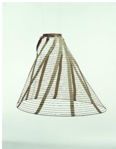
Slika 1. Krinolina u obliku kaveza - obruči od čelične žice i platnene trake, cca. 1865. g.

Šezdesetih godina devetnaestog stoljeća u svijetu mode došlo je do velikih promjena. Veliki utjecaj na tijek mode imao je Građanski rat u Americi, kao i odijevanje osamnaestog stoljeća. Tijekom 1860-ih godina veličina, to jest širina krinoline dosegla je svoj vrhunac, dok je muška moda prelazila u šire i lagane krojeve. Viktorijansko razdoblje u modi zabilježilo je mnoge promjene, kako u stilu, tako i u modnoj tehnologiji te načinima distribucije. Na modu su još utjecali i razni pokreti u arhitekturi, književnosti i vizualnim umjetnostima. Značajnom napretku mode također je pridonijela masovna proizvodnja šivaćih strojeva 1850-ih godina te pojava sintetičkih boja. Uspon pariške mode, počevši s modnom kućom koju je osnovao Charles Fredrick Worth, postavljat će trendove do kraja stoljeća. Silueta 1860-ih godina bila je definirana krinolinom u obliku kaveza ili suknjom s obručem, tzv. hoopskirt . On se pojavio krajem 1850-ih godina, a sastojao se od niza koncentričnih čeličnih obruča kružnog oblika pričvršćenih okomitim trakama. Krinoline su bile široko dostupne svim ženama i često ismijavane kroz razne crteže zbog veličina koje su dosežale, poput onih u rokokou. 1