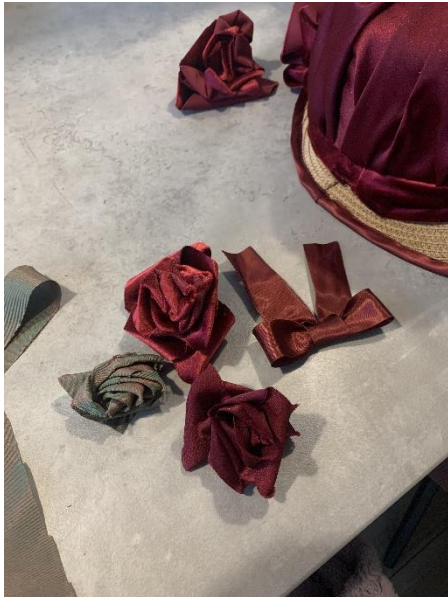
Izrađivanje ružica i mašne