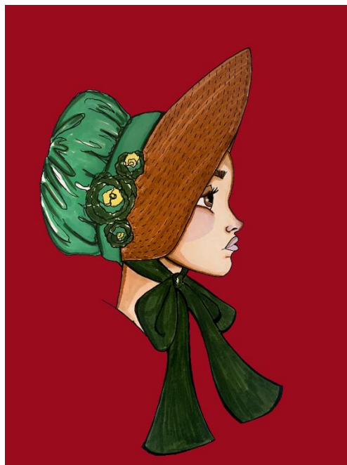
Šešir malog oboda

U sklopu eksperimentalnog dijela izrađivala sam dva šešira, jedan velikog i jedan malog oboda. Materijali koje sam koristila prilikom izrade šešira malog oboda su pliš u crvenoj boji i saten u bordo i zelenoj boji. Šešir odgovarajućeg oblika s obodom bilo je potrebno presvući u bordo satensku tkaninu koju sam pomoću vrućeg ljepila postavila na oglavlje i postepeno lijepila oko postojećeg oblika šešira. Nakon što sam presvukla željeno oglavlje, oko istog sam ušila traku pliša širine pet centimetara kako bih postigla izraženiju efektnost. Pomoću crvenog pliša izradila sam trake širine sedam, a duljine četrnaest centimetara koje sam potom ručno pričvrstila s unutrašnje strane oglavlja. Obod šešira obrubila sam kosom satenskom trakom u bordo boji. Pomoću ta tri materijala sašila sam i detalje u obliku ruža različitih veličina kojima sam ukasila šešir. Prilikom izrade šešira velikog oboda koristila sam crno-bijeli dekorativni materijal, kao i saten u zelenoj boji. Širina oboda iznosi 26 centimetara, a kako bih dobila na čvrstini između tih dvaju slojeva, postavljen je karton istog oblika. Za unutrašnji dio šešira koristila sam šešir u bijeloj boji koji je oblikom odgovarao istom. Traka zelenog satena koja obrubljuje unutrašnji šešir krojena je u kosini (45 stupnjeva) širine pet centimetara. Također, skrojila sam dvije trake zelenog satena širine sedam, a duljine četrnaest centimetara koje sam ručno ušila s unutrašnje