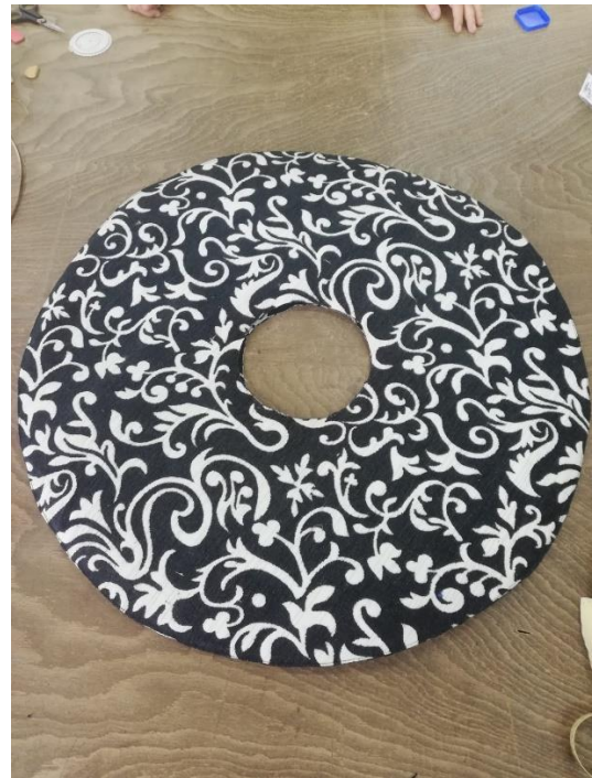
Izrada kroja oboda iz dekorativnog materijala