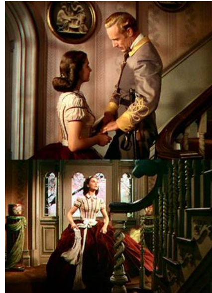
Slika 23. Scarlett u crveno-bijeloj haljini

Dok se napad Yankeeja na Atlantuu nastavlja, Scarlett se natjera da radi kao medicinska sestra u vojnoj bolnici, iako za to mjesto nikada nije bilo manje prigodnog ljudskog bića, što jasno možemo primijetiti iz ekspresija njezina lica – slično kao što nije htjela biti udovica, ne želi biti ni medicinska sestra, no život i okolnosti tjeraju je u ovaj vrlo neželjeni položaj. Ono što je sjajno u vezi s tim likom jesu sila i snaga s kojima se ona tome protivi. No, unatoč njezinom duhu i volji, cijeli joj se svijet ruši pod nogama, zbog čega se počinje odijevati u jednostavniju odjeću tamnijih boja i prigušenijeg tona. Svijetle, živopisne boje i bujne haljine iz njezinih dana na Tari su nestale.