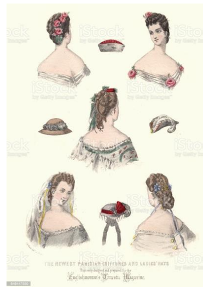
Slika 9. Moda oglavlja i frizura 1860-ih godina

1860. godine svjedočile su usponu jednog od najvažnijih likova u modi devetnaestog stoljeća, Charlesa Fredericka Wortha, koji se dan danas slavi kao „otac visoke mode“. Davne 1858. godine otvorio je vlastitu modnu kuću, zajedno sa svojim partnerom Ottom Gustafom Bobergom koji se bavio administracijom posla. Do 1860. godine, putem namjernog promicanja i pametnog marketinga, Worth je uveden u carske dvorske krugove i počeo je odijevati najelitnije francusko društvo, uključujući i caricu Eugenie. Tijekom 1860-ih, kuća Worth uživala je ogromni uspon i uskoro su joj klijentice bile aristokratske žene iz cijele Europe, kao i žene bogate društvene klase u Americi. Worthovi su dizajni bili poznati po svojim