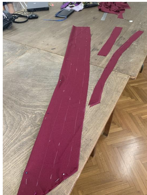
Krojenje traka za izradu ružica