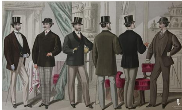
Slika 15. Muška silueta, 1871. g.

baršunastim oblogama, bio je najpopularniji oblik gornje odjeće, krojen do koljena 1870-ih godina. 14