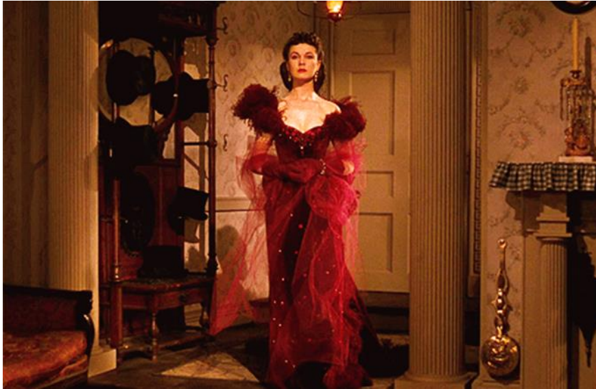
Slika 30. Scarlett u ikoničnoj crvenoj haljini na proslavi

prikladne dizajne izrađene od bogatih materijala poput baršuna. U tom razdoblju ženski kodeks odijevanja vlada strogim pravilima koja Scarlett krši kad stigne odjevena u svoju nevjerojatnu, ali odvažnu haljinu usred obiteljske proslave.