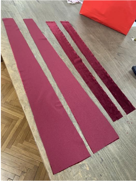
Krojenje traka od crvenog pliša