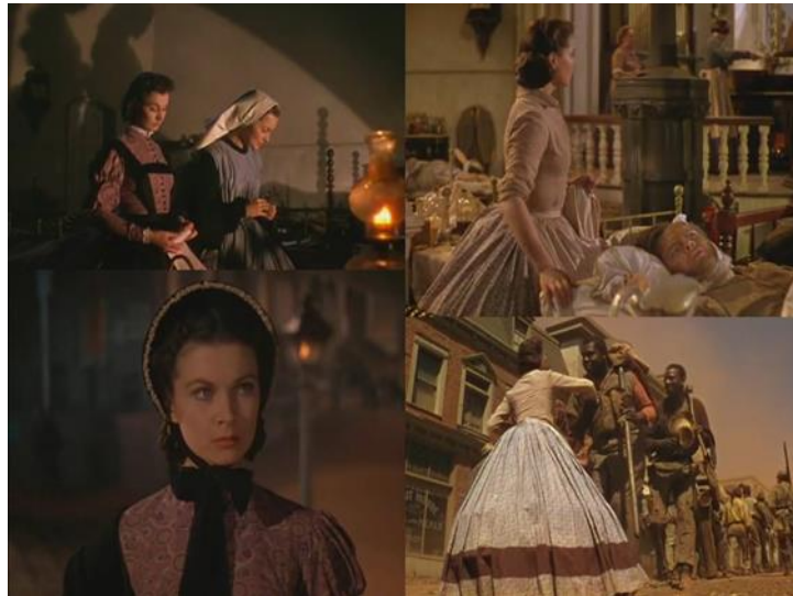
Slika 24. Scarlett nakon napada Yankeeja na Atlantuu