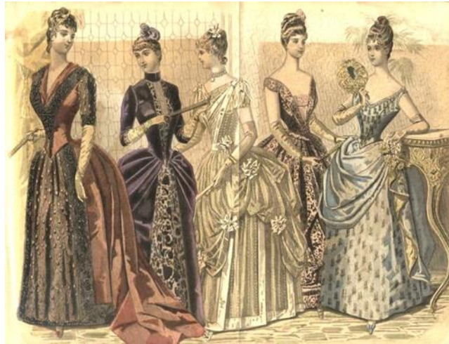
Slika 10. Ženska moda 1870-ih i 1880-ih godina

su do predstavljanja tzv. tea gown – haljine za čaj koje su se nosile doma, najčešće za druženje s prijateljicama, budući da su bile opuštenije forme i dopuštale su ženama da otpuste korzet ili da ga uopće ne nose. Frizure su se razradile – složene u puno čvorića i pletenica s kovrčama koje su ostavljene da slobodno padaju niz lice, a nosili su se i umetci (engl. waterfall hairstyles ), dok su šeširi bili manjeg oboda, ukrašeni trakicama i cvijećem. 10