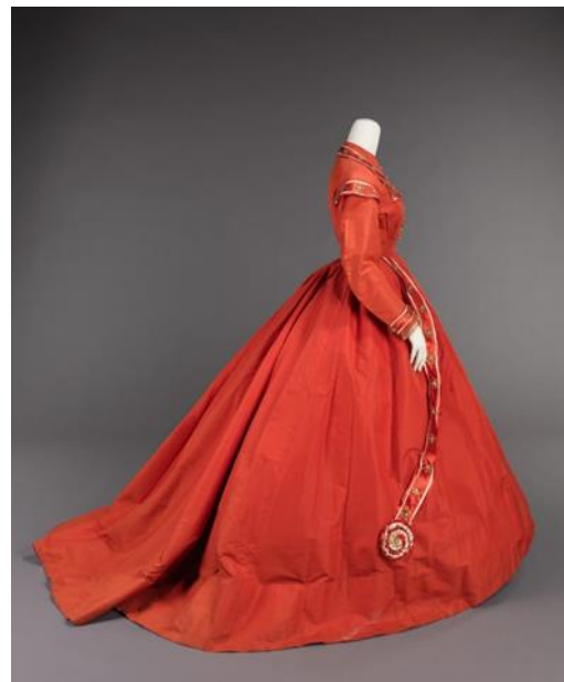
Slika 3. Poslijepodnevna haljina, cca. 1865. g.