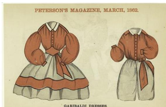
Slika 6. Garibaldi dresses , ožujak 1862. g.