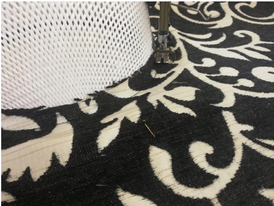
Spajanje oglavlja i oboda