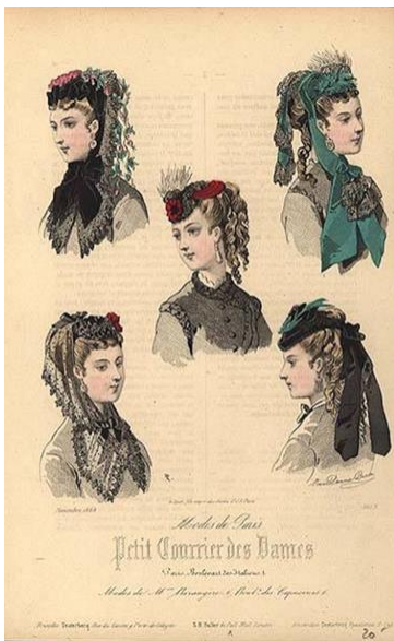
Slika 8. Moda oglavlja i frizura, 1868. g.

kovrčice koje su nježno padale niz lice, a žene bi ih upotpunjavale trakicama ili mrežicama za dnevne varijante, tzv. snood kojom bi obgrlile pundžu. Krajem desetljeća frizure su postajale sve kompleksnije i bogatije. Umjetna kosa postala je uobičajena, a prodavala se u uvojcima i pletenicama. Kako su frizure rasle u veličini i složenosti, snood je ispao iz mode. 7 Bonnet šesirić se i dalje nosio, manje kapice s tilom i mrežicom, cvijećem i trakicama, na sredini glave, te je mogao imati zaobljen obod ili biti malo sužen. Kako su krajem 1860-tih frizure postajale više i kompleksnije šesiri su se naginjali malo prema naprijed, tj. više prema čelu. Za svečane večernje prilike nosili su se ukrasi za kosu od dragulja, cvijeća ili voća.