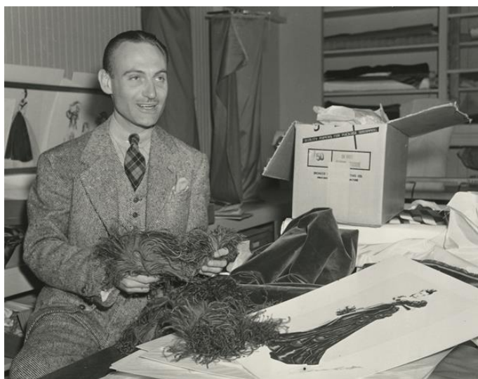
Slika 16. Walter Plunkett

Adams (1935), A Woman Rebel (1936), Zameo ih vjetar (1939), That Forsyte Woman (1949), Summer Stock (1950), Amerikanac u Parizu (1950), Showboat (1951.), Singin' In The Rain (1952.) i Raintree County (1957). 16 Nakon što je pročitao Zameo ih vjetar , Plunkett je bio toliko zarobljen pričom da je odmah nazvao svoje agente da zatraži posao kostimografa na filmu. Selznick je znao za Plunkettove kostime jer je s njim radio na filmu Little Women te je na licu mjesta angažirao dizajnera. Za svoje najpoznatije kostimografsko djelo u filmu Zameo ih vjetar , Plunkett je stvorio više od 5 000 zasebnih odjevnih predmeta za više od pedeset likova. U Plunkettu, Selznick je dobio zaposlenika koji je dijelio njegovu fanatičnu pozornost prema detaljima te je bio jako pedantan. Knjigu je pročitao više puta, provjerio svaki odlomak koji se odnosi na modu te sastavio knjigu zapisa od 200 stranica s citatima o kostimima. 17 Walter Plunkett deset je puta nominiran za Oscara, a 1951. godine priznat je za Amerikanca u Parizu , kada je nagradu podijelio s kolegama kostimografima Orry-Kellyjem i Irene Sharaff. Plunkett se povukao 1966. godine nakon što je radio u filmovima, na Broadwayu i za Metropolitan Opera. Posljednje godine života proveo je sa svojim partnerom Leejem. Walter je umro 1982. godine, ostavivši Leeju svoje imanje. 18