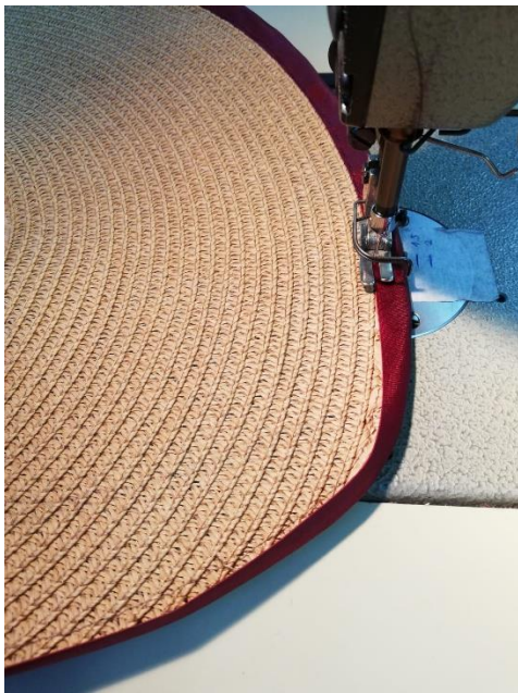
Ušivanje satenske kose trake na obod šešira