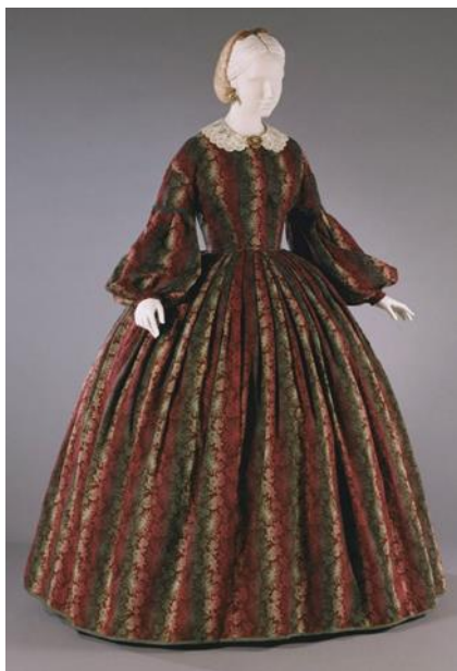
Slika 2. Dnevna haljina, 1860. – 1862. g.

Obruči su bili relativno pristupačni, stvarajući modu koja se nosila u cijelom društvu, iako je takva moda često bila predmetom ismijavanja jer su ženske suknje zauzimale sve više prostora na nogostupima, klupama i dvoranama. Tijekom desetljeća oblik krinolina suptilno se mijenjao, mijenjajući s njim cijelu siluetu. 1860. godine obruč je bio ogroman, koji je gotovo jednako kružan cijelim putem. Otprilike 1862. godine tzv. hoopskirt počeo se povećavati prema leđima, postajući piramidalnog oblika, do 1868. godine sprijeda se spljoštio, dok je većina volumena bila sa stražnje strane. Zapravo, 1868. godine počinju se nositi tzv. crinolette , serija poluobruča koja podržava volumen samo straga. 2