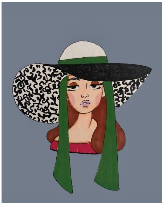
Šešir velikog oboda