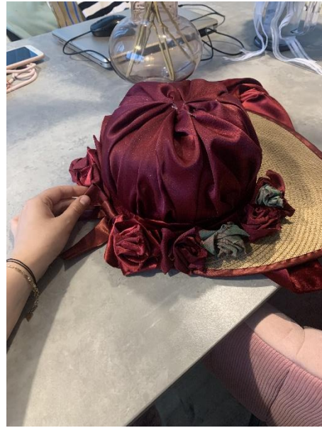
Postavljanje (lijepljenje) ružica na šešir