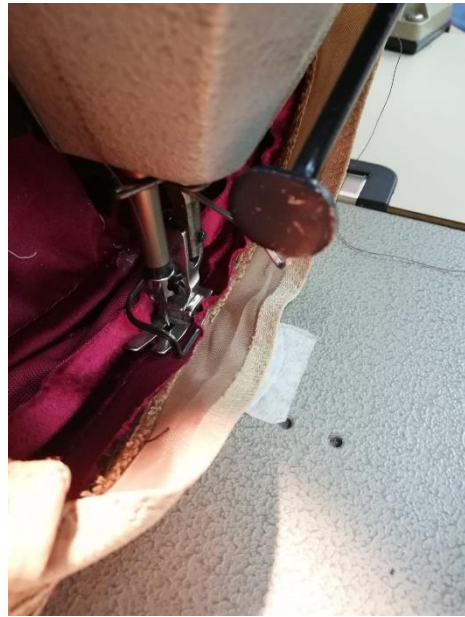
Spajanje oglavlja i oboda