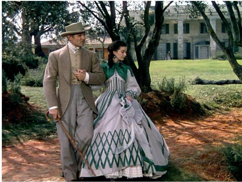
Slika 28. Scarlett u bijelo-zelenoj haljini nakon vjenčanja s Rhettom

potpuno podsvjesno, izbrisati dio svog života koji joj se zapravo nikada nije sviđao, zbog čega se vraća svojoj staroj projekciji slike o samoj sebi.