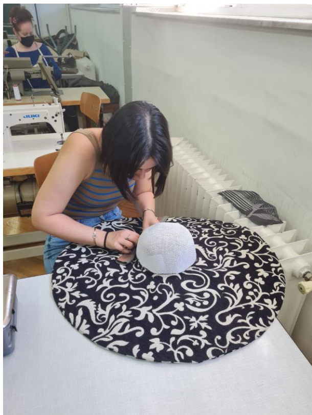
Ručno ušivanje zelene trake na mjestu spajanja oglavlja i oboda