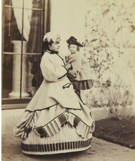
Slika 5. The Crown Princess of Prussia i Prince Henry , listopad 1863. g.

1860-ih godina, trend za suknje uparene s bluzama, za razliku od dosadašnjeg odgovarajućeg prsluka, počeo je prevladavati u ležernoj dnevnoj odjeći, osobito među mladim djevojkama. Najznačajnija vrsta ženske bluze bila je tzv. garibaldi bluza, nazvana po talijanskom borcu za slobodu Giuseppeu Garibaldiju, a inspirirana vojnom odorom. Tradicionalno izrađena od grimizne merino vune s crnom pletenicom i gumbima, imala je visoki izrez i pune rukave skupljene u usku manžetu. 5