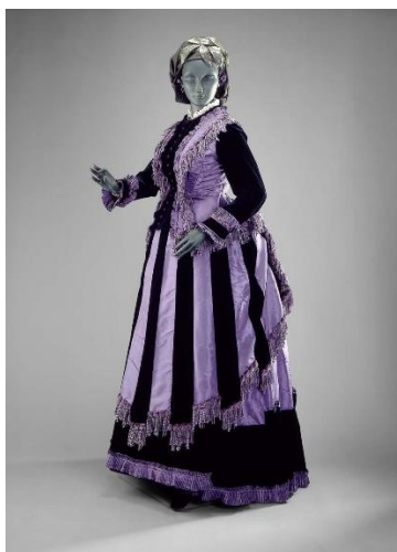
Slika 12. Dnevna haljina, 1870. g.