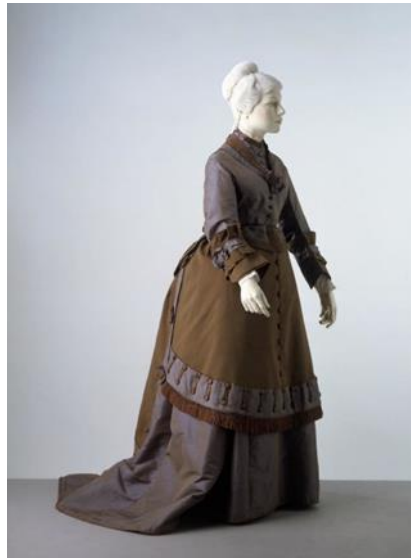
Slika 4. Haljina, 1868. – 1869. g.

Ženska odjeća sastojala se od steznika, rukava različitih stilova, te široke suknje koja je dodirivala pod. Konstrukcija krinoline s metalnim obročima, tzv. cage (kavez) iskosi, nosila se preko tzv. chemise haljine, gaćica i steznika. Steznici su se skraćivali jer nije bilo potrebe za ograničavanjem kukova. 3 Općenito, u ovom razdoblju korzeti nisu bili usko vezani, već je sama veličina suknji činila struk malim. Položaj struka u 1860-im godinama opet se malo povisio, stvarajući dojam kraćeg struka. Oko 1868. godine gornja se haljina znala podizati i vezati kako bi se vidjela donja haljina; naročito su to bile dnevne haljine pogodne za duge šetnje ili, pak, sportske varijante. S obzirom na to da su se donje haljine vidjele, ukrašavale bi se trakicama, resicama ili su bile jarkih boja. Tijekom cijelog desetljeća, dnevni steznici imali su dugačke rukave i visoke vratne izreze. Široki pagoda rukavi u obliku zvona iz 1850-ih bili su i dalje prisutni, dok su se donji engeantes rukavi mogli složiti u obliku balona te bi cijeli obujam bio veći. Rukavi 1860-ih sve su se češće počeli zatvarati na ručnom zglobu, te su poprimili mnoge varijante. Nosili su se mobilni ovratnici i pojasevi. 4