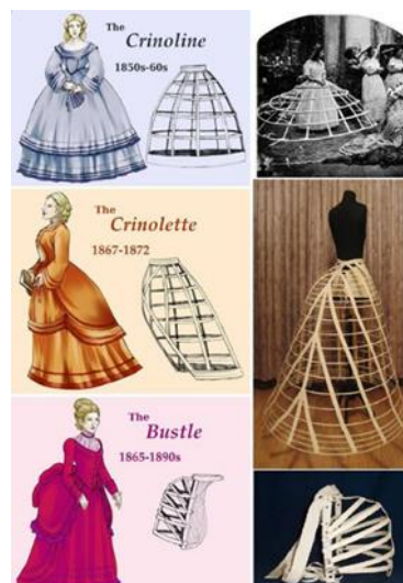
Slika 7. Crinolina, Crinolette, Bustle

Za večernje haljine vratni se izrez spuštao, odnosno mogao je biti ravan ili se spuštati lagano sa svake strane u sredinu prsa. Nosila se i tzv. bertha – ovratnik izrađen od čipke ili druge tanje tkanine, generalno ravan ili zaobljen, a naglašavao je ženska ramena. Rukavi za večernje izlaske bili su kratki, ponekad upotpunjeni s naramenicama. Što se tiče vanjske odjeće, šalovi su i dalje bili omiljeni, posebice jer su široke suknje bile savršena površina na kojoj se mogao prikazati veliki Paisley ili „indijski“ šal. Krajem desetljeća nosile su se i paletot jakne koje su bile \frac{3}{4} dužine i opuštenih rukava koji se nježno drapirao od ramena do poruba.