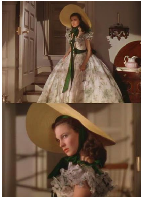
Slika 19. Scarlett u haljini na roštilju Twelve Oaks

odrasla djevojčica. Dodajući mu i zelene elemente koji ukazuju na njezinu otrovnu zavist i ambiciju koji se pojavljuju prvi put tijekom piknika dok pokušava, ali i ne uspijeva, otjerati Ashleyja Wilkesa od spomenute Melanie. Također, dodatni gigantski šešir učvršćuje njezinu koketnu narav. Iako je to bio poslijepodnevni roštilj, Scarlett je inzistirala da obuče tu haljinu kratkih rukava koji su bili primjereni samo za večer, kako bi privukla pažnju svog voljenog Ashleyja. Ova haljina možda je najikoničnija reprezentacija klasičnog prijeratnog južnjačkog stila. Možda je djevojčica, ali zna i voljna je koristiti svoje čari. „Donje rublje 1860-ih koje možemo vidjeti na sceni gdje se Scarlett priprema za roštilj sastojalo se od košulje, korzeta, lepršave podsuknje s mnoštvom volana i krinoline. Tek se od 1850-ih godina donje rublje moglo raskošno dekorirati čipkom i mašnama, što se prije smatralo nemoralnim.“ 24