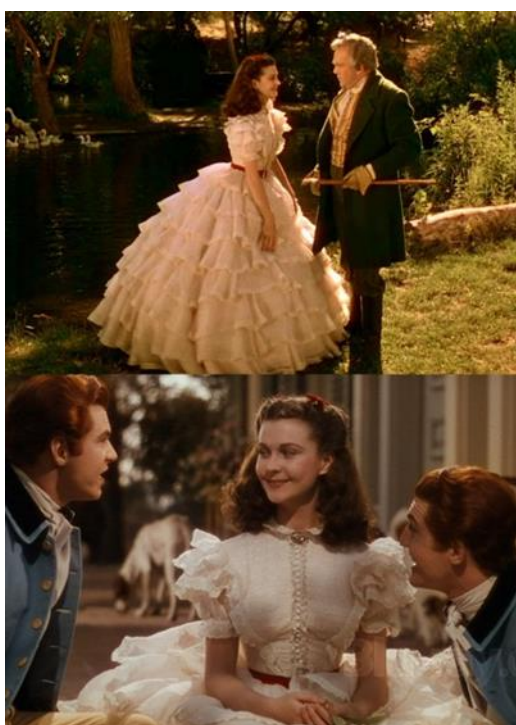
Slika 18. Scarlett O'Hara u bijeloj haljini s volanima

Scarlett O'Hara lik je veći od života i sila na koju treba računati – ona je lik koji balansira ambiciju, odlučnost i snagu. Ona je središnji lik filma, zbog čega je neizbježno usredotočiti se na nju kada govorimo o kostimima filma. Njezin ormar nije samo ikoničan, već prikazuje i čitav njezin lik. Walter Plunkett ispričao je priču o ovom nevjerojatnom liku kroz svoje kostime, ostavljajući nam ogromnu lekciju o narativnom dizajnu na koju će se pozivati mnogi nadolazeći dizajneri. Kada prvi put upoznamo Scarlett, ona je tek dijete – razmažena djevojčica koja je uvijek uživala u svim blagodatima i privilegijama svog statusa, ali još uvijek dijete. Sukladno tome, predstavljena je u velikoj bijeloj haljini s volanima.