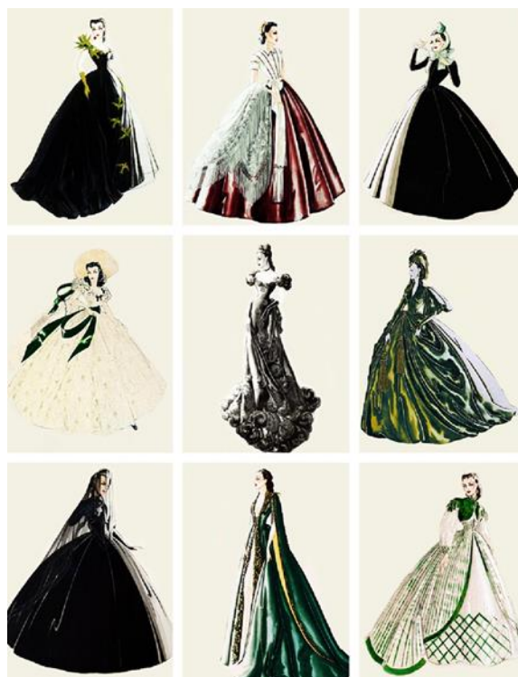
Slika 17. Plunkettove skice za film Zameo ih vjetar