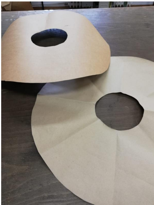
Izrada kroja oboda iz čvrstog kartona