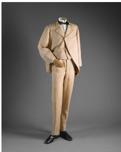
Slika 14. Tzv. sack odijelo, 1865. – 1870. g.

Što se tiče gornje odjeće, chesterfield kaput obrubljen pletenicom i svilenim baršunastim oblogama bio je popularan oblik gornje odjeće. Košulje, koje su se češće skrivale ispod jakni s visokim gumbima, sada su bile jednostavnije nego prijašnjih desetljeća. Ovratnici košulja nisu bili posebno visoki, a često su bili preklopljeni, upotpunjeni raznim kravatama. Prsluci su obično bili jednostruki i često su imali šal ovratnik. Muškarci su kosu nosili u visini ušiju, uredno razdijeljenu i začešljanu na stranu, a meki se val smatrao privlačnim. U modi su bili različiti brkovi, uključujući podrezane brade. Svileni cilindrični šešir ostao je prevladavajući izbor, dostigavši visoke visine ranih 1860-ih.