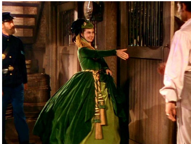
Slika 25. Scarlett O'Hara u haljini od zelenih zavjesa

Ta je haljina bez sumnje jedna od najprepoznatljivijih haljina u filmu. Ova haljina nije samo savršen odraz Scarlettine osobnosti, već je nevjerovatna izjava o tome gdje se nalazi u filmu i kamo planira otići. Zelena boja temeljito je uspostavljena kao vizualni prikaz njezine sumnjičave i spletkave naravi, a točno to ova haljina i predstavlja – masku s kojom se pretvara da je nešto što nije, samo kako bi dobila ono što želi. Na neki način ova haljina predstavlja ključnu promjenu u njezinom karakteru. Prije se drugačije odijevala i koketno se ponašala jer je mislila da to rade žene, a sada to čini isključivo kako bi dobila ono što želi. I tako, ona odlazi u zatvor odjevena kao dama jer zna da je to jedini način na koji će Rhatt obratiti pažnju na nju. Upravo je zbog toga ova haljina toliko kulturna – sjajno uspijeva izraziti njezinu sposobnost da izvuče maksimum iz svih okolnosti u kojima se nađe. Što ako nema novca za kupiti haljinu? Napraviti će jednu od zavjesa.