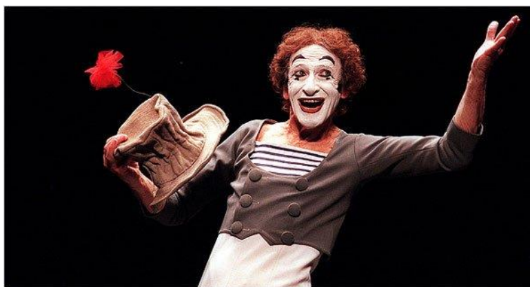
Slika 13 Marcel Marceau kao klaun Bip, nastup u New Yorku, 1999.

Marcel Marceau (1923.-2007.) bio je francuski glumac i pantomimičar, najpoznatiji po scenskom liku klauna Bipa. Marceau je najpoznatiji pantomimičar u svijetu. Njegov klaun bijela lica Bip, karakteriziran kao melankolična skitnica baziran je na liku francuskog Pierrota te je igrao na pozornicama, kao i na televiziji i filmu. Pantomimu je smartao umjetnošću tišine te je profesionalno nastupao diljem svijeta. Studirao je dramske umjetnosti i pantomimu u Parizu, a 1978. godine osnovao je školu pantomime École Internationale de Mimodrame de Paris razvijajući umjetnost mime i prenoseći znanje kao glavni izvođač i učitelj.