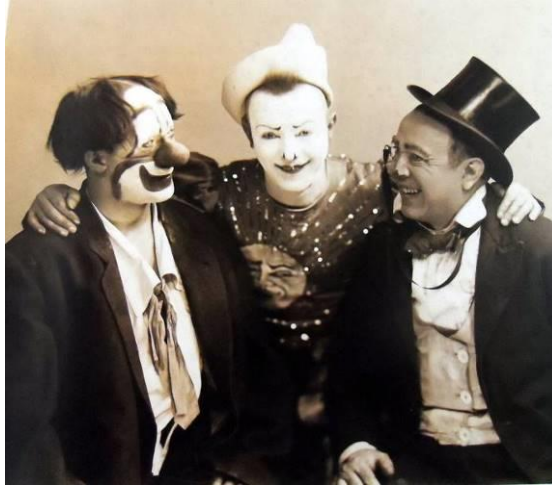
Slika 14 Braća Alberto, Francois i Paolo Fratellini, najpoznatiji cirkuski klaunovi između 1900. i 1920.

i kaskaderi Fratellini-Craddocks , Françoisovi sinovi, a u 1980-ima i 1990-ima Tino (1947-93). Paulova unuka Annie (1932-97), koja se proslavila jedinstvenom osobnošću žene-klauna, utemeljila je 1972. Državnu školu cirkusa u Parizu. 30