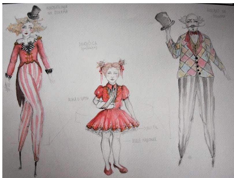
Slika 20 Kostimografske skice za predstavu, akrobatkinja, djevojčica, akrobat