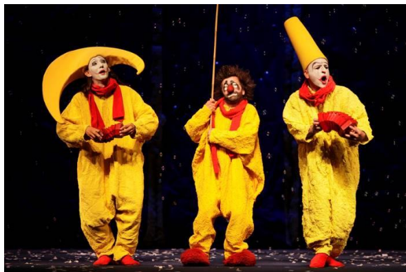
Slika 15 Slava's SnowShow

Likovni dio rada baziran je na estetici cirkusa i bogat je bojama, a kostim bijelog klauna, odnosno dio rada koji je potrebno izraditi je u kontrastu s ostatkom vizualnih elemenata predstave. Inspiracija je potekla iz cirkusa, commedije dell'arte i kazališnog klauna. Kostimi poznatog klauna Slave Polunina utjecali su na izbor željenog kroja kostima koji je potrebno izraditi. Kostimi u njegovom SnowShowu su podijeljeni u dvije grupacije. Jedna grupa izvođača odjevena je u žute kostime s crvenim detaljima, vizualno vrlo efektno, te toplim bojama naglašen je njihov pozitivan karakter. Druga grupa sastoji se od negativnih likova te su odjeveni u kostime tamnijeg spektra boja, variraju od maslinasto zelene, smeđe, crne i sive boje. Također, glavni motiv je lik francuskog Pierrota kao najznačajnijeg karaktera koji se bavi pantomimom, govorom tijela, osjećajima i mislima, a odjeven u bijeli kostim.