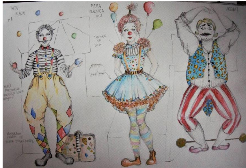
Slika 18 Kostimografske skice za predstavu, tata, mama i akrobat