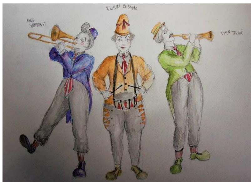
Slika 21 Kostimografske skice za predstavu, tri klauna glazbenika

Zamišljeni su kao tri klauna, dvojica su odjeveni u frakove, dok je središnji lik u odijelu. Jedan svira trombon, drugi bubanj, a treći trubu te djeluju kao tandem. Kao trio se uvijek pojavljuju zajedno, a boje njihovih gornjih dijelova kostima su sekundarne - ljubičasta, narančasta i zelena. Povezuju ih detalji istih boja i uzoraka, a hlače su sive.