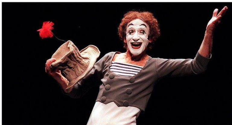
Slika 13 Marcel Marceau kao klaun Bip, nastup u New Yorku, 1999.

Marcel Marceau (1923.-2007.) bio je francuski glumac i pantomimičar, najpoznatiji po scenskom liku klauna Bipa. Marceau je najpoznatiji pantomimičar u svijetu. Njegov klaun bijela lica Bip, karakteriziran kao melankolična skitnica baziran je na liku francuskog Pierrota te je igrao na pozornicama, kao i na televiziji i filmu. Pantomimu je smartao umjetnošću tišine te je profesionalno nastupao diljem svijeta. Studirao je dramske umjetnosti i pantomimu u Parizu, a 1978. godine osnovao je školu pantomime École Internationale de Mimodrame de Paris razvijajući umjetnost mime i prenoseći znanje kao glavni izvođač i učitelj.