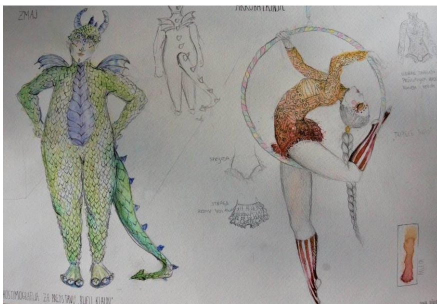
Slika 19 Kostimografske skice za predstavu, zmaj i akrobatkinja