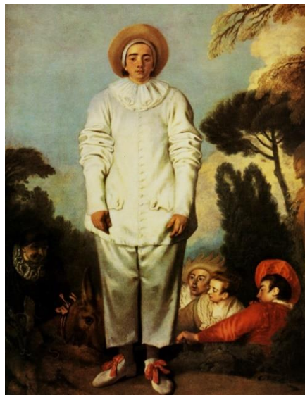
Slika 7 Gilles ili Pierrot i ostala četiri lika Commedije dell' arte, autor Wattau, 1718, Musee du Louvre, Paris

U 17. st. Pierrot je još uvijek bio pod utjecajem Pedrollina i njegove lukave i smjele prirode ili kao statički i miran lik, ovisno o scenariju izvedbe. U to vrijeme najznačajniji dramaturzi su Jean Palaprant, Antoine Houdar de la Motte i najpoznatiji Jean Francois Regnard često su smještali Pierrota u središta ranje. Pierrotov karakter se mijenjao, djelovao je kao anomalija među zauzetim i karizmatičnim likovima koji ga okružuju. On je prilično usamljen, drugačiji, međutim, komičan i nosi svojevrsan patos. Antoine Watteau (1684.- 1721.) bio je francuski slikar koji je najviše slikao teatralne momente commedie Italiane i baleta, no posebno su izraženi njegove kompozicije s Pierrotom u središtu. Na tim djelima Pierrot je sanjivi poetski lik, na neki način izoliran od ostalih likova, s zagonetnim izrazom lica. Odjeven je u bijeli satenski kostim. Gornji dio kostima je košulja na gusto kopčanje s nabranim rukavima iznad laktova što sugerira da su bili značajno duži od njegovih ruku. Donji dio čine široke hlače koje su perekratke, otkrivaju njegova stopala i gležnjeve što je u suprotnosti s rukavima gornjeg dijela. Ima mali nabrani ovratnik te šešir na glavi.