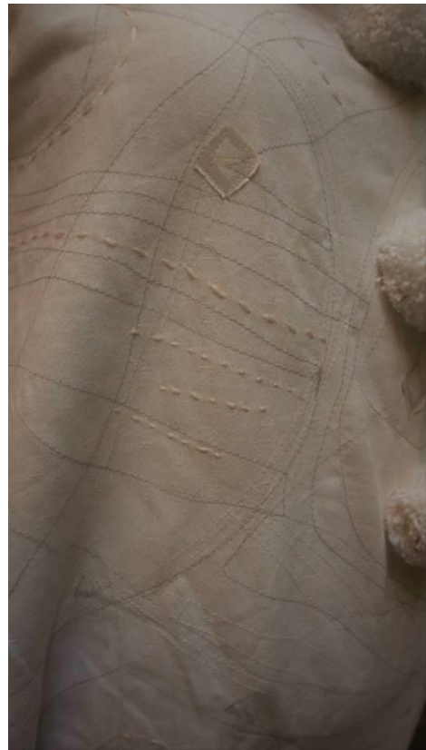
Slika 26 i 27 Detalji izrađenog kostima