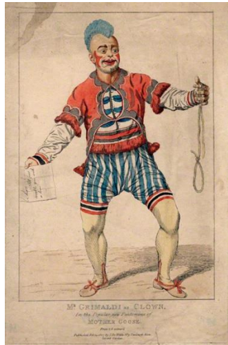
Slika 8 Klaun Joey, 1807.

na oba obraza. Postoje razne teorije o trokutima na licu. Prema nekim izvorima trokuti su simboli preuzeti s Harlekinova kostima. Drugi izvori navode da je želio stvoriti jak kontrast i izražajnost koja bi se mogla vidjeti jednako iz zadnjih redova kazališta. Neke teorije navode da je želio pridonijeti parodiji izvedbe te je njegova šminka satiričan komentar na dendije tog vremena. 27 On je prvi klaun koji je lice bojao u bijelo što je utjecalo na gotovo sve buduće naraštaje klaunova.