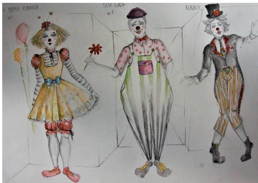
Slika 17 Kostimografske skice za predstavu, mama, tata, klaun

Sljedeća skica ponovno prikazuje mamu i tatu, također u ulogama kalaunova. Ovdje su njihovi kostimi bogatijeg kolorita, teksturalno naglašeniji s više uzoraka, nego u prošlom primjeru. Ponavljaju se uzorci točkica, pruga i rombova. Također imaju crvene noseve i klaunske cipele.