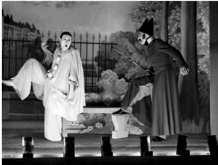
Slika 11 Film Les Enfants du paradis Marcela Carnea, 1945.

Deburau je kreirao lik Pierrota kao dominantnu ulogu francuske pantomime. Preuzeo je lik Pedrolina iz commedije dell'arte te stvorio novu figuru, poetičan i misteriozan karakter tužnog klauna. Pierrot je bio djeven u vrećasti bijeli kostim s uskom crnom kapicom te dječaćkim načinom izvođenja, optimističan ali razočarani ljubavnik, šarmirao je publiku i kritičare. Nakon Deburauove smrti, sin Charles nastavio je karakter Pierrota na Funambulesu . Njegova figura, melanholični i vječno zaljubljeni Pierrot u dugom bijelim kostimu, koji u tišini podnosi bol neuzvraćene ljubavi, bila je tada u kontrastu s karakterima melodrame, koji su tada bili u modi.