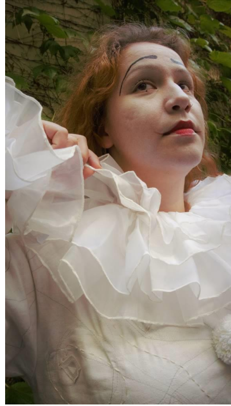
Slika 24 i 25 Izrađen kostim bijlog klauna