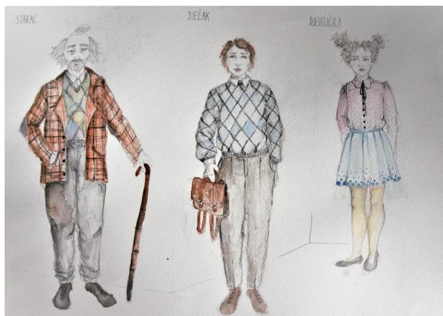
Slika 16 Kostimografske skice za predstavu, starac, dječak i djevojčica