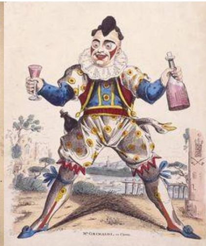
Slika 9 Joseph Grimaldi kao klaun Joey