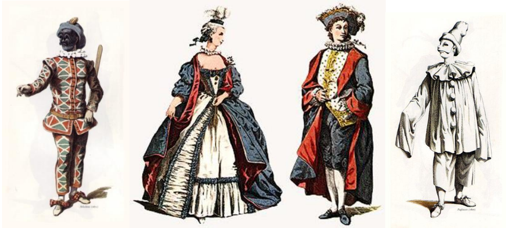
Slika 3, 4 i 5 Arlecchino, Inamoratti i Pedrolino