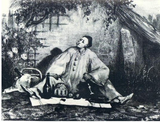
Slika 10 Litografija Augustea Bouqueta prikazuje Deburaua kao Pierrota, oko 1830.

Deburau je kreirao lik Pierrota kao dominantnu ulogu francuske pantomime. Preuzeo je lik Pedrolina iz commedije dell'arte te stvorio novu figuru, poetičan i misteriozan karakter tužnog klauna. Pierrot je bio djeven u vrećasti bijeli kostim s uskom crnom kapicom te dječaćkim načinom izvođenja, optimističan ali razočarani ljubavnik, šarmirao je publiku i kritičare. Nakon Deburauove smrti, sin Charles nastavio je karakter Pierrota na Funambulesu . Njegova figura, melanholični i vječno zaljubljeni Pierrot u dugom bijelim kostimu, koji u tišini podnosi bol neuzvraćene ljubavi, bila je tada u kontrastu s karakterima melodrame, koji su tada bili u modi.