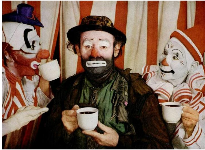
Slika 6 Emmett Kelly i njegov "Weary Willie" karakterni klaun (u sredini) i dva whitefacea iz Ringling Bros. and Barnum & Bailey Circus, 1953.

moguća je pruzimanje elemenata Whitefacea i Augustea. Kostimi su im komična i groteskna verzija uniformi ili odjeće karaktera kojeg igraju. 25