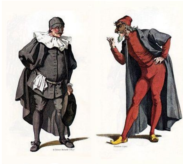
Slika 1 i 2 Likovi commedije dell' arte , Il Dottore i Pantalone