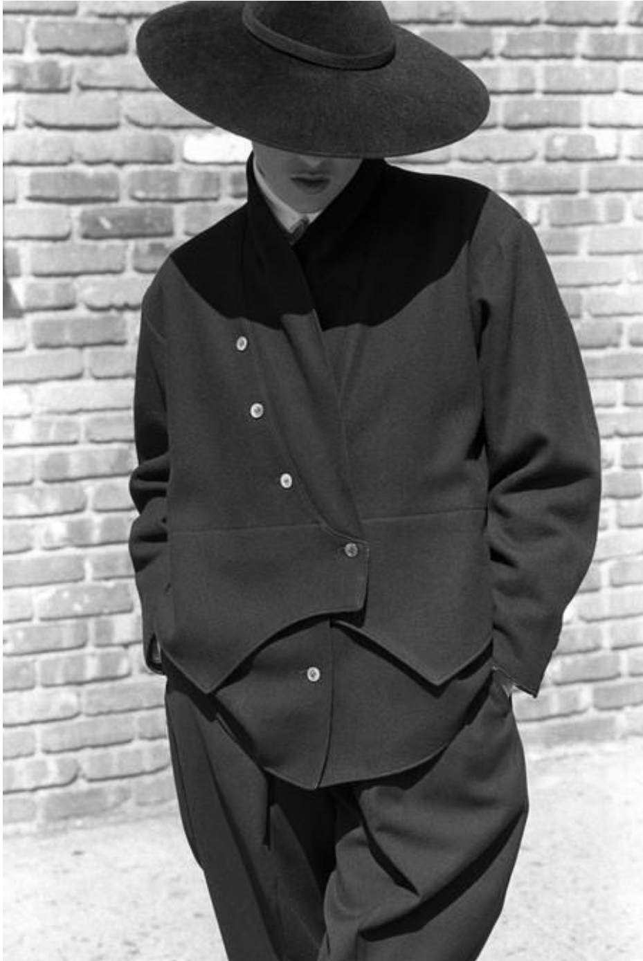
Slika 10. Dekonstruirana silueta iz ready to wear kolekcije jesen/zima, 1981. godina [10]

Konstrukcija tijela modela bila je važan čimbenik prilikom ovih revija, jer je ona određivala kako će slojevi odjevnih komada padati na tlo, čineći jedinstvenu siluetu. Ovime postaje jasno da tijelo i odjeća postaju jedno, zajedno tvore jedinstvenu izvedbu. Predimenzionirana odjeća također je bila u funkciji skrivanja spolnog identiteta nositelja, ostavljajući dojam nedorečenosti. Spolno – neutralan pristup odjevnom komadu Yamamoto dijeli s Kawakubo,