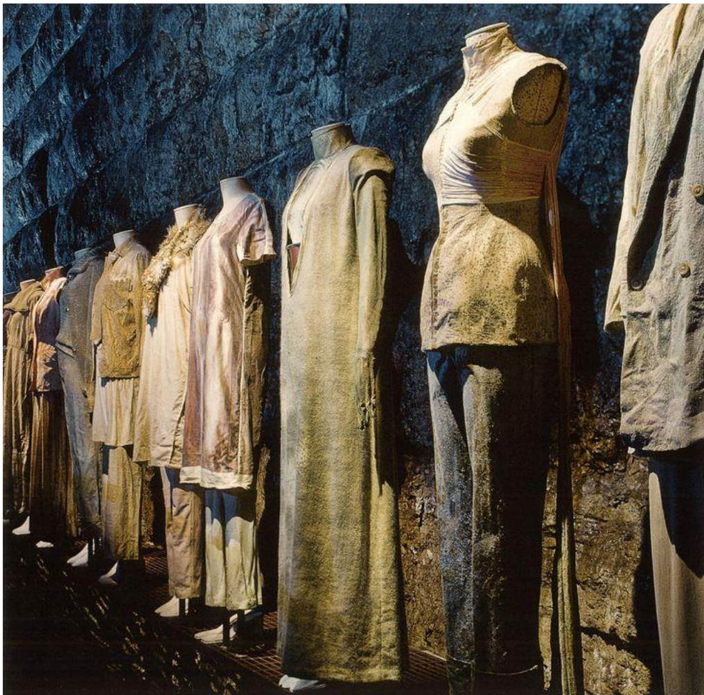
Slika 21. Kolekcija 9/4/1615, Rotterdam, 1997. [21]

Čini se da dizajner poput Margiele ima nešto za reći o djelovanju odjeće kao okviru tijela i, potencijalno, utjecaju mode, kao mehanizma, strukture ili diskursa, odnosno kao (pozivajući se na Barthesa) modni sustav s ogromnim kulturnim, ekonomskim i ontološkim učincima. Pod modnim sustavom mislim na industriju i njezinu prateću infrastrukturu koja donosi redovite promjene u muškoj i ženskoj odjeći i tijelu. [Gill: 1998:27].