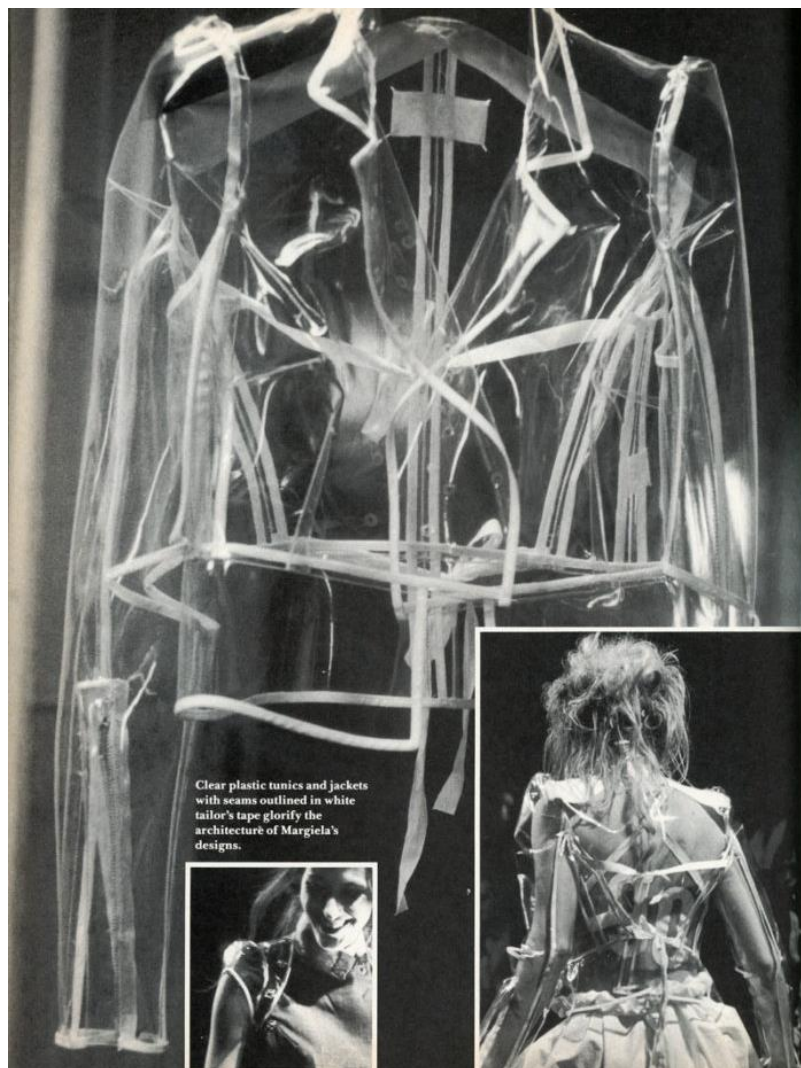
Slika 6. Revija Martina Margiele (1989.) kroz oko i kritiku Billa Cuninghama, ožujak 1990. godine; časopis Details [6]

Nakon što je Derrida predstavio seciranje binarnih opozicija kao svojevrsnu kritiku zapadnjačke kulture (u svojem djelu Of Grammatology ), tako su je dizajneri 80ih i 90ih objeručke prihvatili i također je pretvorili u kritiku mode toga doba. Posebice kritiku prikaza savršene modne siluete: Igrajući se idealiziranim tijelom, moda dekonstrukcije osporila je tradicionalne suprotnosti između „subjekta“ i „objekta“, „iznutra“ i „izvana“... „tijela“ i „odjeće“ [Loscialpo 2011:7-8].