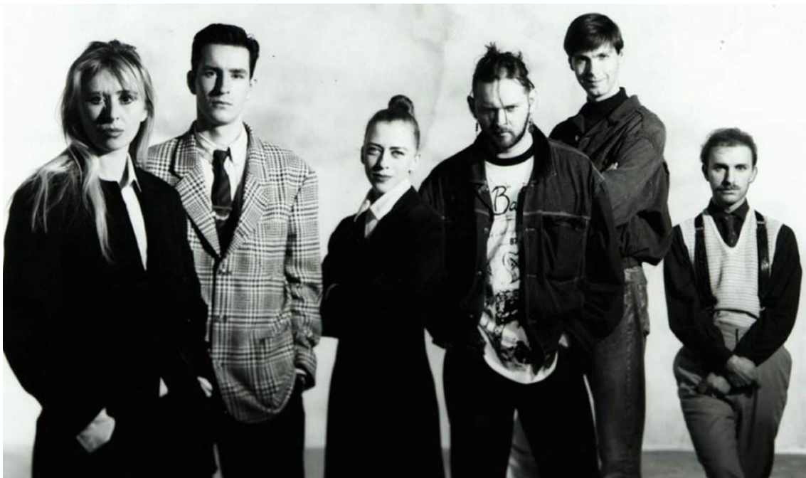
Slika 15. The Antwerp six, 1986. godina [15]