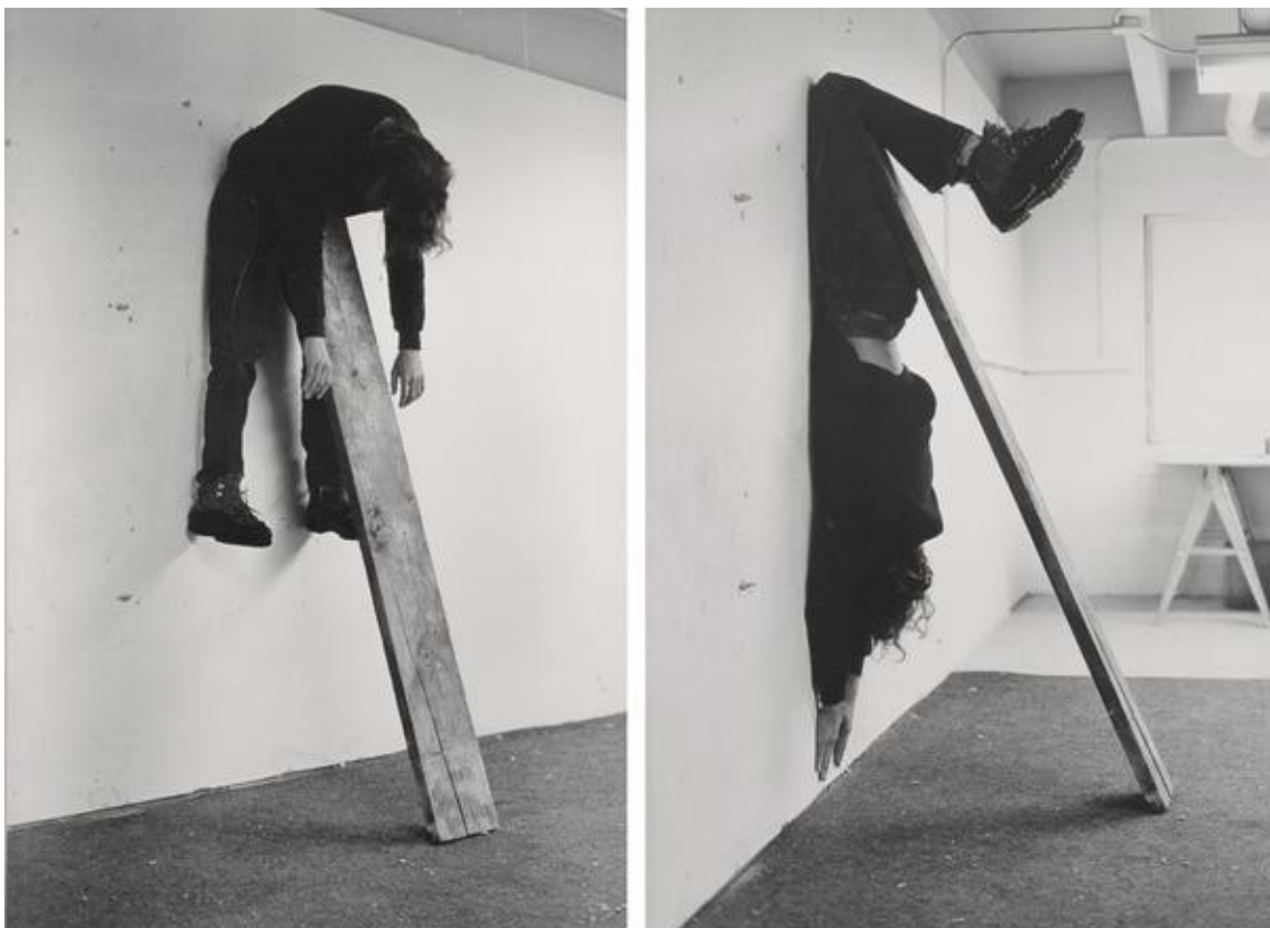
Slika 2. Charles Ray: Plank Piece I i II; performans [4]

Pojam performansa počinje se koristiti 1970ih godina prošlog stoljeća. Dolazi od engleske riječi performance te označava oblik izvedbe koji se razvio iz tradicije i likovnih i predstavljačkih umjetnosti. Performans se njima suprotstavlja svojom ekspresivnom, žanrovskom, intermedijalnom i interkulturnom hibridnošću što ga čini jedinstvenim oblikom izvedbe. Iako se pojam počinje koristiti tek 1970ih godina prošlog stoljeća, njegovi začeci sežu u početak 20. stoljeća te ga se povezuju s futurizmom, dadaizmom, nadrealizmom, flaksusom koji su bili skloni fragmentaciji, kolažu, simultanosti i provokaciji. Kasnije se performans širi i na američki kontinent gdje dolazi u doticaj s happeningom (oblikom umjetnosti u kojoj se koriste raznolika izražajna sredstva u obliku usporedno ili raspršeno izvedenih nepredvidljivih događaja koji gledatelja navodi na aktivno sudjelovanje) . Performans ima elemente kazališta, plesa, pantomime, glazbe ili cirkusa. Tako dolaze do izražaja osnovni elementi u igri; vrijeme, prostor, tijelo umjetnika, dramaturgija.