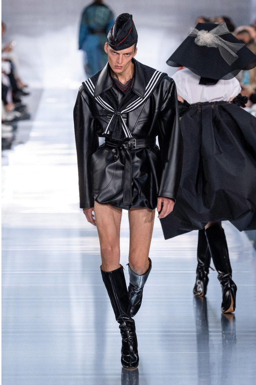
Slika 25. Kontroverzni hod modela na reviji Maison Margiela S/S 2020 [25]

najznačajnijih britanskih dizajnera odličnom idejom uzimanja povijesnih događaja koji su nepovratno unazadili svijet u proteklom stoljeću, ukazuje kakve posljedice Brexit može imati.