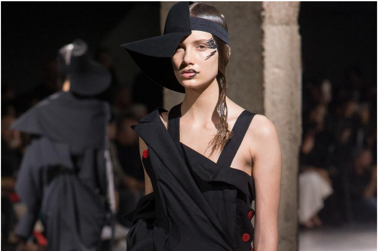
Slika 11. Yamamoto: asimetrijom do savršenosti, ready to wear S/S 2018. [11]

koja je također brisala granice između muškog i ženskog predstavljanja odjećom. Kasnije se u njegovom radu mogu vidjeti i tzv. dvije podijeljene siluete koje gledateljima prezentiraju dva potpuno različita identiteta. To je vidljivo i na reviji iz 2018. godine gdje modeli hodaju podijeljenih šešira i haljina, formirajući dvije potpuno različite slike ovisno o promatračevom kutu gledanja. Ovaj način prezentiranja asimetrije i nesavršenosti nastao je iz ideje da ljudsko tijelo nije nikada simetrično te se rađa nova percepcija savršenosti.