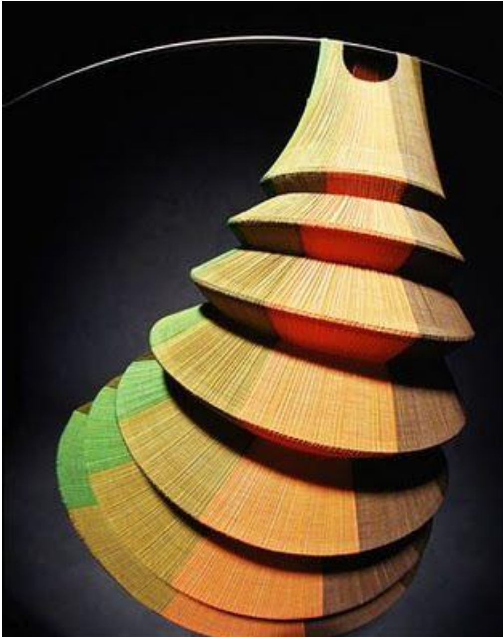
Slika 13. The minaret dress – Pleats please, 1993. godina [13]

Njegovo promišljanje i dekonstruiranje zapadnjačkih konvencija sugerira nošenje odjeće na nekoliko načina, što je vidljivo kroz cijelu njegovu karijeru. Primjerice, primjenom nove, napredne tehnologije, stvorena je nabrana haljina za njegovu kolekciju proljeće/ljeto iz 2010. godine. Sadržavala je nekoliko različitih otvora za glavu i tri rukava umjesto dva, na taj način nositelj je imao mogućnost da sam odluči kroz koji otvor ili rukav želi nositi odjevni predmet.