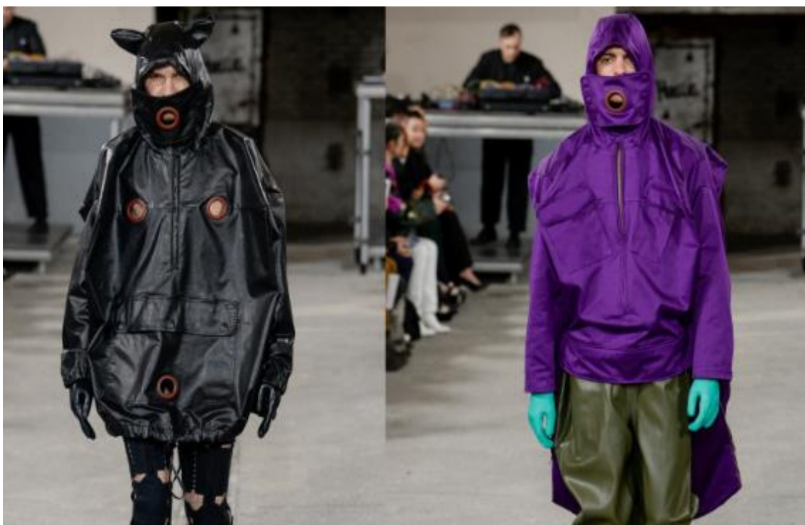
Slika 19. Walter Van Beirendonck The Pig F/W 2018 [19]

Dok su se Demeulemeester i van Noten poigrali rezovima i teksturama, Beirendonck je promišljao novu sliku tijela kroz dekonstrukciju slike o poimanju savršenog tijela prema rasi, dobi i tijelu na temelju njegovih tjelesnih modifikacija. Estetika Beirendoncka nema normu i odvažno se koristi formom, bojom, uzorkom, tiskom i stilom jer je Beirendonck reinterpreтираo kritičke stavove o bitnim problemima koje ljudski život uključuje u motiv njegovog simboličkog značenja u zabavi. S obzirom na estetiku dizajna. Beirendonck je proširio modu kombinaciji s filozofskom kreativnošću i uporabom dekonstrukcijskog pristupa. [Park, Yim, 2015:1]. U svom radu izbjegavao je modne trendove i nove pokrete, umjesto toga usredotočio se na razvoj vlastite originalnosti te je njegov rad prožet simbolikom i značenjem. U njegovom dizajnu prisutna su promišljanja o tamnoj strani mainstream kulture: seksualnim tabuima, tjelesnim korekcijama i estetskim operacijama koje su dovodile u pitanje samu tjelesnost i ljepotu te je često na svojim modelima koristio prostetiku kako bi naglasio određene tjelesne deformacije. Noviji primjer njegovog rada čini revija naziva The Pig F/W 2018 u kojoj je i dalje očigledan utjecaj dekonstrukcijskog pristupa izradi odjevnog predmeta: razni asimetrični šavoovi, bezoblična silueta i rupe na materijalu koje simboliziraju njegovo ogorčenje društvenim medijima i njihovom lažnom cenzurom .