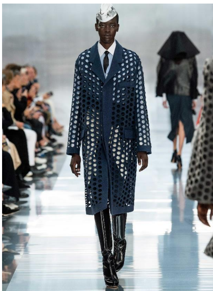
Slika 23. i Slika 24. Dekonstruirane muške vojne uniforme, Maison Margiela S/S 2020. [23] [24]