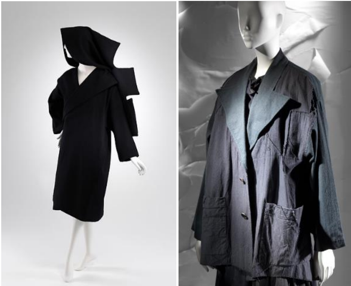
Slika 7. Ogrtač od teške vune sa rezovima koji simboliziraju prekomjernu uporabu japanske radne odjeće Gloves, Skirts, Quilted Big Coats 1983. [7]

U ožujku 1983. Kawakubo predstavlja kolekciju koja uključuje haljine - kaputa, velike i četvrtaste krojeve bez prepoznatljivih linija, oblika ili siluete. Mnogi su imali krivo postavljene revere, gumbe i rukave te neusklađene tkanine. Dobro postavljena neravnoteža stvorena je čvorovima, kidanjem i rezanjem tkanina koje su bile zgužvane, naborane i tkane u neobičnim teksturama. Obuća se sastojala od papuča ili gumenih cipela s četvrtastim prstima.[Kawamura, 2004:138]