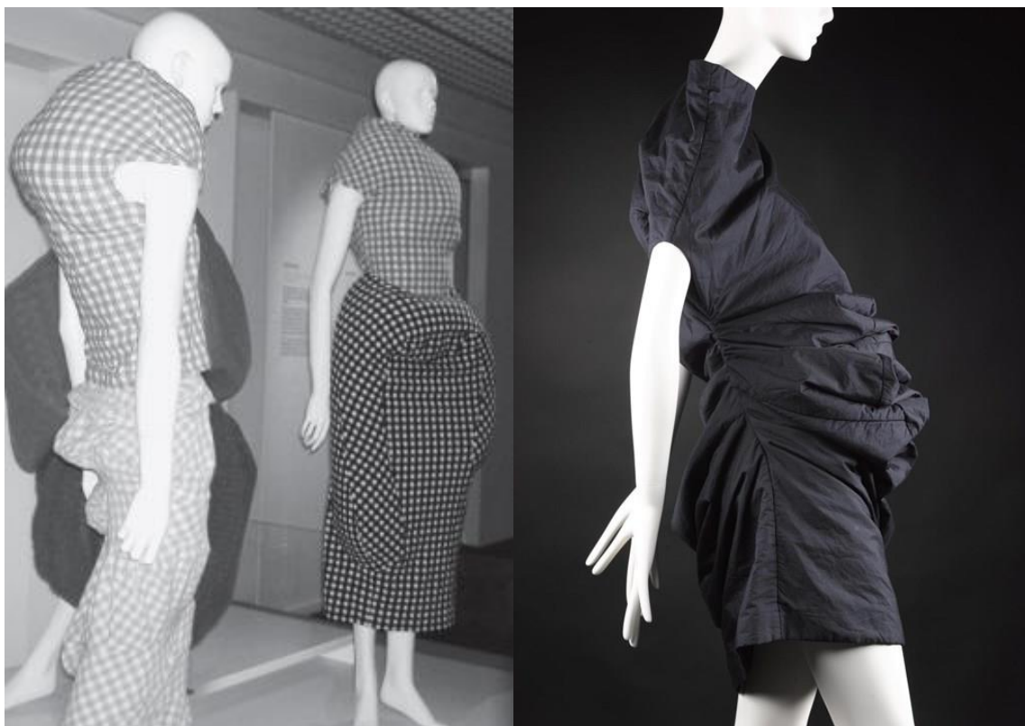
Slika 9. Body meets dress, dress meets body , 1997. godina [9]