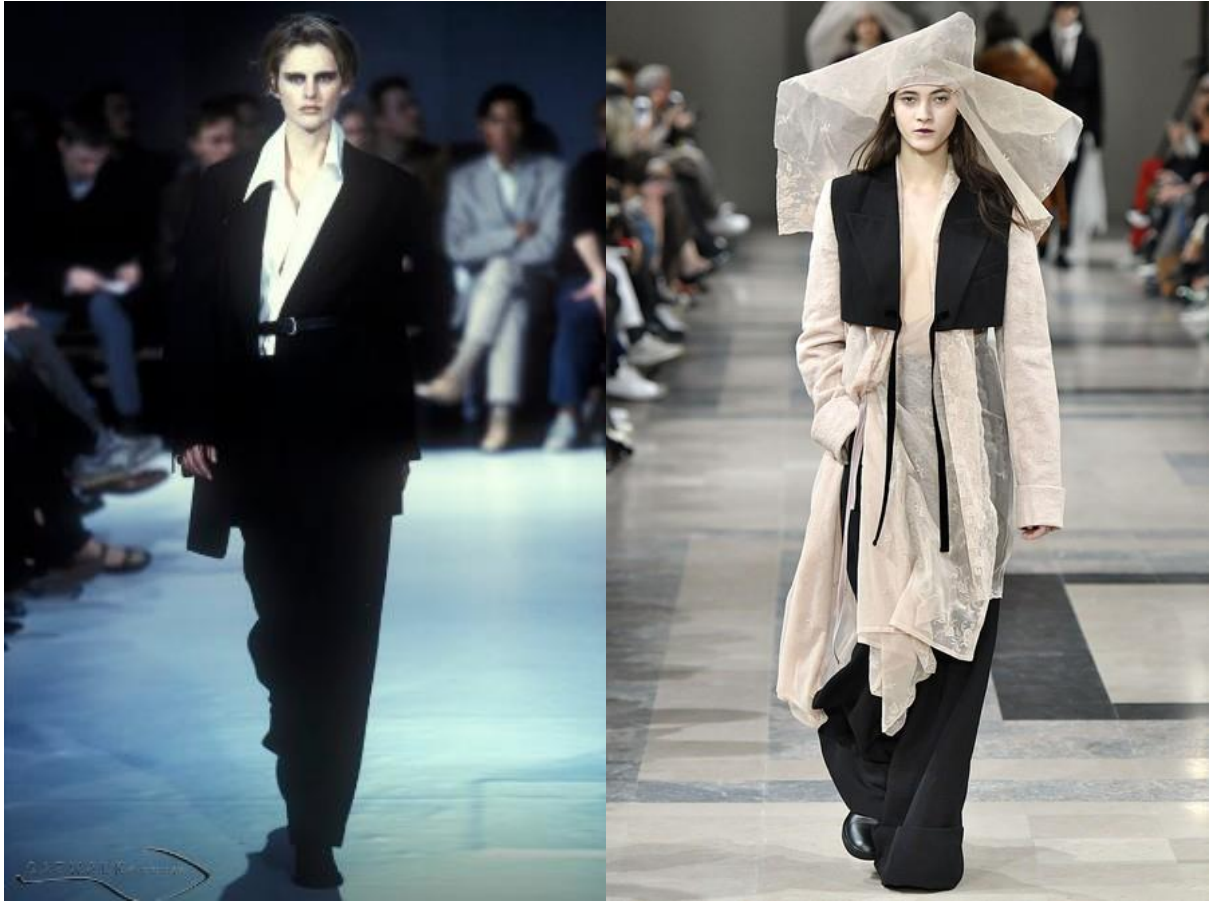
Slika 16. i 17. Kolekcija Ann Demeulemeester 1997. godine i kolekcija 2017. godine Paris Fashion Week [16] [17]