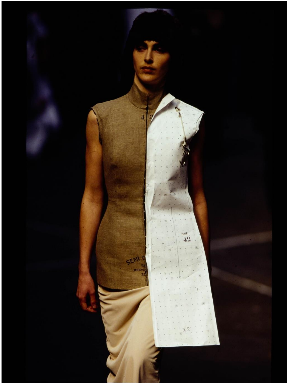
Slika 2. Revija Martina Margiele F/W 1997. godina [1]

dizajnera istražuje zapadnjački orijentirano društvo te utjecaj istoka (ovo posebice dolazi do izražaja ako se u obzir uzme političko stanje i utjecaj religije na spomenuto društvo na prijelazu stoljeća); rodne podjele i pitanja seksualnosti, i pitanja poput visoke i niske mode.