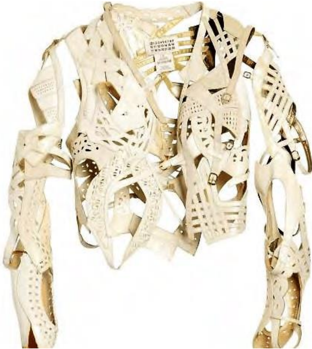
Slika 21. Dekonstruirana jakna izrađena od baletnih papuča, Artisanal kolekcija S/S 2006. godina [22]