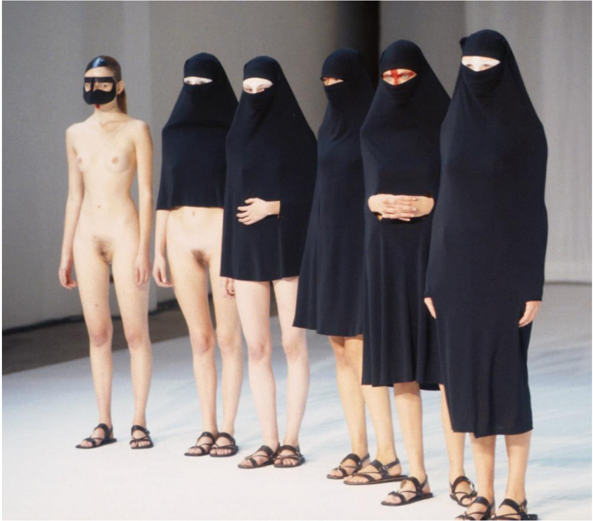
Slika 3. Hussein Chalayan: Between 1998. godina [3]