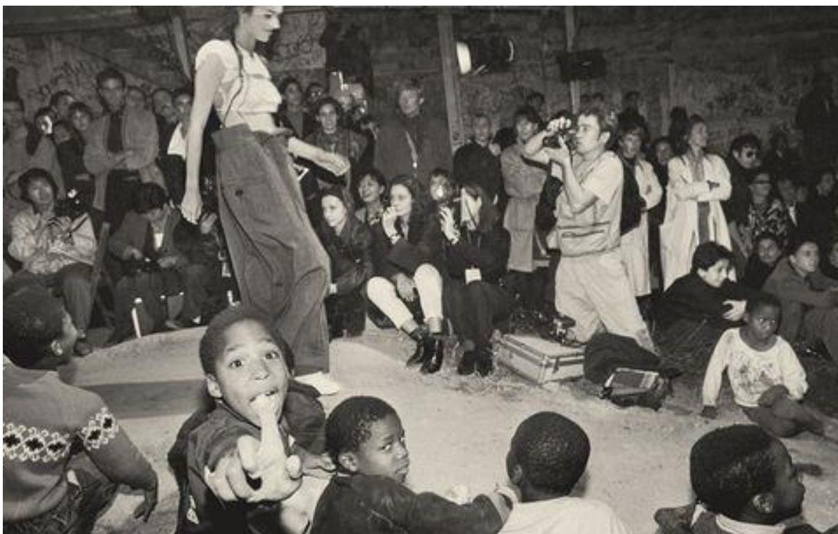
Slika 20. Djeca u prvim redovima Margieline revije, Pariz, 1989. godine [20]

Revija je održana u predgrađu Pariza te je bila otvorena za svu javnost, odjeća je bila dekonstruirana, a modeli su se ponašali nekonvencionalno noseći odjevne komade, na koncu revije djeca su se pridružila modelima na pisti. Ovo je bio tek početak spektakla i mijenjanja modne industrije iz temelja. Revija je označila i veliki proboj Margieline kulture cipele Tabi Boot , dekonstruirane cipele s dva prsta. Čizma Tabi izgledala je poput muške cipele, izrađene od debele kože i debelih potpetica, dok su svi predstavljali klasične štikle. Tabi boot i danas je prisutna na revijama Maison Margiele te i dalje ostaje jedan od najpoznatijih predmeta proizašlih iz kreativnog promišljanja Martina Margiele.