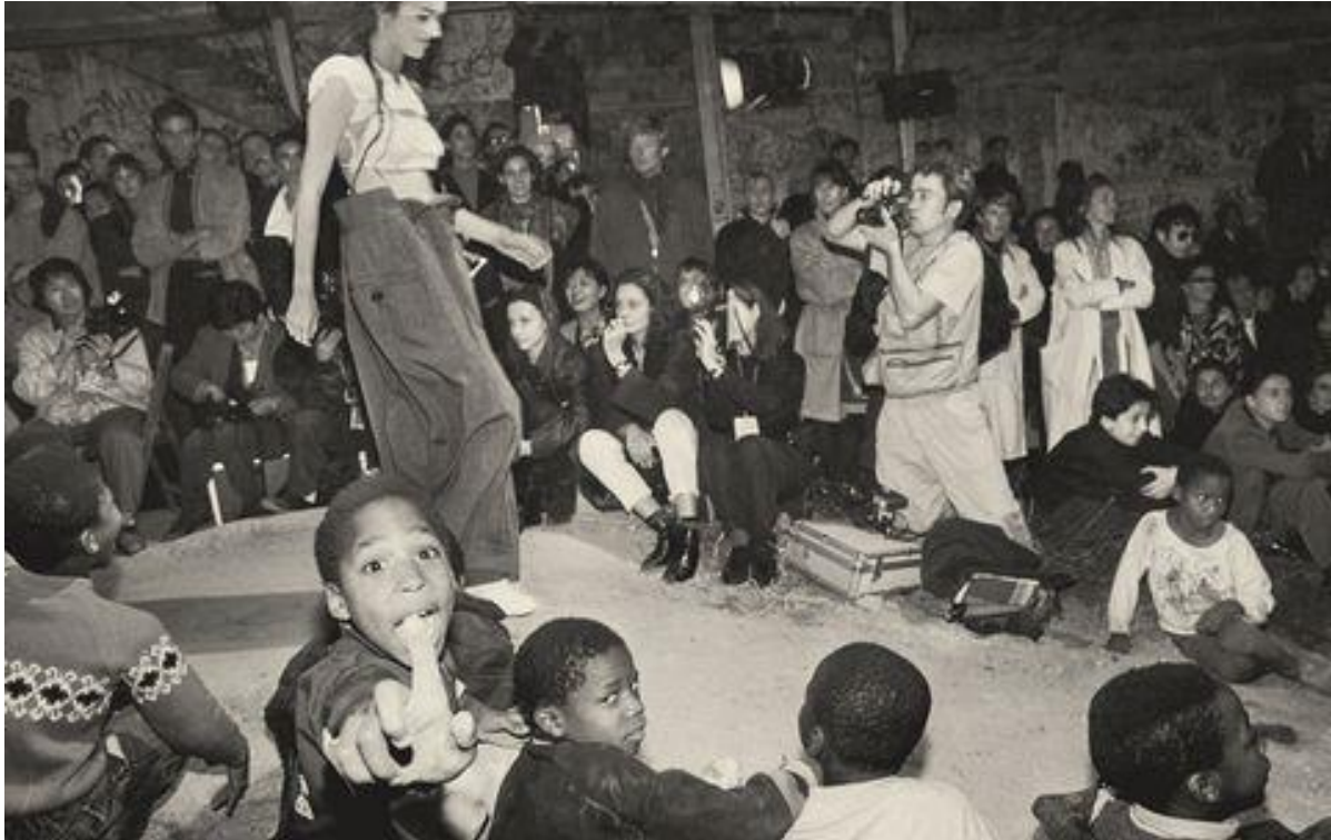
Slika 20. Djeca u prvim redovima Margieline revije, Pariz, 1989. godine [20]

Revija je održana u predgrađu Pariza te je bila otvorena za svu javnost, odjeća je bila dekonstruirana, a modeli su se ponašali nekonvencionalno noseći odjevne komade, na koncu revije djeca su se pridružila modelima na pisti. Ovo je bio tek početak spektakla i mijenjanja modne industrije iz temelja. Revija je označila i veliki proboj Margieline kultne cipele Tabi Boot , dekonstruirane cipele s dva prsta. Čizma Tabi izgledala je poput muške cipele, izrađene od debele kože i debelih potpetica, dok su svi predstavljali klasične štikle. Tabi boot i danas je prisutna na revijama Maison Margiele te i dalje ostaje jedan od najpoznatijih predmeta proizašlih iz kreativnog promišljanja Martina Margiele.