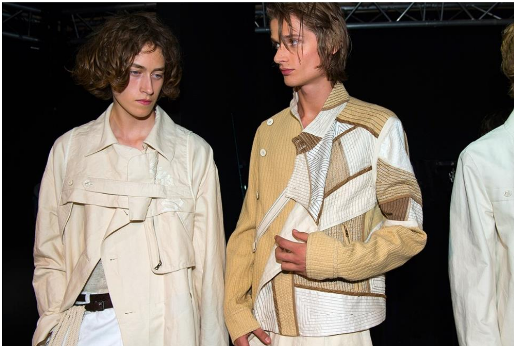
Slika 18. Dries Van Noten, dekonstruirana jakna, proljeće ljeto, 2017. godina