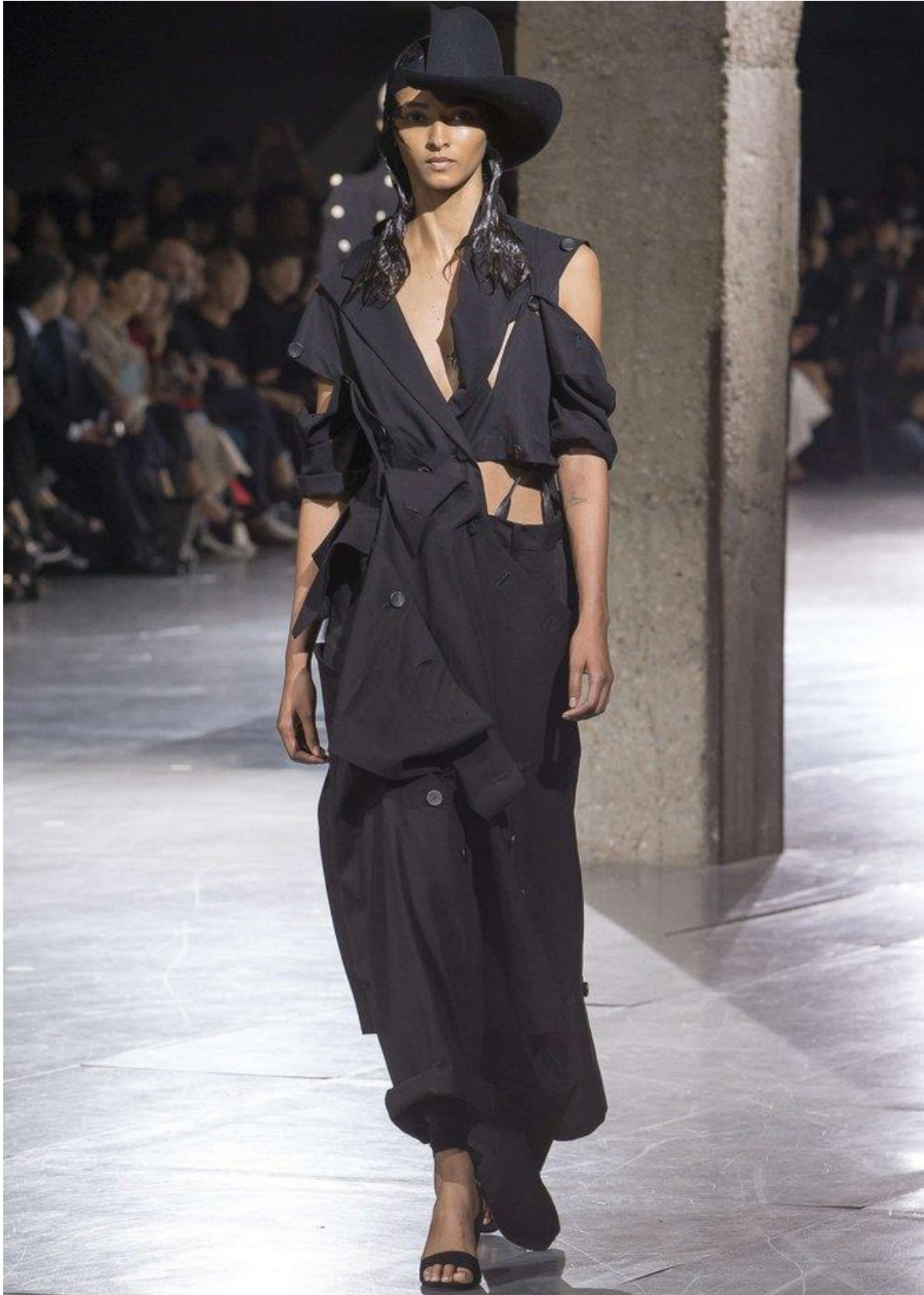
Slika 12. Yohji Yamamoto: S/S ready to wear collection 2018 [12]