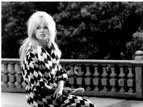
Slika 21. Brigitte Bardot u filmu Vrlo privatna afera iz 1962. godine u kaputu s geometrijskim uzorcima