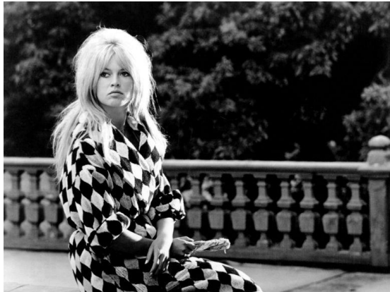
Slika 21. Brigitte Bardot u filmu Vrlo privatna afera iz 1962. godine u kaputu s geometrijskim uzorcima