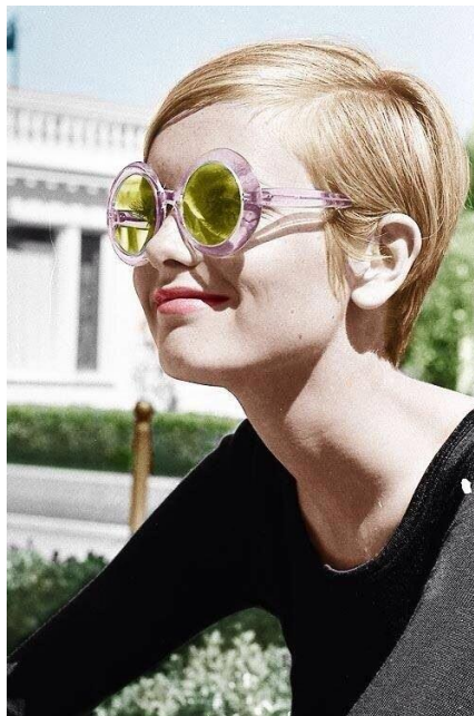
Slika 12. Twiggy nosi geometrijske sunčane naočale