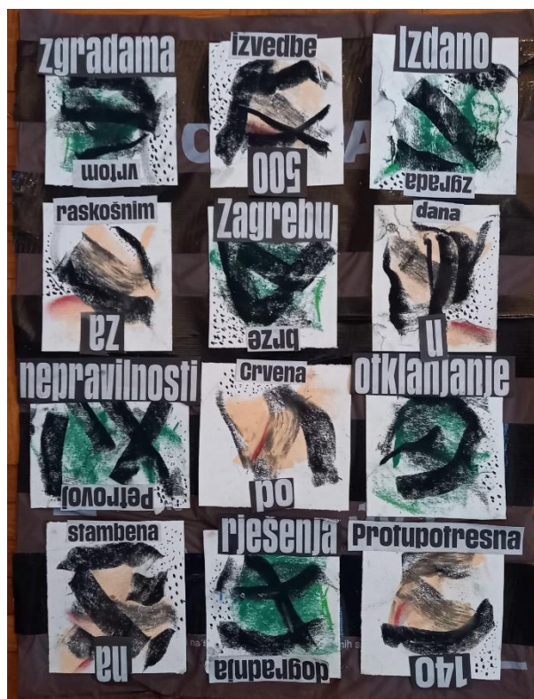
Slika 16: „Riječ”, 2021., asamblaž, 594 x 891

Na četvrtom radu, vidimo korištenje bio-vrećice, ali s pik trakom koja stvara rešetke, u kojima se nalaze različiti predmeti. U ovom radu koristi se mnogo predmeta, koja popunjavaju prostor i time stvaraju uzorak. Kako bi se ostvarila dinamika na radu, ubacujemo elemente, boje, stare ambalaže i vrećica. Njihovim ponavljanjem dobiva se kontinuitet i pravilan uzorak. Predmeti koji se koriste su svakodnevni poput zubnog konca, ugljena, gumica za kosu, čačkalica, flastera, konaca, spajalica, vreća za vrt, gumbiju i filtera za cigarete. Svaki od tih predmeta više nije samo običan svakodnevni predmet, nego postaje umjetnost.