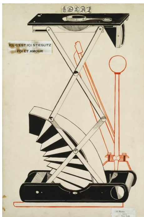
Slika 5: Francis Picabia, „Ideal“, 1915., pero i crvena i crna tinta na papiru, 75,9 x 50,8 cm, The Metropolitan Museum of Art, New York

Francis Picabia je surađivao s Marcelom Duchampom i u Duchampovu duhu preuzeo strojne prikaze kao amblemski i ironičan način prikazivanja. Radi osebujna djela poput „Ideala“ (1915.) u kojem potvrđuje konceptualnu formu portreta, a istodobno uspostavlja duhovit kontrast između strojnih prikaza i starih plemenitih znakova. (H. Harvard Arnason, 2009.; 252)