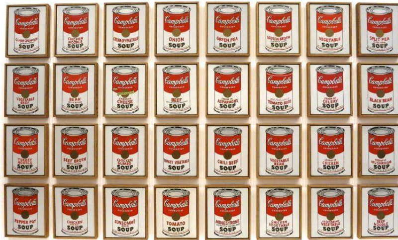
Slika 9: Andy Warhol, „Limenke Campbell juhe”, 1962., platno, sintetička polimerna boja, 51 x 41 cm, MoMA, New York

U Americi se stvaraju dva mlada umjetnika koja su imala slične ideje. Njihov rad je bio puno prije Andyja Warhola, ali ideja je bila slična. Dva mlada umjetnika imena Jasper Johns i Robert Rauschenberg su bili nesumnjivo nasljednici Marcela Duchampa i Kurta Schwittersa. Možemo reći da su upravo oni bili prethodnici Pop-art-a.