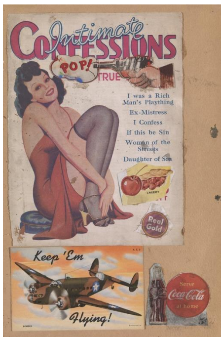
Slika 8: Eduardo Paolozzi, „ Bila sam bogataševa igračka”, 1947., karton, kolaž, 359 x 238 mm, Tate Modern, London

Bitan umjetnik koji koristi jedan motiv, umjesto više motiva, kako je radio i umjetnik Jasper Johns, kojeg će se spomenuti u neodadaizmu kao bitnu figuru, je Andy Warhol. Njegovo pojednostavljenje na grafički prikaz, postao je njegov zaštitni znak. Koristi motive koji su toliko popularni da ih svi primjećuju, on time rad stavlja na istu poziciju kao i reklamu ili proizvod pored kojeg prolazimo u svakodnevnom životu. Kao najbolji primjer možemo navesti i njegov rad naziva “Limenke Campbell juhe” (1962.) koji prikazuje trideset i dvije slike limenki Campbell juhe. Radi se trideset i dva platna na kojem je prikazano drugačiji okus iz Campbellove ponude. Platna su postavljena u horizontalni niz te izgleda kao da se još nalazi u trgovini. (W. Gompertz, 2019; 303) Sa slikom je uspio ukloniti gotovo sve dokaze svoje prisutnosti, što znači da nema niti jednog dijela u kojem se označava on kao umjetnik. Tu se vidi ponavljanje metoda modernog oglašavanja, čiji je cilj infiltrirati proizvod u svijest javnosti, bombardirajući nas istim slikama. S ovim radom umjetnik osporava pravilo da umjetnost treba biti originalna.