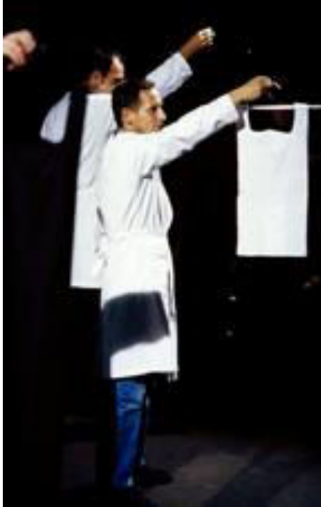
Slika 9. Martin Margiela SS'98

U doba kulture celebrity dizajnera, njegova ga je osobnost dovela do karakterizacije ploda mašte modne industrije. U skladu s njime samim i njegove kolekcije igraju se sa sadašnjošću i odsutnosti; vidljivosti i nevidljivosti. Kroz njegova prepoznatljivu estetiku, on koristi vidljive šavove koji privlače pažnju uzorku odjevnog premeta i njegovoj konstrukciji. Ti vidljivi šavovi preokreću odjevni predmet, gdje naličje postaje licem. Time vještina izrade odjeće, koja je nepoznata većini potrošača postaje vidljiva na površini. Forme koje koristi, od umanjenih do preuveličanih, dramtizacije proporcija prikazuje ponekad izuzimajući samo tijelo iz prezentacije, a ponekad naglašavajući individualne fizičke karakteristike modela. Margiela je, konačno, proširio svoju ideju i na samu modnu pistu; prezentirao je svoj rad na modelima skrivena lica, čime je u potpunosti oduzeo identitet i zadržao anonimnost pojedinca kojeg njegova ideja nadilazi.