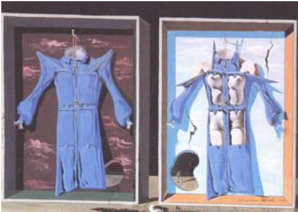
Slika 8. Salvadora Dalí, Noćna i dnevna odjeća tijela iz 1936. godine

jeftinije platno modele, čije su naknade bile niže ukoliko nisu prikazivali lica, danas su postale jedna od njegovih najprepoznatljivijih inovacija.