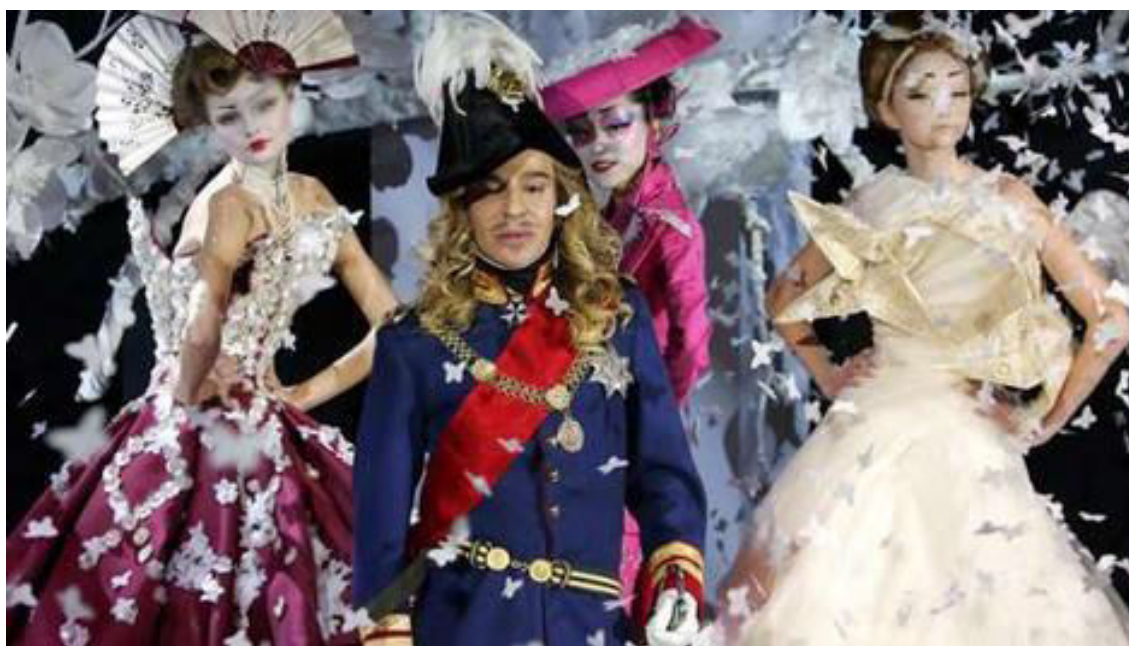
Slika 3. John Galliano kolekcija SS'07.

Prve dvije Gallianove godine u Dioru smatraju se renesansom visoke mode. Nije tajna da je couture dugo bio u krizi, služeći samo kao skupa reklama velikim modnim kućama za prodaju pret-a-portera i kozmetike. Gallianovim dolaskom visoka moda ponovno postaje nosiva i poželjna. Njegova posvećenost konstrukciji i ljepoti donijela je nešto novo na modnu scenu. Galliano je bio početak novog vremena, u kojem dizajner postaje poput rock zvijezde, mijenja stari režim i u modnu unosi elemente narativa, spektakla i teatra.