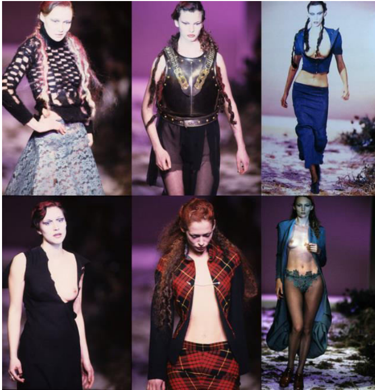
Slika 2. Highland Rape , FW'95. Highland Rape ,

Highland Rape , kontroverzna revija iz 1995. godine, njegova četvrta po redu, predstavljena je prije nego što je dizajner uopće krenuo u komercijalnu proizvodnju svoje odjeće.