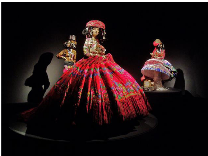
Slika 1. Mapping of the World (2004./05. godine)

Njihova svrha nije nikada bila da udovolje zahtjevima svakodnevnog života, već da se ponašaju samo kao sredstvo kojim se privlači medijska pažnja, golica mašta gledatelja i pronalazi potencijalni kupac. 17 Radi se o showpiece komadu koji, iako jest bliži umjetnosti po svojim karakteristikama od čisto uporabnog odjevnog predmeta, ipak nije u potpunosti oslobođen svrhe. Njegova svrha je da privuče pozornost i stvori auru oko branda ili prikaže koncept, ali svejedno u svrhu prodaje ostalih nosivih komada. 18