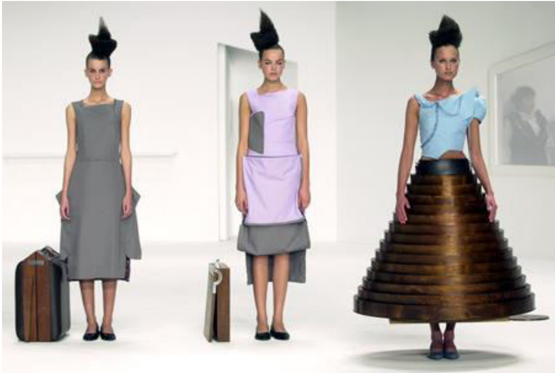
Slika 5. Chalayan A/W00

podatke o tijelu i slati okolini? Javlja se pitanje kontrole. Tko će i po kojim kriterijima analizirati informacije i koje su posljedice? Benefiti primjene nanotehnologije u odijevanju su beskrajni, u mnogim aspektima utjecat će pozitivno na kvalitetu života, ali ostavlja ogroman prostor za manipulacije i kontrolu. Hoće li kompjuter upravljati sistemima koji će se referirati na odijevanje i ljudsko zdravlje?