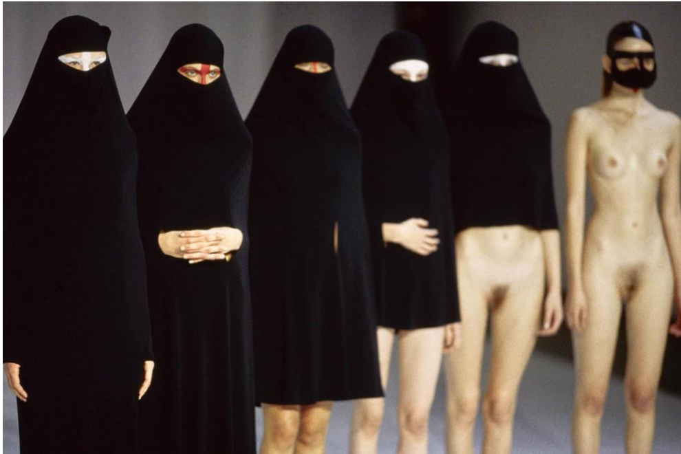
Slika 6. Between Burka SS'98

navodi da dizajneri poput Husseina Chalayana, Martina Margiele i Viktora&Rolfa stvaraju izazov Debordovoj ideji spektakla i predlažu da ju je nužno modificirati i prilagoditi suvremenim promjenama društvenog konteksta i komunikacijskih tehnologija. 1998. za svoju kolekciju Between kao završetak revije prikazao je šest manekenki koje su nosile chadore (burke) različitih veličina, tako da je prva bila odjevena u crnu burku sve do poda s potpuno prekrivenim licem, a sve naredne su nosile sve kraće i kraće, do posljednje kojoj je bilo prekriveno samo lice.