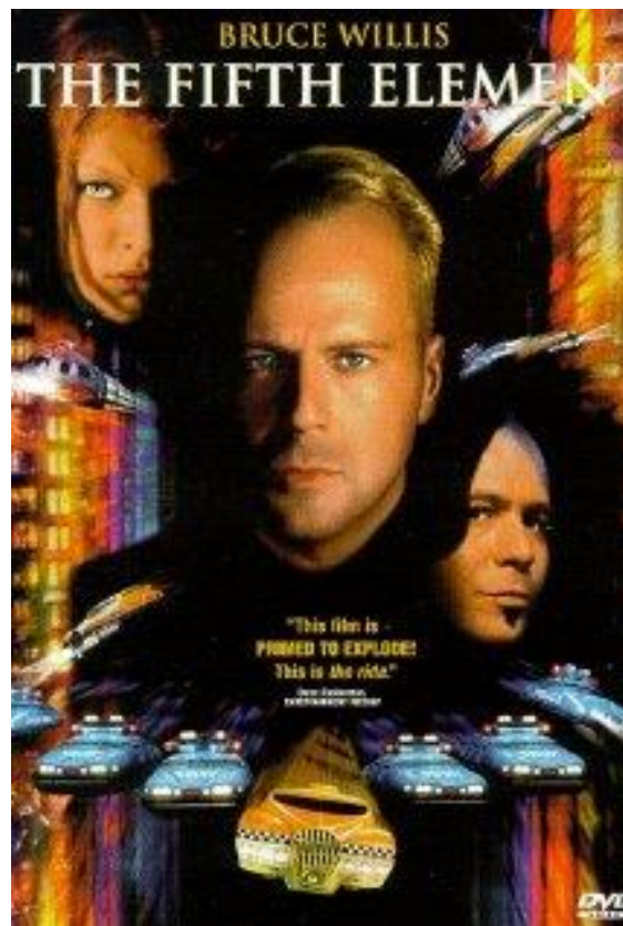
Slika 1. Poster za film „Peti element“, 1997. godina

nadrealnog i do tada nepoznatog. Pri tome se stvara fikcijski svijet koji je prilagođeniji spektaklu nego samoj činjenici da postoji i mora postojati radnja koja se prenosi publici. Pri tome se osmišljaju fiktivni likovi koji u svojoj prirodnoj okolini predstavljaju junaka radnje, ali upotpunjuje ih segment spektakularnosti kroz vizualni identitet što predstavljaju kostimografija i scenografija. Kinematografija od samih početaka nastoji se što više približiti spektaklu kao epskom sustavu prihvaćanja sedme umjetnosti koja je uslijed razvoja tehnologije dobila na izražaju upravo segment spektakularnog. Tijekom 50 - ih godina prošlog stoljeća kada se film razvija kao nova industrijska i umjetnička grana svoj uspon dobiva tijekom stvaranja hollywoodske scene koja ne ostavlja izbor da li je potreban spektakl da bi zaokupio publiku jer film je sam po sebi već postao spektakl i kao takav se razvijao 4 .