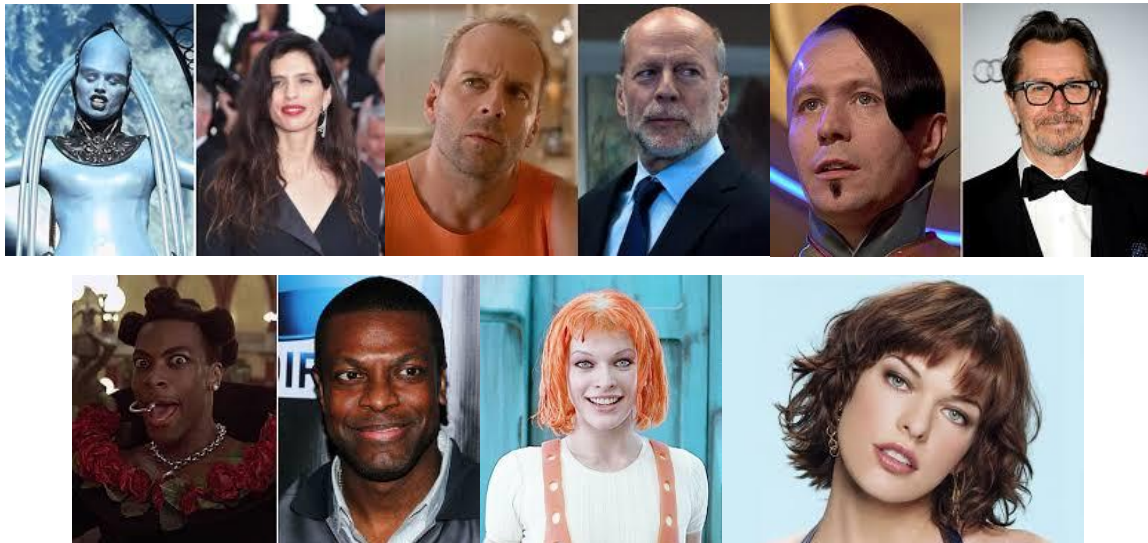
Slika 3. Glavni protagonisti filma „Peti element“