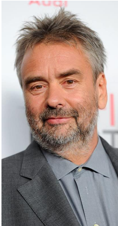
Slika 2. Luc Besson, francuski redatelj

Luc Besson je francuski redatelj, producent i scenarist rođen 1959. godine u Parizu. Uz roditelje koji su bili instruktori ronjenja zaljubio se u more i u mladosti je htio postati marinac no nakon nesreće u sedamnaestoj godini odlazi s Mediterana i vraća se u Pariz gdje razvija zainteresiranost za kinematografiju i film. Nakon što je odslužio vojsku s devetnaest godina odlazi u Hollywood gdje radi kao ispomoć u filmskim studijima. Povratkom u Francusku odlučuje se baviti filmskim stvaralaštvom pri čemu je u početku radio kao asistent na mnogobrojnim manje poznatim filmovima surađujući s Patrickom Grandperretom, Claudeom Faraldom, Mauricom Pialatom i drugima 7 . Godine 1980. napravio je svoj prvi film u crno bijeloj verziji „L'avant - dernier“ kao postapokaliptični film s elementima znanstvenofantastične drame te osvojio mnogobrojna priznanja i nagrade. To ga je potaknulo na daljnje filmsko stvaralaštvo. U naredne tri godine napravio je još dva filma i do 1983. godine se intenzivno počeo baviti filmom. Te godine izlazi njegov prvi veći film „Le Deriner Combat“, a dvije godine poslije „Subway“ crna komedija koja