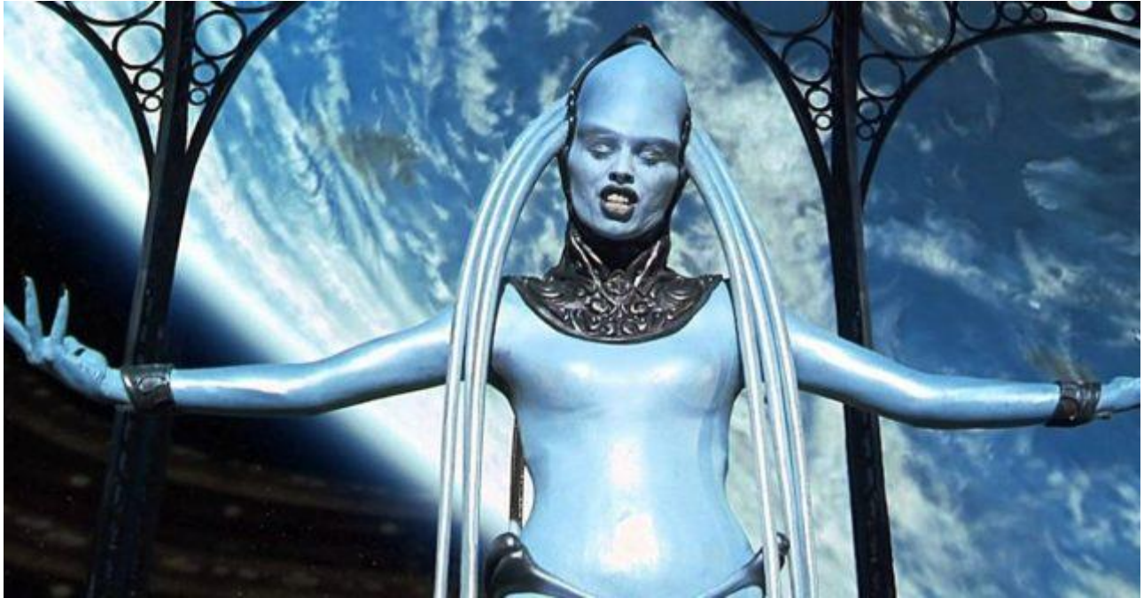
Slika 10. Plava laguna, izvedba opere

Diva Plava Laguna je poznata i cijenjena operna pjevačica u svemiru u 23. stoljeću. Ujedno ima presudnu ulogu glavnog kontakta Leeloo i skriva tajnu gdje se nalaze toliko traženi elementi. Nakon što je smještena u luksuznom hotelu u filmu je još jednom prisutna i to onda kada na kazališnoj sceni izvodi jedan od najtežih opernih izvedbi. Prema takvoj divi svi iskazuju veliko strahopoštovanje, a samim time što može izvesti neizvedive tonove zavrjeđuje još više poštovanja. Vrlo je povučen lik i ekspresivnost joj je vrlo niska, ali upravo u tom skrivenom iskazivanju svojih karakternih obilježja leži njena tajanstvenost. Nakon što ju rane Zorgovi plaćenici odlučuje samo Korbenu povjeriti elemente koje čuva u svojoj utrobi 36 . Maiwenn koja glumi divu utjelovila je njen lik no sam glas u opernoj ariji pripada Invi Mula, albanskoj pjevačici i ono što je karakteristično je činjenica da nitko nije vjerovao da će ona uspjeti otpjevati taj dio. Do danas je ostala poznata sopranistica kojoj je pjevanje za glazbeni dio u filmu donijelo veliku slavu i priznanje 37 . Što se tiče