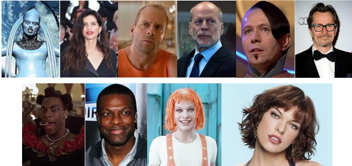
Slika 3. Glavni protagonisti filma „Peti element“

i Maiwen Le Besco. Film je okupio i druga poznata lica poput Luke Perrya, Brion Jamesa, Lee Evansa, Kim Chana i Staxwy McKenzie.