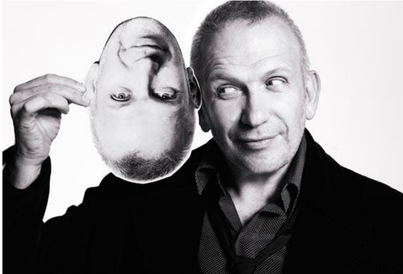
Slika 4. Jean Paul Gaultier