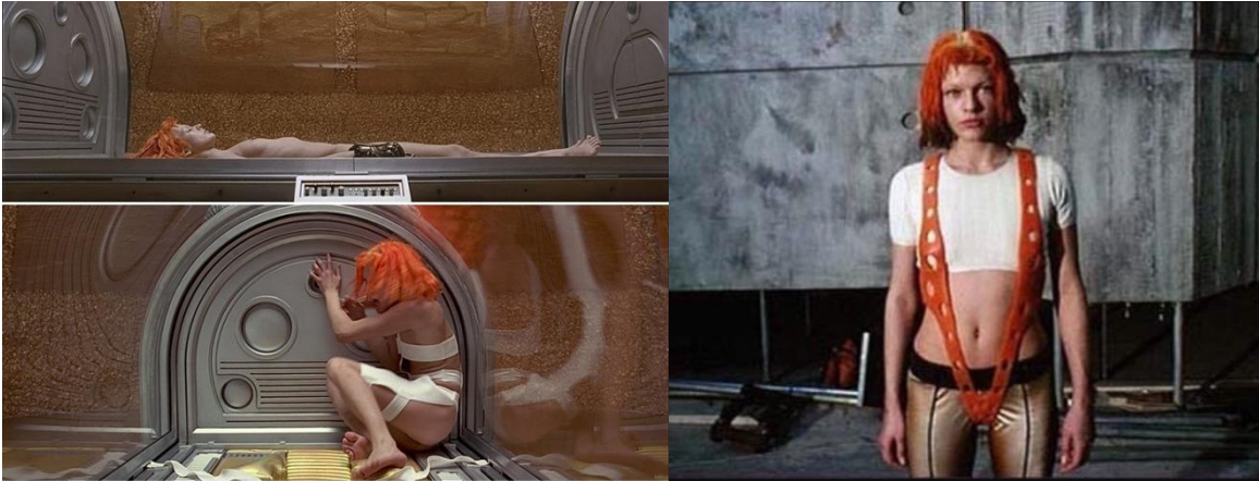
Slika 6. Leeloo kostim