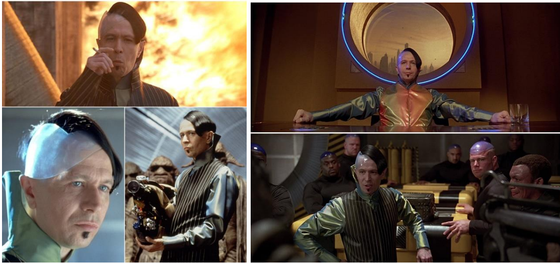
Slika 8. Kostimi i oglavlje Zorga

Zorg predstavlja glavnog negativca u filmu i uz plaćenike diljem svemira nastoji doći do elemenata prije svih. Svojim egocentričnim i maničnim ponašanjem idealan je prikaz negativca koji je u strahu od neuspjeha. Karakter predstavlja multikulturalni lik koji svojim mafijaškim pristupom nastoji osvojiti svemir. Njegovi kostimi svedeni su na dva osnovna kostima no oba su primjeri eklektične mode, a sami kostimi daju mu određenu dozu humora. Prvi kostim je dugačka jakna na pruge s odgovarajućim prslukom i hlačama uvučenim u vojničke čizme. Prsluk nosi preko zelenoplave košulje s visokim zakrivljenim ovratnikom koji je nešto kraći na prednjoj strani. Time se naglašava plastično oglavlje kaciga koju nosi. Kako je i predviđeno, kao futurističko odijelo izrađeno je od gume, a jakna ima živopisnu crvenu podstavu. Drugi kostim je dizajner osmislio kao sličan prvom no zamijenio je prsluk s onim narančasto zelene boje koja se prelijeva duljinom kroja ostavljajući efekt presijavajućeg tafta. Taj ombre efekt omogućio je bogatiji izgled tkanine, a tim ga se i naglašava kao maničnu osobu i potvrđuje njegov lik negativca 34 .