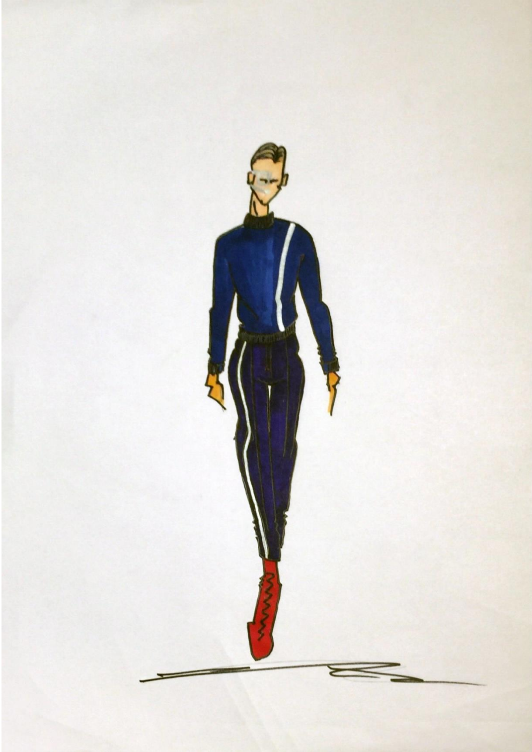
Jean Baptiste Emanuel Zorg