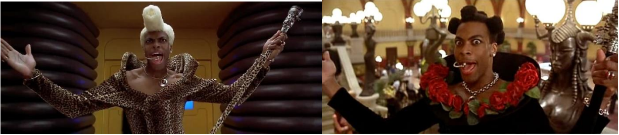
Slika 9. DJ Ruby kostimi

Iako je prvenstveno uloga trebala pripasti Prince - u, Chris Rock je odlično odigrao ulogu ekscentričnog i smiješnog televizijskog voditelja. Ionako poznat kao veliki zabavljač, Rock je uspio udahnuti još ekscentričniju dozu humora u ovaj lik. Osim svojom pojavom DJ Ruby uspio je nadmašiti sva očekivanja humoristične osobe. Iako ponekad pretjerano nadobudan i previše introvertan lik uspio je naglasiti humorističnost radnje u filmu i naglasiti svoje karakterne crte. K tom je pridonijela i ekscentrična odjeća koju nosi. Prvi upečatljivi kostim je onaj leopard uzorka, usko odijelo s pojačanim ramenim djelom, velikim lađa izrezom naglasio je blijedu skoro bijelu periku na tamnoputom liku. Taj ga je kostim okarakterizirao kao velikog šaljivdžiju i pomalo feminiziranog eksperimentalnog muškarca koji se ne boji iznenaditi. Drugi kostim koji nosi je crne, moćne i dominantne boje s naglašenim ramenim dijelom na kojem se nalaze mnogobrojne crvene ruže. Perika je ponovno ekstravagantna no ni ona nije uspjela nadomjestiti onaj šarm koji je ostavio kao lik DJ Rubyja, ekscentričnog voditelja koji je istovremeno smiješan, katastrofalan, naporan i zabavan. Kao dodatak su bili mikrofoni i ukrasni štapovi koje je imao kao modne dodatke koji su naglasili njegovu ekspresiju 35 .