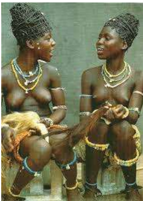
Slika 12. 'Dipo' žene

Prema Kennedyju ideja pornografije je nešto što je čovjek stvorio, nije nešto što je proizašlo od našeg Stvoritelja, iako su mnogi kršćani vjerovali i propovijedali.