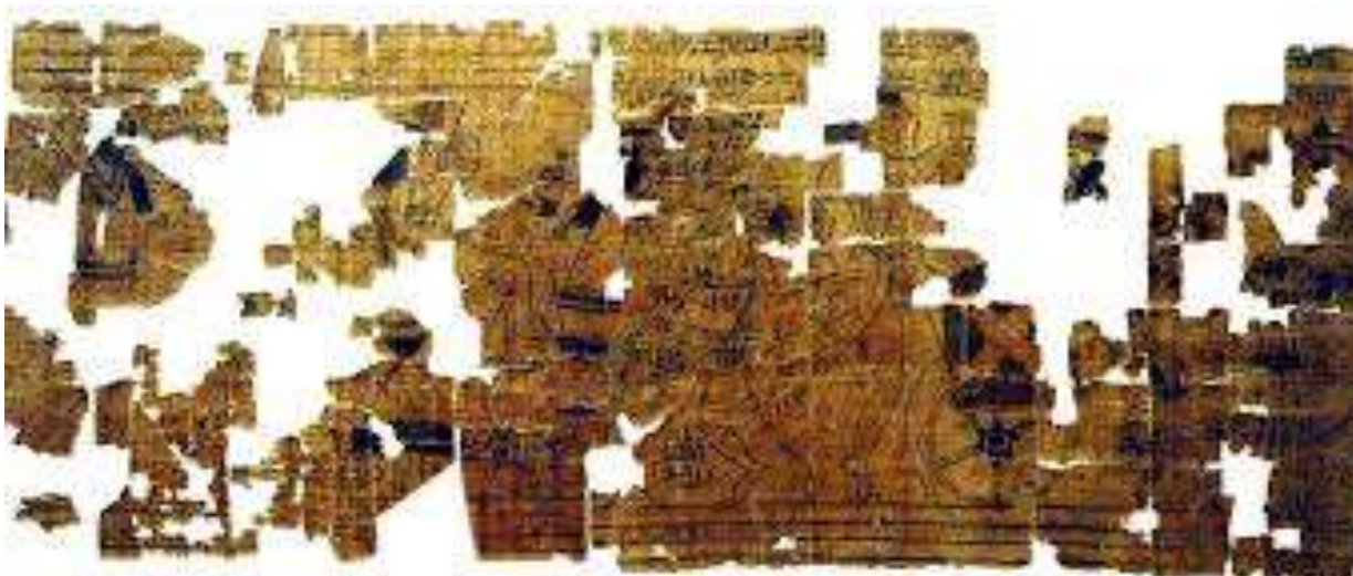
Slika 19. Erotic and Satirical papyrus, Der el-Madina (1186-1070 Pr. Kr.)

Rekreacija nagog ljudskog tijela u umjetnosti zahtjeva od gledatelja da svjesno ili subjektivno odluči je li to u dobrom ili lošem ukusu, što vrijedi i kako ocjenjujemo umjetnost općenito. Seksualno uzbuđenje ne mora biti jedina namjera pornografije, ali smatra se da je to njegova središnja ili krajnja namjera. Sa biblijskog stajališta, možemo se osvrnuti na Pavlovu poslanicu Rimljanima: