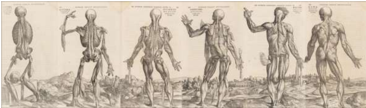
Slika 11. Andreas Vesalius, 1543

Razlika između njih dijelom je samo pitanje terminologije i naglaska na koncept “nagost i razborit“, Graves se protivi “gol i neosramoćen“. S druge strane konceptu “gol i neugodan“ Clark se protivi “gol i objedinjen umjetničkom idejom“. Njihove sličnosti mogu biti jasnije s detaljnijim analizom Gravesove pjesme, s mogućnošću da se pjesnik mogao povjeriti povjesničaru umjetnosti ne samo na početnu katalitičku simulaciju ali i za neku intelektualnu razinu njegove pjesme. Na kraju, podudarna podudaranja između njihovih stavova je izuzetna.