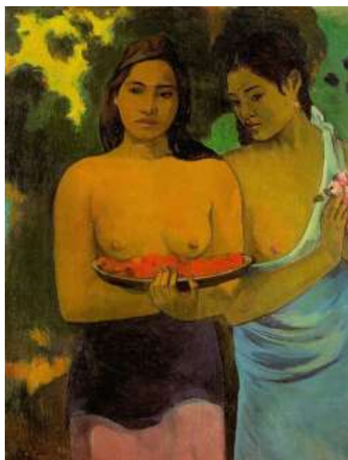
Slika 7. Gauguin, Dvije Tahitijanke (1899.)

“Dvije Tahitijanke“ (Two Tahitian Women) od Gauguina govori i seksualnoj slobodi. Subjekti neumorno stoje pred nama u svojoj erotskoj ljepoti, njihovi izrazi su prazni i tako postaju ništa više od muškog pogleda.