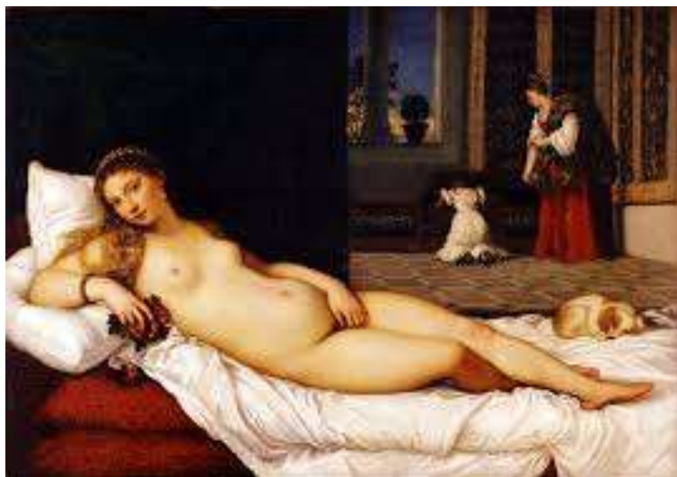
Slika 15. Titian Venera iz Urbina, (1532-1534)

Jedna ženska golotinja (Titian, Venera iz Urbina ) poznata je zbog konceptualnog okvira koji ju okružuje: stari izgled boje koji prenosi njezino tijelo i položaj, oblik njezina tijela prikazuje model iz prošlih vremena, i njezina poza koja se prikazuje u određeno razdoblje. Ovi znakovi upućuju gledatelje kako je razumjeti. Ona je ta koju se štuje, kojoj se divimo i čuva u svetom carstvu, tamo gdje tijela nisu predstavljena radi seksualnog užitka. Dakle, kontekst i sadržaj akta postoji u dijalektičkim odnosima. Titian koristi pažljivo, suptilno nacrtano svjetlo i sjenu