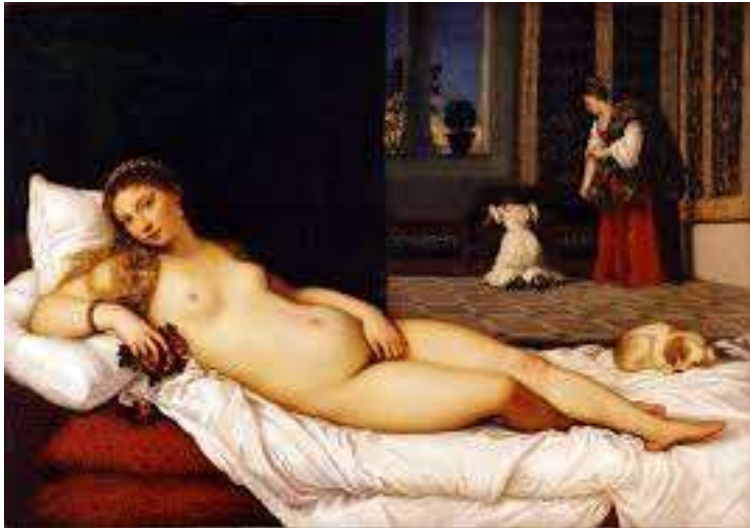
Slika 15. Titian Venera iz Urbina , (1532-1534)

Jedna ženska golotinja (Titian, Venera iz Urbina ) poznata je zbog konceptualnog okvira koji ju okružuje: stari izgled boje koji prenosi njezino tijelo i položaj, oblik njezina tijela prikazuje model iz prošlih vremena, i njezina poza koja se prikazuje u određeno razdoblje. Ovi znakovi upućuju gledatelje kako je razumjeti. Ona je ta koju se štuje, kojoj se divimo i čuva u svetom carstvu, tamo gdje tijela nisu predstavljena radi seksualnog užitka. Dakle, kontekst i sadržaj akta postoji u dijalektičkim odnosima. Titian koristi pažljivo, suptilno nacrtano svjetlo i sjenu