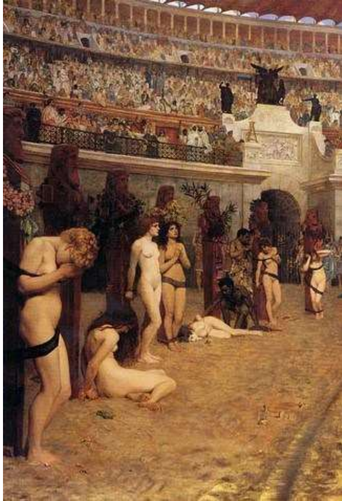
Slika 18. Herbert Gustave Schmalz, Vjerni u smrt, (1888)