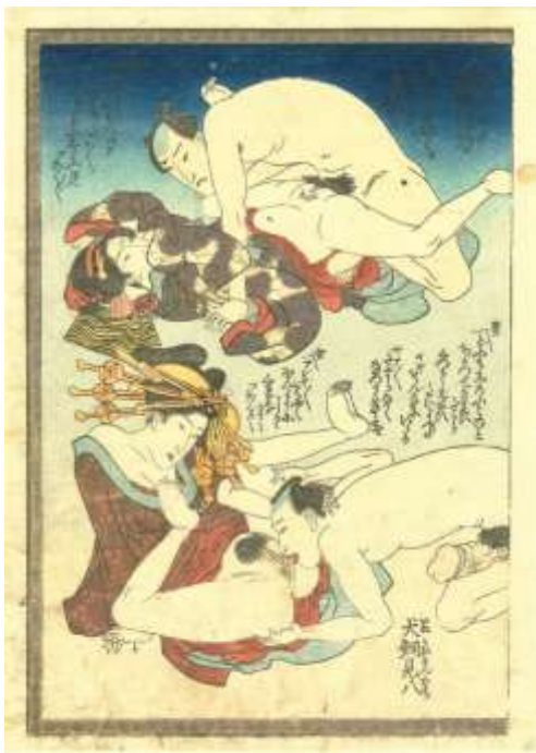
Slika 21. Utagawa Kunisada (1786-1864), Japan

široj kulturi, shunga nije bila samo umjetnost, nego je bila i ekonomska blagodat tijekom Edo razdoblja. Kao što je tipično za većinu umjetnosti, sadržaj i likovi shunge nevjerojatno su raznoliki. Zamišljati je kao samo na “slike ljudi koji imaju spole odnose“ je vrlo ograničavajuće jer često, kada gledamo shungu, predoči se izuzetno složena slika koja se u potpunosti može uvažiti samo ako se razumje sva njena umjetnička i kulturna komponenta.