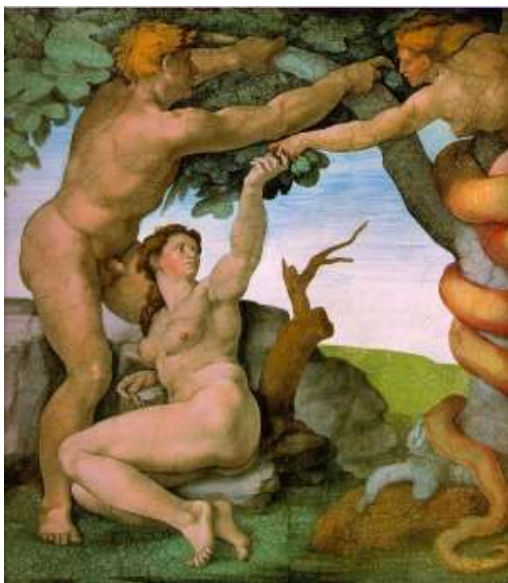
Slika 3. Michelangelo, detail of Adam and Eve from the Sistine Chapel (1508-1512)

Michelangelo, koji je bio pod velikim utjecajem humanizma i rada starih Grka, napravio je korak dalje za ovu tjelesnost za Papu Julija II., slikajući freske Sikstinske kapele. Freske nam govore priču o Božjem stvaranju, čovjekovom padu i krajnjoj potrebi čovječanstva za stvaranjem koje je Bog ponudio kroz Isusa. S više od tristo figura, miješajući oba lika iz biblijskih priča i figure iz drevne mitologije, Michelangelo je uspješno kombinirao Kršćansku teologiju s humanizmom renesanse. Iako se količina golotinje susrela s nekom kritikom, papa Ivan Pavao II. je rekao: