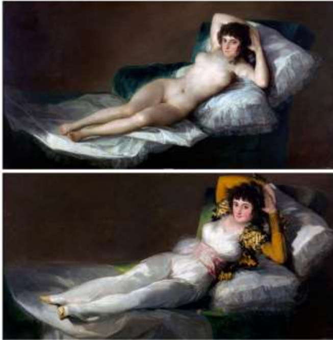
Slika 5. Goya, The Clothed Maya and the Nude Maya, (1800.-1803)

simfonije. Prosvjetiteljstvo je oduzelo čovjeku čak i njegovu čovječnost, pretvarajući čovjeka u "prirodnog". Posljedice su bile teške: ako je čovjek samo još jedna životinja, onda velike ideje koje su se stoljećima vjerovala, u načelu više nemaju svoje značenje.