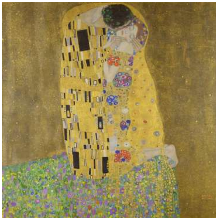
Slika 16. Gustave Klint, Poljubac (1907)

Pornografija uključuje prikazivanje eksplicitnog seksualnog materijala kako bi potakla psihološko seksualno uzbuđenje. Nisu sva umjetnička djela, koja uključuju aktove, povezana sa pornografijom, a niti sva umjetnost koja se bavi seksualnim pitanjima ne pristupa toj temi s polazne točke gledišta.