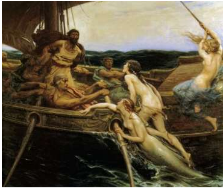
Slika 17. Herbert James Draper, Uliks i Sirene (1910)

Također, postoji neka umjetnost koja je istinski i namjerno ponižavajuća za pripadnike bilo koje skupine, a ponekad je priroda te poruke povezana sa spolom. Bez obzira na to, golotinja nije potrebna za stvaranje takve umjetnosti, niti je dovoljna. Kritiziranje umjetničkih djela je oduvijek bilo dopušteno, ali ljudi često koriste prečice pod pretpostavkom da se može znati je li umjetničko djelo ponižava nekoga na temelju odjeće ili nedostatka istog. Neka djela kao što su na primjer orijentalističke slike tržišta robova, mogu prikazati ponižavanje ljudi, često čak i golih ljudi koji izgledaju ranjivo, kako bi pokazali koliko je zapravo loša degradacija.