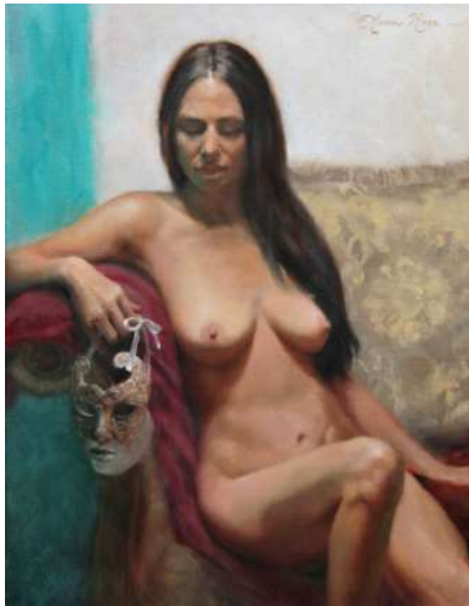
Slika 20. Anna Rose Bain, Unmasked (2012)