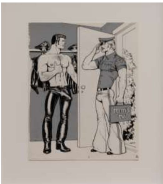
Slika 22. Tom of Finland, T.V.- Repair, 1972

već i na ulicama s ljudima, zato mnogi od njih djeluju pod pseudonimima, jer je vandaliziranje javne imovine zločin. Anti-autoritativan po prirodi, postmodernizam je odbio prepoznati autoritet bilo kojeg stila ili definicije onoga što umjetnost treba biti. Srušio je razliku između visoke kulture i masovne ili popularne kulture, između umjetnosti i svakodnevnog života. Budući da je postmodernizam prekršio utvrđena pravila o stilu, uveo je novo doba slobode i osjećaj "anything goes" ("sve ide").