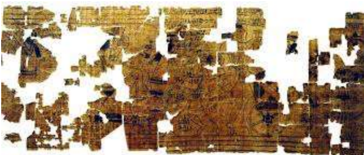
Slika 19. Erotic and Satirical papyrus, Der el-Madina (1186-1070 Pr. Kr.)

Rekreacija nagog ljudskog tijela u umjetnosti zahtjeva od gledatelja da svjesno ili subjektivno odluči je li to u dobrom ili lošem ukusu, što vrijedi i kako ocjenjujemo umjetnost općenito. Seksualno uzbuđenje ne mora biti jedina namjera pornografije, ali smatra se da je to njegova središnja ili krajnja namjera. Sa biblijskog stajališta, možemo se osvrnuti na Pavlovu poslanicu Rimljanima: