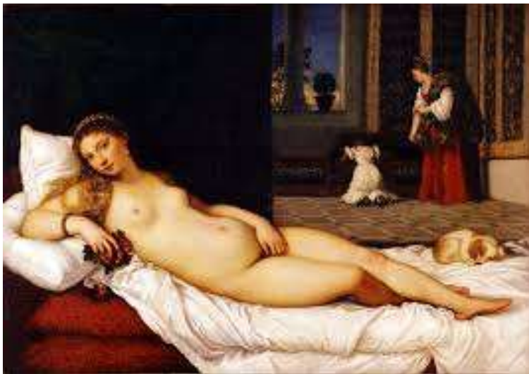
Slika 15. Titian Venera iz Urbina, (1532-1534)

Jedna ženska golotinja (Titian, Venera iz Urbina ) poznata je zbog konceptualnog okvira koji ju okružuje: stari izgled boje koji prenosi njezino tijelo i položaj, oblik njezina tijela prikazuje model iz prošlih vremena, i njezina poza koja se prikazuje u određeno razdoblje. Ovi znakovi upućuju gledatelje kako je razumjeti. Ona je ta koju se štuje, kojoj se divimo i čuva u svetom carstvu, tamo gdje tijela nisu predstavljena radi seksualnog užitka. Dakle, kontekst i sadržaj akta postoji u dijalektičkim odnosima. Titian koristi pažljivo, suptilno nacrtano svjetlo i sjenu