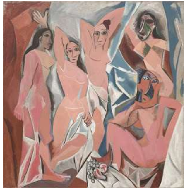
Slika 9. Picasso, "Gospođice iz Avignona" (Les Demoiselles d'Avignon) (1907.)

Pablo Picasso preveo je Gauguinove slike žene na sljedeći korak. Njegovo djelo je bilo nevjerojatno inventivno; niti jedan umjetnik od tada nije uspio revolucionirati slikarstvo onako kako je on to činio. Bio je kreativni genij na način na koji su konzervativci često otporni da mu daju zasluge. Poznao je klasičnu tehniku i anatomiju što se vidi po njegovim ranijim radovima prije 1906-te godine. Međutim, Picasso je uskoro krenuo u drugom smjeru. Iako je Gauguinov rad ostao u osnovi reprezentativan, njegove su figure bile pomalo androgine 6 .