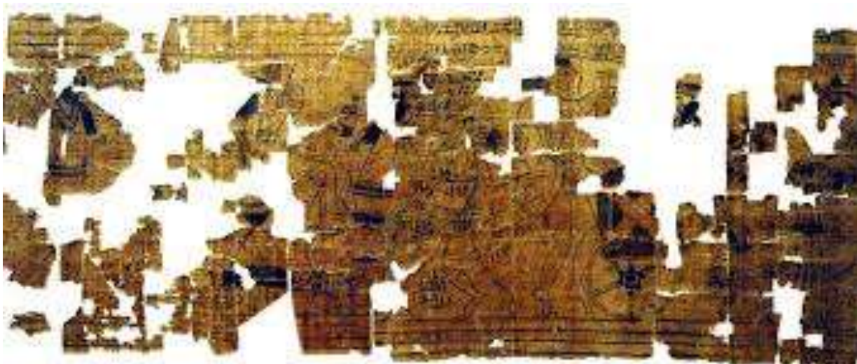
Slika 19. Erotic ands Satirical papytus, Der el-Madina (1186-1070 Pr. Kr.)

Rekreacija nagog ljudskog tijela u umjetnosti zahtjeva od gledatelja da svjesno ili subjektivno odluči je li to u dobrom ili lošem ukusu, što vrijedi i kako ocjenjujemo umjetnost općenito. Seksualno uzbuđenje ne mora biti jedina namjera pornografije, ali smatra se da je to njegova središnja ili krajnja namjera. Sa biblijskog stajališta, možemo se osvrnuti na Pavlovu poslanicu Rimljanima: