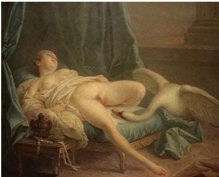
Slika 14. Francois Boucher, Leda i labud (1740)

ono što je razuzdano i uvredljivo, tj. 'pornografsko', i ono što je prihvatljivo i estetski ugodno ili 'umjetničko', nikad nije izravno jer značenja pornografije i umjetnosti dosta variraju.