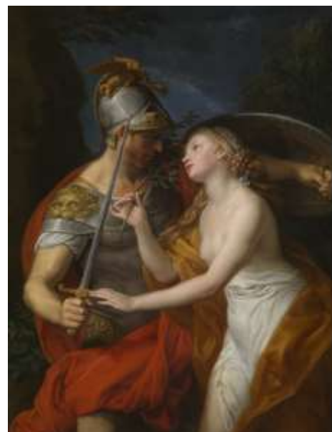
Slika 4. Pompeo Batoni, Mir i Rat (Allegory of Peace and War), 1776.)

Simbolika golotinje nastavila bi se kroz 18. stoljeće. Odličan primjer toga možemo vidjeti na umjetničkom djelu "Mir i Rat" od talijanskog umjetnika Pompea Girolamo Batonia. Fraza "Voli ljubav, a ne rat" dolazi na pamet kad se pogleda njegovo djelo. Rat predstavlja rimski bog Mars, koji se čini žestokim i nezaustavljivim u svome oklopu. Pax, božica mira, moli ga pogledom i nježno odguruje mač. Njena prsa su izložena i simboliziraju snagu i ranjivost. Njih dvoje se istovremeno približavaju i odguruju. Umjetničko je djelo upotpunjeno značenjem, posebno ako se gleda datum kada je stvoreno i sjećamo povijesnih događaja koji su se dogodili u to vrijeme. Međutim, slika je možda iznimka od trendova koji su se događali već u 18. i 19. stoljeću.