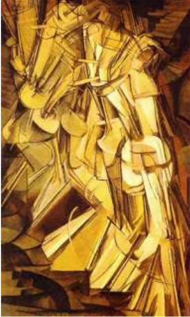
Slika 10. Marcel Duchamp, Akt silazi niz stepenice (1912.)

ogromno apstraktno djelo koje se sastoji od cilindričnih i stožastih elemenata za koje se čine da se kreću po prostoru, ali nam ne daju pojam u odnosu na spol, dob, individualnost ili karakter subjekta.