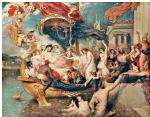
Slika 8. William Etty, Kleopatrin dolazak u Ceciliju (1821)

Ni jedan drugi umjetnik su britanskoj povijesti se nije posvetio prikazivanju ljudskog oblika tako umjereno kao William Etty, posebice ženske golotinje. Bilo da se radi o kompozicijama s malim figurama, akademskim studijama ili velikim mitološkim i povijesnim djelima koje je poslao Kraljevskoj umjetničkoj akademiji, njegove su slike ukrašene obilnim golim mesom. Iz