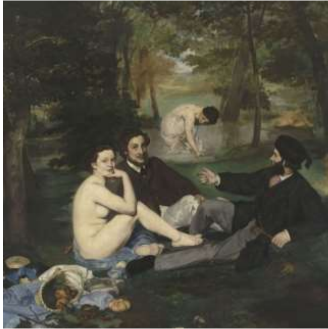
Slika 6. Edouard Manet, Doručak na travi (1862-1863)