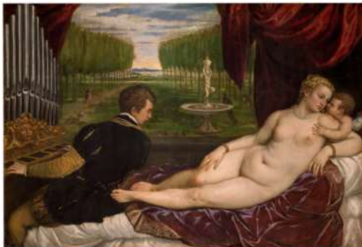
Slika 2. Titian, Venus with an Organist and Cupid (1555.)

“ Venera i glazba “ je odličan primjer za to. Žena leži gola na kauču dok glazbenik svira. Te dvije figure su odvojena jedna od druge, ali orguljaš gleda u Veneru tražeći “ljubav i ljepotu“ za inspiraciju u njegovoj glazbi. Upravo ta simbolika čini ove slike smislenima. Ona je muza. Nije žena upitne podobnosti jer nije stvarna. Umjesto toga, ona predstavlja nešto uzvišeno i pruža način čovjeku da promišlja ljudske vrijednosti i istinu.