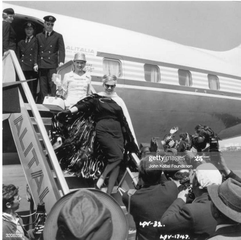
Slika 6: Sylvia senzualno izlazi iz zrakoplova

počešljana i podignuta u punđu s raspuštenim šiškicama po čelu. Senzualno silazi iz aviona dok ju novinari fotografiraju smiješeći se poput kakve dive. Na nogama nosi crne salonke.