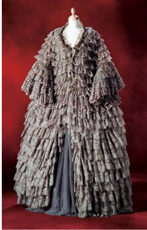
Slika 12: Siva raskošna haljina Casanovine majke