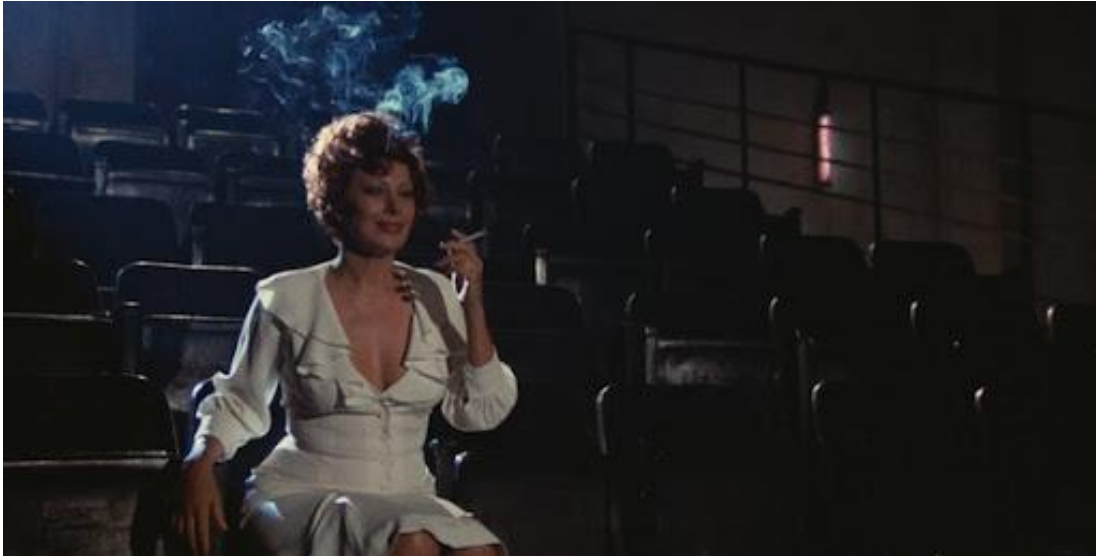
Slika 16: Gradisca u strukiranom bijelom kostimu koji naglašava njezine obline, zaljubljeno promatra Garyja Coopera na filmskom platnu

način tim činom odbijanja, on sazrijeva. Stoga mislim da bijela boja njezine haljine ima upravo tu ulogu, odagnati dječачke snove i osvijestiti ga, odnosno usmjeriti na pravi put. Često ju vidimo ili u bijelim ili crvenim kombinacija, poigravanje sa nevinošću i zavođenjem. Ako zavodi odijeva se u crveno, a kada mašta i sanjari o svom životnom suputniku, vjenčanju, odjevena je u bijelo.