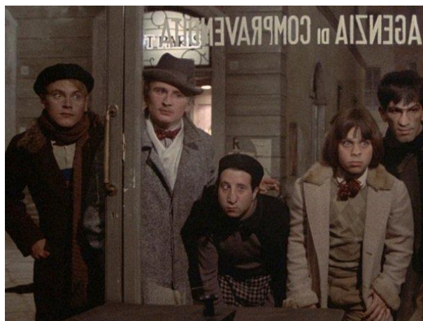
Slika 14: Tittini prijatelji, odjeveni u jednostavnu odjeću toga doba