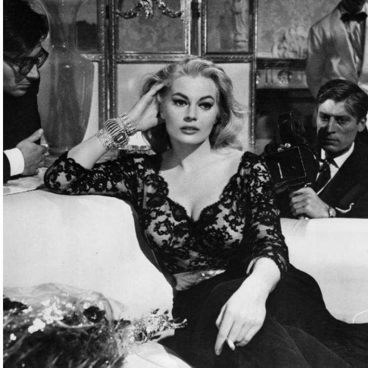
Slika 7: Sylvia u hotelu u crnoj čipkastoj haljini gdje je njezino bujno poprsje u prvom planu

Monroe; u čemu spava, na što ona odgovara kao i Marilyn; da spava samo s dvije kapi francuskoga parfema.