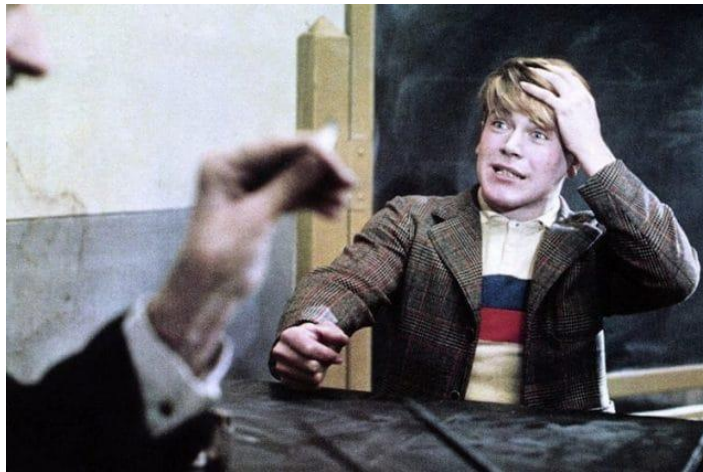
Slika 13: Titta u jednoj od svojih tipičnih odjevnih kombinacija, smeđi sako i prugasta polo majica ispod