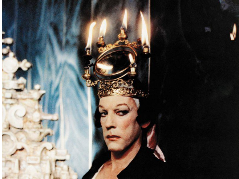
Slika 11: Casanova s neobičnom krunom sačinjenom od svijeća