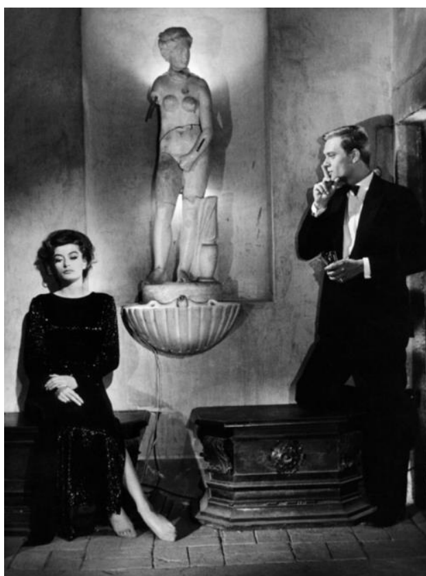
Slika 4: Maddalene u dugoj crnoj haljini sa šljokicama

Njezin ormar ukazuje na glamur iz 1950-ih i šik početkom 1960-ih. Smatra se da je Fellinija inspirirala haljina Cristóbal Balenciage vrećastog izgleda iz 1957. godine za samu viziju ženskih kostima La dolce vite . Brunello Rondi, scenarist filma, navodi da su Fellinija vrećaste haljine oduševile jer bi učinile ženu prekrasnom, umjesto da moraju biti mršave te kosturi duhovitosti i samoće. U filmu nema vrećastih haljina, iako su ga upravo one potaknule na razmišljanje, ali Fellini pametno predstavlja ljepotu dok izlaže tamniju, površnu stranu "slatkog života", odabirom tamnih boja na odjeći. Inače, tamnije boje na odjevnim predmetima oduvijek su označavale pripadnost višem, elitnijem sloju društva, odraz su sofisticiranog stila i elegancije i odgovaraju svakoj prilici.