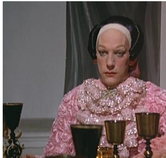
Slika 9 i Slika 10: Casanova u raskošnom ružičastom kostimu

Isto tako, vrlo zanimljivo je Casanovino oglavlje koje izgleda poput svijećnjaka. Personifikacija njegovog oglavlja, odnosno krune označava da je kralj, a krug simbolizira savršenstvo, vječnost iz kojeg plamte svijeće. Vrlo dojmljiv modni dodatak koji, rekla bih, simbolizira vragolastu narav samog Casanove. On je poput plamteće svijeća, prepun seksualne strasti i energije koja vječno plamti.