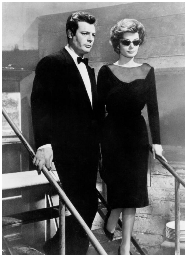
Slika 3: Maddalene u maloj crnoj haljini s V-izrezom

Prvi puta kada ju vidimo u filmu odjevena je u usku malu crnu haljinu s V-izrezom sprijeda i straga. V-izrez je upotpunjen i prekriven s crnim tilom. Haljina je dužine do koljena, prati liniju tijela i stegnuta je u struku remenom. Naglasak je na ženskom struku. Na nogama nosi crne salonke, a na očima ponovno naočale mačkastog oblika. Vrlo je jednostavno odjevena, a opet moćno i elegantno.