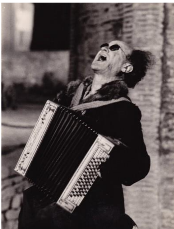
Slika 18: Slijepi harmonikaš u pohabanom kaputu, raščupane kose i sa sunčanim naočalama