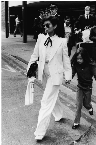
Sl. 1, Bianca Jagger nosi sako Yves Saint Laurenta

Jedan od najpamtljivijih odjevnih predmeta Yves Saint Laurenta bila je safari jakna koju je prvi put predstavio šezdesetih godina, a nakon toga je, zahvaljujući toj jakni, nastavio definirati svoj stil koji se temeljio na pretvaranju muških odjevnih predmeta u žensku modu. Safari jakna bila je savršena za visoke temperature tijekom ljeta te je vrlo brzo postala popularna. Yves Saint Laurent, osim brojnih modnih kolekcija, radio je i kao kostimograf, te je stvorio kostime za brojne filmove i predstave. Godine 1983. Metropolitan muzej u New Yorku otvorio je izložbu 'Yves Saint Laurent, 25 godina dizajna' kojoj je prisustvovalo milijun ljudi.