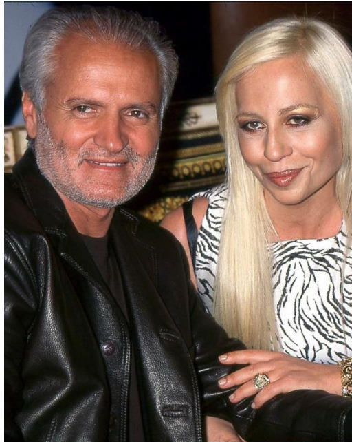
Slika 1. " Gianni i Donatella ", 1997.

Ništa manje inovativna, a elegantna, sa profinjenim ukusom za lijepo i senzualno, njegova mlađa sestra, Donatella. Nastavila je voditi tvrtku, a kako izgleda, vodi ju vrlo spretno i bez previše muka, poput snažne kraljice koja upravlja svojim carstvom mode i dizajna.