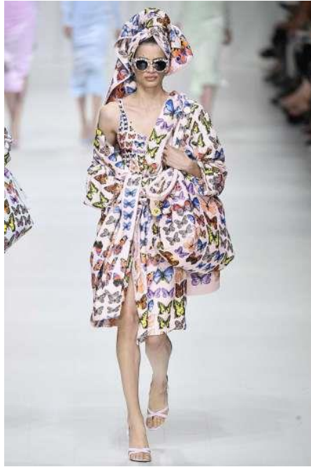
Slika 14. "Predmet iz "Kolekcije s leptirima" " 2018. Autor fotografije: Victor Virgile, URL: https://www.houstonchronicle.com/life/style/luxe-life/article/Summer-fashion-trend-prints-that-pop-13030486.php (pristupljeno 5.8.2020.)