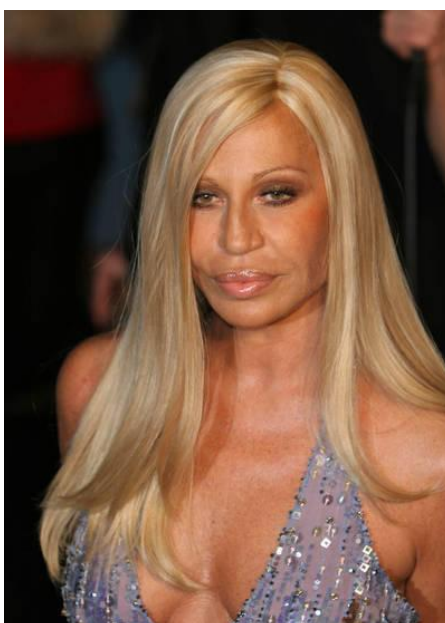
Slika 9. "Mlada Donatella Versace. Crna olovka oko očiju i platinasto plava kosa." 1997.

Donatella Versace, prvo poznata samo kao sestra velikog Giannia Versace kojoj je šivao i dizajnirao haljine za večernje izlaske, danas kao nasljednica i glavna izvršna direktorica jedne od najvećih modnih tvrtki svih vremena. Samu sebe u djetinjstvu opisuje kao "razmaženu bebu" u obitelji, kasnije kao "najbolje obučenu curu u gradu". Svom bratu je od najranijih dana služila kao muza i sa zadovoljstvom je nosila njegove kreacije, a već s 11 godina ju je počeo voditi sa sobom po noćnim klubovima. Platinasta kosa i crna olovka oko očiju su nešto što je Donatellin zaštitni znak.