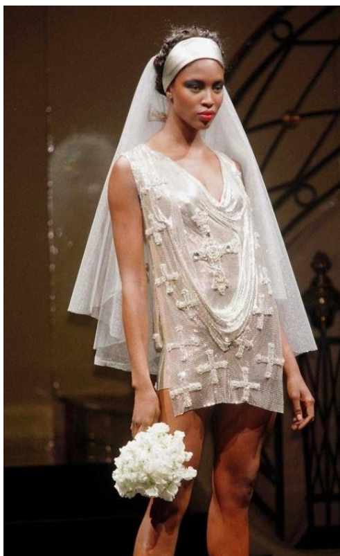
Slika 4. "Naomi Campbell na reviji u vjenčanici s metalnom mrežom i križevima", 1997.