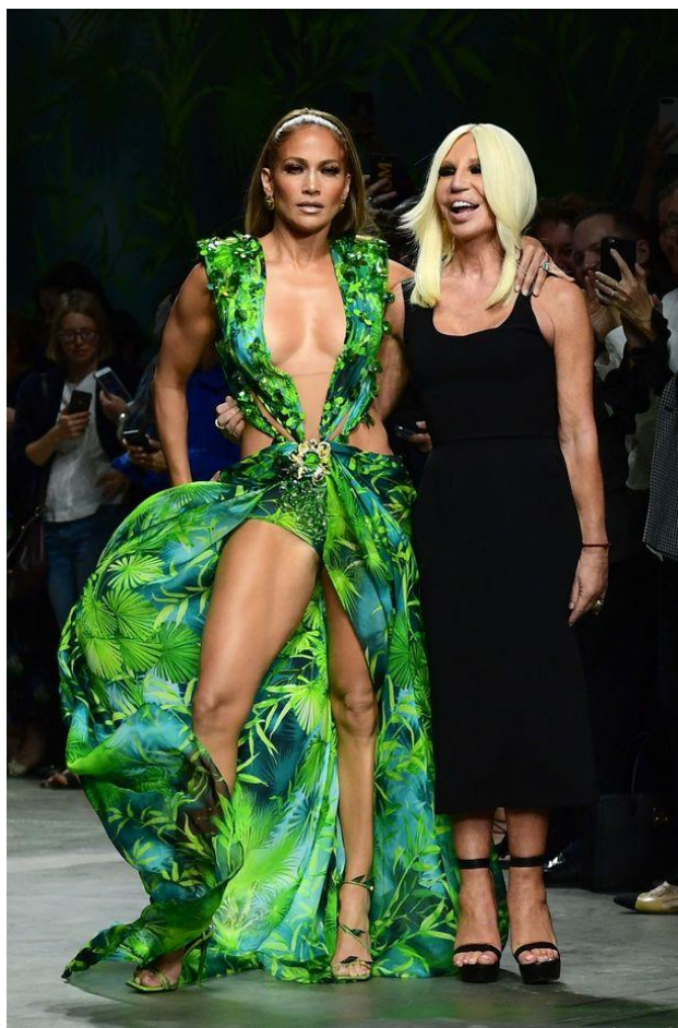
Slika 18 " Jennifer Lopez u reinkraniranoj haljini iz 2000. " 2019. Autor fotografije: Getty P.

URL: https://www.mirror.co.uk/3am/celebrity-news/jennifer-lopez-takes-walk-down-20134350 (pristupljeno 7.8.2020.)