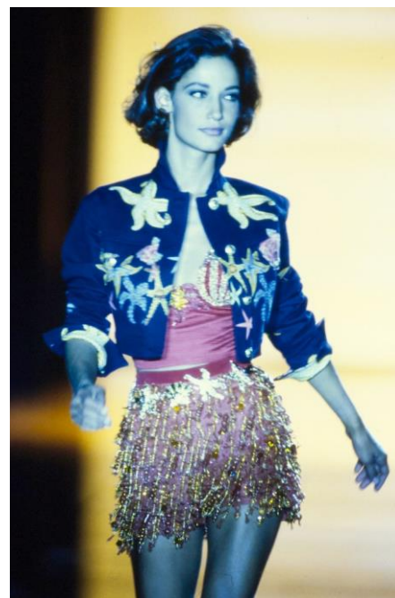
Slika 15. (lijevo) "Kolekcija "Trésor de la Mer" od Donatelle " 2018. URL (za obe fotografije): https://vintagevonwerth.de/products/gianni-versace-s-s-1992-cropped-denim-jacket-starfish-size-s?variant=12631522213939