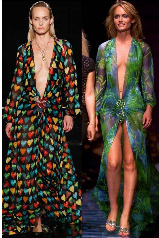
Slika 17. "Haljina s crnom podlogom i šarenim srcima zamijenila je trpske motive, ali ostavila je isti kroj" 2018. URL: https://www.harpersbazaar.com/fashion/fashion-week/a25381230/versace-pre-fall-2019-show/ (pristupljeno 5.8. 2020.)

Crvenog tepiha i zelene haljine J.Lo ovih su se dana prisjetili njezini obožavatelji diljem društvenih mreža i pjevačicu učinili trending temom. No nitko nije slutio da će graciozna i seksepilna Portorikanka zatvoriti jučerašnju reviju Donatelle Versace u Milanu. Samouvjereno je zatvorila reviju u haljini koja joj stoji kao salivena, kao i prije 20 godina. 50-godišnja J.Lo izgledala je poput grčke božice defilirajući pistom, zasjenivši tako Versaceove manekenke, s čime se složila i sama dizajnerica s kojom je naposljetku pozirala fotografima. Odmah je nakon revije podijelila fotografiju i snimku 20. obljetnice od ovog modnog trijumfa koji joj je nesumnjivo obilježio karijeru.