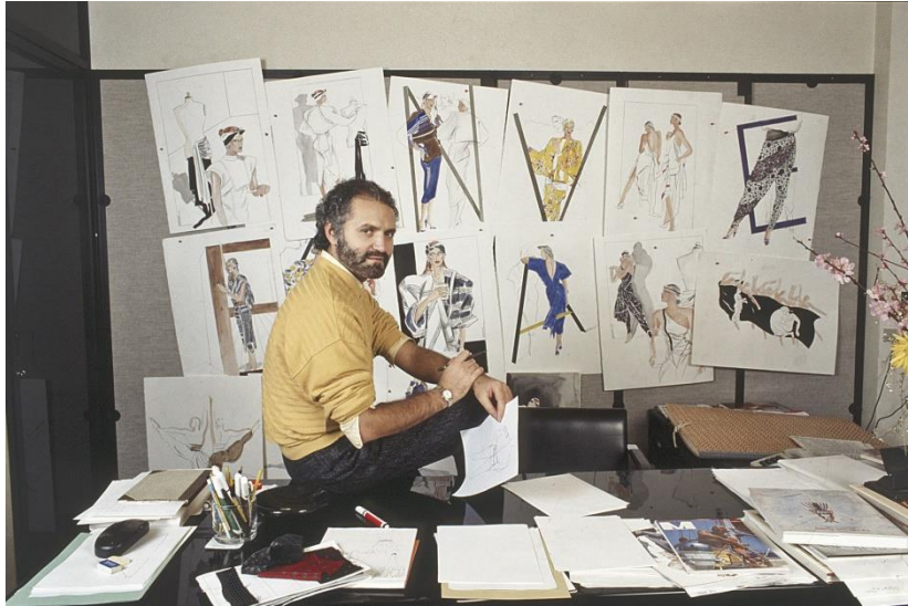
Slika 5. "Gianni s ilustracijama za novu kolekciju", 1990.