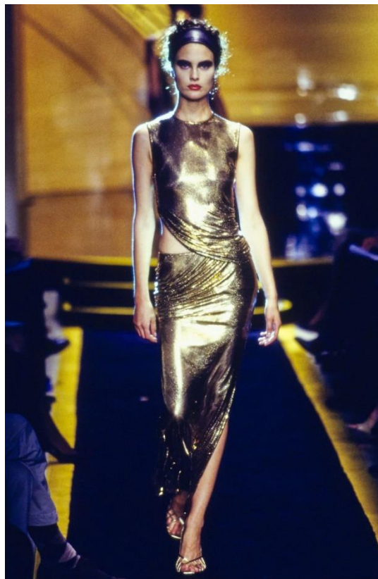
Slika 8. " Haljina od metala ", 1997.

Gianni, čiji je jesenji izgled spreman za nošenje u subotu navečer službeno otvorio tjedan talijanskih kolekcija ovdje. Gianni iz plodne mašte, čija izgleda metalna tkanina dolazi od kompjuteriziranog robota i visokotehnoloških strojeva za tkanje, a ne od ljudske umjetnosti, čije večernje haljine provjerene harlekinom izgledaju poput otisaka koji su počeli postati šahovske ploče, ali postali su psihodelični, s njihovim kvadratima koji nasumično mijenjaju veličinu i postaju sve deblji ili mršaviji kako nalažu hir ili tijelo ispod. Versace je jedini dizajner koji izgleda u stanju isplesti metal, a da nastane klizavi i mekani; dio razloga u ovosezonskim kolekcijama je taj što su ti otisci optičke iluzije pleteni u klizave elastične materijale, pa metalni kvadrati zaista mogu promijeniti oblik.