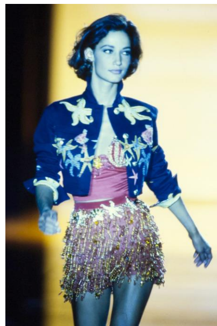
Slika 15. (lijevo) "Kolekcija "Trésor de la Mer" od Donatelle " 2018. URL (za obe fotografije): https://vintagevonwerth.de/products/gianni-versace-s-s-1992-cropped-denim-jacket-starfish-size-s?variant=12631522213939