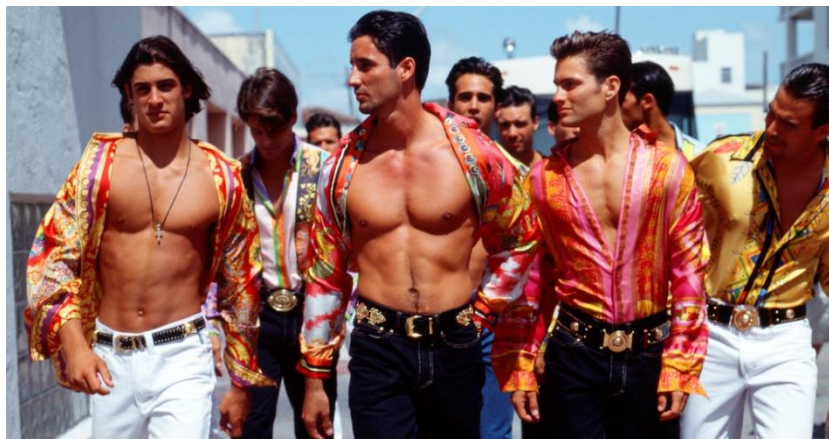
Slika 7. "Vidljiva tijela muškaraca na fotografijama Giannijevih kolekcija" 1993.

vještina, srce se može slomiti. A moderni bi se duh mogao vinuti. 4 Drugo, novi oblik muškog utjelovljenja uokvirivao je mršavu siluetu: ženstveno, mršavo, visoko, tinejdžersko, ne onesposobljeno i uglavnom bijelo muško tijelo. Ovaj je ideal predstavljao dramatičnu promjenu u odnosu na hiper muški i mišićavi model 1980-ih i 1990-ih. Vitki ideal tijela s početka dvadeset i prvog stoljeća u ovom izgledu modne piste iz prozora muške odjeće za proljeće / ljeto 2016. Saint Laurent, dok s druge strane se prikazuje mišićni ideal prethodnih desetljeća u ovom oglasu za Versace Signature iz 1994. godine. Muškarci su iskoristili napredak digitalnih tehnologija i mrežnih društvenih mreža kako bi prikazali svoja tijela i odabir odjeće. Iako je modna industrija uvodila objektivizirano muško tijelo u uobičajenu vizualnu kulturu devedesetih, pametni telefoni i društveni mediji povećali su te reprezentacije početkom dvadeset prvog stoljeća pružajući muškarcima alate i platforme za proizvodnju i objavljivanje slika samih sebe.