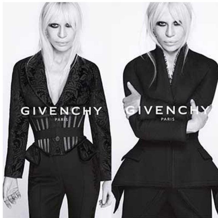
Slika 13 "Crno-bijele slike Donatelle za Givenchy" 2015. URL: https://www.look.co.uk/fashion/donatella-versace-is-the-new-face-of-givenchy-38694 (pristupljeno: 18.7.2020.)

iznenađenje za modne mode - Riccardo je vijest otkrio još u travnju, s tim da je modni paket s nestrpljenjem iščekivao fotografije. "Tako ponosan i počašćen što sam predstavio moju novu ultimativnu ikonu: Donatellu Versace", napisao je tada na Instagramu, uz crno-bijelu sliku para. To nije prvi put da Givenchy izaziva pomutnju - u svibnju je super zvijezda Beyoncé izazvala nagađanja da će pokrenuti kampanju za etiketu nakon što je 33-godišnjak primijećen na fotografiranju s Riccardom, odjeven od glave do pete u svojim dizajnom i poziranje za kameru na krovu u Brooklynu. Jedina stvar koju u modi ne volim je zapravo minimalizam - rekla je Donatella našalivši se na svoj račun jer joj mnogi modni kritičari spočitavaju 'pretjerani kič'. U svom kreiranju, Donatella je ostala verna prepoznatljivim stubovima Versace stila koje je njen brat utemeljio, te je stvarala odeću za žene koje se ne plaše da pokažu svoju jačinu ali i ženstvenost kroz senzualne i izazovne linije garderobe.