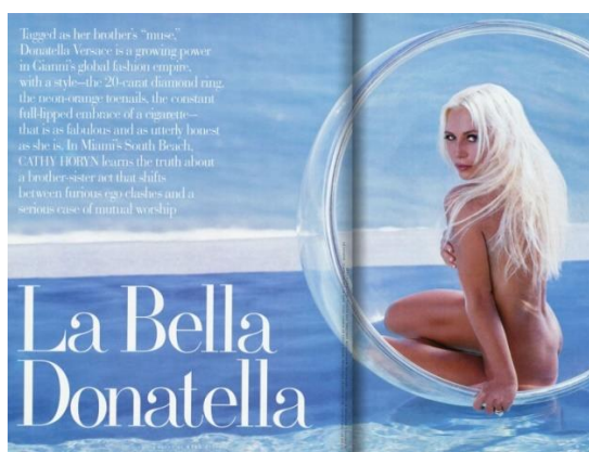
Slika 3. " Donatella u časopisu s naslovom "La Bella Donatella" ", 1997. Autor fotografije: Herb Rittz, URL: https://www.vanityfair.com/style/1997/06/donatella-versace-profile-cathy-hornby (pristupljeno 1.7.2020.)