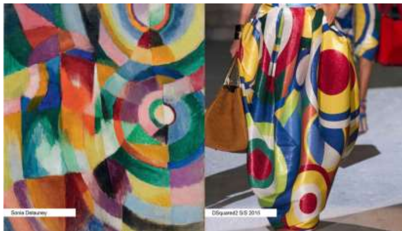
(slika br. 1, lijevo: electric prisms; 1914, desno: Dsquared2 S/S 2015)

Svaka ideja na papiru namijenjena tekstilnoj proizvodnji naziva se kreacijom tekstila. Tako da ako želimo neki uzorak, šaru ili dezen za tkaninu, pletivo ili vez prikazati na papiru, a potom realizirati u materijalu, moramo odrediti njezin raspored ponavljanja s obzirom na čitavu širinu tkanine koju zamišljamo izraditi, kao i visinu samog uzorka. Takav raspored ponavljanja jednog uzorka u odnosu na širinu tkanine zovemo raportom. Dizajn znači crtež ili skica, neka ideja izražena crtežom. Dizajn je umjetničko oblikovanje predmeta za upotrebu, što znači da je dizajn tekstila proces izrade dizajna za tkanine, pletiva i sl. To je proces od sirovine do gotovog proizvoda. Da bismo došli do gotovog proizvoda treba od nečeg krenuti. Prvo nam je potrebna osoba koja će sve to osmisliti (modnog dizajnera), osoba koja će potaknuti na ideju za završni produkt. U ovom slučaju mnogi su dizajneri ideje crpili iz već poznatih umjetničkih djela i uključivali ih u svoje. Tako je i Sonia Delaunay svojom umjetnošću i kreacijama utjecala na rad suvremenih modnih dizajnera. Dobivši ideju na temelju već nastalih radova, u ovom slučaju umjetničkog djela na platnu, to je bilo potrebno realizirati i prebaciti u uporabni tekstilni materijal iskoristiv namjeni odijevanja.