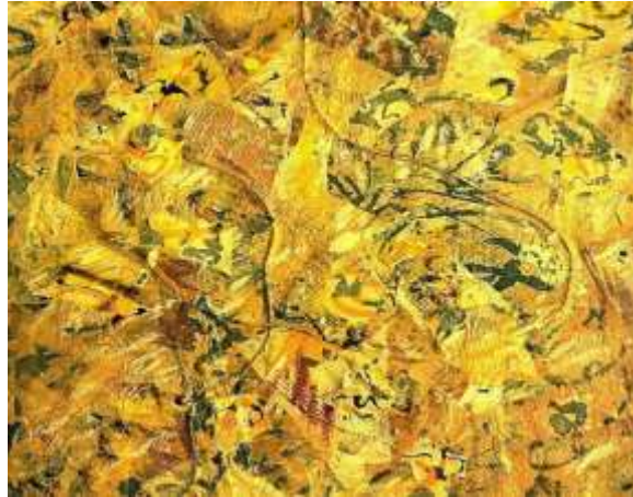
(slika br. 4, Jackson Pollock, 'Number 2', 1951)