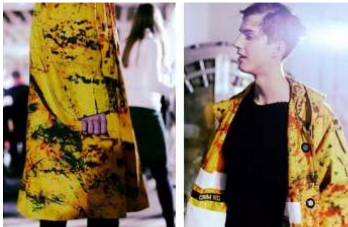
(slika br. 5, Raf Simons, X Ruby Sterling, AW 14 )

Mihara Yasuhiro, Japanski dizajner u kolekciji proljeće/ljeto koristio se ekspresionističkim potezima spontanog razlijevanja boje na svojim modelima. Model koji je vidljiv na slici br. 9 bijele je boje, prošaran s crveno crnim linijama i točkama baš kao na Pollockovoj slici „Untitled“ iz 1948. godine. Koristio je model umjesto platna kako bi prenio poruku publici. Crvena žarka boja, simbol snage u kombinaciji s neograničenim pokretima čine dezen u kojem dizajner ostavlja vlastiti rukopis, baš kako što su i slikari ostavljali na svojim djelima.