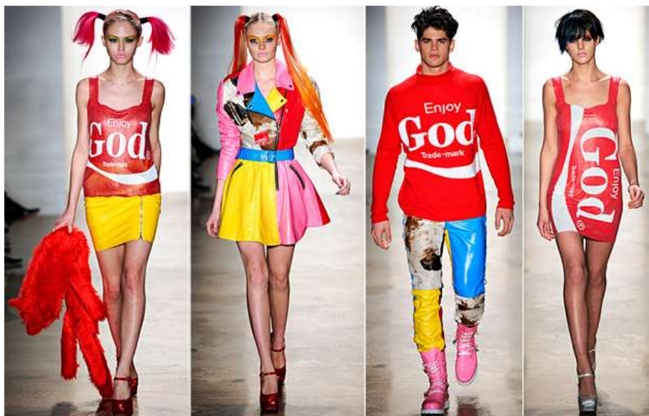
(slika br. 10, Jeremy Scott, jesen/zima, 2011)

Gianni Versace je 1991. godine napravio kolekciju koja sadrži verziju Warholovih “Merlinki”, koja je uistinu učinila umjetnika sinonim za visoku modu. 2008. Diana von Furstenberg izbacila je liniju kaftana i kupaćih kostima koristeći „pop“ boje i ikone portreta. Potom su velike tržišne marke Vans i Supreme 2012. izbacili kolekciju tenisica, majci i pokrivala za glavu također s Andyjevim Campbell juhama. Tu nije bio ni početak a ni kraj Warholovog utjecaja na modu, broj dizajnera koji je koristio njegove radove kao print na svojoj odjeći zapanjujuće je velik. Svaki njegov rad zarazno je mamio, znao je kako pronaći sljedeću stvar koja će zgrabiti ljude. Imao je instinkt i jedinstven talent za vizualizaciju i konceptualizaciju. Bez obzira na to odakle je njegova inspiracija došla, ili što ga je natjeralo na slikanje, jedna stvar je sigurna – njegov utjecaj je i dalje snažan i još uvijek postoji strast prema odjeći nadahnutoj stilom pop-arta.