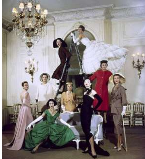
Slika 5. Diorovi modeli poziraju u novoj kolekciji, u njegovom salonu u Parizu, 1957.g.