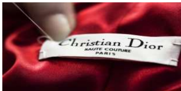
Slika 1. Christian Dior label, visoka moda, Pariz

Ime Christiana Diora danas je sinonim za luksuz, ljepotu i dobar ukus. Dizajner je zaslužio to svojim predanim radom i inovativnošću, osobinama koje su ga prometnule u jednog od najvećih modnih vizionara dvadesetog stoljeća.