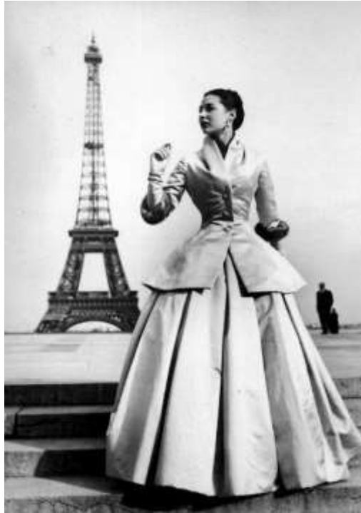
Slika 7. „Zemire“ haljina, Pariz, 1957.g.