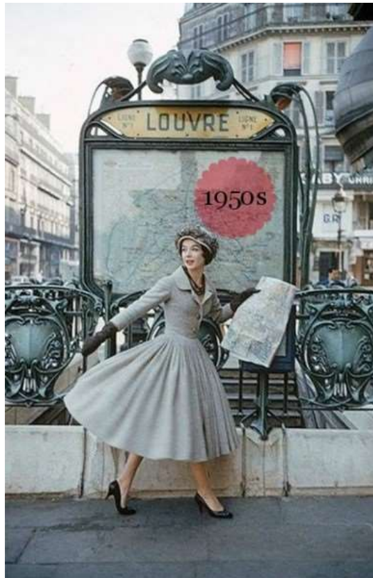
Slika12. Fotografija Diorovog modela iz 50-ih u Parizu.