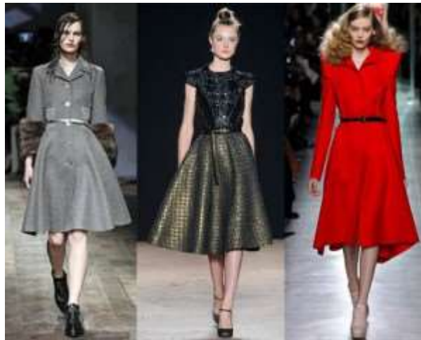
Slika 11. Revitalizacija New looka, revija 2013.g.- Prada , Aquilano Rimondi, Bottega Venet

Mnogi dizajneri današnjice i dalje „kopiraju“ slavnog dizajnera u svojim kreacijama. Toliko je utjecao na modu pa je apsolutno nemoguće njegovo učestalo nepojavljivnje i danas. Dobar takav primjer je i revija iz 2013.g. - Prada , Aquilano Rimondi, Bottega Veneta. Na ovom primjeru vidimo značajke New looka sa uskim strukom i širokim punim sknjama.