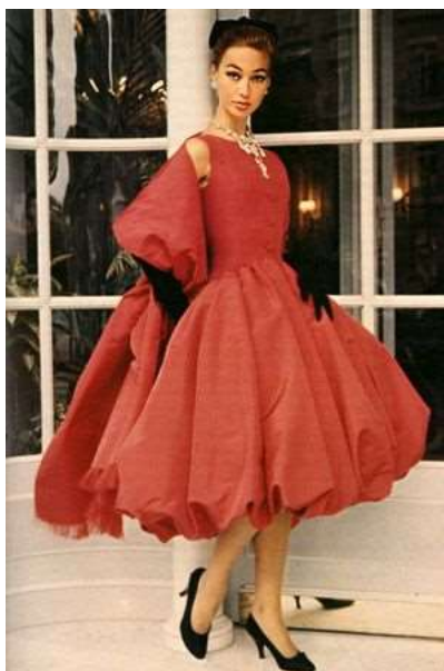
Slika 9. Diorov model u crvenoj „Bubble dress“, 1950.g.