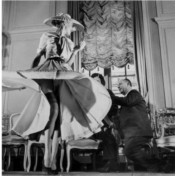
Slika 4.: Christian Dior sa svojim modelom u haljini iz new look kolekcije, 1947.g.

Ali naposljetku New look je bio pogrešan naziv. Što je zapravo bilo novo nakon svega u tome da se žene odijevaju u sex objekte i statusne simbole za svoje muževe? New look je bila modna revolucija koja je vratila žene pravo u Belle Epoque . Reflektirala je Diorovu želju da oživi tradiciju lukuza u francuskoj modi. To je zapravo bila njegova tajna uspjeha. Dior se oglasio rekavši „ Na Europu je palo dosta bombi, sada želim vatromet “. 10 Time se vratio u sigurnu prošlost kakva je bila prije rata i svih nereda. Uskoro New look je bio nezaustavljiv. U Londonu je bilo prodato 7000 odijela u samo dva tjedna.