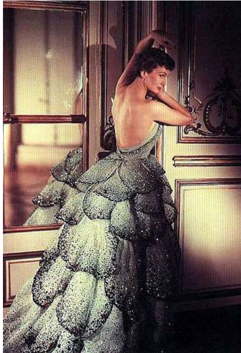
Slika 8. „Junno dress“, jedna od značajnijih Diorovih kreacija, iz kolekcije jesen/zima 1949/1950g.