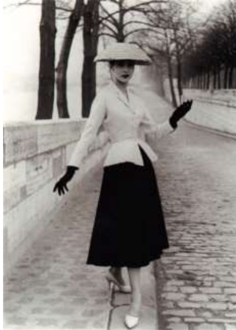
Slika.6: Model nosi „Bar“ odijelo iz kolekcije New look, pokraj sene, 1947.g.

je u modnom smislu bezvremenska. To odijelo je postalo toliko popularno te se moglo vidjeti na ženama po cijelom Parizu, ali ne samo u Parizu nego i diljem svijeta.