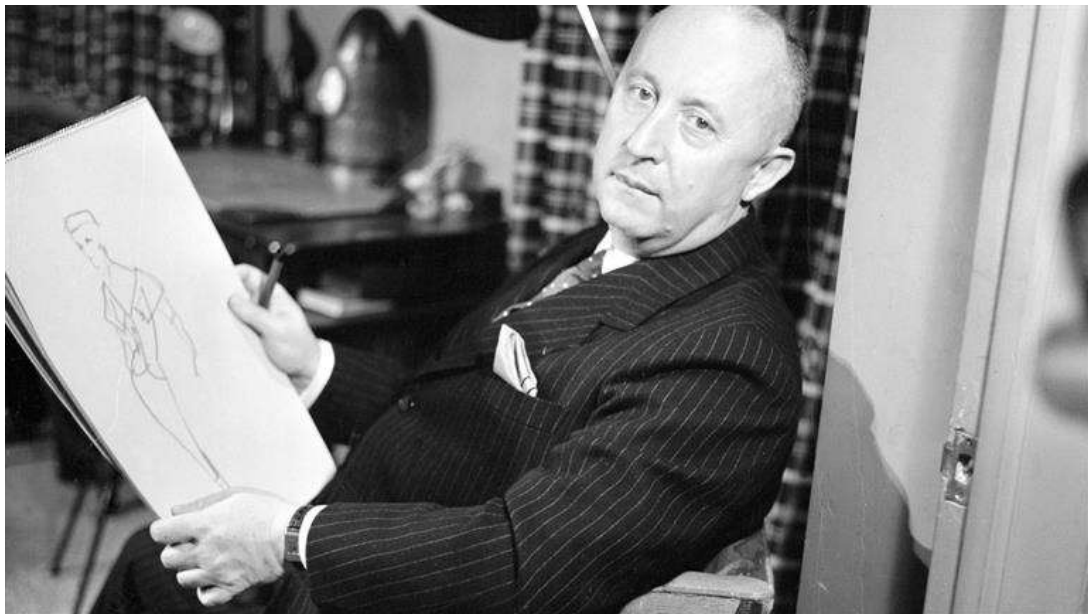
Slika3. Modni dizajner Christian Dior u svom ateljeu prilikom skiciranja modela

Danas je modna kuća Dior jedna od glavnih lidera u svijetu mode. Proizvode konfekcijsku odjeću, kožnu odjeću, modne dodatke, obuću, nakit, šminku i različite kozmetičke proizvode. Sa 60. godina uspjeha kuća Dior je savršena definicija visoke mode: delikatna, sofisticirana i puna karaktera. Današnje zvijezde rado nose modele iz recentnih kolekcija ove modne kuće, ali za posebne prilike posegnu za vintage modelima slavnog dizajnera. Svi njegovi nasljednici su odavali počast modnim izričajima dizajnera.