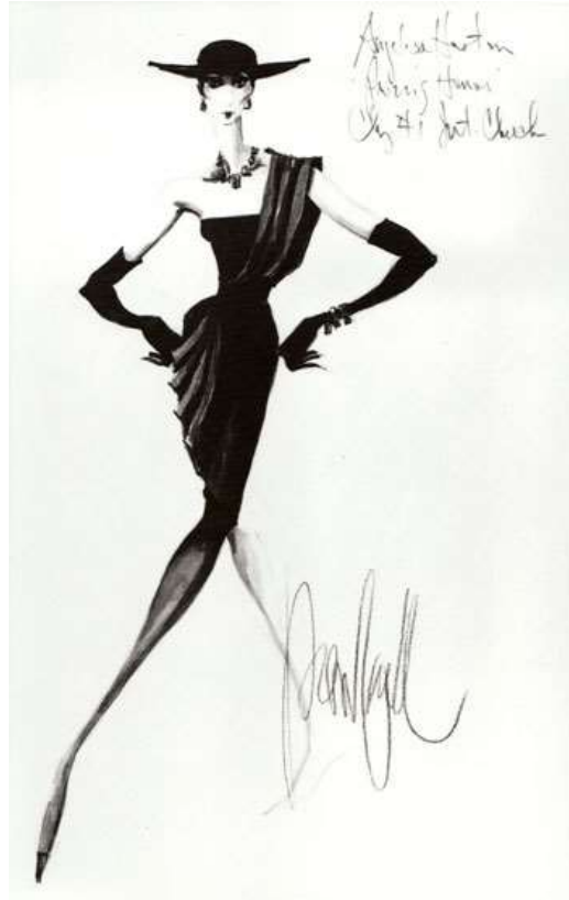
Slika 2: Jedna od značajnijih skica modela Christiana Diora iz 50-ih