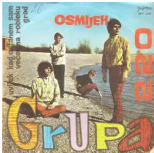
Slika 11.: Naslovnica albuma „Osmijeh“ Grupe 220 iz 1967. godine

Omasovljavanje rock scene u Hrvatskoj zbilo se sedamdesetih godina prošloga stoljeća, kada se rock počeo dijeliti na žanrove poput hard rocka, progresivnog rocka, jazz rocka, art rocka, glam rocka, folk rocka, simfonijskog rocka, blues rocka i boogie rocka. Hrvatski rock bendovi nisu nimalo zaostajali za svojim kolegama u svijetu, pa je svaki od ovih žanrovskih pravaca imao barem jednog predstavnika. U tom periodu su se pojavili i neki od najvećih hrvatskih stadionskih rock sastava: Time, Parni valjak, Atomsko sklonište. Što se njihova stila tiče, na svojim su se koncertima odijevali identično bendovima istog žanrovskog opredjeljenja u npr. Engleskoj ili SAD.