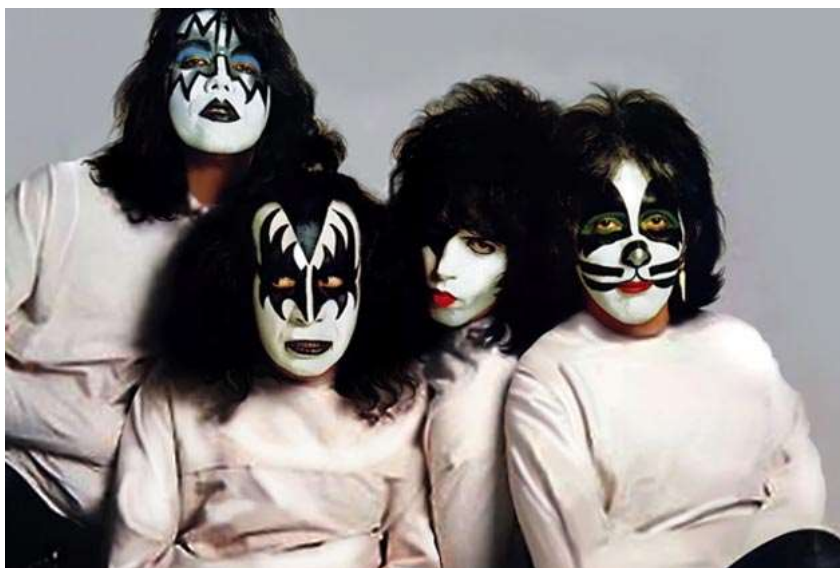
Slika 6.: Kiss 1979.

Slično Alicu Cooperu šminkali su se i članovi benda Kiss osnovanog 1973. iako, za razliku od Alice Coopera nisu svirali heavy metal već glam rock. Članovi ovog benda za vrijeme vrhunca svoje karijere nisu se u javnosti pojavljivali bez obojenih lica tako da je tada malo tko znao kako oni zapravo izgledaju. Za grupu Kiss bilo je specifično to što je svaki član uvijek imao našminkano lice na jednak način.