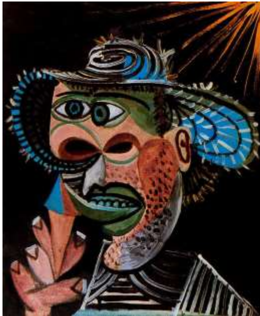
Slika 18. Pablo Picasso, Čovjek sa šeširo, 1938