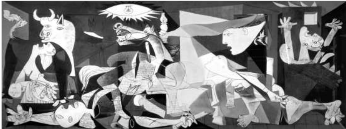
Slika 20. Pablo Picasso, Guernice , 1937

S početkom španjolskog Građanskog rata nastupaju turobne godine. Pozvan od republikanske vlade, Picasso slika za španjolski paviljon Svjetske izložbe maestralno dijelo koje nosi naziv Guernice . Dvije godine poslije i Francuska ulazi u rat. Picasso ostaje u Parizu, uznemiren, napadan no zaštićen svojom slavom. Njegova platna, bilo da je riječ o Mački koja lovi pticu (1939), završenoj na dan kraja rata u Španjolskoj, ili o Velikom ležećem aktu (1943) ili pak mrtvoj prirodi Vrč i kostur (1945), govore o nezamislivoj tragediji i kao da su zaogrnuti crninom, baš kao i to vrijeme.