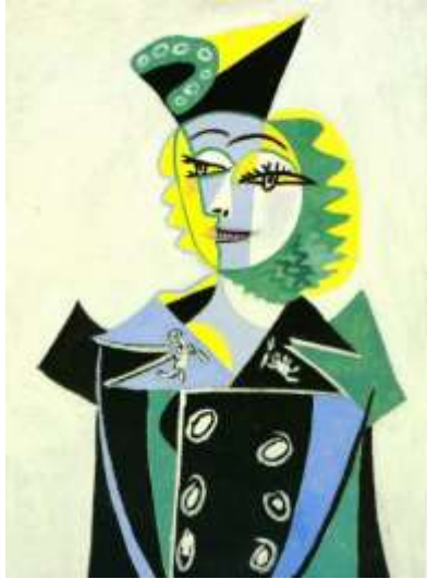
Slika 17. Pablo Picasso, Portret Nusch Eluard, 1937