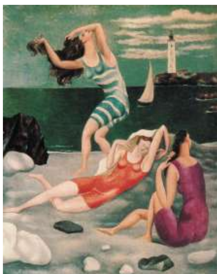
Slika 12. Pablo Picasso, Kupačice , 1918.

Prvi svjetski rat predstavlja zaokret u njegovom djelu i nagovještuje razdoblje kompleksnog stvaranja. Umjetnik nastavlja u kubističkoj maniri i slika Lulu Čašu i igraću kartu (1918) no svoje suvremenike zbunjuje kada za Kupačice (ljetno 1918) odabire svakodnevnu scenu vraćajući se naizgled klasičnijoj figuraciji. To je i slučaj s veličanstvenom intimističkom slikom Portret Olge u fotelji (proljeće 1918). Picassova mlada zaručnica, balerina u Ruskom baletu, odjevena je u haljinu ukrašenu floralnim motivima u skladu sa uzorkom na fotelji i lepezom u njenoj desnoj ruci. Tamne boje odjeće zrače blagom melankolijom.