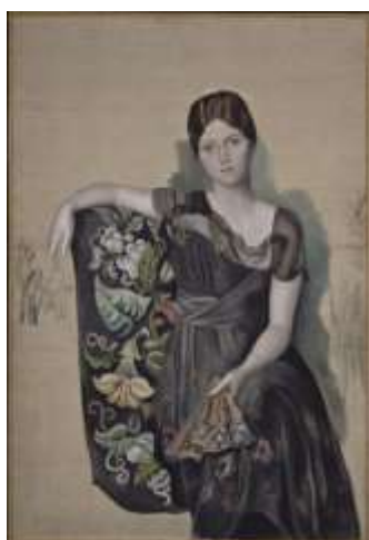
Slika 13. Pablo Picasso, Olga u fotelji, 1918.

Nadahnut ruševinama antičke umjetnosti u Rimu, Picasso početkom 1920-ih slika skulpturalne likove modernog klasicizma. Panova frula (ljetno 1923), nastala za vrijeme njegovog ljetnog boravka na Antibima.