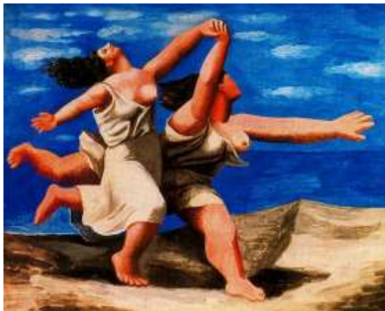
Slika 14. Dvije žene trče plažom ljeti, 1922.

Sredinom dvadesetih nadrealisti se približavaju Picassu. Picasso se ne uključuje u grupu predvođenu Andreom Bretonom, ali surađuje povremeno na njihovim projektima braneći se da nije nadrealist. Te su Picassove godine obilježene povratkom na Cezanneovu i Renoirovu omiljenu temu kupačica. Nimfe postaju kupačice čija su plastična tijela na plaži podvrgnuta slikarevim transformacijama. Od Dvije žene trče plažom ljeti (1922) naslikane za kazališnu zavjesu za balet Plavi vlak, do Kupačica u igri sa loptom (1929), Kupačica otvara kabinu (1928) i Ljudi uz more (1931), pretjerana izdužena ženska tijela uravnotežuju se i ukrutnjuju da bi na kraju zadobila neodređen oblik sličan organskome i mineralnom.