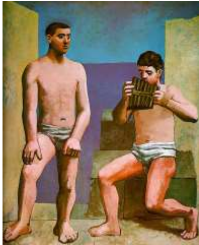
Slika 13. Pablo Picasso, Panova frula, 1923.

Sredinom dvadesetih nadrealisti se približavaju Picassu. Picasso se ne uključuje u grupu predvođenu Andreom Bretonom, ali surađuje povremeno na njihovim projektima braneći se da nije nadrealist. Te su Picassove godine obilježene povratkom na Cezanneovu i Renoirovu omiljenu temu kupačica. Nimfe postaju kupačice čija su plastična tijela na plaži podvrgnuta slikarevim transformacijama. Od Dvije žene trče plažom ljeti (1922) naslikane za kazališnu zavjesu za balet Plavi vlak, do Kupačica u igri sa loptom (1929), Kupačica otvara kabinu (1928) i Ljudi uz more (1931), pretjerana izdužena ženska tijela uravnotežuju se i ukrutnjuju da bi na kraju zadobila neodređen oblik sličan organskome i mineralnom.