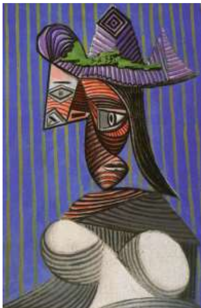
Slika 19. Pablo Picasso, Žena, 1939