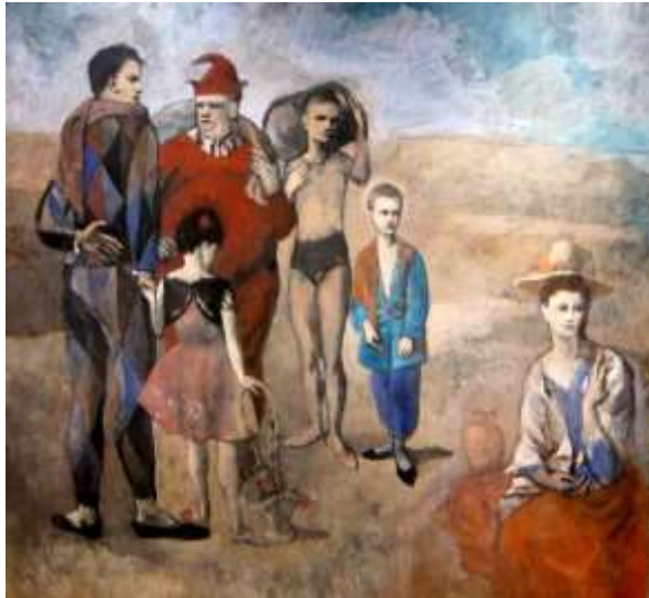
Slika 2. Pablo Picasso, Obitelj cirkusanata, 1905.

U tom razdoblju je naslikao američku spisateljicu Gertrude Stein koja je živjela u Parizu još od 1903. godine te ga 1906. upoznala sa Matisseom. Gertrude Stein rekla je da je Picassu pozirala devedeset puta dok je slikao njezin portret. “Njezina bujna pojava karakteristično odjevena u obilatu, komotnu odjeću, poprima pozu neuobičajenu za ženski model, pozu koja jasno govori o samosvjesnoj naravi žene koja je smiono objavila svoju umjetničku genijalnost. Ona ispunjava prostor poput moćne, masivne skulpture. Picasso je napustio slikanje tog portreta za vrijeme ljetnih praznika u Španjolskoj, pa kad se vratio, naslikao je Steino lice po sjećanju. Njezin lik sličan maski, s iskošenim očima, nagovještava izobličenja u nadolazećim godinama.”(Arnason,2009:161)