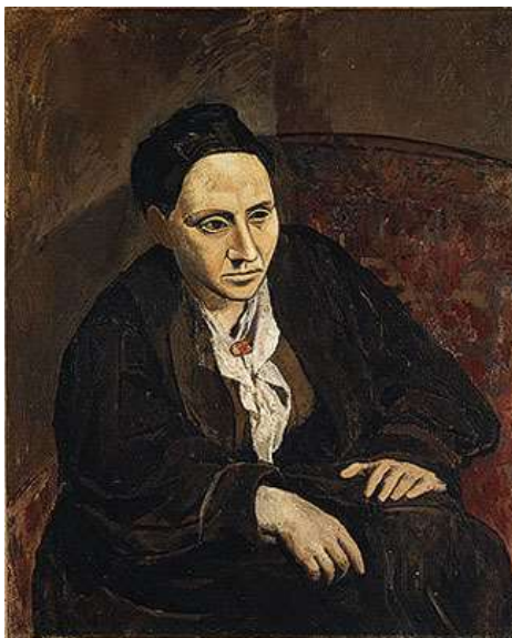
Slika 3. Pablo Picasso, Gertrude Stein, 1905

U tom razdoblju je naslikao američku spisateljicu Gertrude Stein koja je živjela u Parizu još od 1903. godine te ga 1906. upoznala sa Matisseom. Gertrude Stein rekla je da je Picassu pozirala devedeset puta dok je slikao njezin portret. “Njezina bujna pojava karakteristično odjevena u obilatu, komotnu odjeću, poprima pozu neuobičajenu za ženski model, pozu koja jasno govori o samosvjesnoj naravi žene koja je smiono objavila svoju umjetničku genijalnost. Ona ispunjava prostor poput moćne, masivne skulpture. Picasso je napustio slikanje tog portreta za vrijeme ljetnih praznika u Španjolskoj, pa kad se vratio, naslikao je Steino lice po sjećanju. Njezin lik sličan maski, s iskošenim očima, nagovještava izobličenja u nadolazećim godinama.”(Arnason,2009:161)