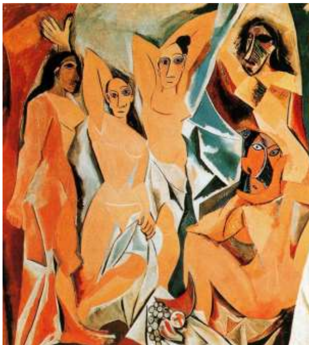
Slika 4. Pablo Picasso, Gospođice iz Avignona , 1907

Tri žene na lijevo imaju pojednostavnjene “iberske” crte koje su nam poznate iz Dva akta . Međutim, najšokantnije su od svegagrubo naslikane maske koje stoje umjesto lica dvaju likova na desnoj strani. Ovdje je, kako piše Steinberg, seksualnost “lišena svih dodataka kulture - ne apelira na intimnost, nježnost, galantnost ili ono poštovanje ljepote koje predstavlja odvajanje i udaljavanje.” ( Arnason,2009:163)