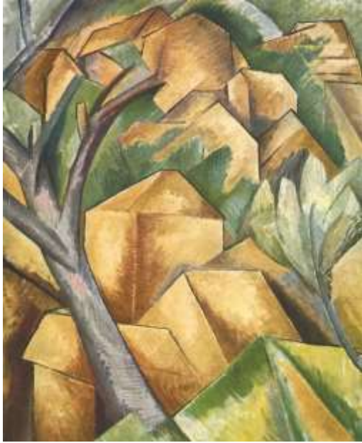
Slika 6. Georges Braque, Kuće u E'Lestqueu, 1908

“U Kućama u E'Lestqueu Braque je ustanovio temeljnu sintaksu ranog kubizma. Obično mu se odaje priznanje da je to sam postigao, prije uspostavljanja stalne komunikacije s Picassom koja će biti obilježje iduće faze razvitka kubizma.