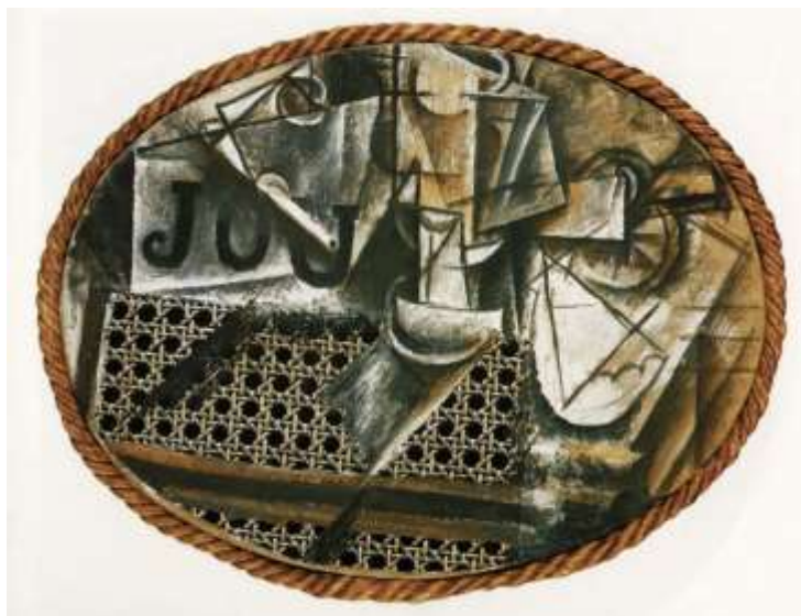
Slika 10. Pablo Picasso, Mrtva priroda sa pletenom trstikom za solice, 1912

U svibnju 1912. godine kubistička potraga za alternativnim načinima prikazivanja dovela je Picassa do izuma kolaža, koje je započeo malim, ali revolucionarnim djelom Mrtva priroda s pletenom trstikom za stolice . Ova mrtva priroda naslikana na ovalnoj podlozi, obliku koji su Picasso i Braque već bili usvojili za ranije kubističke slike, prikazuje predmete rasute po kavanskom stolu. Međutim, najistaknutiji element ovdje je komad običnog voštanog platna na koji je mehanički otisnut uzorak koji ima ulogu pletene trske za stolice. Picasso je naljepio to platno izravno na svoje slikarsko platno. Dok njegov trompe l'oeil materijal nudi zahtjevan stupanj iluzionizma, on je i dalje fikcija kao i Picassove naslikane forme, jer je i dalje faksimil trske za stolice, a ne stvarna trstica. Sliku je uokvirio stvarnim užetom kao ironičnom imitacijom tradicionalnog zlatnog okvira.