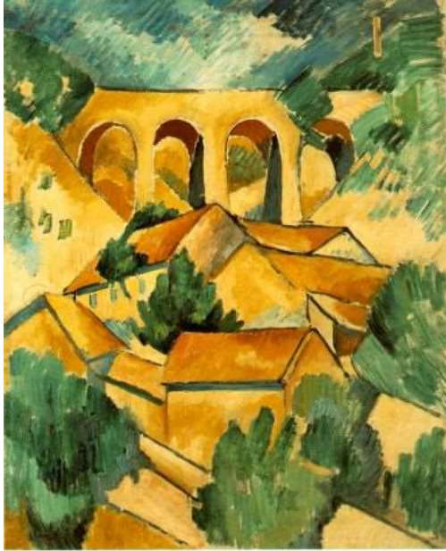
Slika 5. Georges Braque, Vijadukt kod E'Lestqua, 1907