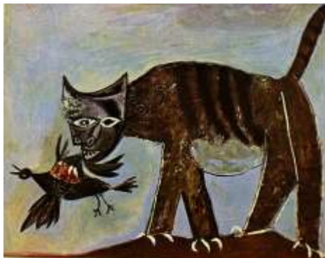
Slika 21. Pablo Picasso, Mačka koja lovi pticu , 1939

No, Picasso se vraća slikarstvu koje je oduvijek u njemu. Početkom pedesetih godina započinje seriju slika po uzoru na stare majstore, posebno Velasqueza, Delacroixa, Couberta ili Maneta. Serija Doručak na travi zaokuplja ga dvije godine, od 1959 do 1961. Picasso stvara slike, crteže i kartonske makete nadahnute Monetom. Preuzima glavne elemente njegova slikarstva i koristi ih na vlastiti način upuštajući se u stilsku vježbu koja djeluje kao slikarski ispis fuge. S tom serijom slika, naizgled nastalih "po uzoru na" Picassovo djelo otvara doba postmodernizma.