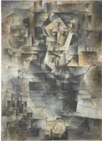
Slika 8. Pablo Picasso, Portret Daniel-Henryja, 1910

1909. godine Braque uvodi novi element u svoju sliku Portugalac , a to su šablonski slikana slova i brojevi u gornjem djelu slike. Braqueovo uvođenje slova u sliku, prakse koju će uskoro usvojiti i Picasso, bilo je jedan od mnogih kubističkih inovacija koje su imale dalekosežne posljedice za modernu umjetnost.