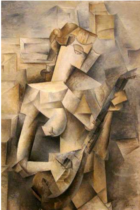
Slika 7. Pablo Picasso, Djevojka sa mandolinom , 1910

paletom , Picassov stil izgleda malo manje radikaln. Figura zadržava dojam organske i u nekim područjima jasno se skulpturalnim modeliranjem odvaja od pozadinske plohe, što je osobito očito u zaobljenim volumenima desne grudi i desne ruke modela.