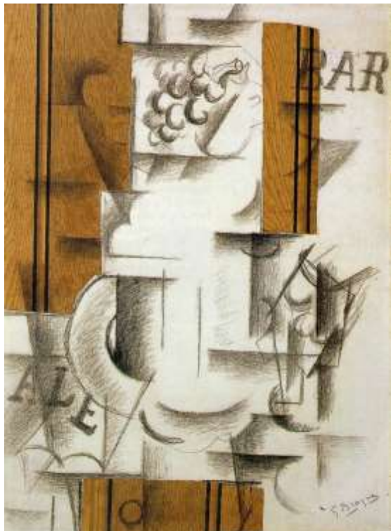
Slika 11. Georges Braque, Posuda s voćem i čaša , 1912

Braque je izradio svoj prvi papier colle , Posuda s voćem i čaša u rujnu 1912. godine.