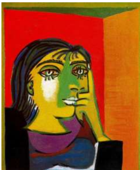
Slika 16, Pablo Picasso, Portret Dore Maar, 1937