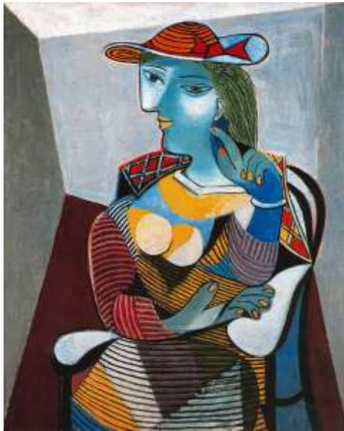
Slika 15, Pablo Picasso, Portret Marie-Therese, 1937

žuti akcent, portret Dore Maar je kontrasniji i doima se da sjaji na višebrojnoj podlozi izbrazdanoj špahtlom. Ta dvostruka slika otkriva promjenu u Picassovom životu, ali i u načinu na koji umjetnik tretira žanr portreta koji će tijekom cijelog desetljeća biti važan dio njegova slikarstva. Dok tradicionalni portret cijenimo zbog njegove sličnosti s modelom, Picasso, ponekad tvrdoglavo, u svojim portretima nastoji zamutiti znakove indentiteta.