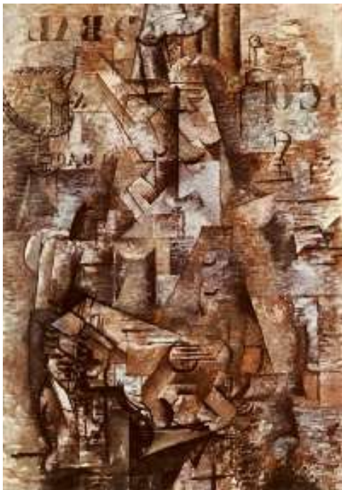
Slika 9. Georges Braque, Portugalac, 1911

1909. godine Braque uvodi novi element u svoju sliku Portugalac , a to su šablonski slikana slova i brojevi u gornjem djelu slike. Braqueovo uvođenje slova u sliku, prakse koju će uskoro usvojiti i Picasso, bilo je jedan od mnogih kubističkih inovacija koje su imale dalekosežne posljedice za modernu umjetnost.