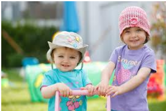
Slika 1 Tekstil za bebe i djecu do treće godine

Tekstil i igračke od tekstila za bebe i djecu do 3 godine starosti npr. donje rublje, kombinezoni, posteljina, mekane igračke i sl.