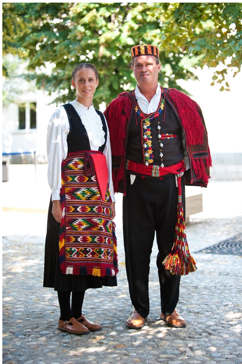
Slika 6. Narodnja nošnja na području Šibenika