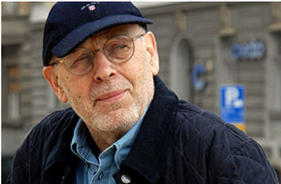
Slika 23. Željko Senečić

Od ostalih nagrada dobio je četiri Zlatne arene za scenografiju na Festivalu jugoslavenskog igranog filma (1964, 1985) te Filmskog festivala u Puli (1992, 2001); nagrade za scenografiju na Festivalu jugoslavenske televizije na Bledu (1968, 1971) i u Portorožu (1982, 1984); nagradu Dr. Branko Gavella za kazališnu scenografiju (1980); nagradu Vladimir Nazor za životno djelo za filmsku umjetnost (1996); Nagradu za životno djelo za scenografiju na Motovunskom filmskom festivalu (2005); nagradu Zlatni Oktavijan za životno djelo za scenografiju u hrvatskoj kinematografiji (2015).