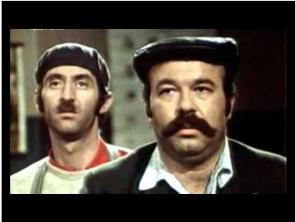
Slika 14. Bukara i Mačak