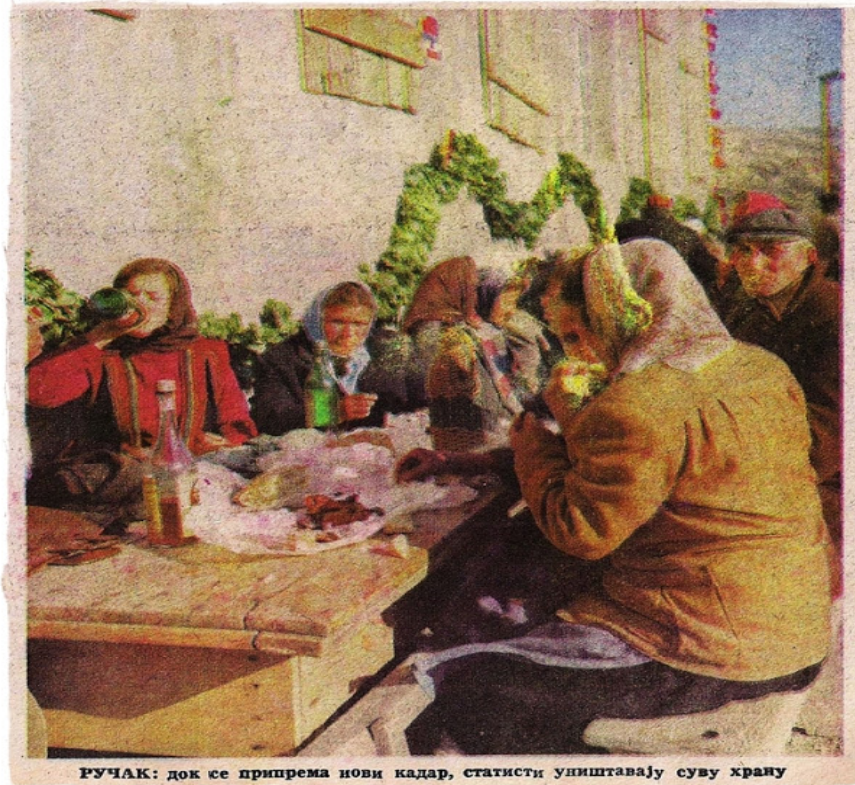
Slika 9: Seljaci Mrduše Donje uživaju u hrani i piću

nađe nekoga tko će stati na njegovu stranu i podržati ga ostaju uzaludni. Odbija ga i Anđa; slomljeni Joco odlazi, a seljaci nastavljaju s plesom.