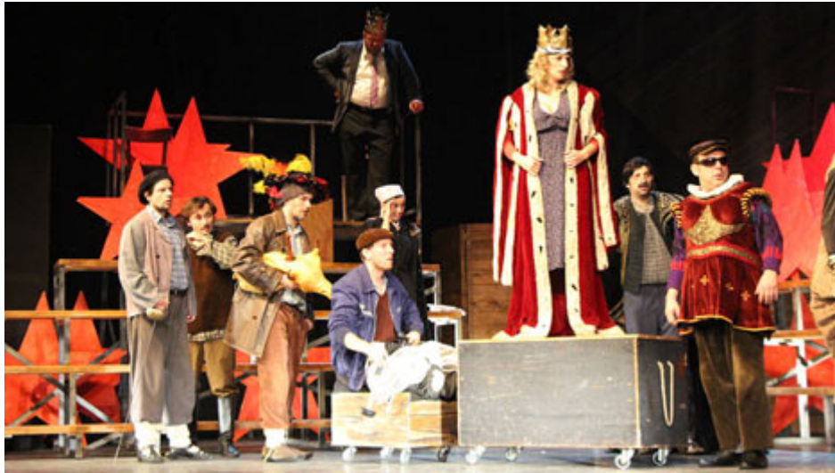
Slika 26: Na kazališnim daskama scena iz Predstave Hamleta u selu Mrduša Donja

Bukara, partijski sekretar, sugestivno, koristeći se političkom retorikom uvjerava učitelja da bi Hamlet trebao biti jedan pozitivan drug i rukovodilac koji se bori za prava radnoga naroda. „Ne može on tute da bude niki princ, pristolonaslidnik, šta ti ga ja znam...“