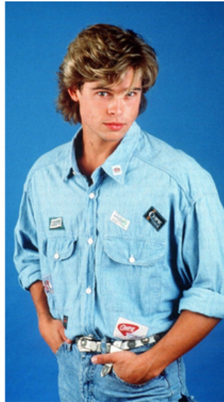
Slika 5. Prikaz stila odjevanja muškarca iz 80-tih