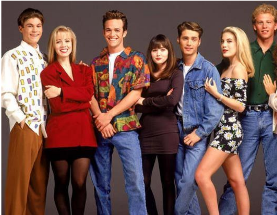
Slika 1. Odjeća iz 80-tih