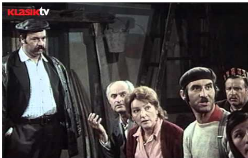
Slika 18. Mještani na Seoskoj skupštini

U predstavi koju priređuju u selu ona glumi Kraljicu, a kostim joj se sastoji od zlatne krune, crvenog bolera, velike crvene ogrlice, te duge crne haljine od satena, nabrane kako bi izgledala kao krinolina.