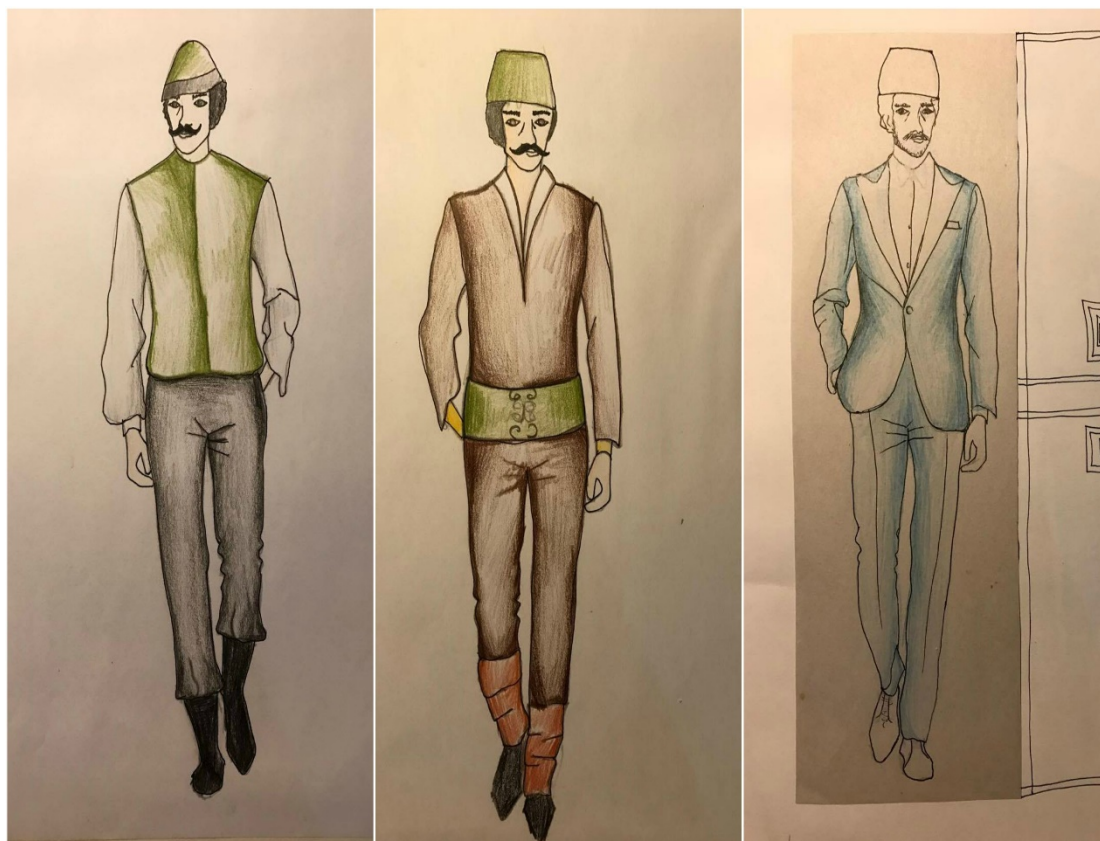
Slika: Primjer kostima za predstavu "Predstava Hamleta u selu Mrduša Donja"

Inspiraciju za izradu ovoga kostima sam pronašla u filmu Predstava Hamleta u selu Mrduša Donja. Isključivo sam se bazirala na filmu, jer sam si na taj način mogla vizualno jasno predočiti godine zbivanja radnje, mjesto zbivanja, prikaz mentaliteta ljudi te podneblje u koje je značajno utjecalo na karakter filma. Također, budući da osobno jako volim narodne nošnje Dalmatinske Zagore, inspiraciju nošnjama tog kraja pokušala sam povezati kako s dijelovima tradicije tako i suvremenog doba. Kao svoj finalni kostim odabrala sam lik Anđe, kako bih što upečatljivije dočarala taj bezbrižni seoski štih 80-tih.