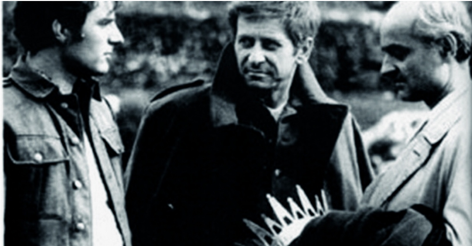
Slika 16. Joca sa svojim ocem i Učiteljem