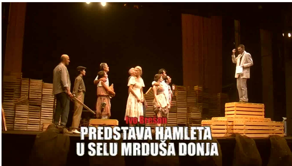
Slika 25. Plakat za Predstavu Hamleta u selu Mrduša Donja