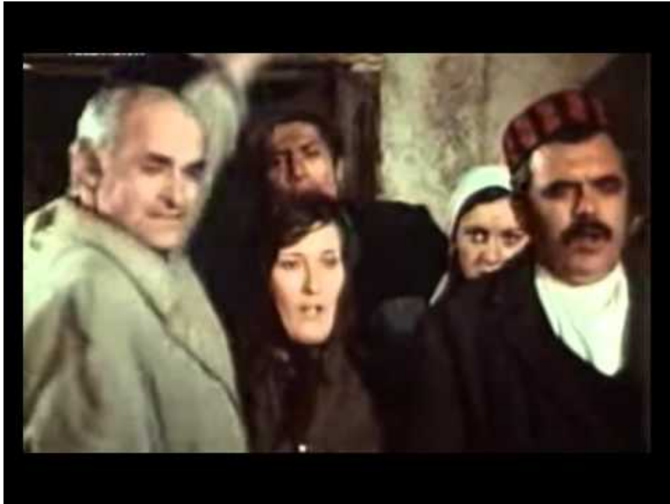
Slika 15: Učitelj i seljani