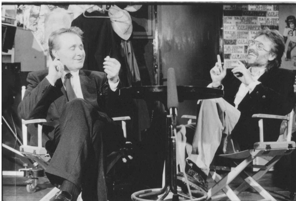
Slika 21. Prikaz Krste Papića u mlađim danima

Osim dokumentaraca, Krsto Papić je postao poznat i po svojim igranim filmovima. Godine 1969. režirao je „Lisice“ koje problematiziraju represiju komunističke tajne policije. Film je osvojio Zlatnu arenu i prikazan je u Cannesu. Potom su uslijedili „Predstava Hamleta u selu Mrduša Donja“ pa horor „Izbavitelj“ (1976.) 80-ih godina prošloga stoljeća Papić je režirao biografski film „Tajna Nikole Tesle“, a 1988. snimio je „Život sa stricem“, svoj najbolji film. Film je bio veliki hit, iritirao je komunističke vlastodršce, ali je ipak dobio Zlatnu arenu i nagradu festivalu u Montrealu. Nakon osamostaljenja Hrvatske, Papić je snimio „Priču iz Hrvatske“ (1992.). „Kad mrtvi zapjevaju“ tragikomedija je kojom je osvojio treću Zlatnu arenu.