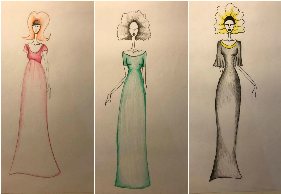
Slika: Primjer kostima za predstavu "Predstava Hamleta u selu Mrduša Donja"