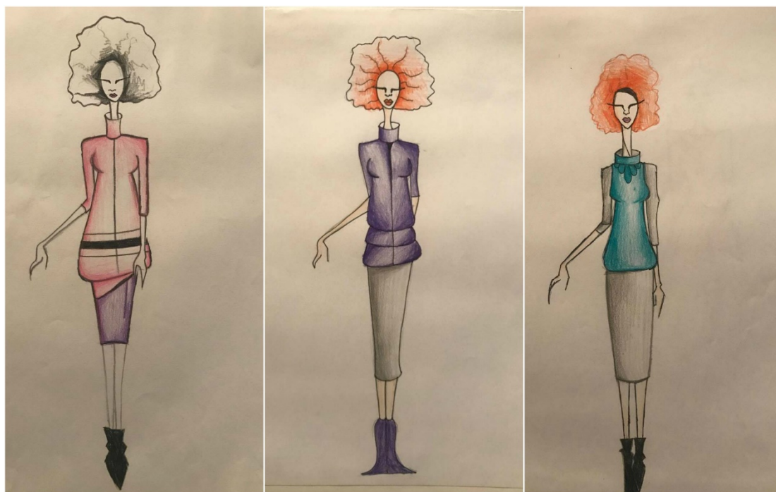
Slika: Primjer kostima za predstavu "Predstava Hamleta u selu Mrduša Donja"