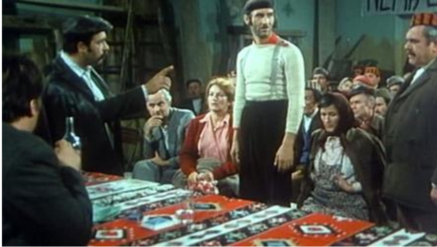
Slika 13. Sastanak seljana; Mačak vodi riječ