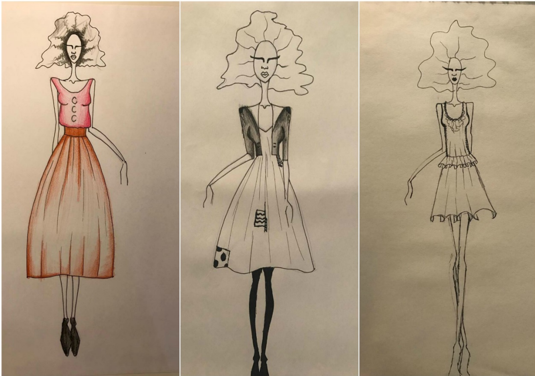
Slika: Primjer kostima za predstavu "Predstava Hamleta u selu Mrduša Donja"