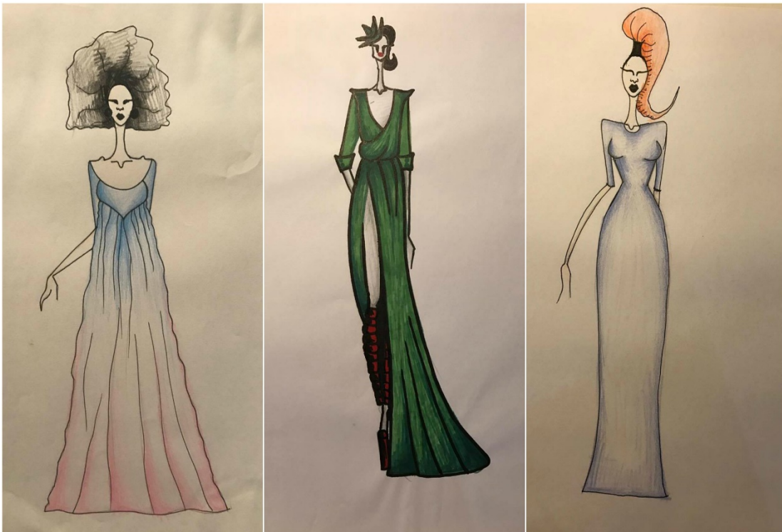
Slika: Primjer kostima za predstavu "Predstava Hamleta u selu Mrduša Donja"