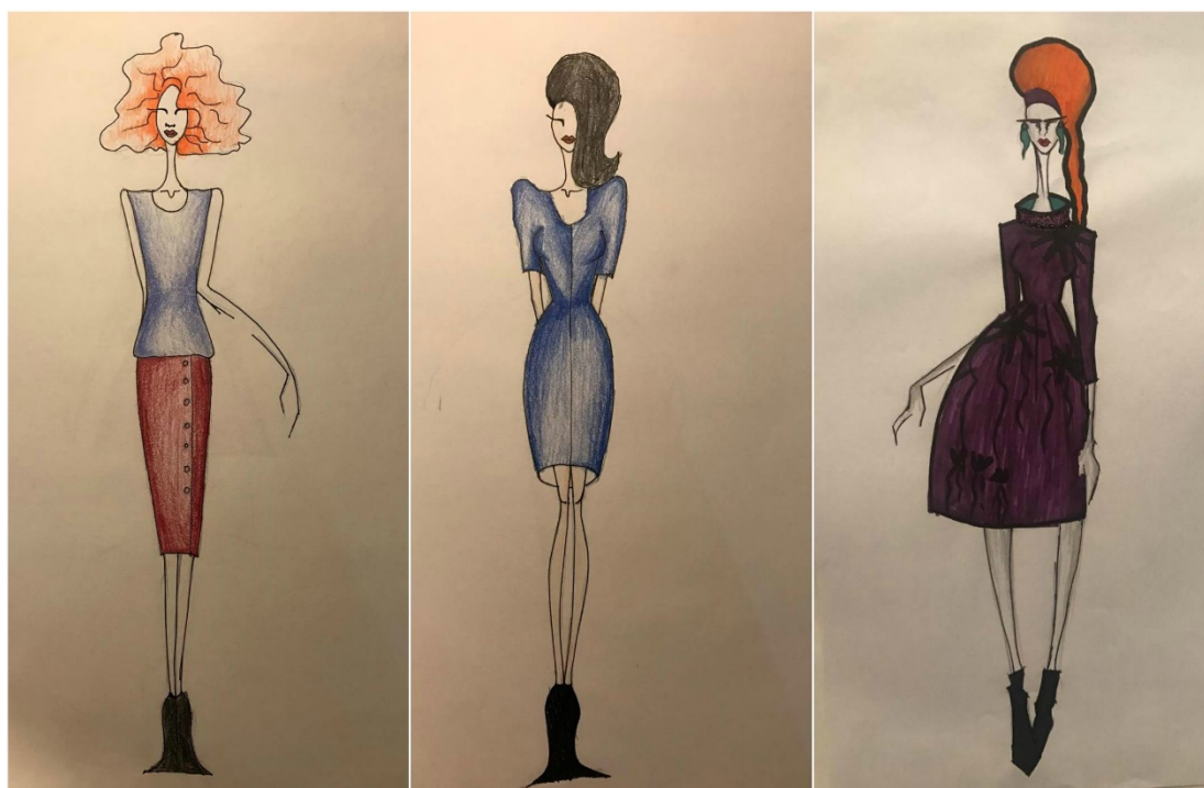
Slika: Primjer kostima za predstavu "Predstava Hamleta u selu Mrduša Donja"