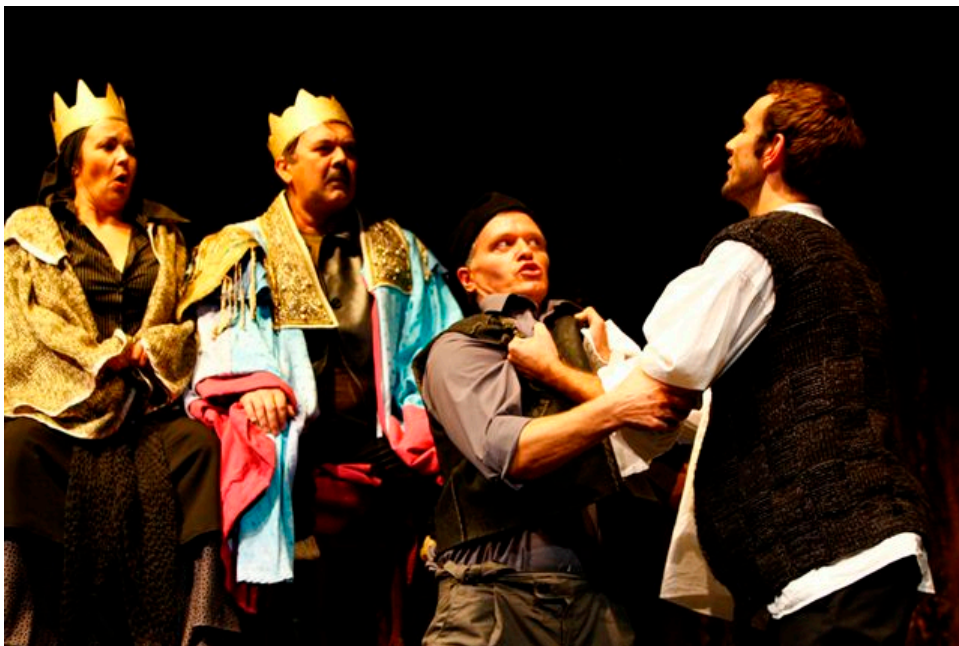
Slika 24. Prizor iz predstave, Kralj, Kraljica gledaju Jocu i Mačka kako se tuku

Nakon nekoliko godina tekst dolazi u ruke ravnatelju zagrebačkog teatra ITD Vjeranu Zuppi koji ga odlučuje uprizoriti. Redatelj Božidar Violačić postavio ga je na scenu 19. travnja 1971. (iste godine objavljen je u Kolu) u jednoj manjoj kazališnoj dvorani Teatra ITD, a ne u glavnoj. Slijedeći upute samoga autora, Violačić na pozornicu postavlja glumce i gledatelje, tako da je kazališna iluzija skoro pa nestala. Srušena je rampa. Publika postaje dijelom sastanka Mjesnog aktiva Narodnog fronta Mrduše Donje. Na taj način Brešan je još jednom aktualizirao poznatu činjenicu da su život i teatar neodvojivi, tj. da je život teatar, a ne teatar život.