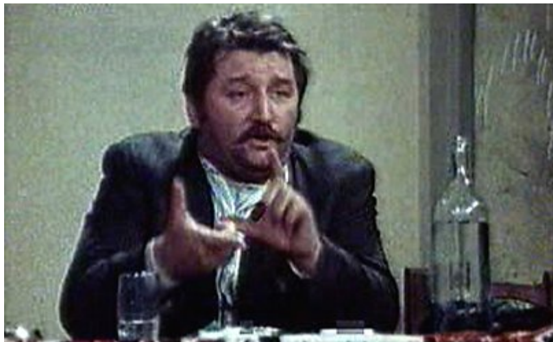
Slika 17. Prikaz Pulje

Njegov kostim sastoji se od bijele košulje s tamnim odjelom. Na nogama nosi tamne cipele.