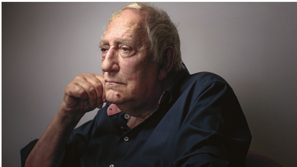
Slika 19. Ivo Brešan

i u Antologiji savremene jugoslovenske drame (O. Lakićević, Beograd 1984) te u Antologiji hrvatske drame (B. Hećimović, Zagreb 1988). Tiskan je i njemački prijevod „Nečastivoga na filozofskom fakultetu“ (Wien, München 1981). B. je autor ili suautor pet filmskih scenarija ( Predstava Hamleta u selu Mrduša Donja, Izbavitelj, Tajna Nikole Tesle, Obećana zemlja i Donator ). Piše i TV drame ( Dva sanduka dinamita, Trideset konja ) i TV serije. Za Predstavu Hamleta u selu Mrduša Donja nagrađen je 1972. „Sterijinom“ i „Gavellinom nagradom“, za „Svečanu večeru u pogrebnom poduzeću“ dobio je „Gavellinu nagradu“ 1979, a 1985. primio je „Sterijinu nagradu“ grada Vršca za komediju.