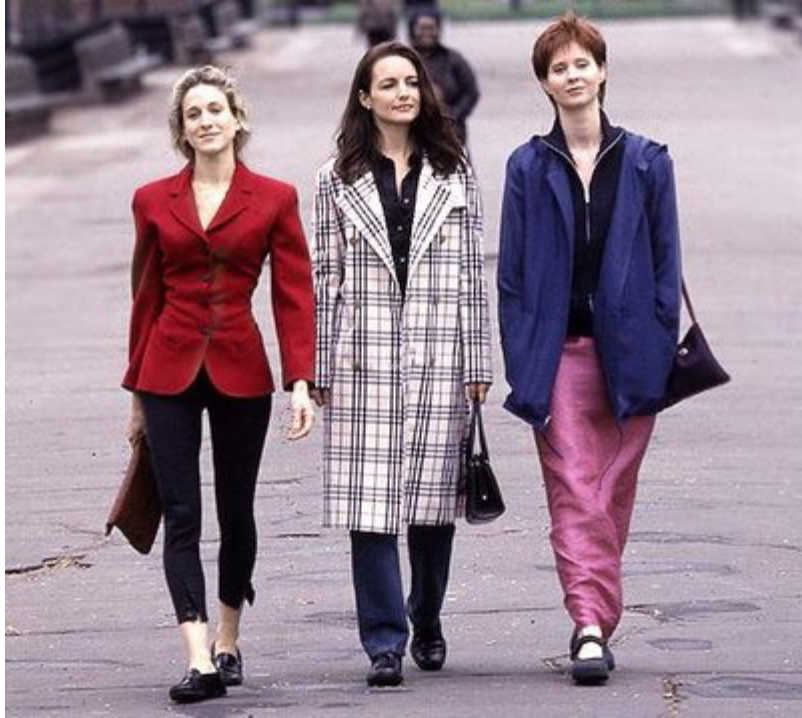
Slika 2. Odjeća iz 80-tih