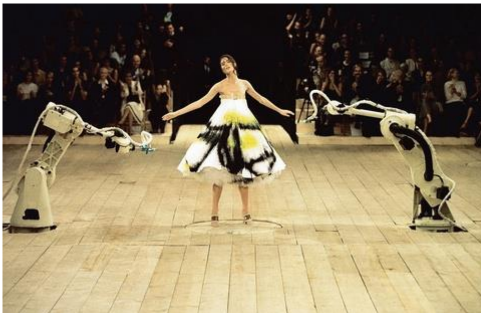
SI. 4

Suradnja ovog dizajnera s Givenchyjem trajala je do 2001. godine, neposredno prije nego što je Guccijeva modna grupacija otkupila 51 posto njegova vlastitog modnog branda Alexander McQueen. Kao razlog prekida suradnje dizajner tada ističe činjenicu da ugovori u ovoj modnoj kući ograničavaju njegovu kreativnost.