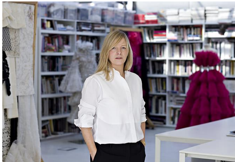
Sl. 6 Sarah Burton kreativna direktorica modne kuće Alexander McQueen, 2012.

Odmah poslije njegovog samoubojstva u veljači 2010. počelo se nagađati tko bi mogao biti dovoljno talentiran i zadovoljiti kreativne standarde koje je dizajnerski genij postavio. Također, njegove su kreacije bile jedinstvene i odraz potpuno individualnog stila pa se nije očekivalo da će za njegova nasljednika biti izabrano neko poznato ime. Nova glavna dizajnerica na čelu linije McQueen godinama je radila kao njegova asistentica, no ostajala je uvijek u njegovoj sjeni i u modnim krugovima za nju nije znao gotovo nitko osim McQueenovih najbližih prijatelja i suradnika.