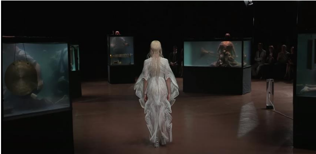
Slika 3. Fotografija iz videa: Airform performans , 2017. vlasnik/autor: I. v. Herpen, 2017.

modnog performansa spomenute tehno-znanstevne umjetnice, odnosno, konceptualne dizajnerice Iris van Herpen.