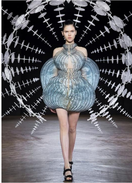
Slika 1. Službena fotografija I. v. Herpen: Hypnosis kolekcija, 2020. Autor/vlasnik: Iris van Herpen, 2020.

Ta skulptura kreira svojevrsnu optičku iluziju koja je donekle beskrajna. Dok se modeli kreću pistom, prolazeći kroz skulpturu portala ona je u neprekidnom pokretu gdje ne možemo razlučiti kreće li se prema naprijed ili natrag. Cijela se skulptura sastoji od nekoliko stotina kružnica različitih dimenzija koje su vrlo detaljno montirane i slagane. Također, ova tehnika primijenjena je na neke od odjevnih predmeta iz kolekcije, tvoreći odjevni objekt u potpuno novom, živom, autopoetičnom, pokretnom obliku (slika 2). 36