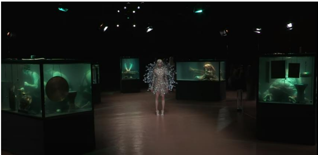
Slika 4. Fotografija iz videa: Airform performansa , 2017. vlasnik/autor: I. v. Herpen, 2017.

U srpnju 2017. godine, van Herpen predstavlja svoju kolekciju Airform na Pariškom tjednu Mode. Kolekcija je bazirana na dubokom istraživanju prirode i anatomije zraka te se iznosi ideja materijalne lakoće zraka pomoću stvaranja negativnog i pozitivnog prostora igrom sjena i svjetlosti (svjetlosna scenografija). Već sam predmet istraživanja unutar modnog stvaranja zahtjeva određene tehnike koje može ponuditi samo nova tehnologija kako bi se isti realizirao.