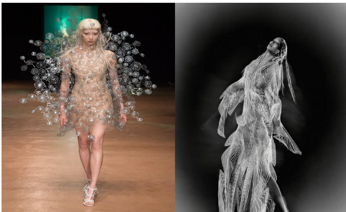
Slika 5. Službena fotografija I. v. Herpen: Airform kolekcija, 2017, vlasnik/autor: I.v. Herpen, 2017.

Airform kolekcija izrađena je od biomorfne strukture koja uključuje laganu pernatu čipku, geodetskih cvjetnih uzoraka koje plutaju oko tijela, produžujući i mijenjajući njegovu formu u suradnji sa Philip Beesleyem (umjetnik/arhitekt). Zrak i voda ovdje predstavljaju strukturne vizualne referente prema kojima je izrađena kolekcija od osamnaest konstruiranih silueta. Utjecali su na razvoj i konstrukciju odjeće što se očitava u talasnim uzorcima i prozirnosti materijala. Odjek valova na tehnološki-proizvedenim tkaninama oslikava mrežkanje povezanog pamuka nad kožom, ističući tako površinu tijela, no pritom oslikava formu njegovih posturalnih kontura. Odjevna silueta prelijeva se preko zadane forme (tijela) poput vala koji zapljuskuje tijelo ili naleta vjetra koji ga dodiruje i obuzima u cjeloj njegovoj postojanosti, ostavljajući osjećaj prisutnosti gustoćom zraka pod silom kretanja. (slika 5.).