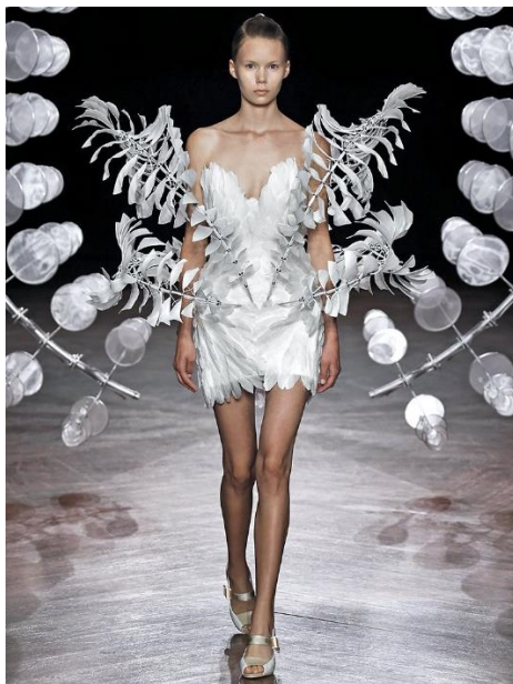
Slika 2. Službena fotografija I. v. Herpen: Hypnosis kolekcija, 2020. Autor/vlasnik: Iris van Herpen, 2020.

Ta skulptura kreira svojevrsnu optičku iluziju koja je donekle beskrajna. Dok se modeli kreću pistom, prolazeći kroz skulpturu portala ona je u neprekidnom pokretu gdje ne možemo razlučiti kreće li se prema naprijed ili natrag. Cijela se skulptura sastoji od nekoliko stotina kružnica različitih dimenzija koje su vrlo detaljno montirane i slagane. Također, ova tehnika primijenjena je na neke od odjevnih predmeta iz kolekcije, tvoreći odjevni objekt u potpuno novom, živom, autopoetičnom, pokretnom obliku (slika 2). 36