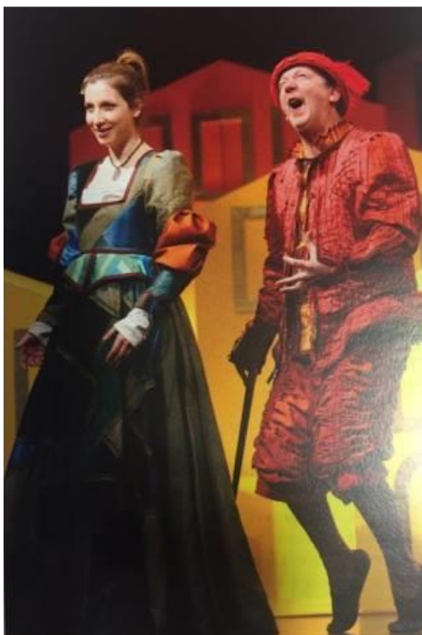
SLIKA 7: Marin Držić: Skup Hrvatsko Narodno Kazalište, Split 28.03.2008.