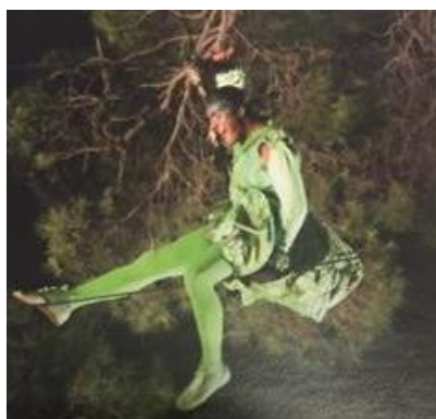
SLIKA 9: Marin Držić, Grižula, Festivalni dramski ansambl, Dubrovnik. 21.08.2003.