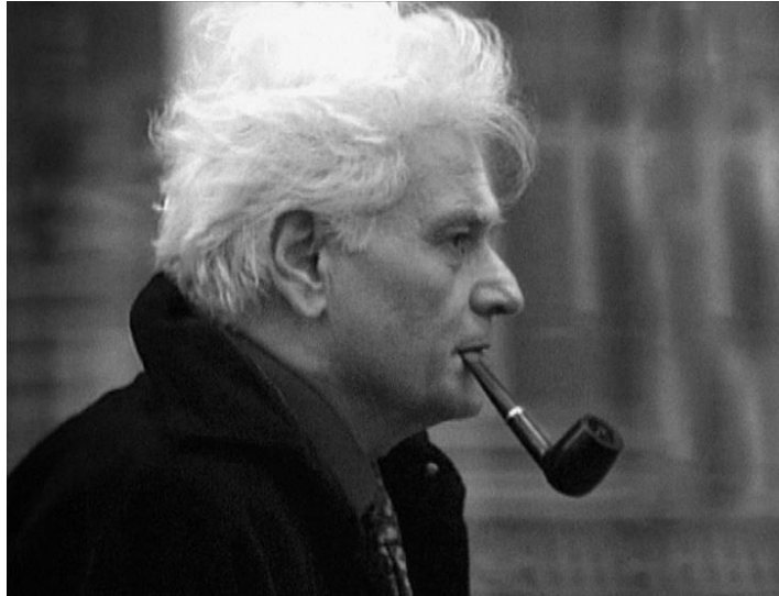
Slika 1. Jacques Derrida 3

Pojam dekonstrukcije kao filozofskog smjera nastaje 70-ih godina prošlog stoljeća djelom De la grammatologie ili „O gramatologiji“ francuskog filozofa Jacquesa Derrida (slika 1). Iako prvotno filozofski smjer dekonstrukcija se popularizira te širi na područja literature, filma, slikarstva, arhitekture, mode, te cjelokupnog područja dizajna.