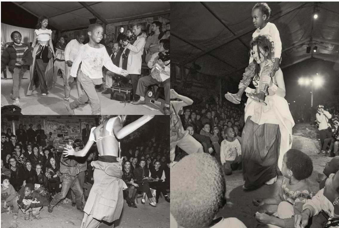
Slika 21. Maison Martin Margiela A/W1989. godine 17

Već na jesen 1989. godine Margiela sprema novu kolekciju koja će biti prikazana u dječjem vrtiću u predgrađu Pariza pretežito naseljenog sjevernoafričkom populacijom. Nije bilo ekskluzivnih prvih redova, blještave pozornice, luksuznih odjevnih predmeta, i seksualiziranih modela. Prve redove ispunjavala su lokalna djeca, modne piste nije ni bilo, odjevni predmeti bili su potpuno dekonstruirani, modeli su bile „obične“ djevojke koje su se zbog same neravne površine spoticale, a Margiela nije ni htio da hodaju „profesionalno“. Djeca nisu mogla ostati mirna i u jednom trenutku su se spontano uključila u reviju zajedno s modelima, a izrazi na njihovim licima bili su neprocjenjivi (slika 21). Modni dizajner Raf Simons koji je prisustvovao reviji izjavio je kako je kao student oduvijek smatrao modu pomalo površnom, ono što je bilo prezentirano pod modom bilo je blještavilo, luksuz i glamur, no ova revija je pojam mode u njegovim očima zauvijek promijenila. Margiela je dekonstrukcijom konstruirao novi pogled na modu, modu kao konceptualnu umjetnost, kao performans. 16