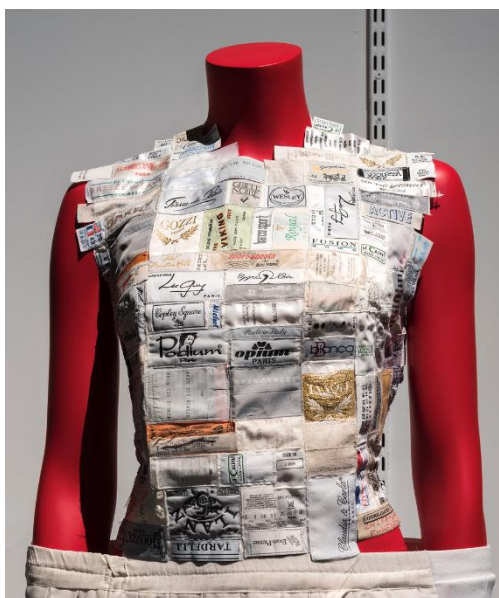
Slika 25. Maison Martin Margiela retrospektiva 1989-2009., Musée de la mode de la Ville de Paris 20

Najutjecajnija modna revija sezone jesen/zima 2018. godine u Parizu nije se odvijala ni na jednoj od raskošnih pista koje su organizirali divovski brendovi. Umjesto toga, bila je to retrospektivna izložba dvadesetogodišnjeg rada Maison Martin Margiele prikazana na lutkama, praćenih starim videozapisima, priborom, tekstovima, skicama i instalacijama, koje su pričale priču o samozatajnom dizajneru čiji je rad sve ove godine govorio umjesto njega. Priča iza stvaranja odjeće i oblikovanja tijela