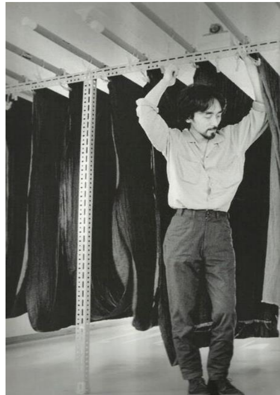
Slika 2. i 3. Rei Kawakubo, Comme des Garçons i Yohji Yamamoto u Parizu 80-ih 4

U svojoj knjizi „Japanska revolucija u pariškoj modi“ (2004.) profesorica sociologije Yunija Kawamura ističe kako je odluka Rei Kawakubo i Yohji Yamamota (slika 2 i 3) da svoje kolekcije predstave u Parizu bio način da legitimiziraju vlastiti dizajn unutar pariškog sustava mode koji bi im omogućio ulazak na međunarodnu modnu scenu. Njihov prelazak iz Tokija u Pariz došao je u pravo vrijeme, točno onda kada se međunarodni fokus počeo okretati prema Japanu.