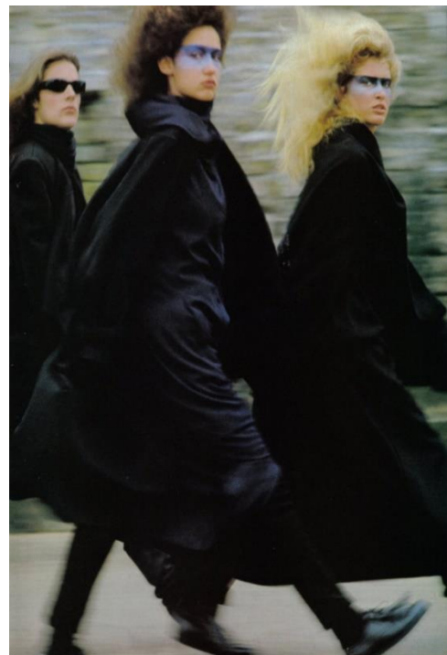
Slika 12. i 13. Rei Kawakubo i Yohji Yamamoto u US Vogue-u 1983. 10