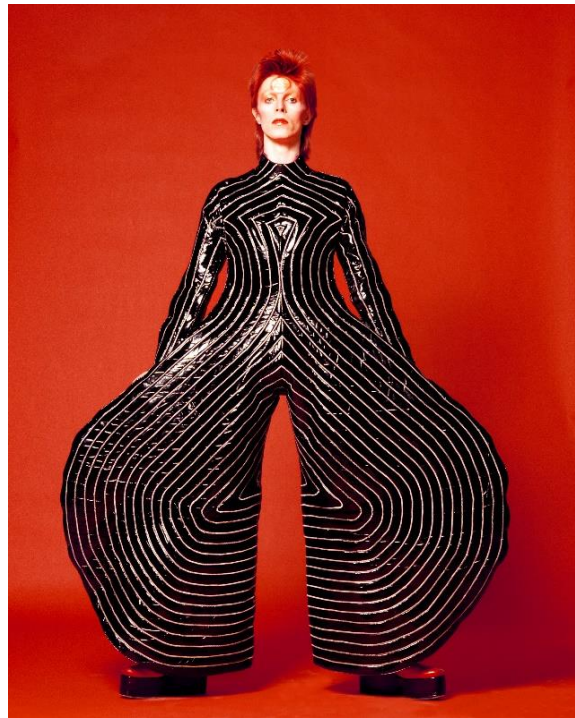
Slika 4. Hanae Mori, East meets West . 5 Slika 5. Kansai Yamamoto, Aladdin Sane turneja David Bowiea 6

Jedan od dizajnera koji je prethodio dvojcu bio je i Issey Miyake koji je također smatran revolucionarnim i inovativnim dizajnerom s futurističkim načinom razmišljanja. Njegov rad, iako ukorijenjen u tradicionalnoj japanskoj filozofiji dizajna, ipak je istraživao odnos tradicionalne japanske odjeće i zapadne mode (Kawamura 2004: 127).