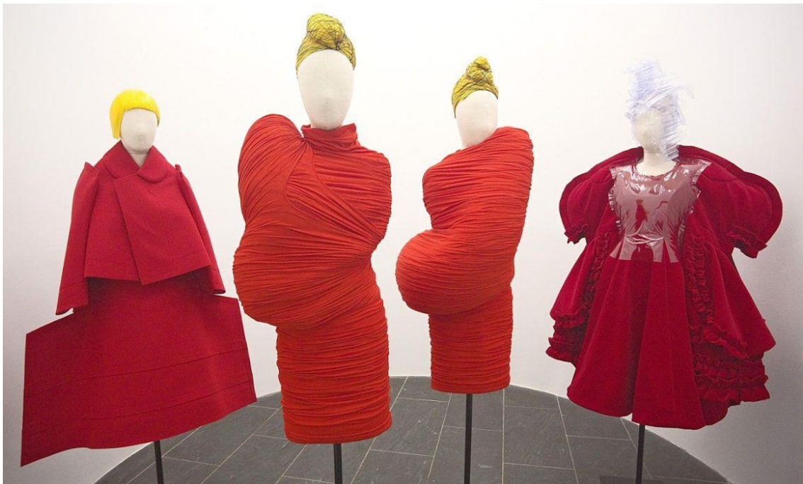
Slika 17. Rei Kawakubo, Comme des Garçons, Body Meets Dress, Dress Meets Body iz 1997. 13

Dakle, istinska rezidencija mode nalazi se u prostoru strukture identiteta tijela izvan „prirodnog“ i „kulturnog“. Moda kao „kulturna industrija“ pripada utopijskom horizontu „novog“. Modni stilovi kao što je „ New look “ i japanska dekonstrukcija u modi ranih 80-ih godina područja su povezana društvenim i kulturnim identitetima koji proizlaze iz anti-modnih i uličnih stilova obilježenih pobunom protiv osiromašenih vrijednosti naše tvrdokorne tradicije (Paić 2018: 70-72). Moda u suvremenoj kulturi tako dobiva novo značenje, tijelo se može mnogostruko pojavljivati i reprezentirati u različitim oblicima, s toga moda se u suvremenoj kulturi se ne može gledati samo kao slika nego i kao proces. Tako suvremenu modu možemo shvatiti na dva načina, jedan je kao vizualnu komunikaciju, drugi kao tijelo u procesu koji se odvija u medijski konstruiranom modnom događaju. Rei Kawakubo i Yohji Yamamoto s modnom dekonstrukcijom početka 80-ih godina obilježiti će početak drugačijeg pristupa kako odjevnom objektu tako i samom tijelu. Njezina apokaliptična moda u kojoj su prisutne rupe, grubo rezani materijali, i izobličena modna silueta podsjeća na neprestani proces tjelesnog propadanja, a odjevni objekt se zajedno s tijelom tretira kao jedna cjelina. Dakle upravo u japanskoj dekonstrukciji u modi možemo shvatiti modu kao proces koji se neprestano obnavlja i koji je direktno vezan uz tjelesne promjene (Krpan 2018: 156).