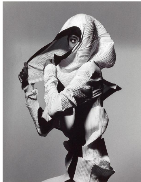
Slika 8. i 9. Issey Miyake, The Loss of Small Detail 8