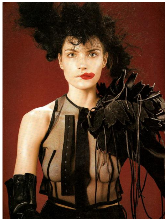
Slika 15. i 16. Rei Kawakubo, Comme des Garçons 80-ih i 2004. 12