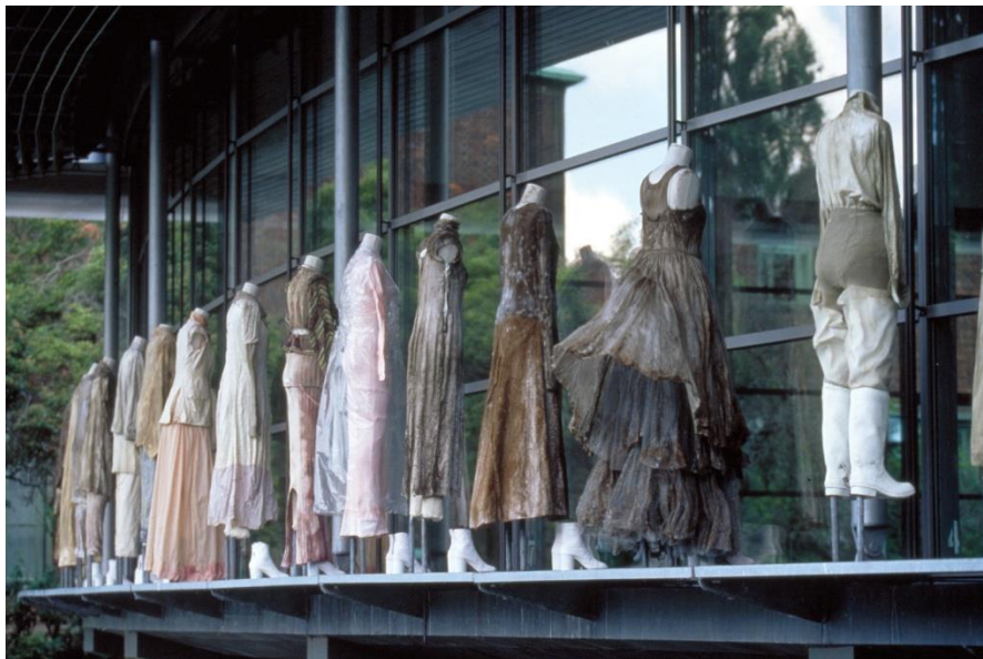
Slika 24. Maison Martin Margiela , 9/4/1612 iz 1997. godine u Rotterdamu 19

Također, njegova izložba 9/4/1612 iz 1997. godine u Rotterdamu (slika 24) u kojoj Margiela eksperimentira sa odjevnim predmetima koji predstavljaju objekte eksperimenta stavljajući na njih umjetno proizvedene bakterije koje ih postepeno proždiru. Margiela na taj način istražuje ciklus propadanja i konzumacije periodične kupovine, te njezino odbacivanje, a testira i samo značenje vremena i prolaznosti u svijetu mode (Loschek, 2009: 190). Tijelo zajedno s odjećom predstavlja prolaznu i propadajuću formu. Nešto što 70-ih godina nagovještava francuski filozof i teoretičar kulture Jean Baudrillard. Tijelo koje nastaje kao rezultat utjecaja novih tehnologija i kreativnosti nakon kojih postaje metamorfno krećući se tankom linijom između života i smrti. Dakle, iz vizualne kulture tijelo prelazi u virtualnu kulturu gdje ono više nema mogućnosti stvarne materijalizacije (Krpan 2018: 149).