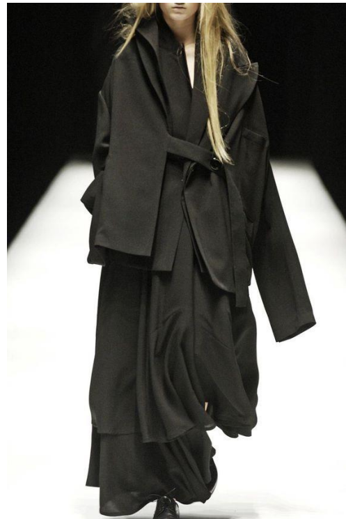
Slika 10. i 11. Yohji Yamamoto, dekonstrukcija u modi 9

Kada je američki Vogue , u travnju 1983. napisao članak o dvojcu, priznajući njihov utjecaj kao avangardnih dizajnera, bio je trenutak u vremenu kada su Rei Kawakubo i Yohji Yamamoto stekli ugled i osigurali uspjeh (slika 12 i 13). Japanska dekonstrukcija u modi tako se opisuje kao novi koncept pristupa modi i tijelu. Povijesno gledano,