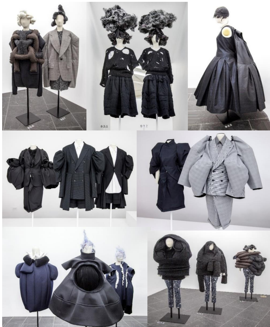
Slika 14. Rei Kawakubo, Comme des Garçons, Art of the In-Between 11

Kawakubo kao Miyake i Yamamoto dijeli iste kvalitete slobode i bezvremenosti vlastitih kreacija. U retrospektivnoj zbirci dekonstruktivističkih radova Rei Kawakubo Art of the In-Between (slika 14) predstavljenoj na izložbi u Metropolitan Museum of Art u New Yorku sagledavamo zbirku radova u kojoj se od početka 80-ih bez suzdržavanja preispituju svojevrsne estetske vizualne nesigurnosti i dvosmislenosti na principu binarnih opozicija dekonstrukcije Jacquesa Derridaea koji se provlače i kroz same naslove radova, a neki termini koji se dovode u pitanje su: prisutnost – odsutnost, moda – antimoda, jednostruko – višestruko, visoko – nisko, onda – sada, objekt – subjekt, predmetnost – bespredmetnost. Zbirka otkriva kako njezini dizajni zauzimaju prostore između tih razlika koji se predstavljaju kao prirodni, a ne društveni ili kulturni, te način kako rješavaju i razbijaju binarnu logiku, prkoseći tako bilo kakvoj klasifikaciji sebe njezina odjeća otkriva umjetnost, proizvoljnost i „prazninu“ konvencionalnih dihotomija.