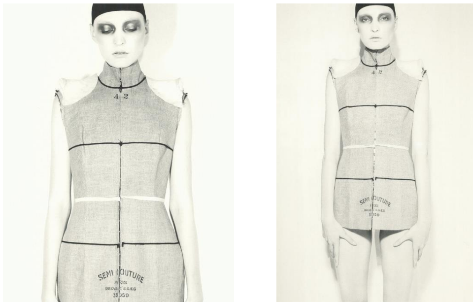
Slika 22. i 23. Maison Martin Margiela, Doll's Wardrobe 18