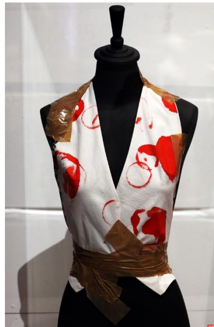
Slika 19. i 20. Maison Martin Margiela S/S 1989 i A/W 1989 15