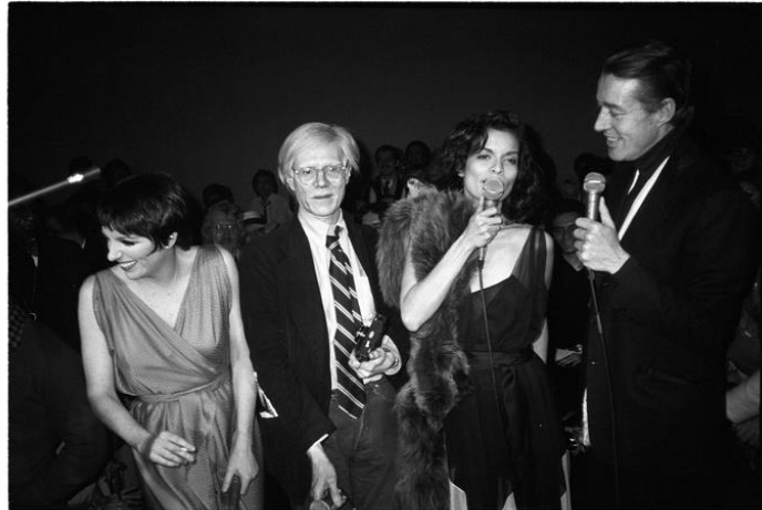
Sl.2. Liza Minnelli, Andy Warhol, Bianca Jagger i Halston, Studio 54, 1978.

donosila na temelju odjevne kombinacije te fizičkog izgleda osobe. Neke od poznatih osoba koje su zalazile u taj klub su: Andy Warhol, Grace Jones, David Bowie, Divine i Klaus Naomi.