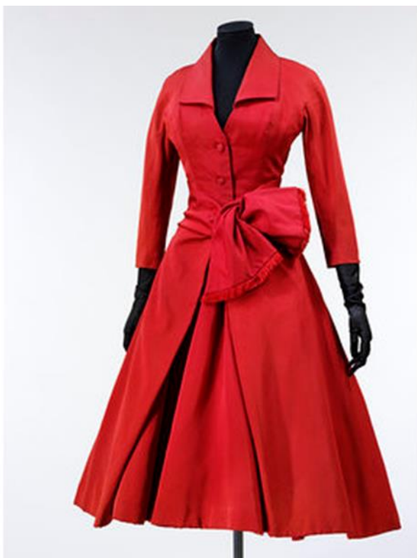
Slika 20: . Haljina Ecarlate, Christian Dior, 1955., pohranjena u muzeju Viktorije i Alberta, http://collections.vam.ac.uk/item/O139936/ecarlate-scarlet-cocktail-dress-dior-christian/ (10.11.2018.)