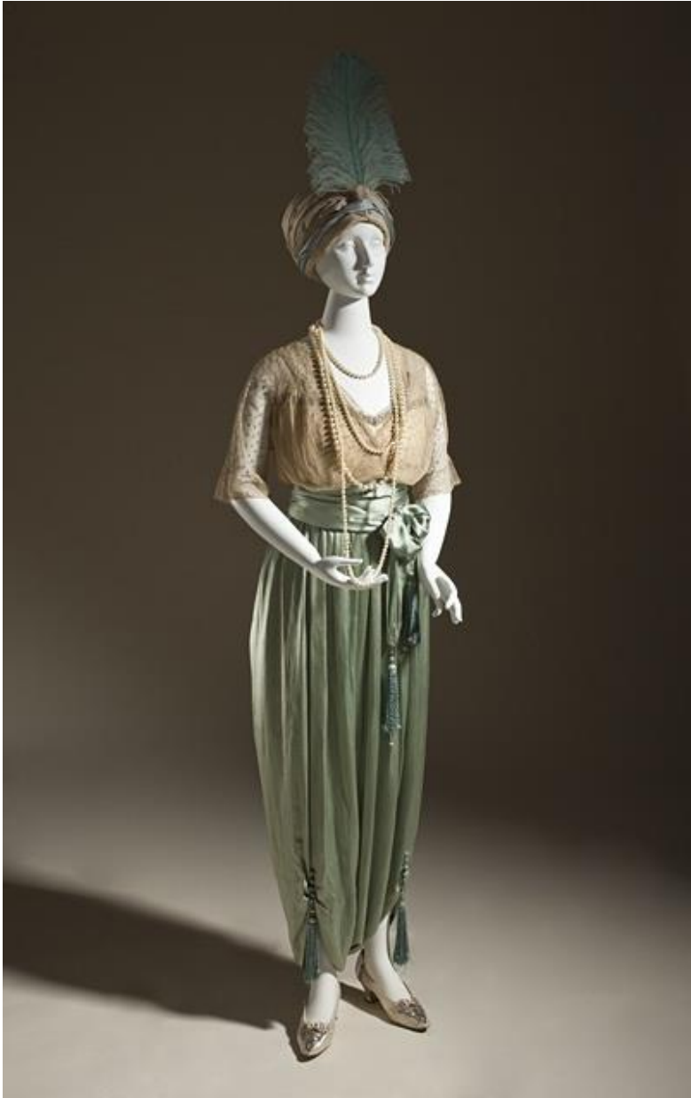
Slika 6: Kostim, Paul Poiret, 1911., pohranjeno u Metropolitan muzeju, https://myfashionillustrations.wordpress.com/2015/04/25/paul-poiret-a-fashion-designer-you-should-know/ (10.11.2018.)