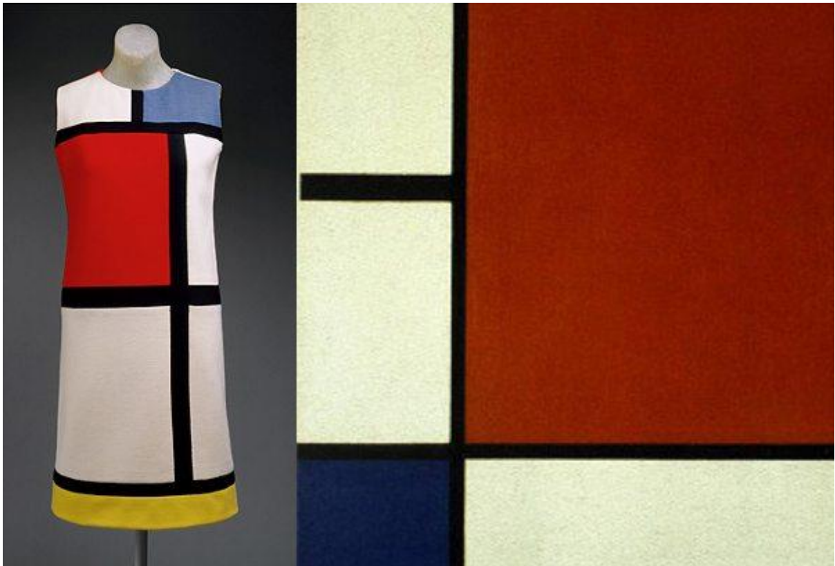
Slika 1: Haljina inspirirana Mondrianovim dijelom, http://www.ziher.hr/pogledajte-kako-moderna-umjetnost-inspirira-modu/ (10.11.2018.)

Haljine čiji je stilski uzor nizozemski stil nisu novost u svijetu mode. Piet Mondrian, nizozemski slikar i najpoznatiji pripadnik pokreta De Stijl , čiji naziv označava nizozemsku riječ za stil, autor je čije kompozicije često vidamo na modnim pistama. Jednostavnost na prvom mjestu – svođenje na osnovne boje i forme, te horizontalne i vertikalne linije koje se nikad ne preklapaju glavna su obilježja pokreta koji se ponekad naziva i neoplasticizam. De Stijl teži utopijskoj ideji reda i harmonije. 7