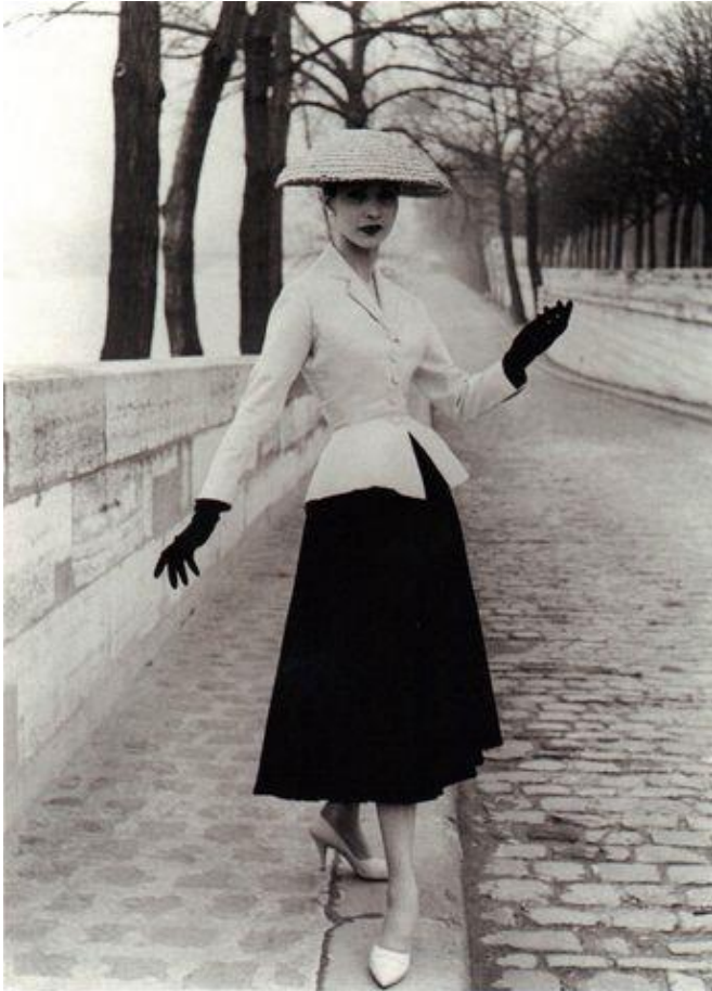
Slika 16: Bar odijelo, Christian Dior, 1947., pohranjeno u muzeju Viktorije i Alberta, http://fashionhistory.wikia.com/wiki/File:New-look-collection-bar-suit-by-christian-dior-in-paris-1947-spring-summer.jpg , (10.11.2018.)