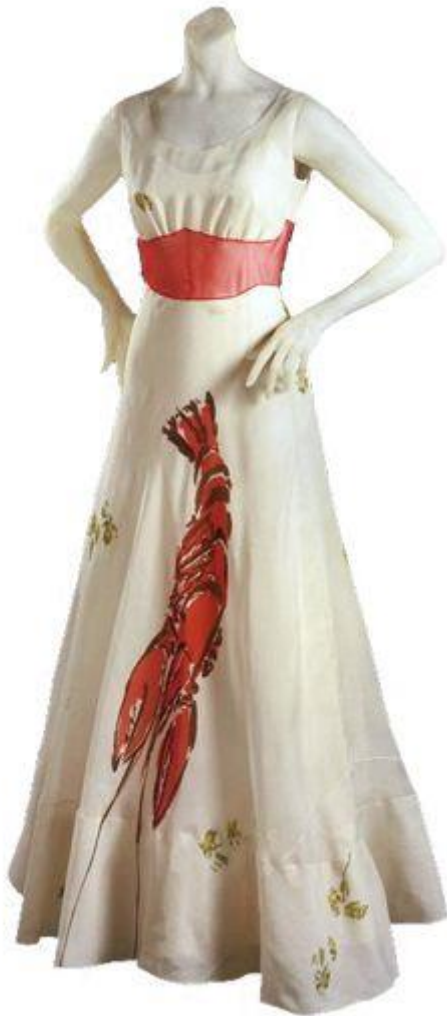
Slika 7: Jastog haljina, 02.1937., pohranjena je u muzeju za umjetnost u Philadelphiji, Elsa Schiaparelli http://emad.pgsri.hr/rad/suradnja-dalija-i-else-schiaparelli/ (10.11.2018.)

Jastog haljina ( Lobster Dress ) je jednostavna, bijela, večernja haljina sa motivom jastoga. Dalijevo motiva koji je imao običaj ubacivati u svoja djela, proizvode. Njegovu sliku za Schiaparelli Satche, vodeći dizajner preslikao je na svilu. 15