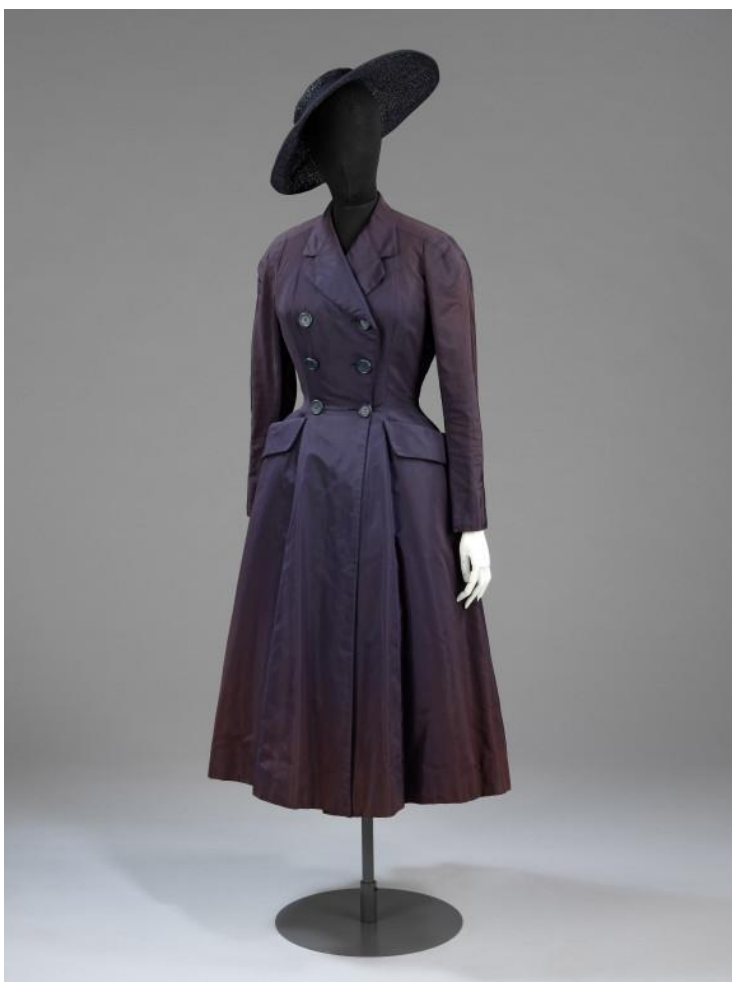
Slika 18: New Look kaput, Christian Dior, 1947-48., pohranjeno u muzeju Viktorije i Alberta, http://collections.vam.ac.uk/item/O139972/new-look-coat-dior-christian/ , (10.11.2018.)

Količina tkanine koja je potrebna za izradu New Look odjevnog predmeta je uglavnom 15 metara za vunenu dnevnu haljinu, 25 metara za kratku haljinu od tafta. Kolekcija je u tajnosti predstavljena princezi Margaret u francuskom veleposlanstvu u Londonu. Unatoč pokušajima odbora za trgovinu da ga potisnu, New Look je bio nezaustavljiv.