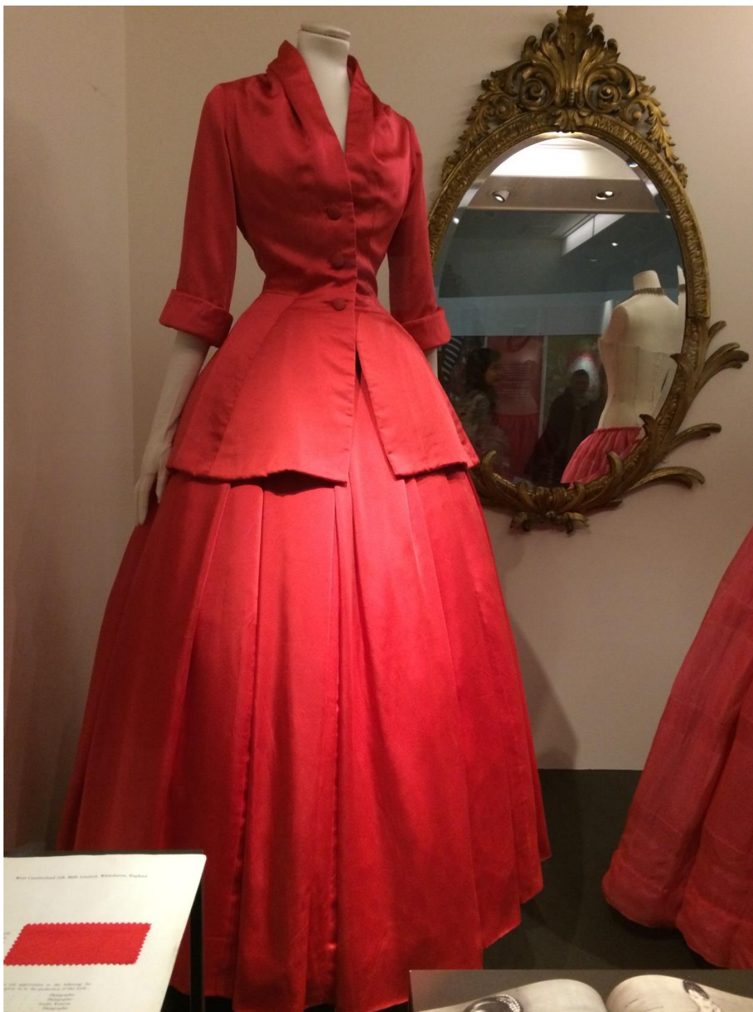
Slika 19:Haljina Zemire, Christian Dior, 1954-55., pohranjena u muzeju Viktorije i Alberta, https://assignmentforjs.wordpress.com/2015/05/07/christian-dior-zemire/ (10.11.2018.)