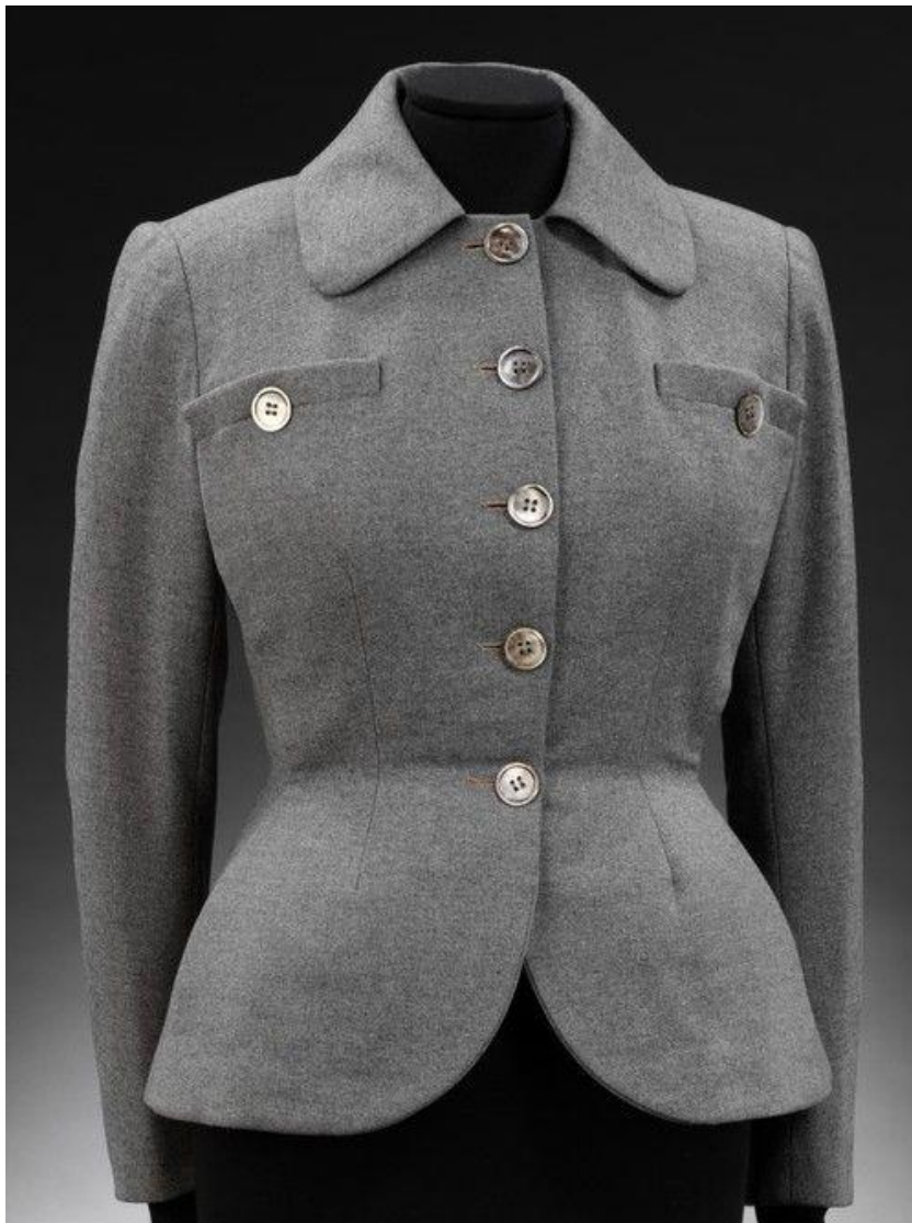
Slika 17: New Look jakna, Christian Dior, 1947-48., pohranjena u muzeju Viktorije i Alberta, https://www.pinterest.com/pin/264516178085611218/ , (10.11.2018.)

Siva jakna od vunenog flanela, strukirana, s jednostrukim kopčanjem i detaljem dvostrukih džepova. Na prednjoj strani jakne preobražavaju se u džepove na prsima. Također ima zaobljeni ovratnik i zaobljeni peplum.