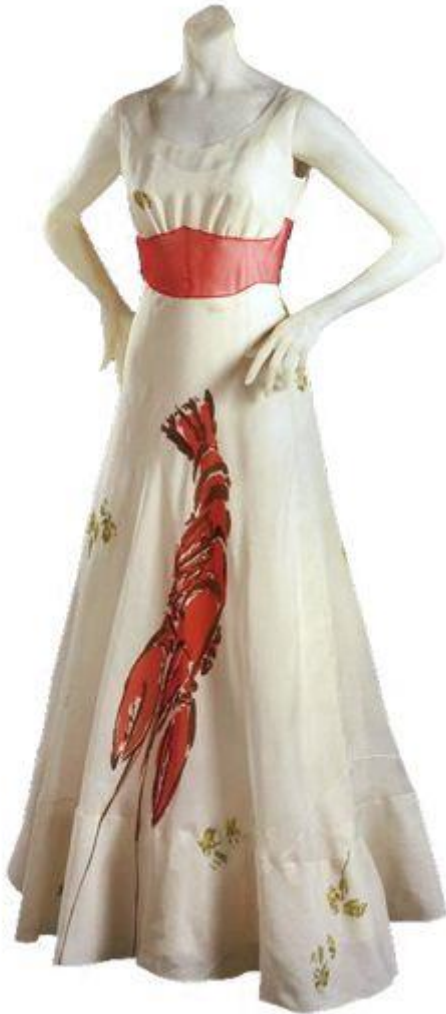
Slika 7: Jastog haljina, 02.1937., pohranjena je u muzeju za umjetnost u Philadelphiji, Elsa Schiaparelli http://emad.pgsri.hr/rad/suradnja-dalija-i-else-schiaparelli/ (10.11.2018.)

Jastog haljina ( Lobster Dress ) je jednostavna, bijela, večernja haljina sa motivom jastoga. Dalijevo motiva koji je imao običaj ubacivati u svoja djela, proizvode. Njegovu sliku za Schiaparelli Satchel, vodeći dizajner preslikao je na svilu. 15