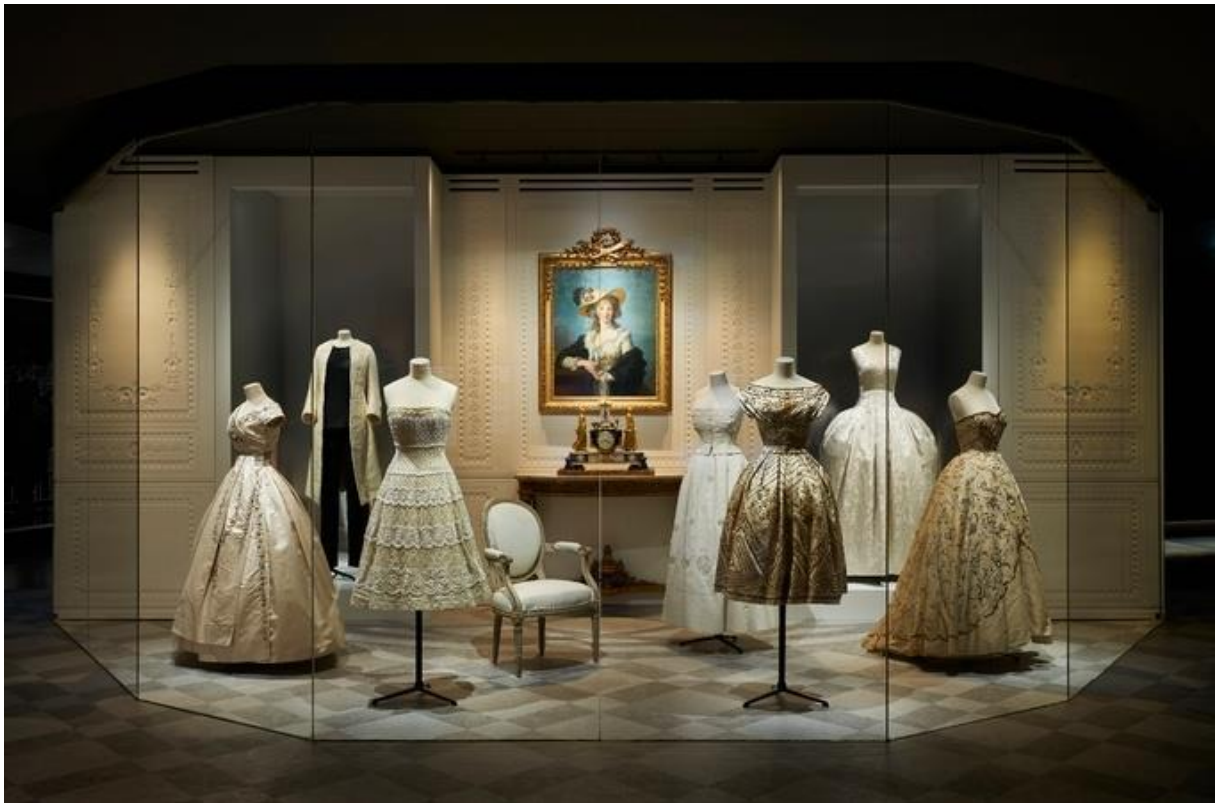
Slika 15:Kreacije Christiana Diora izložene u ambijentu kojim su inspirirane, https://www.gloria.hr/moda/inspiracija/kreator-iz-kuce-snova-christian-dior/6572127/ (10.11.2018.)