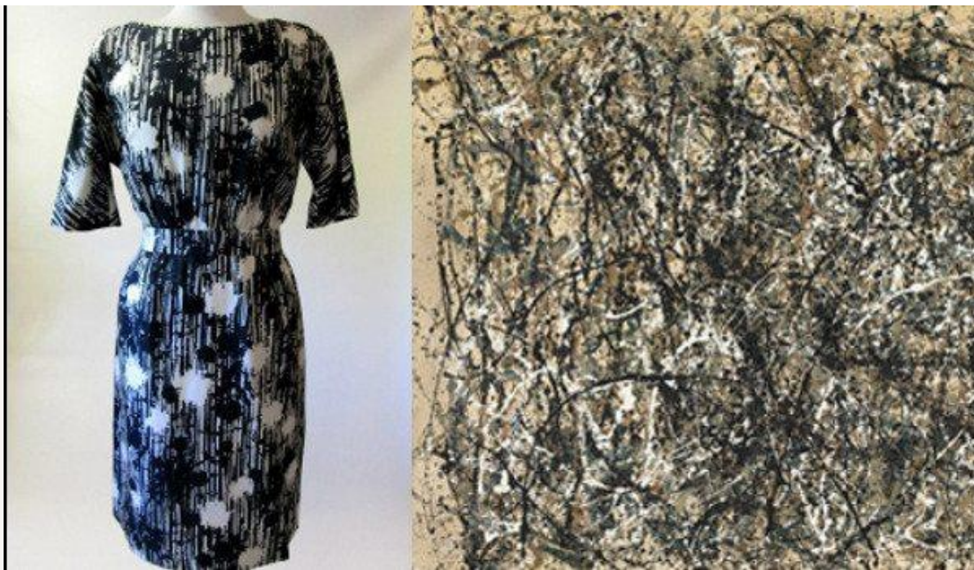
Slika 3:Haljina inspirirana Pollockovim dijelom http://www.ziher.hr/pogledajte-kako-moderna-umjetnost-inspirira-modu/ (10.11.2018.)

Američki slikar Jackson Pollock svojim je apstraktnim ekspresionizmom izvršio važan utjecaj na slikarstvo 20. stoljeća. Za vrijeme slikarske karijere, koju je rano skončao u automobilskoj nesreći uzrokovanoj alkoholom, Pollock je postepeno prelazio na sve apstraktniji i apstraktniji izraz. Potpuno apstraktni prikaz i doživljaj svijeta u kapljicama boje razlivene i poprskane kistom na platnu zanimljiv je i modnim kreatorima. Osim na slikarskom platnu, Pollockova tehnika je dobro primjenjiva i na modnom tekstilu. 9