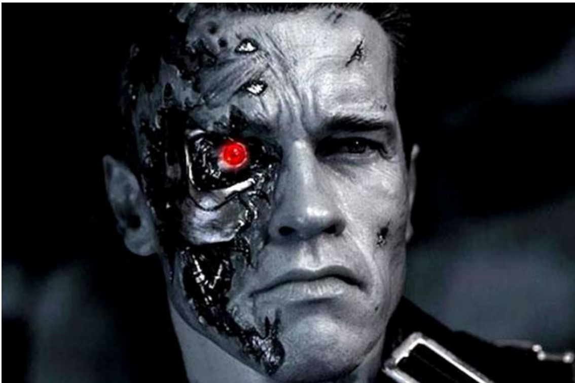
Slika 3: Terminator Genisys , Alan Taylor, 2015.

Gledajući Matrix uočavamo poprilično slično ponašanje likova u “pravom” i virtualnom svijetu. Osim što su virtualno poboljšana raznim vještinama i sposobnostima, manire ponašanja i estetski izgled ostaju u skladu s tradicionalnim okvirima. Oni također imaju osjećaje i uobičajene međuljudske odnose; iako mogu živjeti u virtualnom svijetu, bore se za život u prostoru njihovih izvornih tijela, a virtualnost služi samo kao alat poboljšanja i ostvarenja želja, no bez napuštanja prijašnje slike o sebi. Pravo postojanje ostvaruje se nužno u odnosu s matičnim tijelom koje se po volji prikopčava na mrežu. Tijela ubačena u sustav bez njihove volje i znanja ugrožena su.