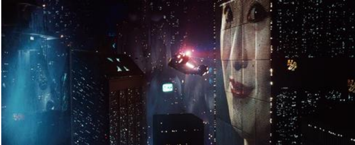
Slika 5: Blade Runner , Ridley Scott, 1982.

„Filmska nas aparatura nadasve uvodi u jedinu zbilju koju je mehaničko viđenje ogolilo i kirurški izrezalo, razorio 'dinamit u desetinkama sekunde', koja je montirana i remontirana prema novim asocijacijama. Ta nova 'optika' omogućava dijalektički obrat otuđenja. Benjaminova je ideja da nam film otkriva 'tisuće određenja o kojima ovisi