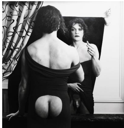
Slika 4: Joel Peter Witkin, Man reflected

Kako god bilo, Bree je i dalje otac svome sinu, bez mogućnosti bijega iz bezizlaznog položaja. Promjenom spola zatvorila je krug podvojene zbilje u kojoj ne može promijeniti da je svome sinu dala muški kromosom, potom postavši žena. Od te biološke determinacije ne može se odijeliti, njena majka rodila je sina tek potom dobivši kćer. Njeno tijelo kao da je ponovno rođeno, no njen je život odavno u trajanju. Svoj identitet ostvarila je principom falsifikacije, tj. opovrgavanjem vlastita tijela ističući bit svoga postojanja. Nemoguće je isključiti njen unutarnji realitet koji ona shvaća intuitivno, a ne samo analizom. 75