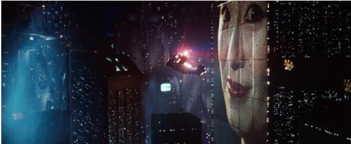
Slika 5: Blade Runner , Ridley Scott, 1982.

„Filmska nas aparatura nadasve uvodi u jedinu zbilju koju je mehaničko viđenje ogolilo i kirurški izrezalo, razorio 'dinamit u desetinkama sekunde', koja je montirana i remontirana prema novim asocijacijama. Ta nova 'optika' omogućava dijalektički obrat otuđenja. Benjaminova je ideja da nam film otkriva 'tisuće određenja o kojima ovisi