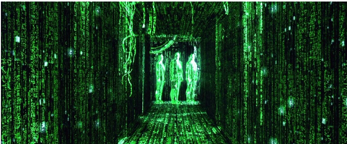
Slika 2: Matrix , Lana i Andy Wachowski, SAD, 1999. [2]

Uništenje se dogodilo u ratu sa "svjesnim strojevima" koji njihova tijela koriste kao energiju. Neo (Thomas) uči kako u Matrici može nadići svoja fizička ograničenja i da se događa ono u što on vjeruje. Pojam viđenja, doživljaja, percipiranja i prihvatanja okoline ključni su za napredak. Ali ipak, upozoravaju ga, ako umre u Matrici umire i u stvarnosti. Koliko je moguća iluzija sustava koji se direktno reflektira na "stvarnu" tjelesnost, odnosno život?