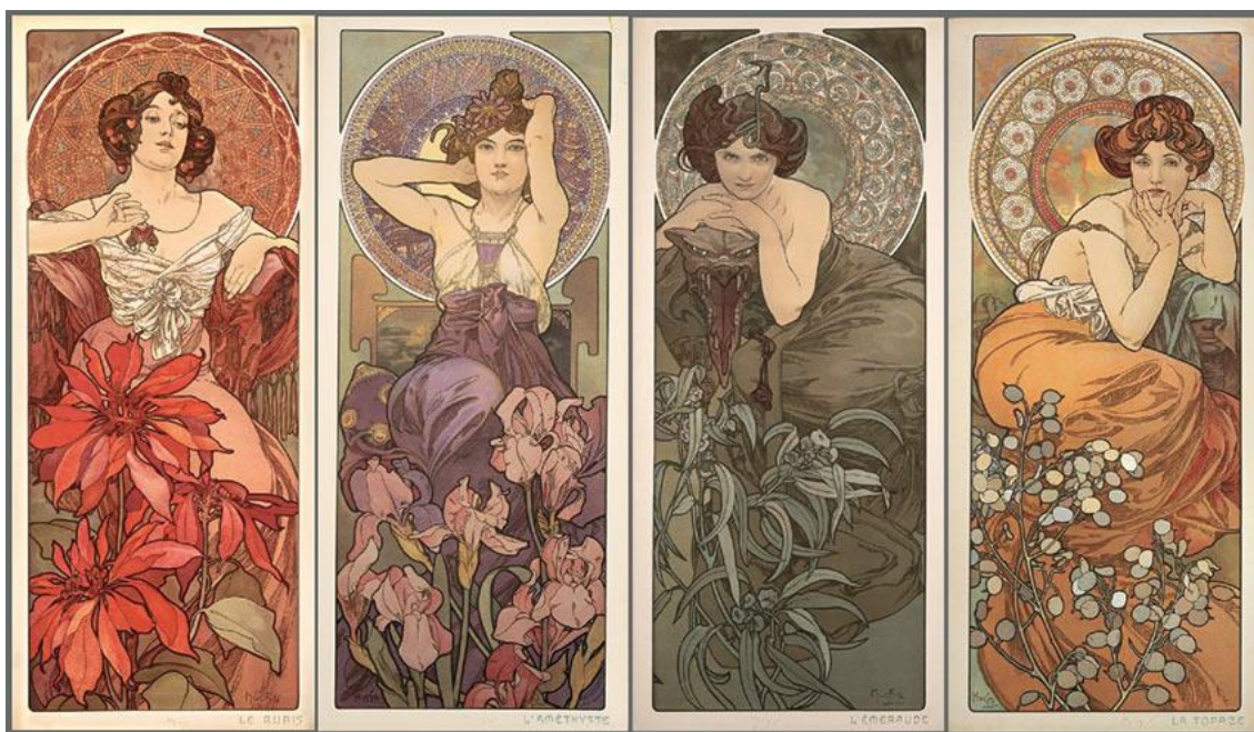
Slika 1. Alphonse Mucha: "The Precious Stone series", 1900.

Portret Art nouveau stila karakterizira bogatstvo iskaza i pristupa, svojevrsno odvajanje od klasičnog pristupa i značajn odmak prema suvremenom, kroz prikaz koji se ne ograničava isključivo na postizanje sličnosti i prikaz osobnosti, već često postavlja i šira pitanja o identitetu osobe, njenom karakteru, njenoj "energiji", uz jako naglašen estetski moment.