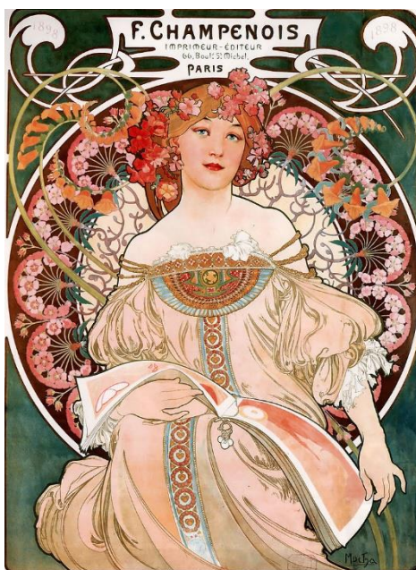
Slika 4. Alfons Mucha: F. Champenois Imprimeur-Éditeur, 1897.

Stručnjaci Art Nouveau tako su nastojali oživjeti kvalitetno majstorstvo, podići mu i proizvesti istinski moderan dizajn koji odražava korisnost predmeta koje stvaraju. Art Nouveau umjetnici pomogli su u sužavanju jaza između finih i primijenjenih umjetnosti.