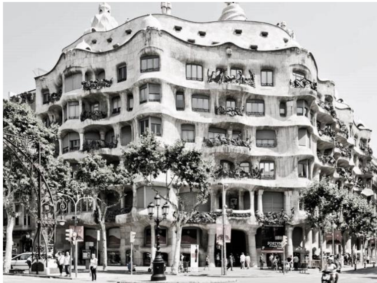
Slika 8. Antonio Gaudi, Casa Mila, 1852.-1926., Španjolska

Najznačajniji primjer stila Art Nouveau u arhitekturi je građevina Casa Mila, Antonija Gaudija, koju, osim navedenog stila, karakterizira i organičko oblikovanje. Kuća se nalazi u Barceloni gdje je nastala u razdoblju od 1852. do 1926. godine. To je zdanje koje je u širokom luku izbjeglo ravne linije, ikakvu simetriju i oštru geometrizaciju, kako bi se stvorio dojam slobodnog oblikovanja krivulja na klesanom kamenu. Vlada nepravilni konkavno-konveksni ritam koji se, osim u interijeru, odlikuje i na fasadi kuće mekanim oblikovanjem te volumenom skulpturalnog karaktera.