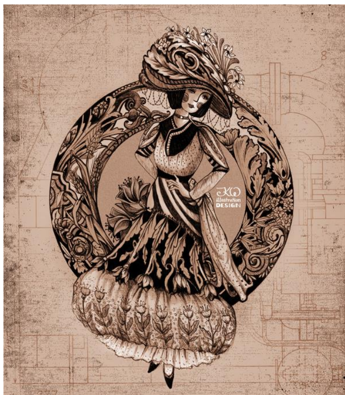
Slika 11. Modna ilustracija u stilu Art Nouveau (n. a.)

Vjerojatno najbolji primjer povezanosti mode i umjetnosti je modna ilustracija, kao vrsta umjetničke forme, odnosno izraza, koja prikazuje idejno rješenje, skicu, modnog dizajnera. Kao takva, modna ilustracija mijenjala se sukladno vremenskom kontekstu kojem je pripadala pa je tako i Art Nouveau utjecao na način prikazivanja i kreiranja modne ilustracije.