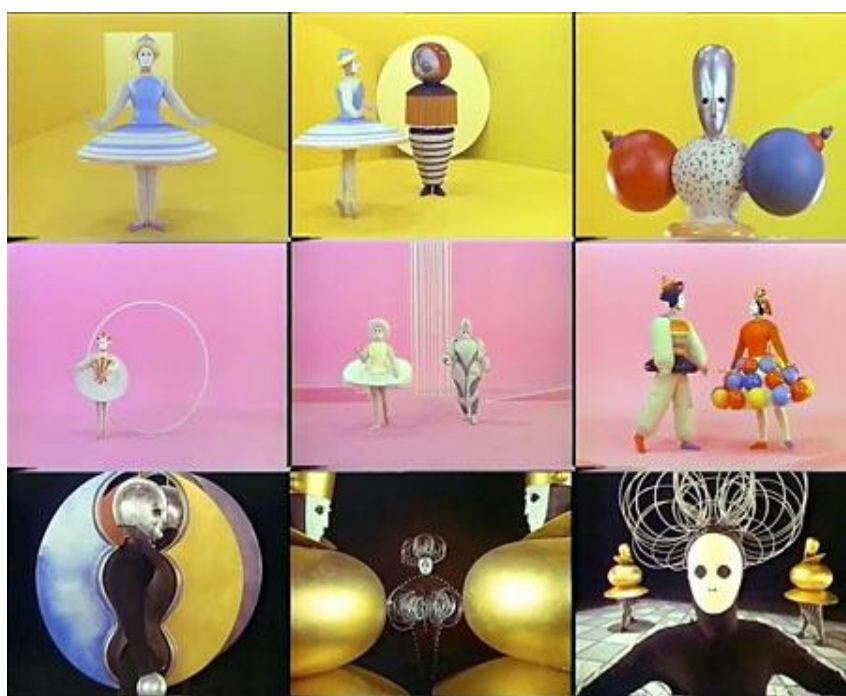
Slika 5.: Video isječci sva tri čina Das triadische Balletta, Oskar Schlemmer, 1921. – 1929.

http://monsieurcocosse.blogspot.com/2013/07/triadisches-ballett.html