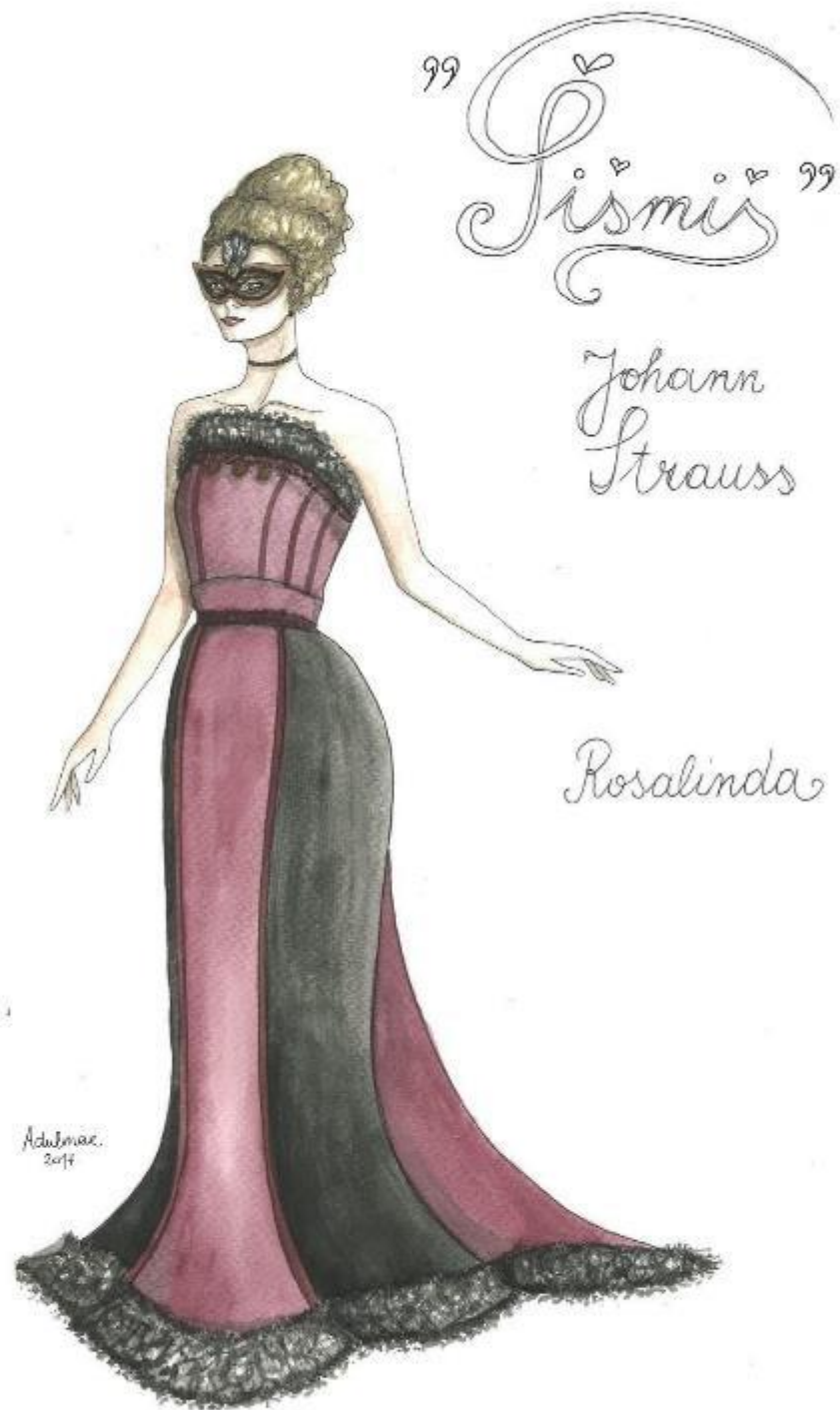
1. Johann Strauss: Šišmiš