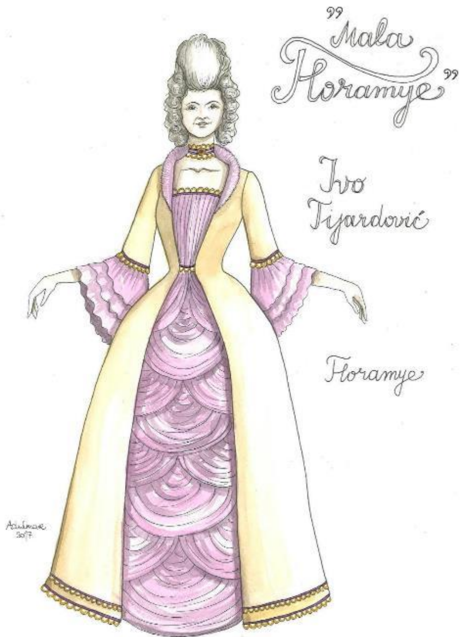
9. Ivo Tijardović: Mala Floramye