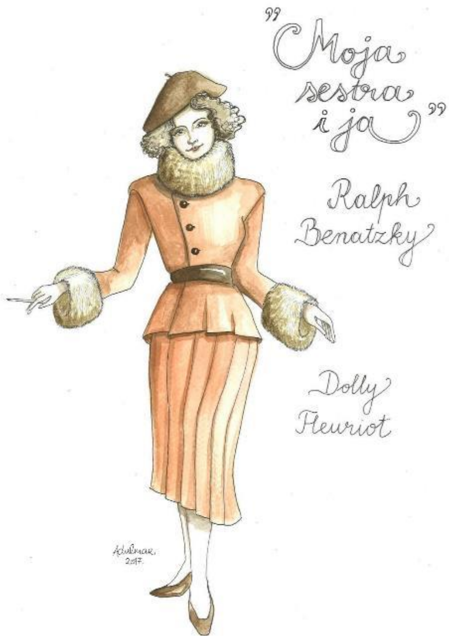
8. Ralph Benatzky: Moja sestra i ja