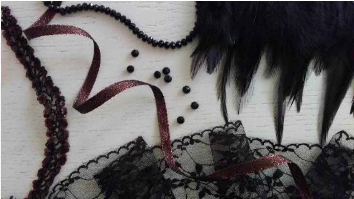
Sl.4. Odabir ukrasa