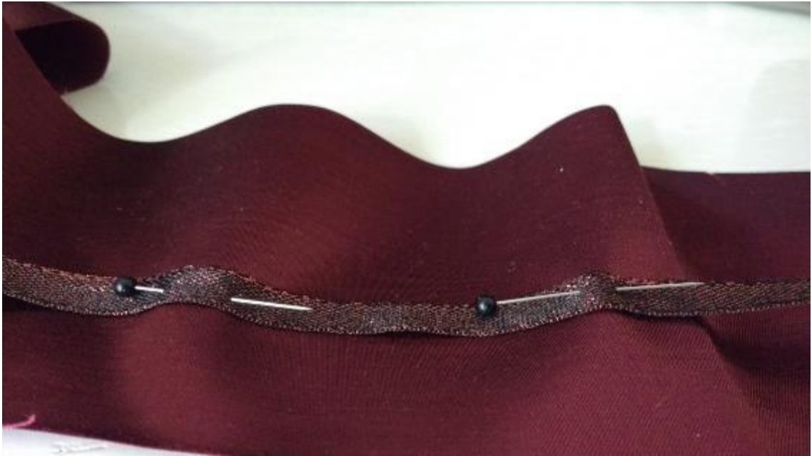
Sl.5. Aplikacija ukrasa