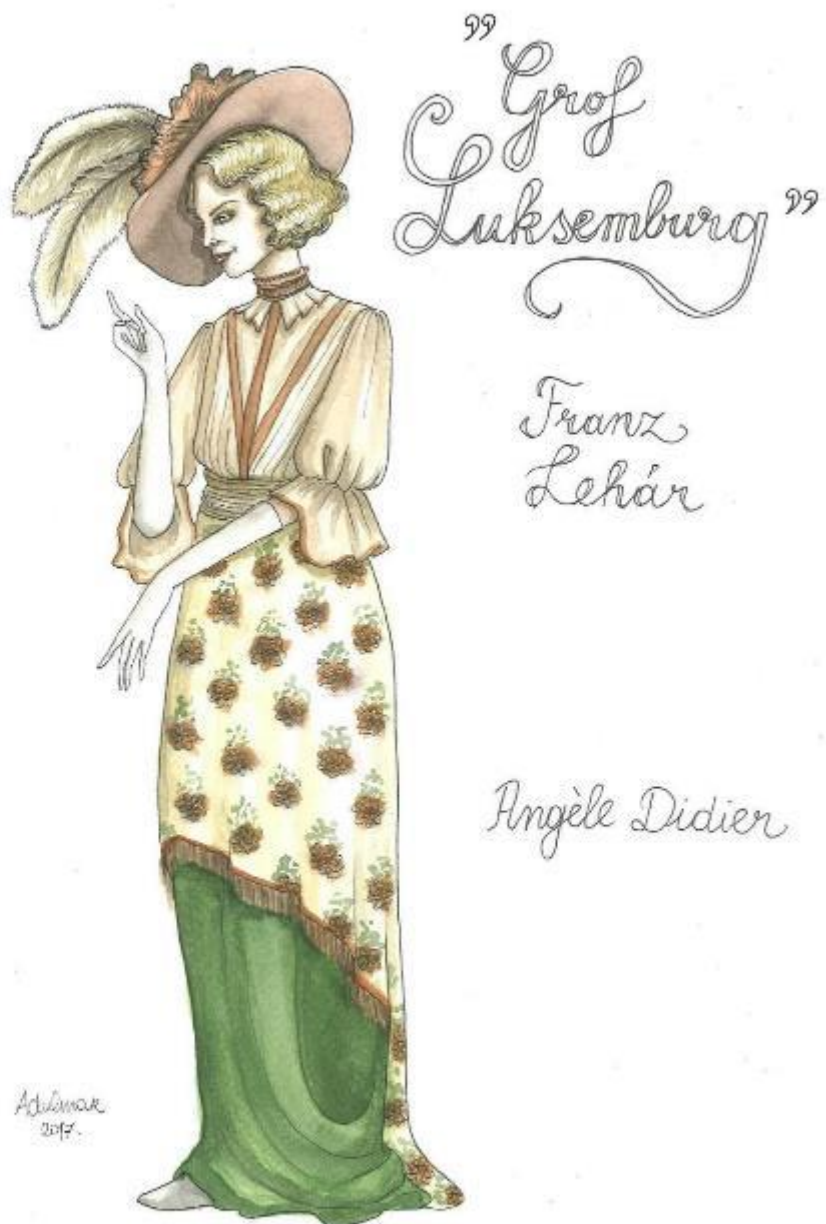
3. Franz Lehár: Grof Luksemburg