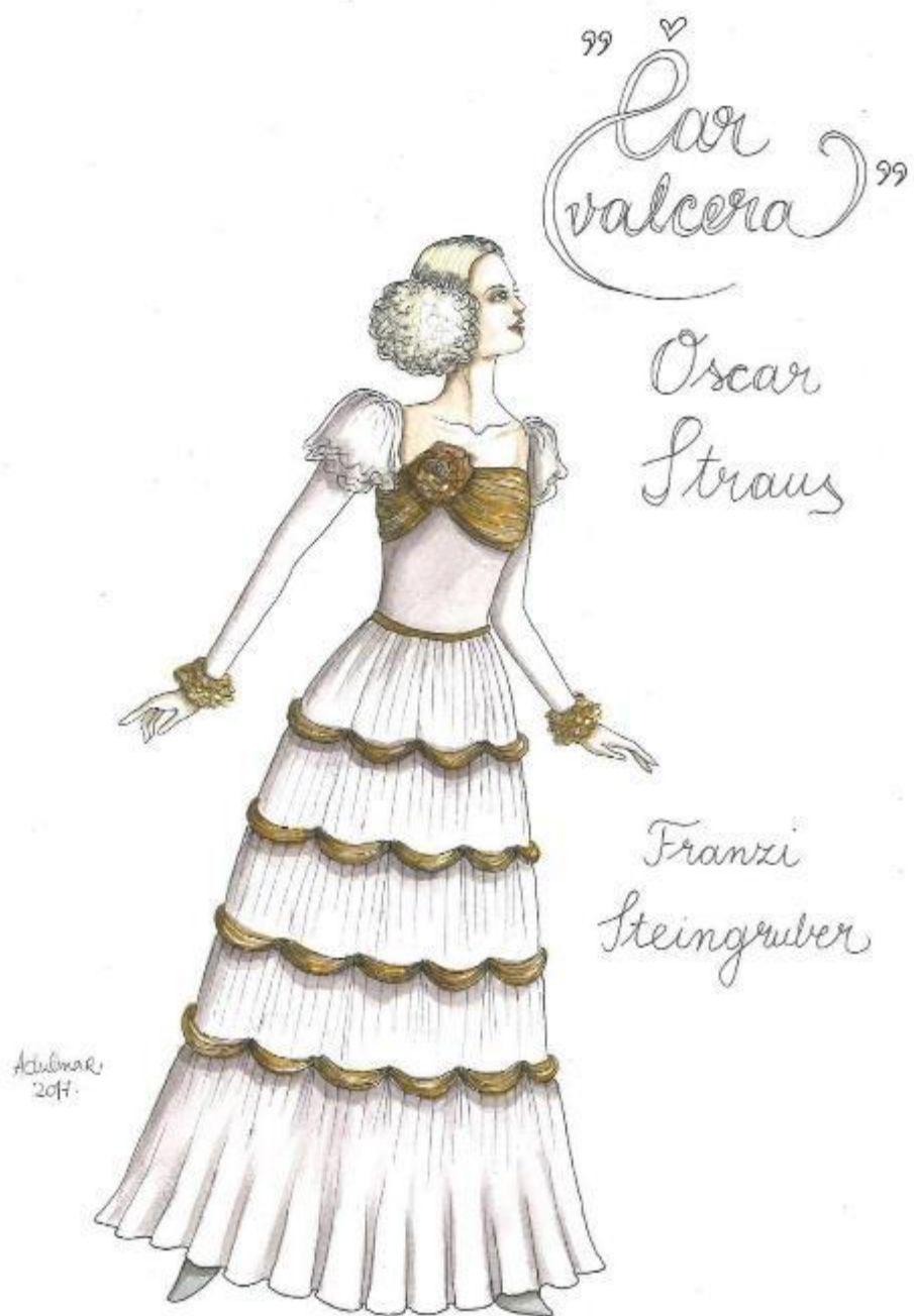
15. Oscar Straus: Čar valcera