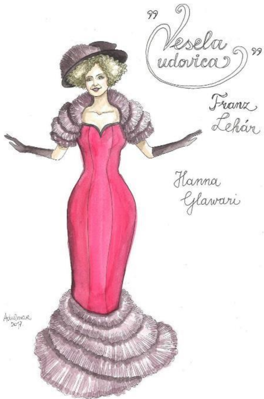
5. Franz Lehár: Vesela udovica