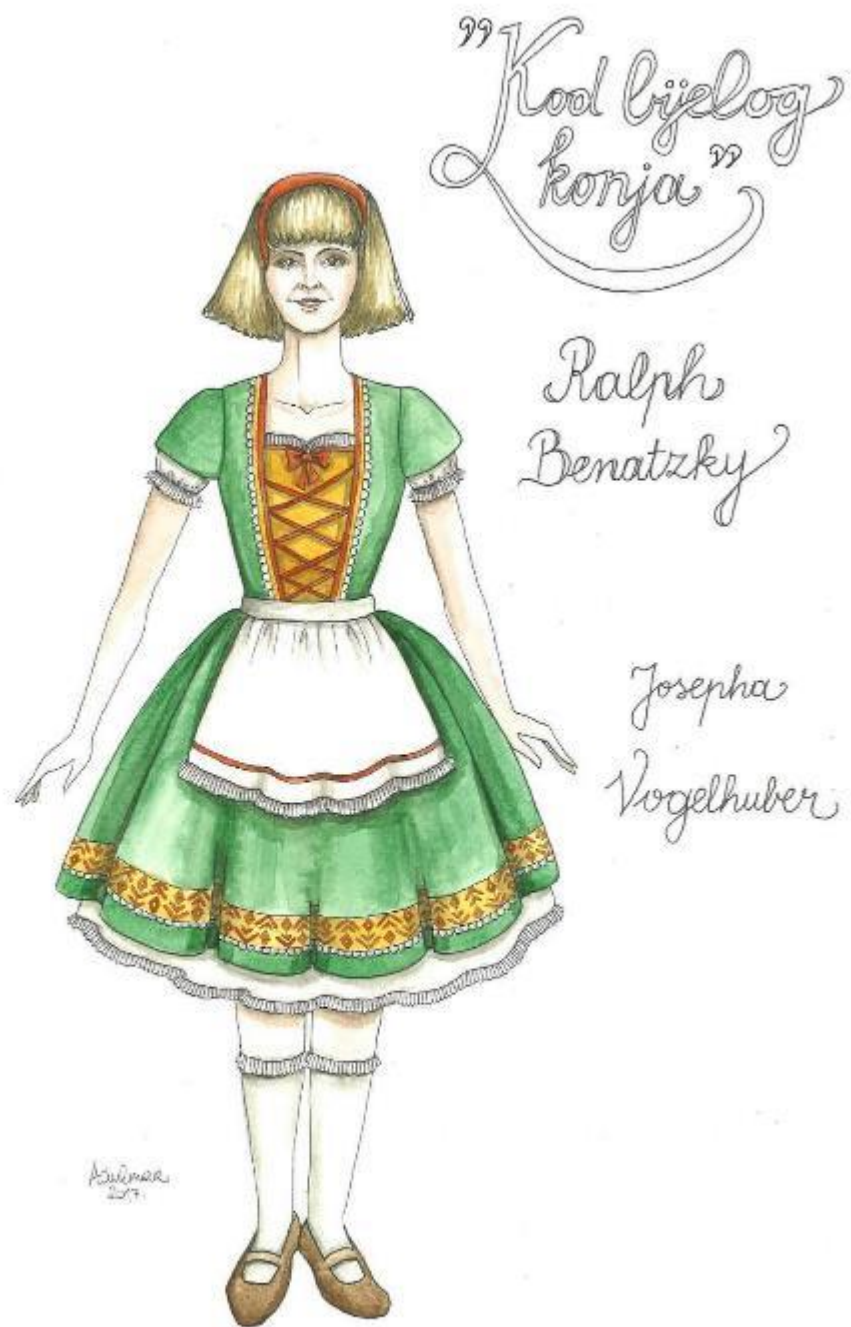
12. Ralph Benatzky: Kod bijelog konja