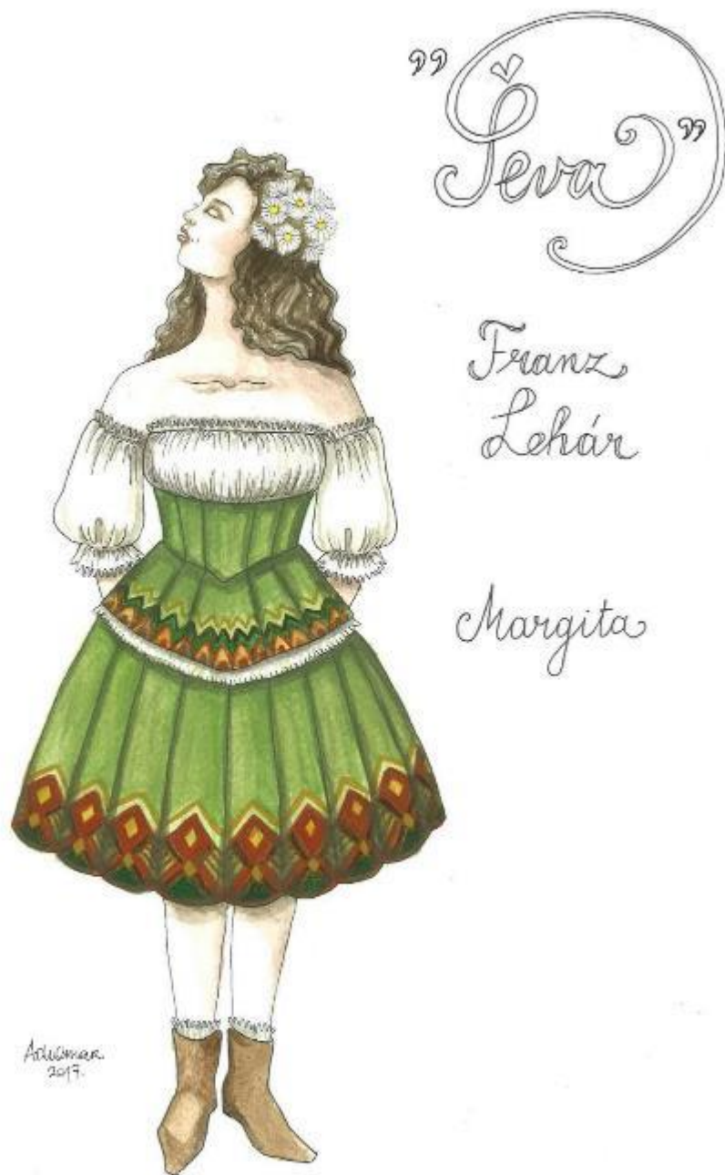
14. Franz Lehár: Ševa