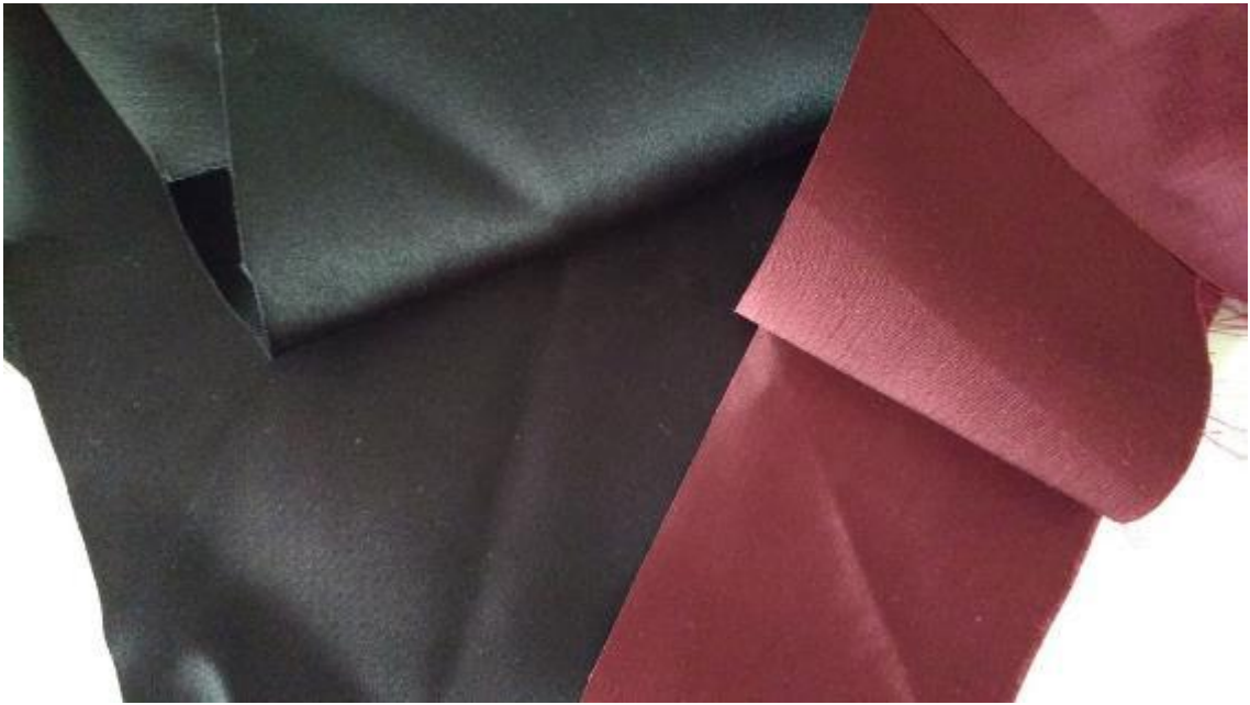
Sl.1. Odabir materijala