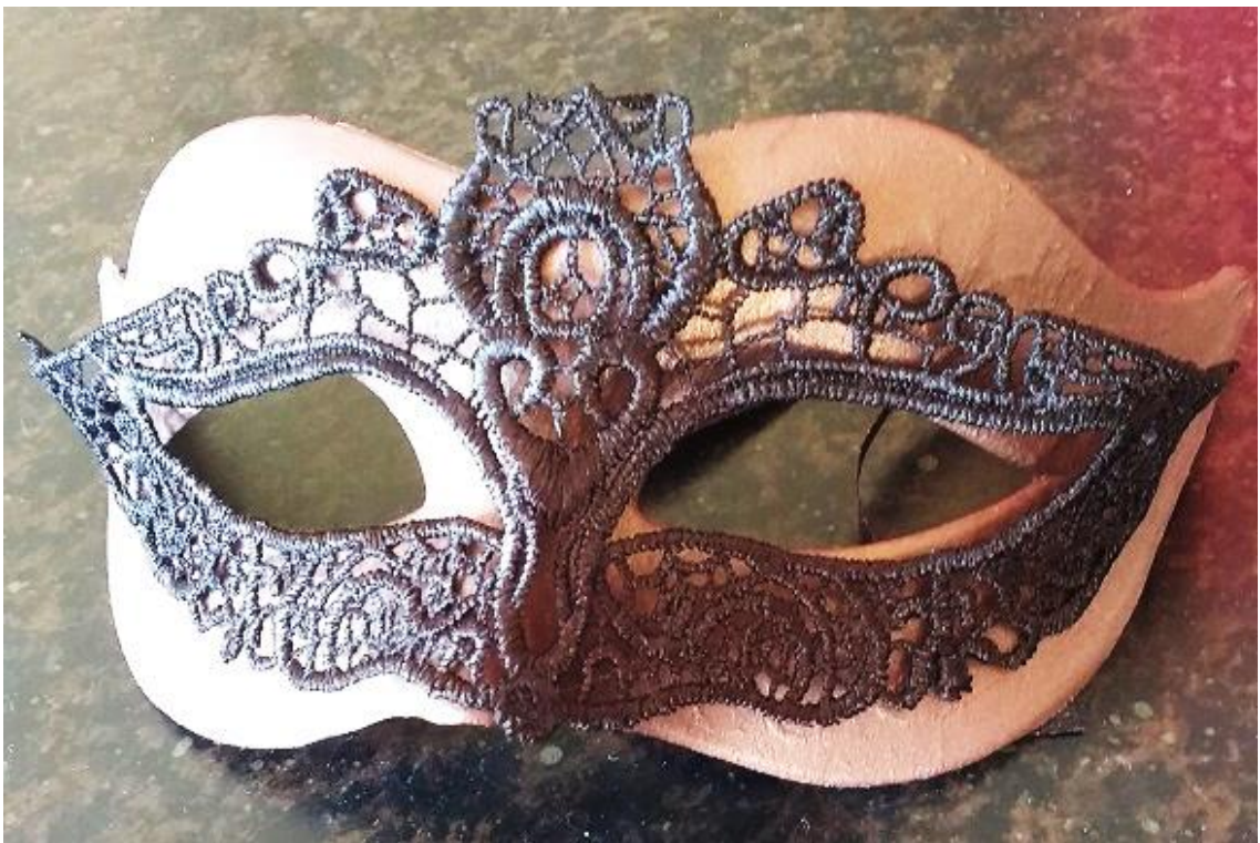
Sl.6. Izrada maske