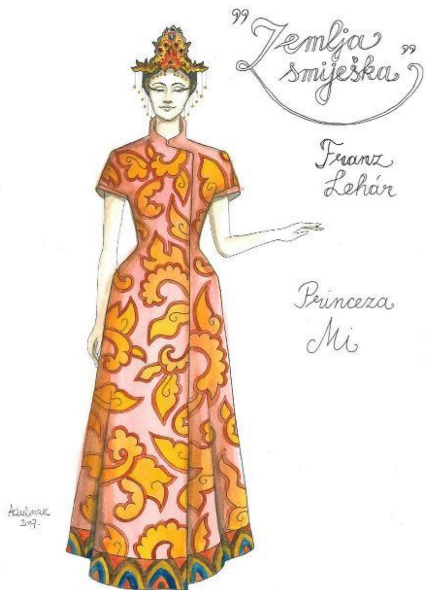
11. Franz Lehár: Zemlja smiješka