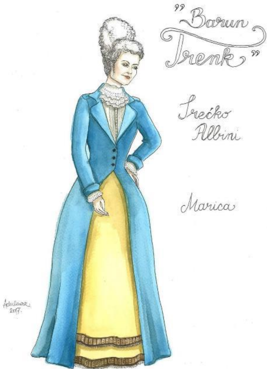
10. Srečko Albini: Barun Trenk