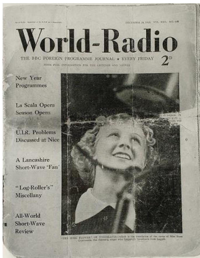
SI.2. Ruža Cvjetičanin na naslovnici World-Radio programa [2]

Uspjeh u operetnim ulogama otvorio joj je put i za druge medije. Nerijetko bi sa svojim kolegama nastupala u kabaretskim programima te na Radio Zagrebu, u „vedrim večerima“. Također, nastupala je i na radijskim koncertima operetnih napjeva i šlagera. Nizozemska tvrtka Philips je 1939. godine održala prvu demonstraciju televizije u Hrvatskoj, u kojoj je sudjelovala i Ruža Cvjetičanin. U to vrijeme bila je to prava senzacija. Jedno od najvećih priznanja koje je mogla dobiti dogodilo se već 1937. godine. Londonski radijski reporter putovao je Europom u potrazi za najboljom pjevačicom na radiju. U Zagrebu je sreo Ružu Cvjetičanin, a njena fotografija objavljena je 24. prosinca na naslovnici BBC-jeve revije za inozemni program World-Radio pod opisom: „'The Rose Flower' of Yugoslavia – prijevod je imena gospođice Ruže Cvjetičanin, šarmantne pjevačice koju se često može čuti u prijenosima iz Zagreba.“ 106