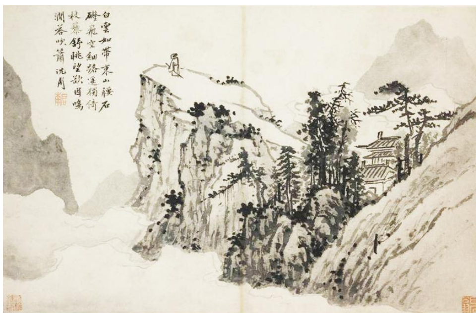
Slika 3: Shen Zhou, "Poet on a Mountaintop", 1500.

Shen je kineski umjetnik rođen 1427. godine u Xiangchengu na jugu provincije Jiangsu tijekom vladavine dinastije Ming. Obitelj mu je bila imućna te nikada nije radio službeni posao, već je uživao dugačak život koji je izučavao poeziju, slikarstvo i kaligrafiju. Smatra se jednim od četiri majstora dinastije Ming. Njegove slike sadrže dozu samopouzdanja, mirnoće i suptilne topline. Doprinio je kineskom slikarstvu otvaranjem nove škole u Suzhou nazvana "Wu" škola u kojoj je zauvijek ovjekovječeno slobodno izražavanje umjetnika. Uzori su mu bili Yuan slikari, do četrdesete godine Wang Meng, te Huang Gongweng i Wu Zhen poslije četrdesete godine. Iako najpoznatiji po slikanju pejzaža, motivi su mu bili i cvijeće, voće, povrće i životinje koje slikao monokromatski tušem. Bio je među prvim literatima koji je počeo slikati cvijeće te je tako pokrenuo novu tradiciju. Jedan od velikih kineskih umjetnika umro je 1509. godine u osamdeset drugoj godini života te za sobom ostavio pregršt umjetničkih djela koja su bila inspiracija daljnjim naraštajima umjetnika.