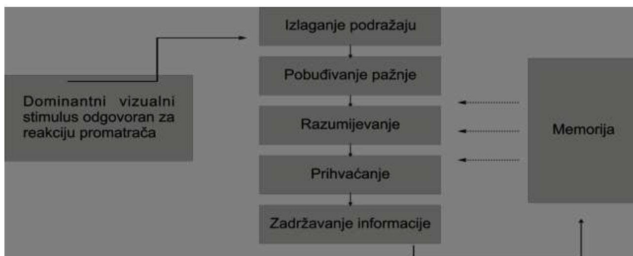
Slika 1.b) : Shema osnovnih faza promatračevog procesa prihvaćanja vizualnih informacija [4]