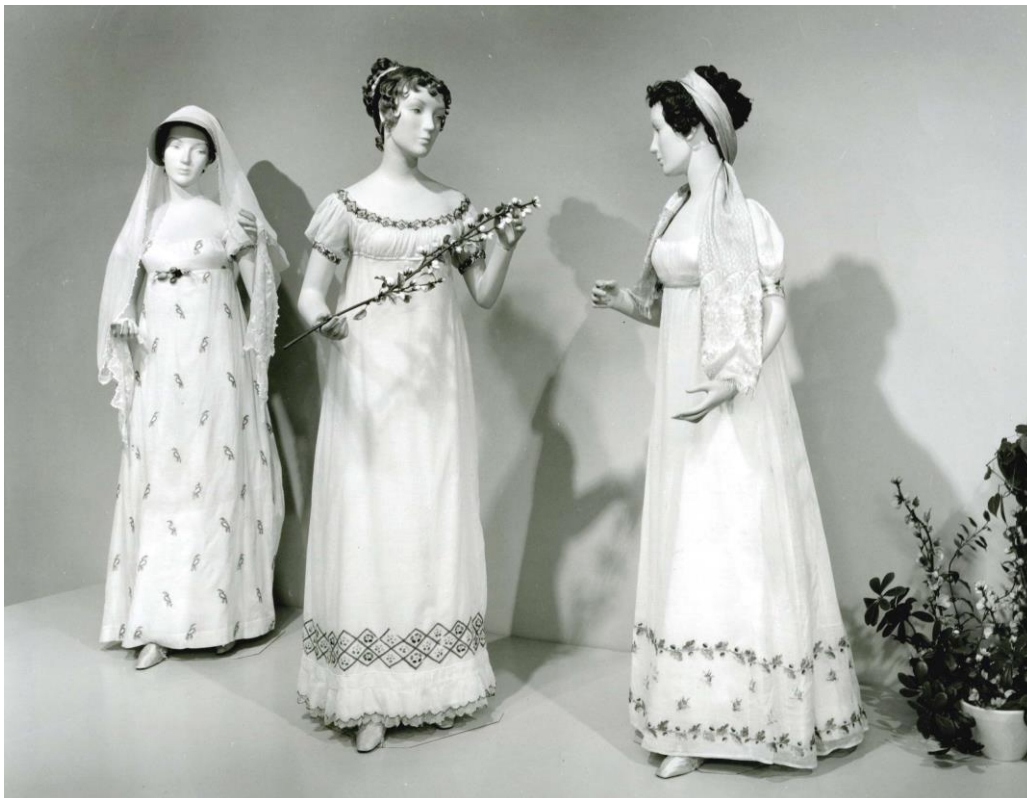
Sl.4. „Summer in Style“ (MET), haljine iz 1805. (1960.), www.metmuseum.org/

Smatra se da je oslobađanju mode u 19. stoljeću prethodila liberalizacija ženske odjeće krajem 18. stoljeća, što je pripisano engleskom utjecaju. Međutim, upravo je kraj 19. stoljeća bio početak mode kakvu znamo danas. Odjeća postaje slobodnija, razbija nametnute društvene okvire i pravila, te omogućuje svakom pojedincu traženje i otkrivanje vlastitog identiteta putem odijevanja. 14 Društvene promjene i revolucije bile su odgovor na podjele u društvu, velike klasne razlike, stoga je logično pretpostaviti da je težnja za manjim razlikama rezultirala i jednostavnošću u odijevanju, međutim u ženskoj modi pojednostavljivanje odjevnih predmeta nije potrajalo dugo.