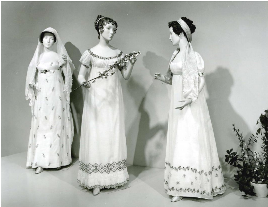
Sl.4. „Summer in Style“ (MET), haljine iz 1805. (1960.), www.metmuseum.org/

Smatra se da je oslobođanju mode u 19. stoljeću prethodila liberalizacija ženske odjeće krajem 18. stoljeća, što je pripisano engleskom utjecaju. Međutim, upravo je kraj 19. stoljeća bio početak mode kakvu znamo danas. Odjeća postaje slobodnija, razbija nametnute društvene okvire i pravila, te omogućuje svakom pojedincu traženje i otkrivanje vlastitog identiteta putem odijevanja. 14 Društvene promjene i revolucije bile su odgovor na podjele u društvu, velike klasne razlike, stoga je logično pretpostaviti da je težnja za manjim razlikama rezultirala i jednostavnošću u odijevanju, međutim u ženskoj modi pojednostavljivanje odjevnih predmeta nije potrajalo dugo.