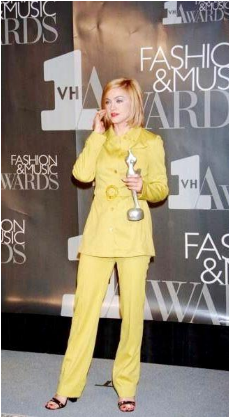
Sl.18. Madonna, VH1 Awards 1995.

Posljedice pokazivanja ove kolekcije vidjele su se već u prvim mjesecima nakon izlaganja i to u prodaji vintage odjevnih predmeta, posebice obuće. Zanimljiv je to prikaz ritma mode i stila koji nikada ne staje, već vuče jednu promjenu za drugom i prilagođava se u trenutku.